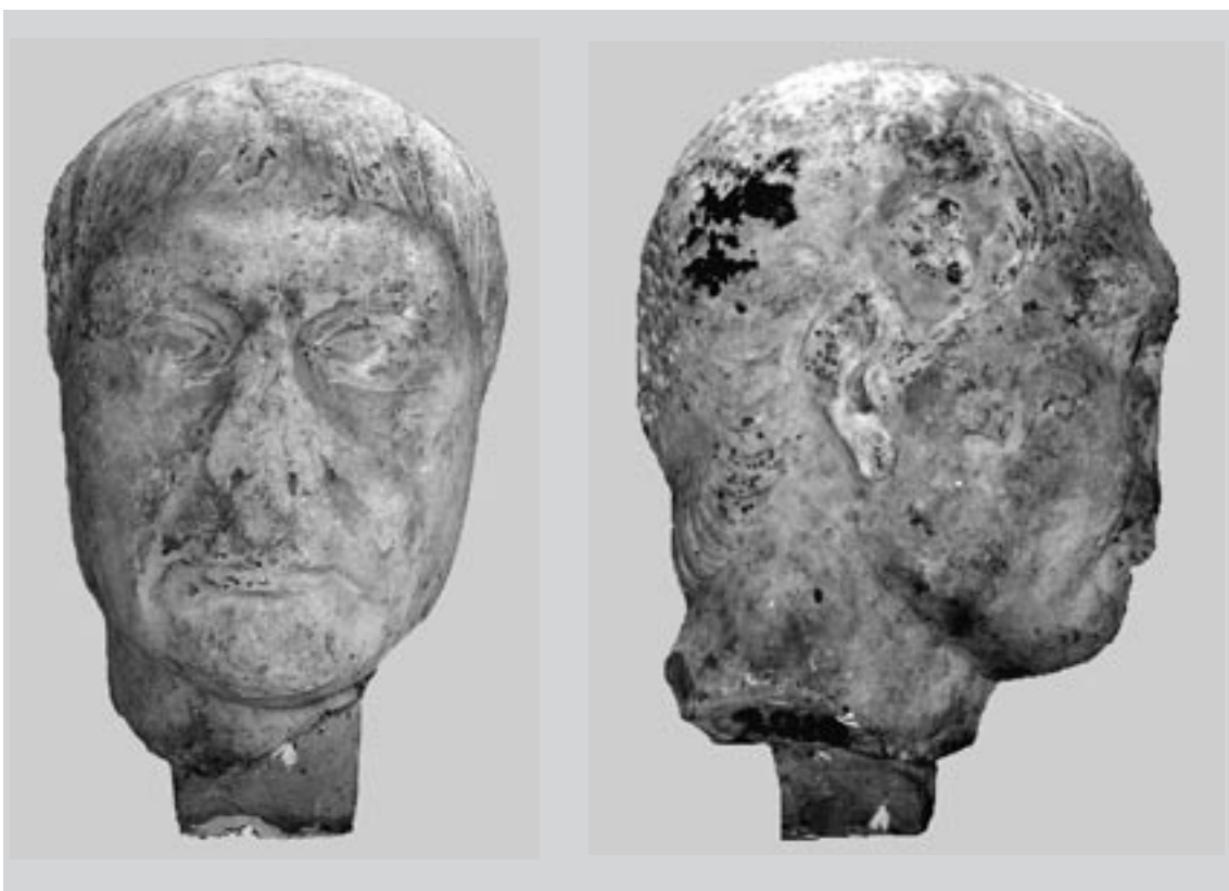
2 Porträt Inv. 1432. Roma, Musei Capitolini