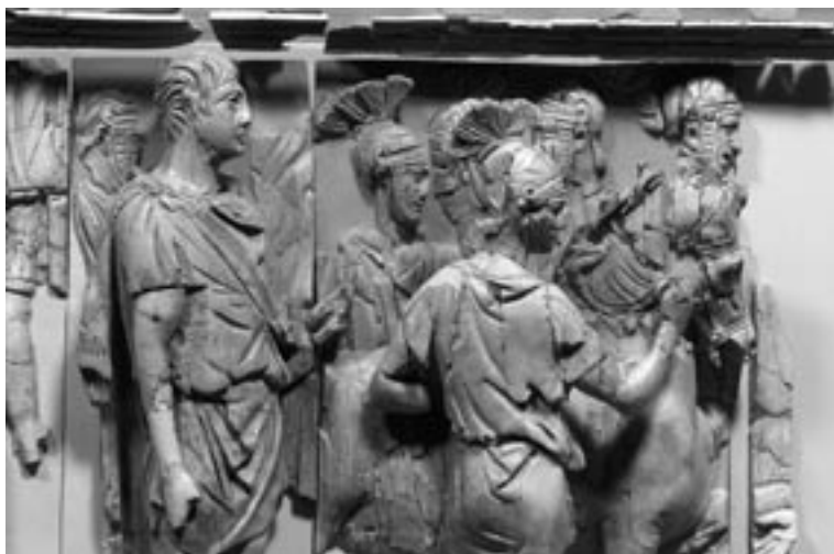
10 Elfenbeinfries, Unterwerfungsszene. Efes Müzesi, Selçuk

Bildfelder sehen einander auf den ersten Blick sehr ähnlich, vor allem in bezug auf die völlige Bartlosigkeit und die typisch traianische Stirnhaargestaltung, die in Kombination mit Rüstungsdetails der begleitenden römischen Soldaten eine Datierung nicht später als an den Anfang des 2. Jahrhunderts n. Chr. nahelegen 43 . Der wesentliche Unterschied der Figuren liegt allerdings in der auffallenden Größendifferenz, die fast einen ganzen Kopf beträgt. Die entscheidende