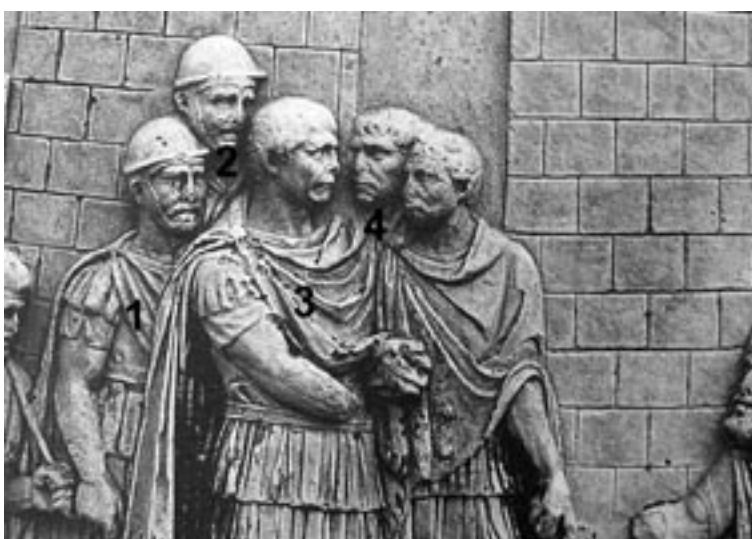
5 Traianssäule, Detail der Friesszene 42.CXLVII nach Cichorius