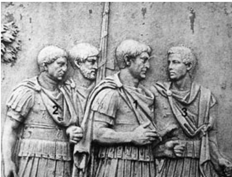
8 Traianssäule, Detail der Fries- szene 77.CIV nach Cichorius