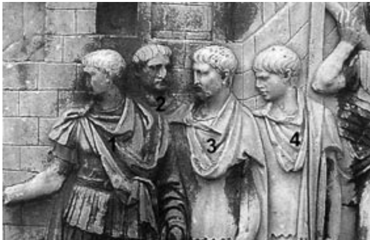
7 Traianssäule, Detail der Fries- szene 14.XL nach Cichorius