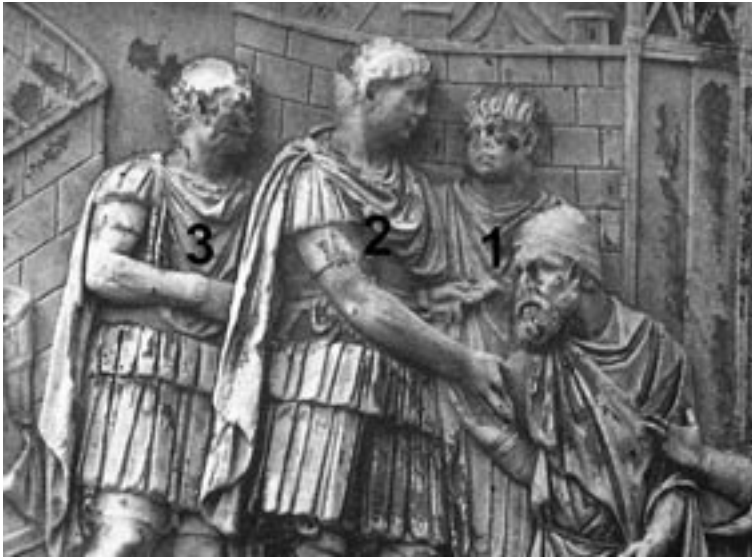
3 Traianssäule, Detail der Friesszene 46.CLXIV nach Cichorius