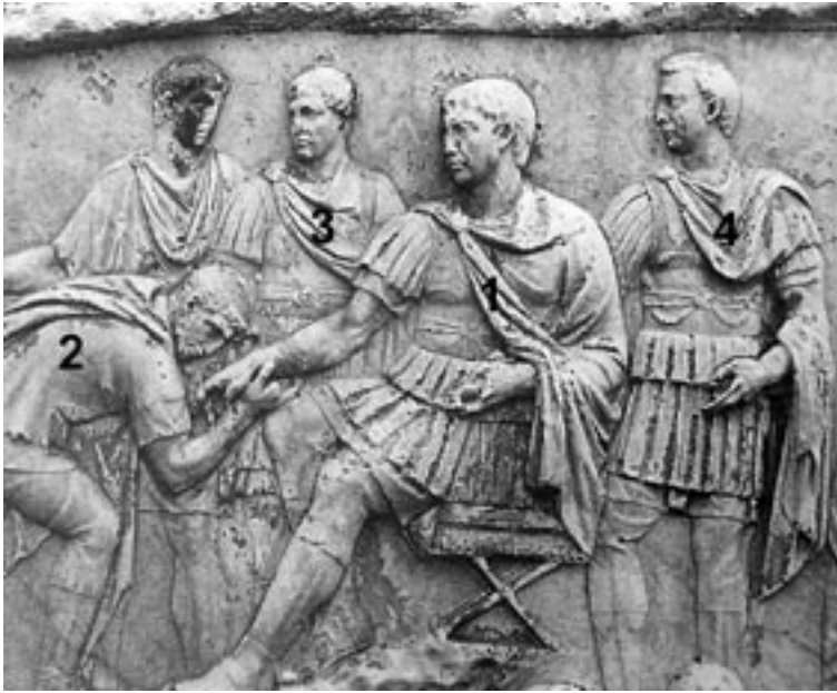
6 Traianssäule, Detail der Fries- szene 34.CXVI nach Cichorius