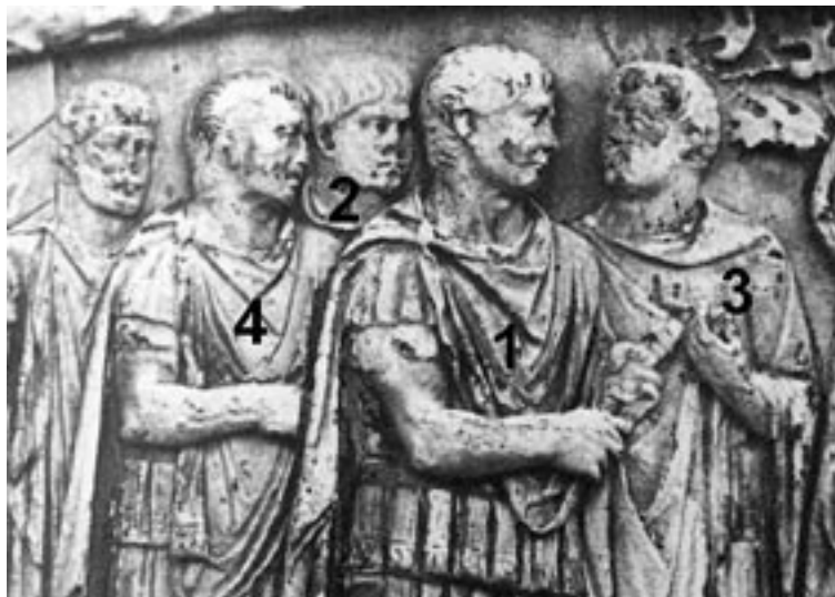
4 Traianssäule, Detail der Friesszene 49.CLXXIV nach Cichorius