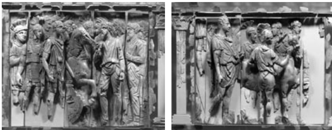
11 Elfenbeinfries, Szenen Abb. 9 und Abb. 10 im Vergleich. Efes Müzesi, Selçuk

Mittelfeldes als Kaiser anzusprechen, woraus sich aus der eingangs erwähnten Zeitstellung eine Benennung als Traian ergeben muß.