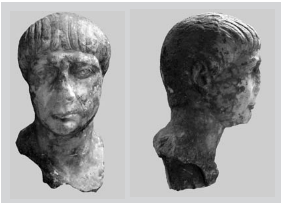
1 Porträt Inv. 3019. Roma, Musei Capitolini