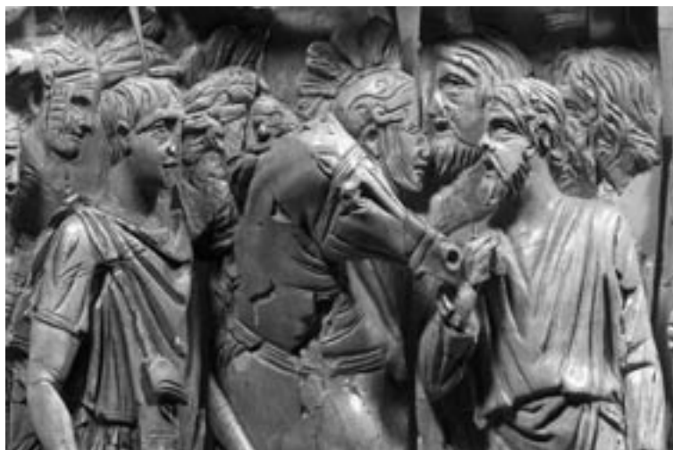
9 Elfenbeinfries, Unterhandlungsszene. Efes Müzesi, Selçuk

unter dem Begriff ‘Bildnisangleichung’ beschrieben haben, darf also folgerichtig für die Reliefs der Traianssäule und die direkte kaiserliche Gefolgschaft in traianischer Zeit angenommen werden. Daraus erklärt sich auch die eingangs erwähnte Beobachtung von W. H. Gross, der daran zweifelte »ob wir Traian ohne die Hilfe des Zusammenhangs wiedererkennen würden« 38 . Der Kaiser ist nämlich bloß aus dem Kontext und der Komposition der Szenen zu benennen 39 .