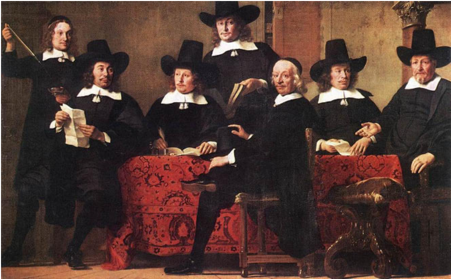
Abb. 6: Ferdinand Bol (1616–1680), Die Vorsteher der Amsterdamer Weinhändlergilde, 1659, Öl auf Leinwand, 193 x 305 cm, Alte Pinakothek München.

ist durchaus auch bei alten Menschen zu finden, so bei sitzenden Greisen der Alterspyramide. 47 Hierbei wird selbstverständlich nicht unterstellt, dass den Künstlern des 16. und 17. Jahrhunderts die „Walther-Haltung“ als Bildtradition bekannt war. Aber als Sitzposition im meditativen Nachdenken war dies nicht nur eine sinnvolle, sondern auch eine körperlich ausgesprochen angenehme Haltung, besonders auch für ältere Menschen – ob mit oder ohne Stein als Sitzgelegenheit. Und so lag ihre bildliche Darstellung einfach nahe.