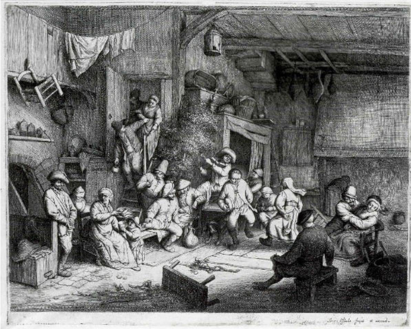
Abb. 8: Adriaen van Ostade (1610–1685), Der Tanz im Wirtshaus , Radierung, 243 x 318 mm, Hamburger Kunsthalle, Kupferstichkabinett.

scheuen (Abb. 8), und benutzte bei anderen Anlässen improvisiert und zwanglos Schemel und Hocker, umgedrehte Fässer und Körbe oder auch lediglich Kissen in kauender Hockposition. Der Körperkontakt selbst zu Fremden beim Sitzen war offenbar noch nicht mit dem Odium des Unangenehmen behaftet, und so finden sich auch Alte neben Jungen in zwangloser Körperhaltung beim Sitzen. Erst mit dem Aufkommen und der weiteren Verbreitung von Stühlen änderte sich die Art und Weise des Sitzens. Der Tisch, der zuvor eine Tafel auf Böcken war, die vor feste Bänke gestellt und nach dem Essen ‚aufgehoben‘ wurde, erhielt jetzt einen festen Platz. Den auf Einzelstühlen sitzenden Familienmitgliedern ist mit der hohen Stuhllehne nun auch ein Rückgrat an Disziplin im patriarchalischen Familienverbund eingezogen worden. 57 Allerdings konnten selbst alte, als nährisch dargestellte Menschen