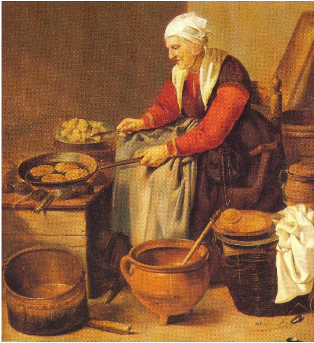
Abb. 2: Nach Gerrit Donck (ca. 1610–1640), Alte Frau am Kochofen sitzend, 1687, Nasjonalgalleriet Oslo.

verwehrt worden und in ihrer elenden Lage der Gebrechlichkeit schlug ihnen auch noch Missachtung und Gleichgültigkeit gegenüber ihrem Los entgegen. So ist Alter mit Bosheit, Trug und Hässlichkeit gleichgesetzt worden, und selbst die Tötung der Alten war kein Tabu, notfalls ist die Leiche mehrmals getötet worden. 13 Die alten Menschen in den Volkserzählungen, vor allem alte Frauen, lebten selten inmitten der Gesellschaft, sondern oft abgesondert an schwer zugänglichen Plätzen, etwa im Wald, und waren dem ständigen Verdacht des bössartigen Ränkeschmiedens und der Zauberei ausgesetzt. Selbst der Wunsch nach Respekt vor ihrem Tod und nach einem ehrenvollen Begräbnis blieb den Alten oft versagt, und noch aus ihrem Sarg holten die Erben die letzten Fetzen ihrer Leichenwäsche. Nicht einmal der Wunsch nach einem Kreuz auf dem Grab ist ihnen erfüllt worden. Über didaktische Literatur gelangte auch eine positive Bewertung des Alters in die Volkserzählungen, und Barmherzigkeit und Mitleid Alten gegenüber waren Tugen-