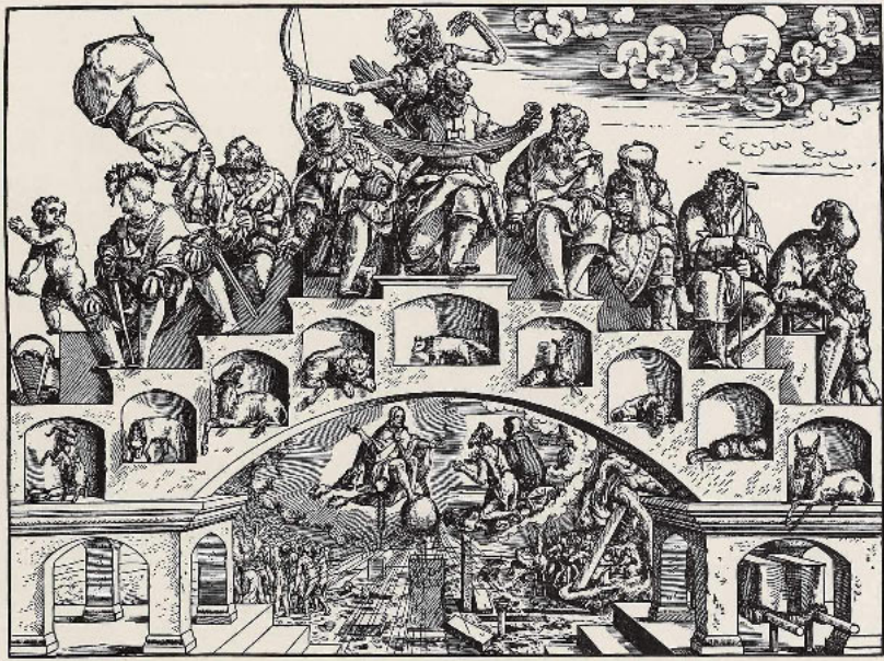
Abb. 4: Jörg Breu d. J. (ca. 1510–1547), Die Lebensalter des Mannes, 1540, 489 x 659 mm, Holzschnitt, Stiftung Schloss Friedenstein Gotha, Schlossmuseum (© Schlossmuseum. Stiftung Schloss Friedenstein Gotha).

genden Lebenstreppe zeigt sie meist mit typischen Altersattributen wie alterstypischer Kleidung, Brille, Altersbuckel und Gehstock – die 90-Jährigen behelfen sich oft mit zwei Krücken oder sitzen gebeugt und abgestützt. Enkelkinder werden beiden Geschlechtern im Alter zur Seite gestellt.