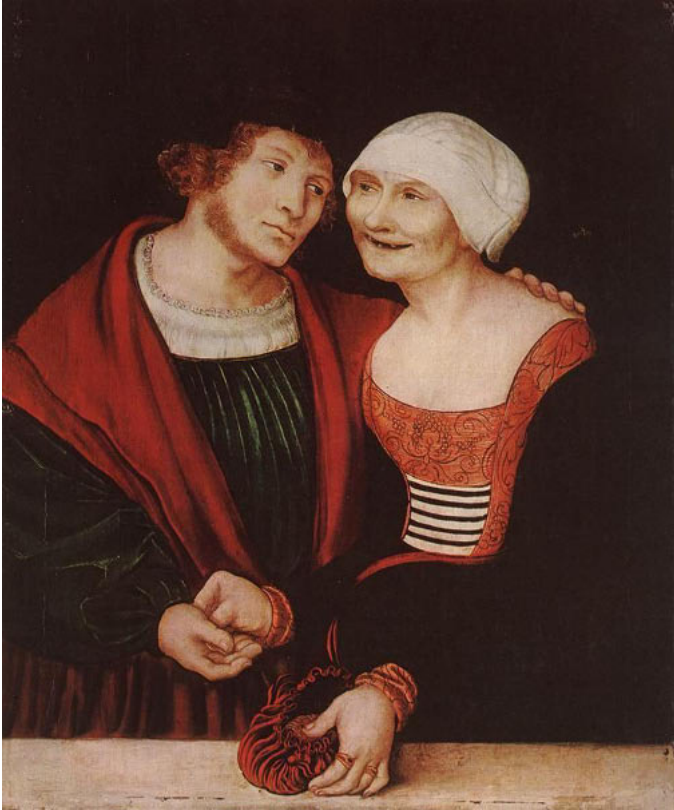
Abb. 3: Lucas Cranach d. Ä. (1472–1553), Verliebte alte Frau und junger Mann, 1520–22, Öl auf Holz, 37 x 37,5 cm, Szépművészeti Múzeum, Budapest.

waren in Pest- und Seuchenzeiten ohnehin im Dauereinsatz für alle Kranken. Die zahlreich vorhandenen Gemälde vom „Vorsteher- bzw. Vorsteherinnentypus“, auf die noch einzugehen ist, zeigen so gut wie nie kranke oder gebrechliche alte Männer und Frauen. Aber keine Frage – kranke alte Menschen aller Sozialschichten sind vielfach ins Bild gesetzt worden. Als Appell an die christliche Nächstenliebe und Barmherzigkeit wurden kranke Alte oft überaus drastisch mit ihren Gebrechen dargestellt. 23 Ob es sich bei dem lep-