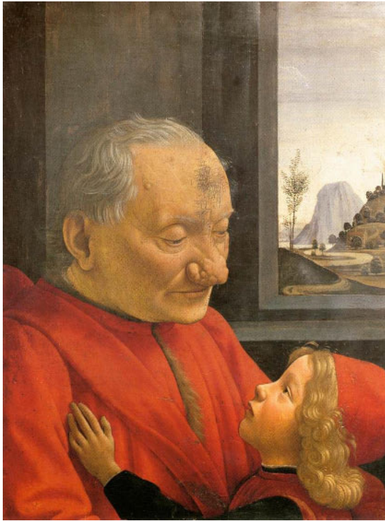
Abb. 1: Domenico Ghirlandaio (1449–1494), Alter Mann mit Kind (Enkel), ca. 1490, Tempera auf Holz, 62 x 46 cm, Musée du Louvre Paris.

ten Erkenntnisse ist, dass das lange Zeit dominierende Bild der omnipräsenten Großfamilie eine Chimäre ist und auch in der Frühen Neuzeit unabhängige Kleinfamilien vorherrschten. Zwar gab es auch Drei-Generationen-Haushalte, aber sie waren in Mitteleuropa die Ausnahme. Ein-Personen-Haushalte wurden vor allem von Witwen in der Unterschicht geführt.