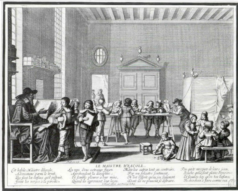
Abb. 5: Abraham Bosse (1604–1676), Der Schulmeister, Kupferstich, 262 x 334 mm, Staatliche Kunstsammlungen Dresden, Kupferstichkabinett (© SLUB Dresden/Deutsche Fotothek, Richter Regine, Kupferstichkabinett, Staatliche Kunstsammlungen Dresden).

Sitzen alte Menschen anders als junge – würdevoller, statuarischer oder auch mühevoller und angespannter? Und geht diese Würde und Ausstrahlung von ihrem Alter, von ihrem Sitz und ihrer Haltung oder von ihrem Stand aus? Saßen alte Frauen anders als alte Männer und wie sah es bei unterschiedlichem Rang und Stand aus? Welche Rolle kam den jeweiligen Situationen des Sitzens zu – war das „Thronen“ bei hoch offiziellen Anlässen selbstverständlich wie umgekehrt ein unbekümmertes Sich-Gehen-Lassen im häuslichen familiären Kreis oder bei ausgelassenen Festen wie etwa einer Bauernkirchweih?