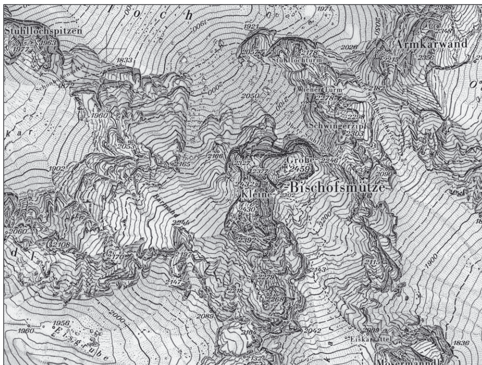
Abb. 2: Gosaukamm (Dachsteingruppe) 1:10.000 (Schwarzweiß-Ausschnitt des mehrfarbigen Kartenblattes aus 1976)

Bei der Geländedarstellung durch Höhenlinien (Höhenschichtenlinien, Schichtenlinien) ergaben sich technische Probleme, die zu einem Forschungsprojekt führten, das im Rahmen der Österreichischen Akademie der Wissenschaften (ÖAW) im Zusammenwirken mit dem ÖAV und dem DAV durchgeführt wurde. Grundsätzliche Voraussetzung für die kartographische Bearbeitung dieser Felsregion war eine sorgfältige, den Anforderungen entsprechende stereophotogrammetrische Luftbildauswertung – bei diesem Gelände keine Selbstverständlichkeit. Ein Spezialflug des Bundesamtes für Eich- und Vermessungswesen im Jahr 1973 bildete die Grundlage für die photogrammetrische Auswertung, die von BRANDSTÄTTERS Sohn Gerhard an der Technischen Universität Graz durchgeführt wurde, der auf diese Weise die Arbeit seines Vaters unterstützen konnte.