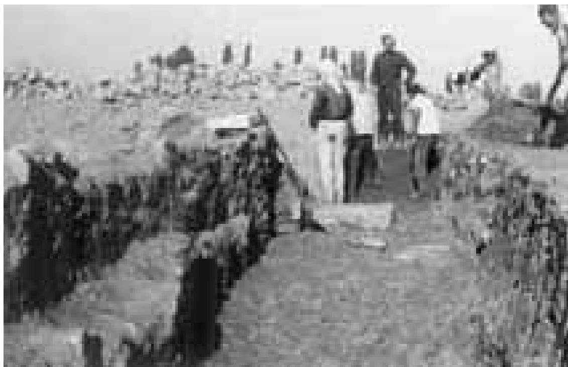
Abb. 2: Altgrabung 1965. Seldschukisches Gebäude: befestigtes Bodenniveau und Schwelle, Quermauer in der linken Bildhälfte. Blickrichtung Westen

Schichten an der West- und Nordseite des Tempels, durch hohes Alluvium von den spätmittelalterlichen getrennt 17 , erst 6 bis 7 m tief unter dem Feldniveau angetroffen 18 .