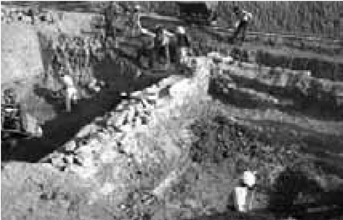
Abb. 3: Altgrabung 1965. Seldschukisches Gebäude: westliche Außenmauer und Quermauer, Blickrichtung Norden

Ungefähr 3 m unter dem Feldniveau lag ein Jünglingskopf aus Marmor, der wahrscheinlich den columnae caelatae des spätclassischen Artemistempels zuzuweisen ist 23 . Mörtelreste auf der Oberfläche des Kopfes deuten darauf hin, daß dieses Skulpturenfragment nach der Zerstörung des Tempels als Baustein wiederverwendet worden ist.