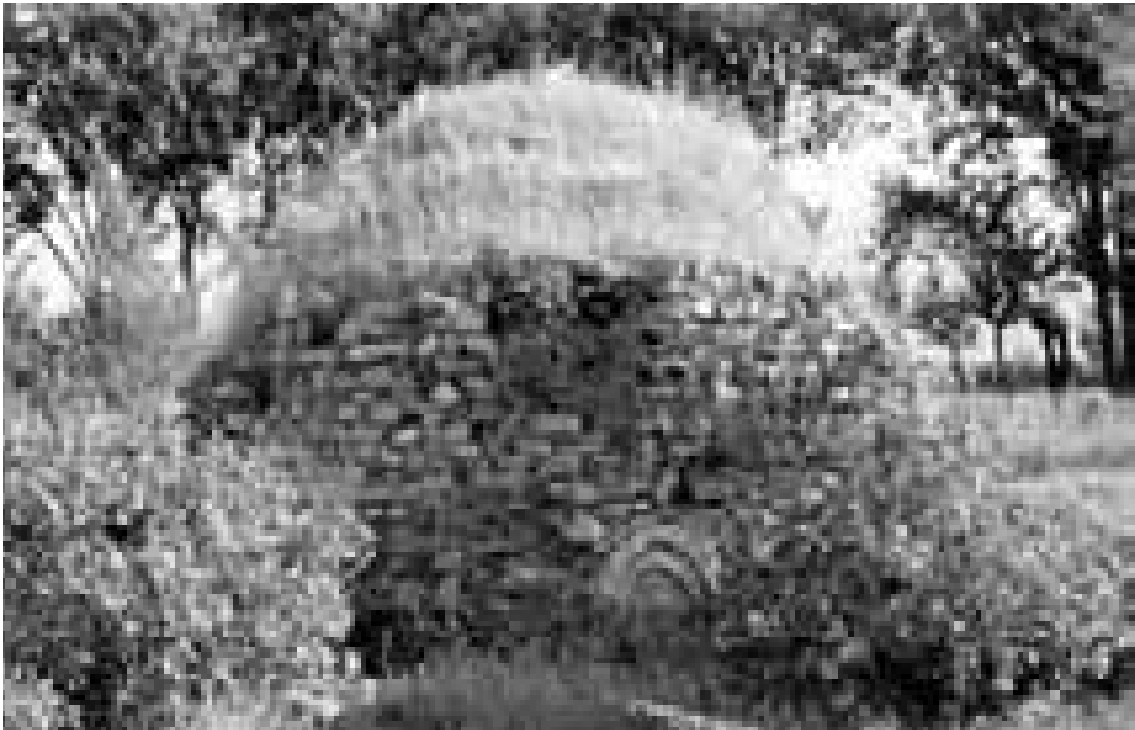
Abb. 5: Türbe

durch die Bewohner bald einstürzten. Der archäologische Befund der verschiedenen Grabungsunternehmen läßt den Schluß zu, daß in seldschukischer und frühosmanischer Zeit im gesamten Bereich des Artemisions Gebäude standen, wobei die Dichte der Bebauung nach Westen hin deutlich abnahm. Die im Grabungsareal nachgewiesenen Bauten lagen offenbar am Rande der spätmittelalterlichen Stadt.