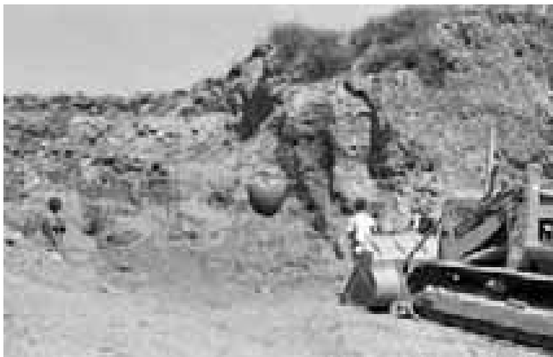
Abb. 4. Grabung 1988. Pithos im sog. Nordalluvium (Archiv des ÖAI)

circa 1,5 bis 2 m unter dem Feldniveau, beobachtet werden. Aus einem Profil an der Nordseite des Grabungsareals wurde 1988 ein Pithos geborgen 26 (Abb. 4).