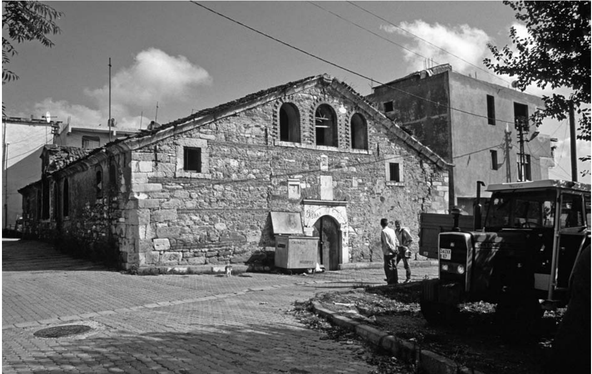
24 Deliōnes (Ortaköy), H. Dēmētrios, W-Fassade