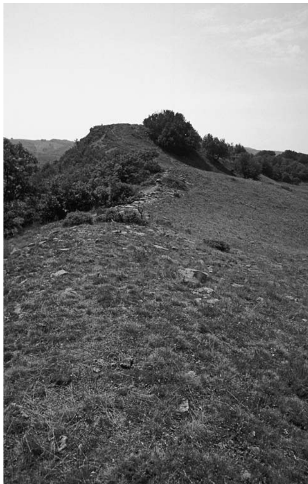
50 Eudēmion (Uçmakdere), Kartalkaya, Reste der s. Umfassungsmauer