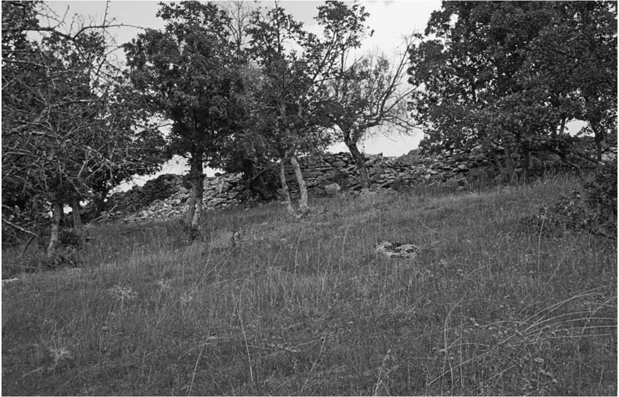
39 Düzorman Köyü Kalesi, W-Mauer, Außenseite