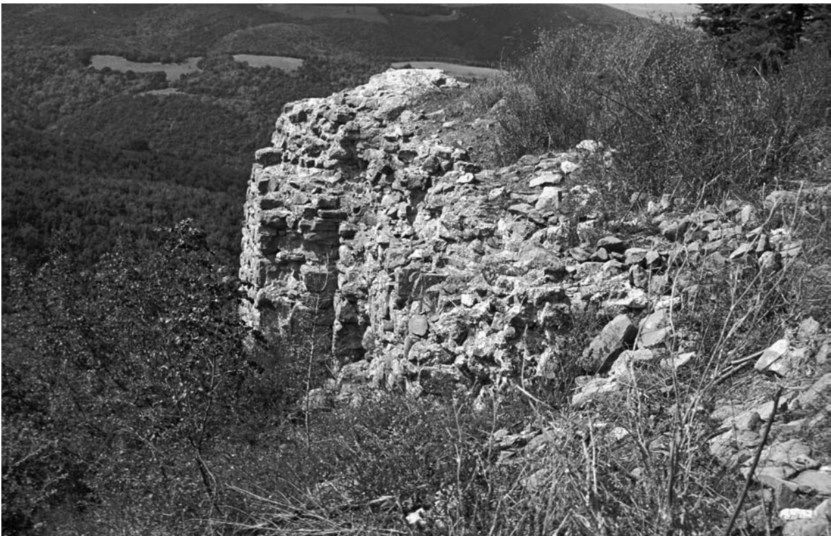
42 Elmalı, Palaiokastron, Bastion im SO