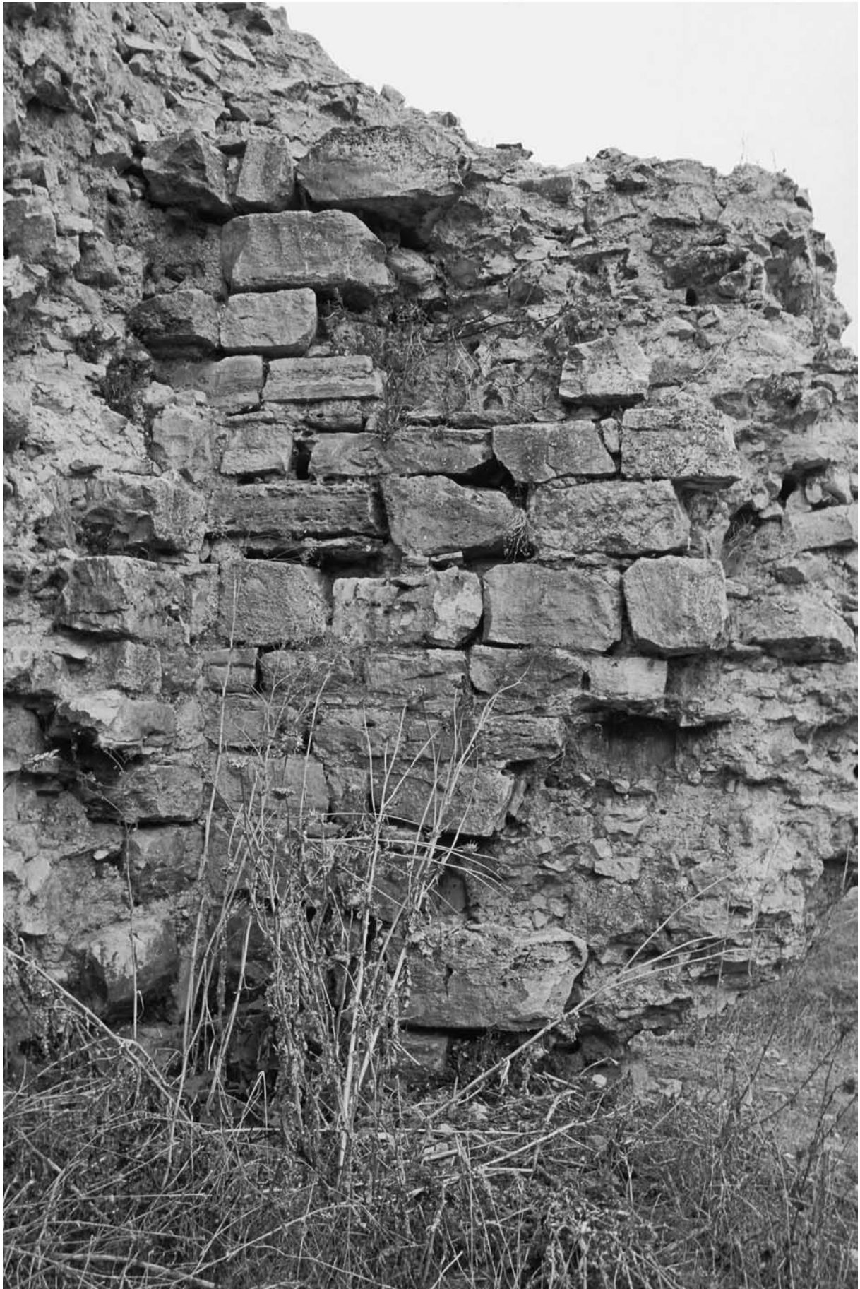
1 Ahmediye, Turm an der O-Mauer, Außenseite