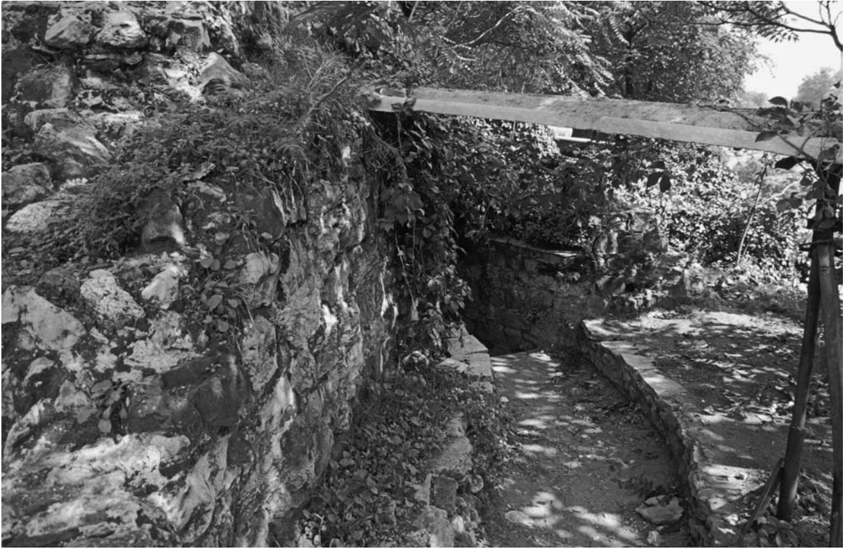
53 Galata, Turm an der Kemeraltı Caddesi