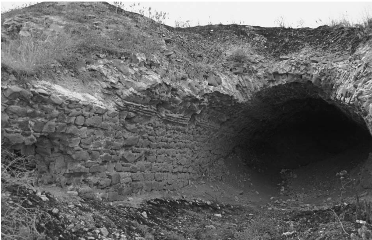
64 Hērakleia (Marmaraeğlisi), Substruktionen im S der Akropolis