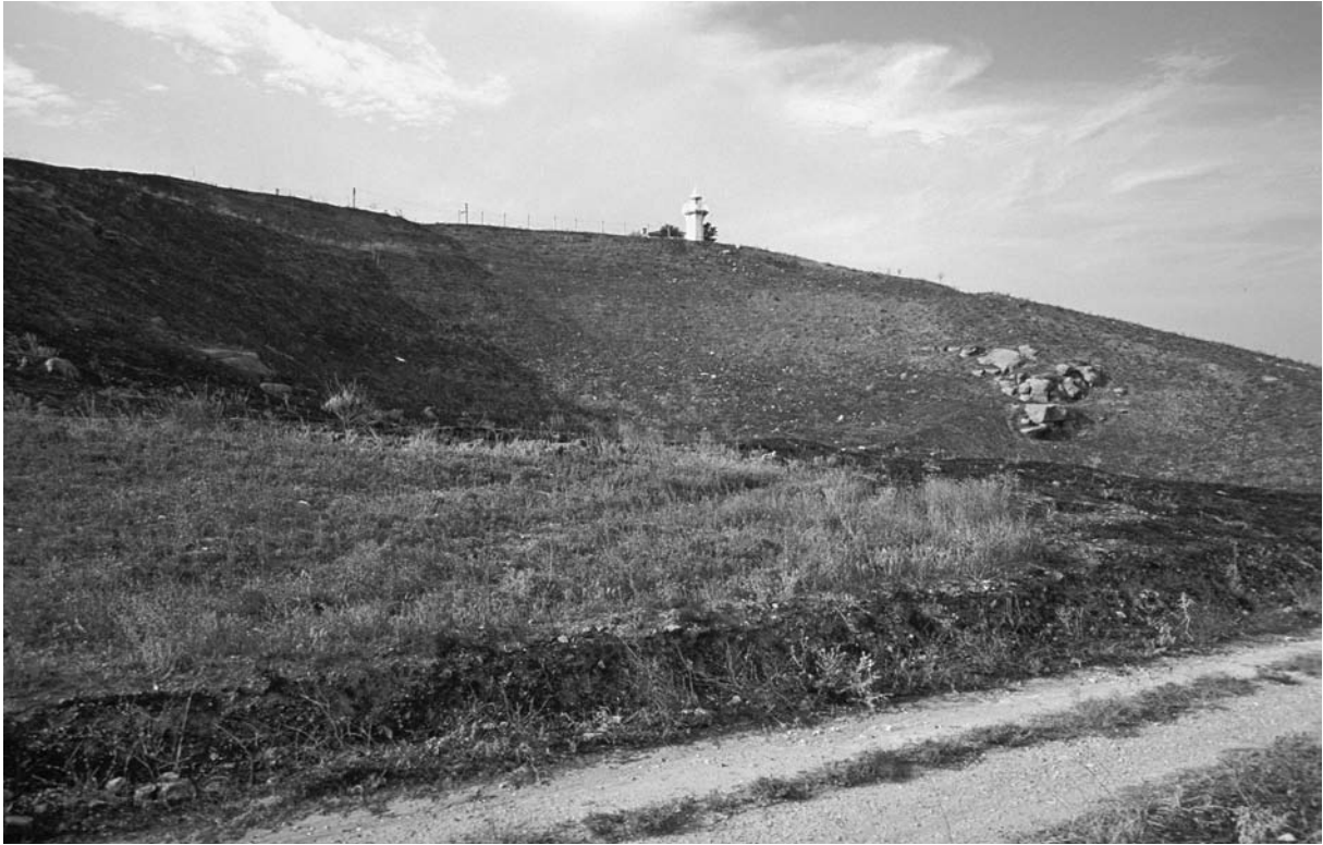
63 Hērakleia (Marmaraeğlisi), S-Hang der Akropolis