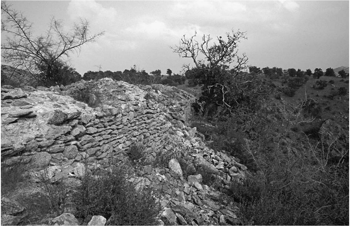
28 Demircihalil, Gözyaka Mevkiindeki Kale, SW-Mauer