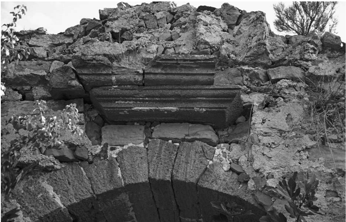
9 Bigalı Kalesi, W-Portal