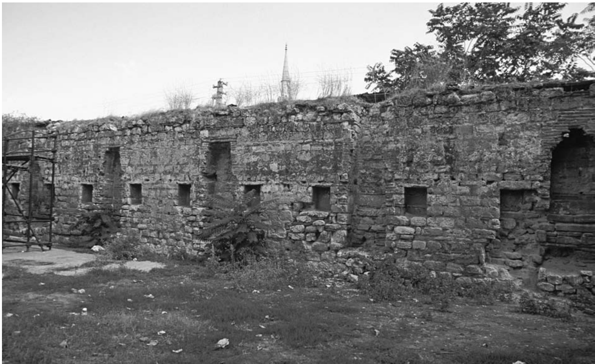
5 Arkadiupolis (Lüleburgaz), sogenannte Kale (W-Mauer)