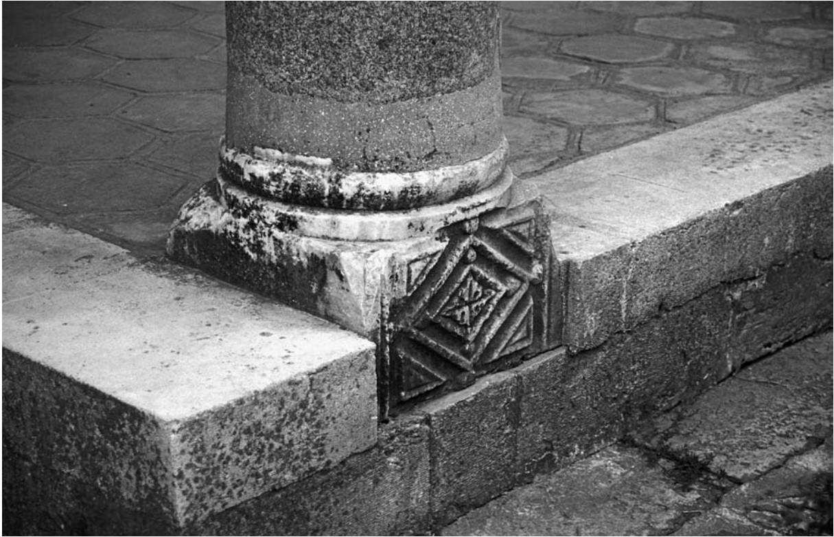
20 Chalkis (İncik), Säulenfuß