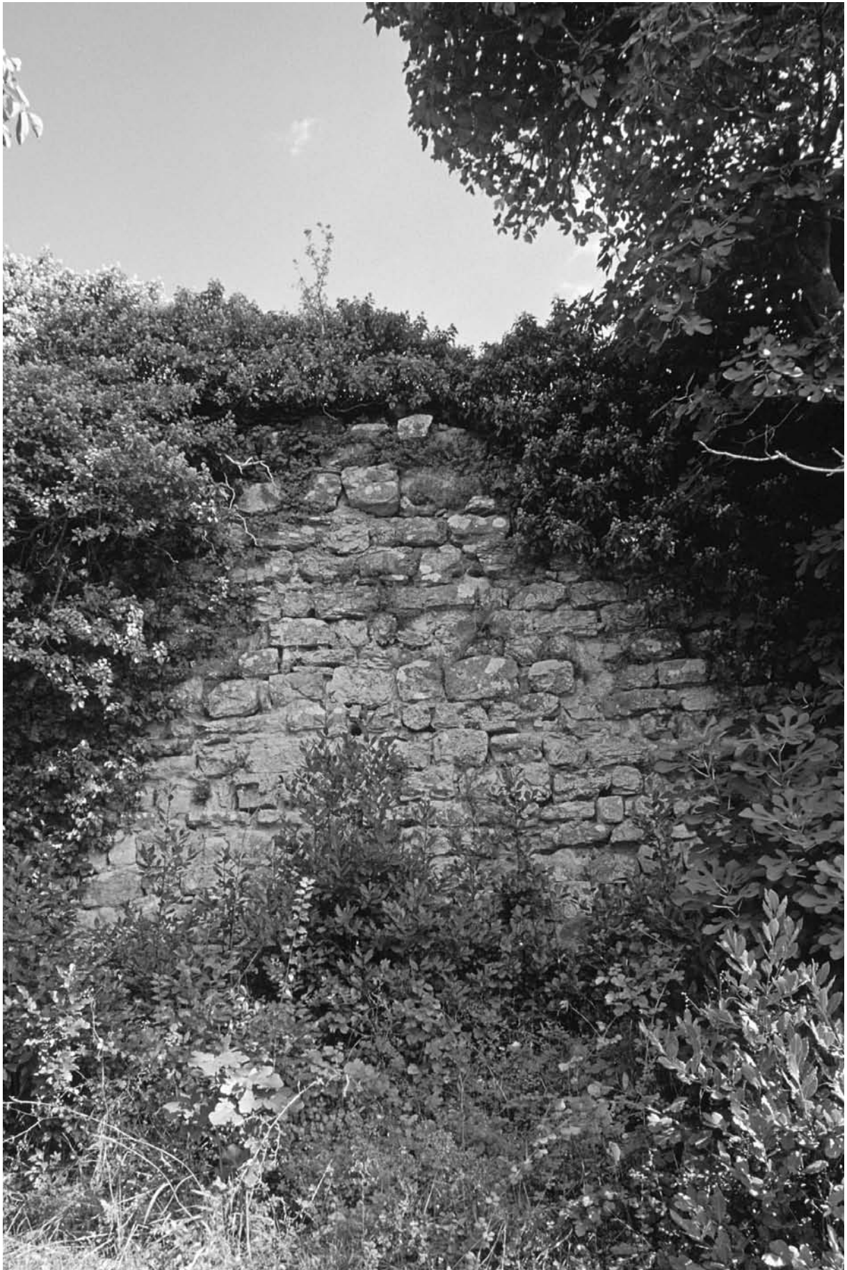
30 Derkos (Durusu), O-Mauer, Außenseite