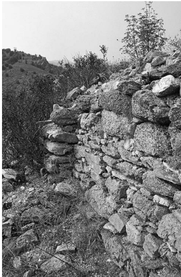
29 Demircihalil, Gözyaka Mevkiindeki Kale, Detail der SW-Mauer