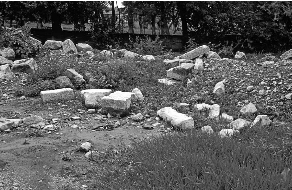
38 Dursunköy, Quaderblöcke