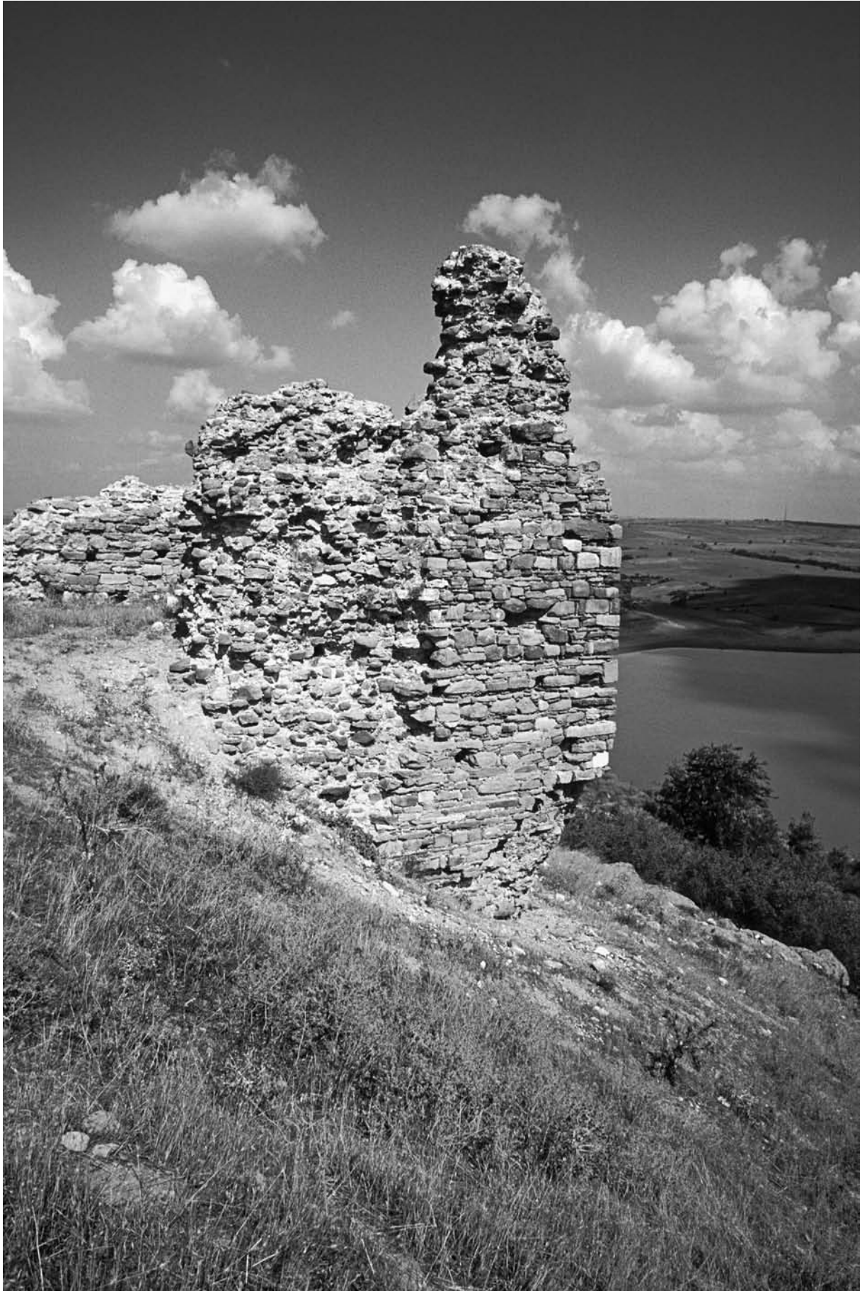
59 Garella (Altinyazi), SO-Turm von S