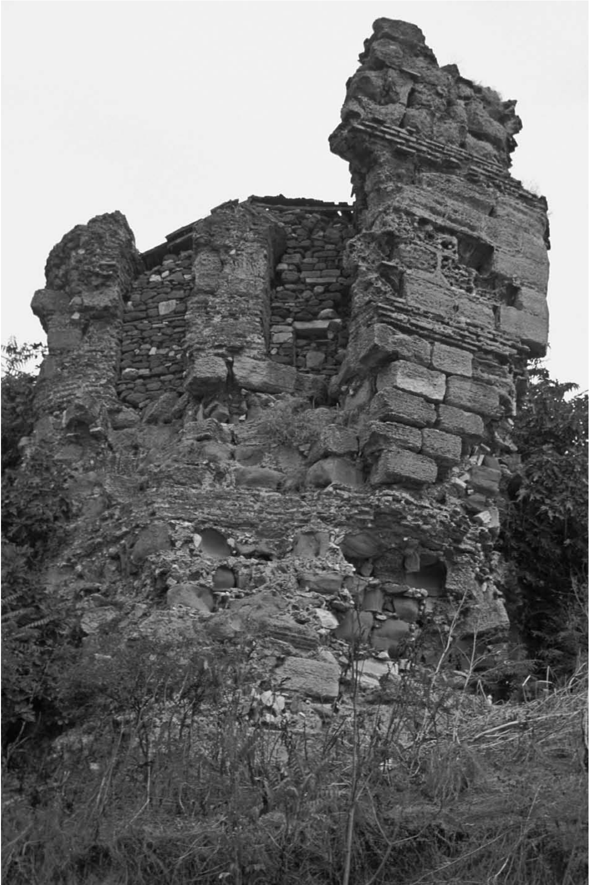
62 Hērakleia (Marmaraereğlisi), Festungsturm am NW-Hang der Akropolis