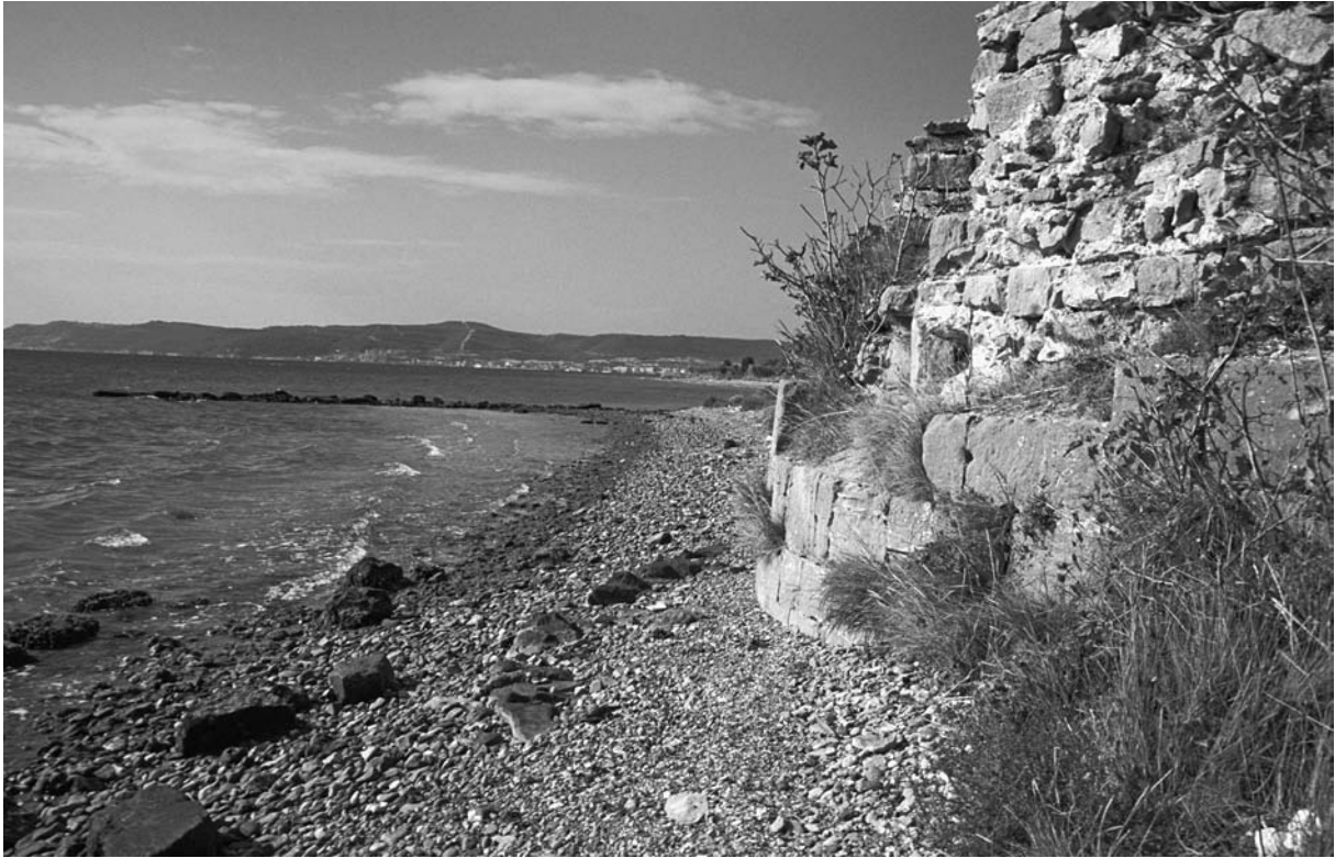
8 Bigalı Kalesi, Turm im SO mit Blick auf den Kakma Dağı