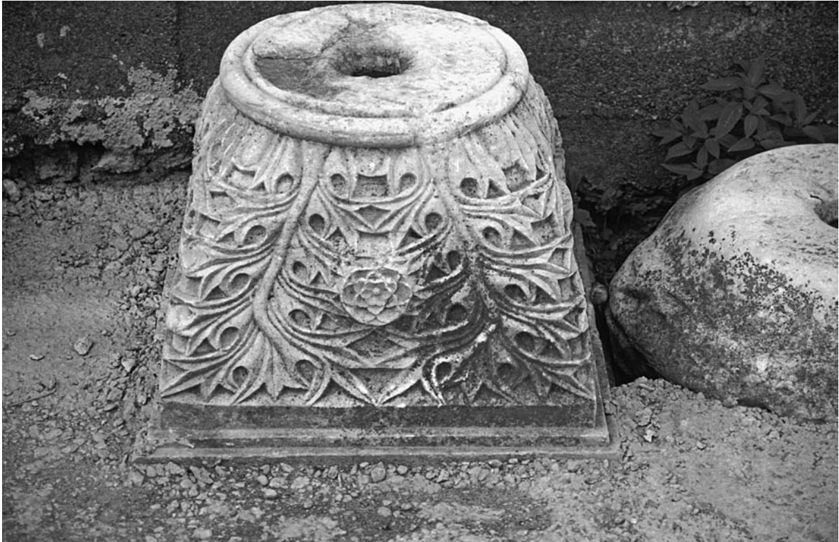
18 Chalkis (İnceik), Kapitell im Hof der Eski Camii