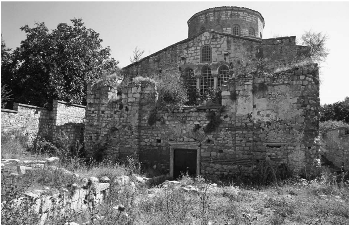
11 Bizyē (Vize), H. Sophia von W