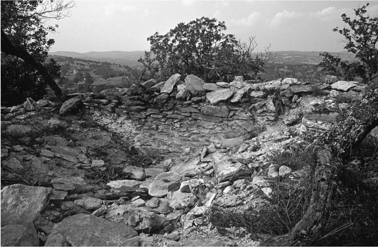
41 Düzorman Köyü Kalesi, byzantinisches Gebäude vor der n. Mauer