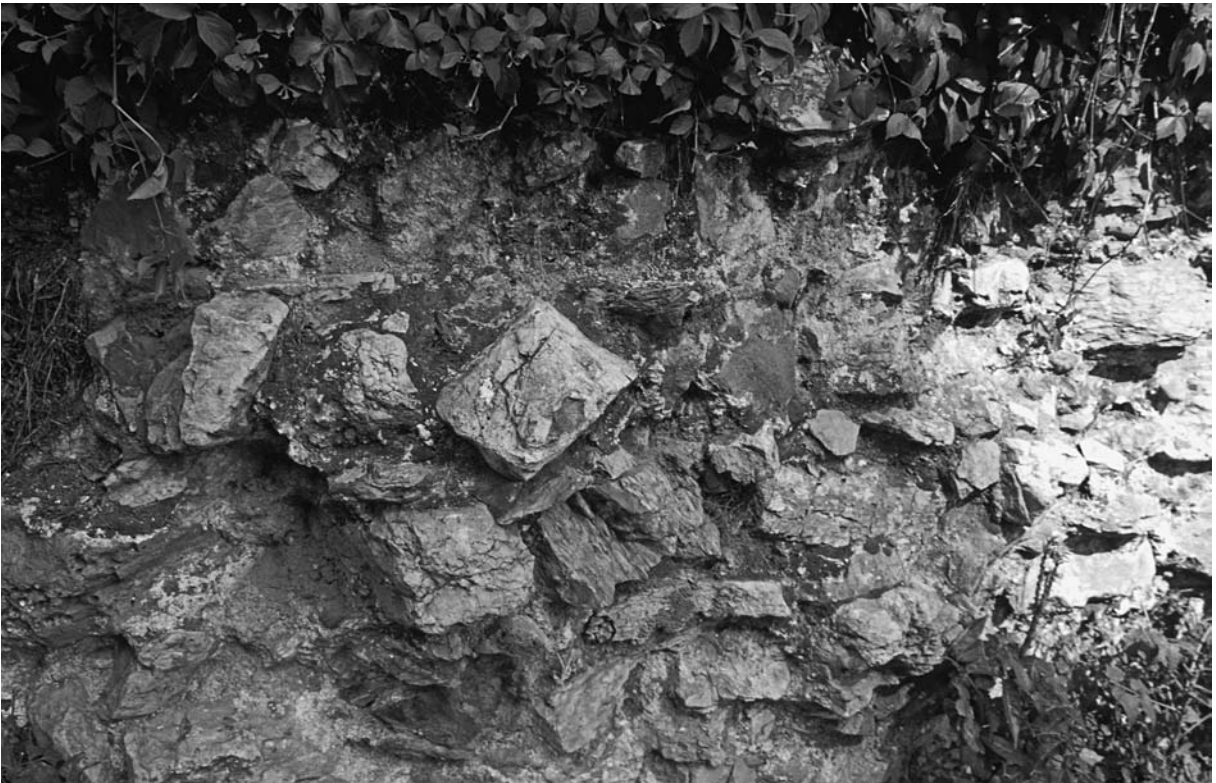
54 Galata, Detail des Turmes