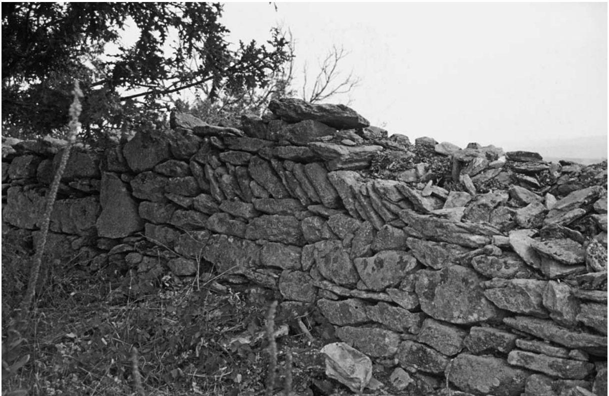
40 Düzorman Köyü Kalesi, NW-Mauer