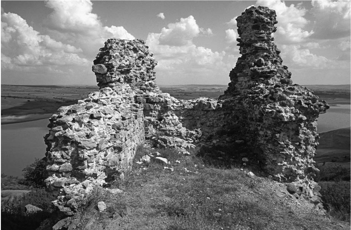
57 Garella (Altinyazi), Innenseite des SO-Turmes