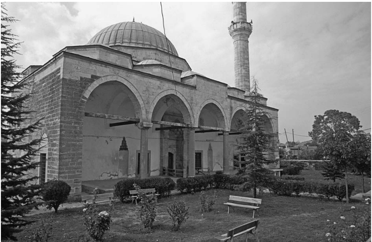
17 Chalkis (İneçik), Eski Camii von NW