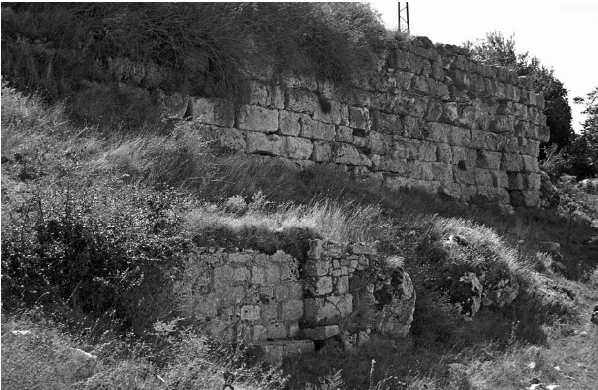
15 Bizyē (Vize), W-Mauer, Außenseite