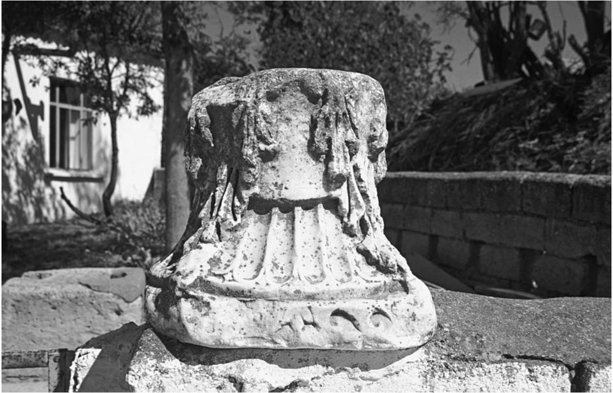
16 Büyükanafarta, Kapitell