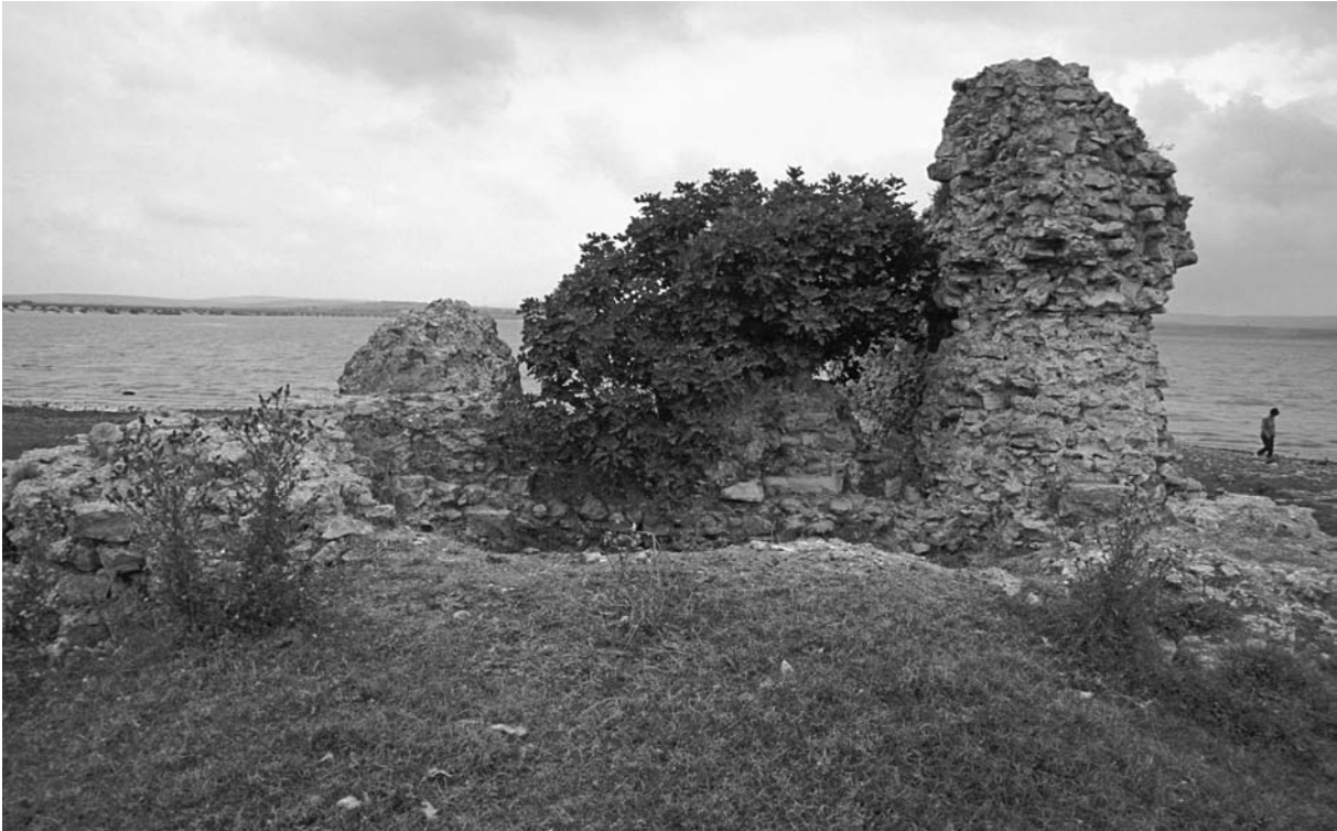
2 Ahmediye, Turm an der O-Mauer