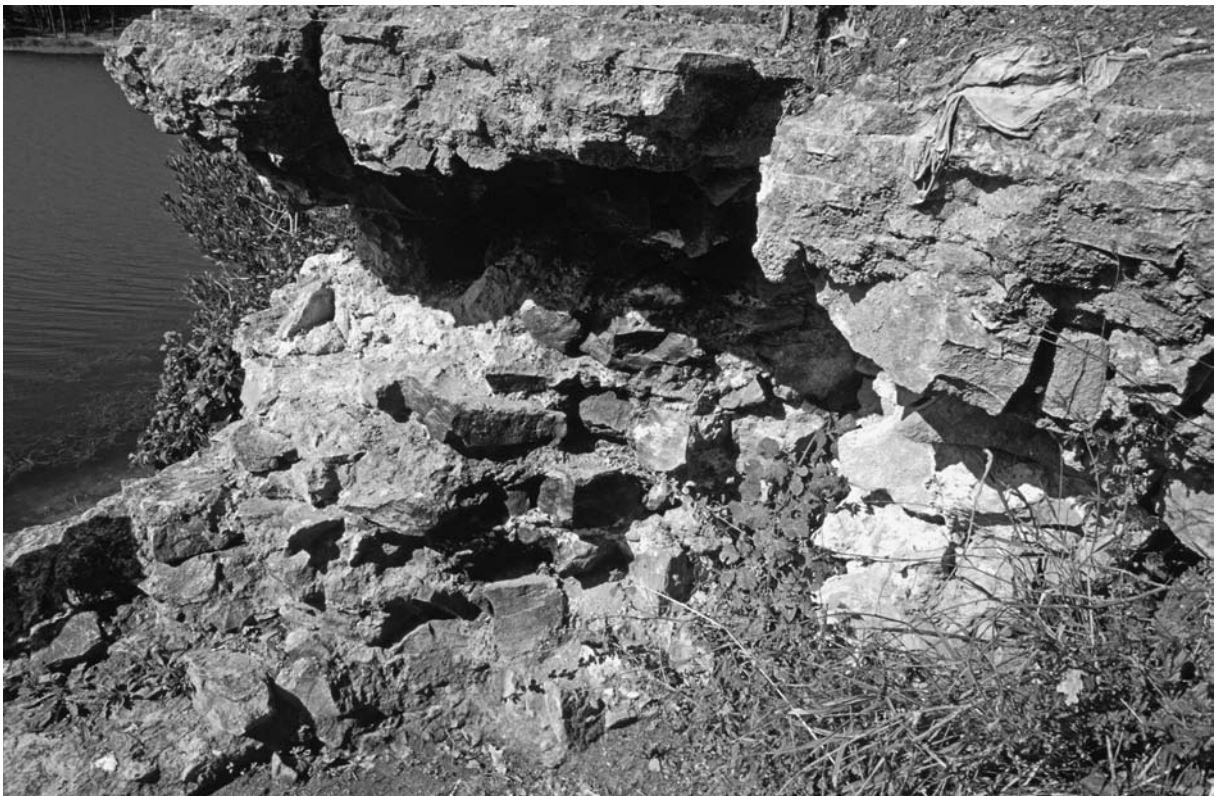
34 Derkos (Durusu), Manastir Iskelesi, Detail von SO