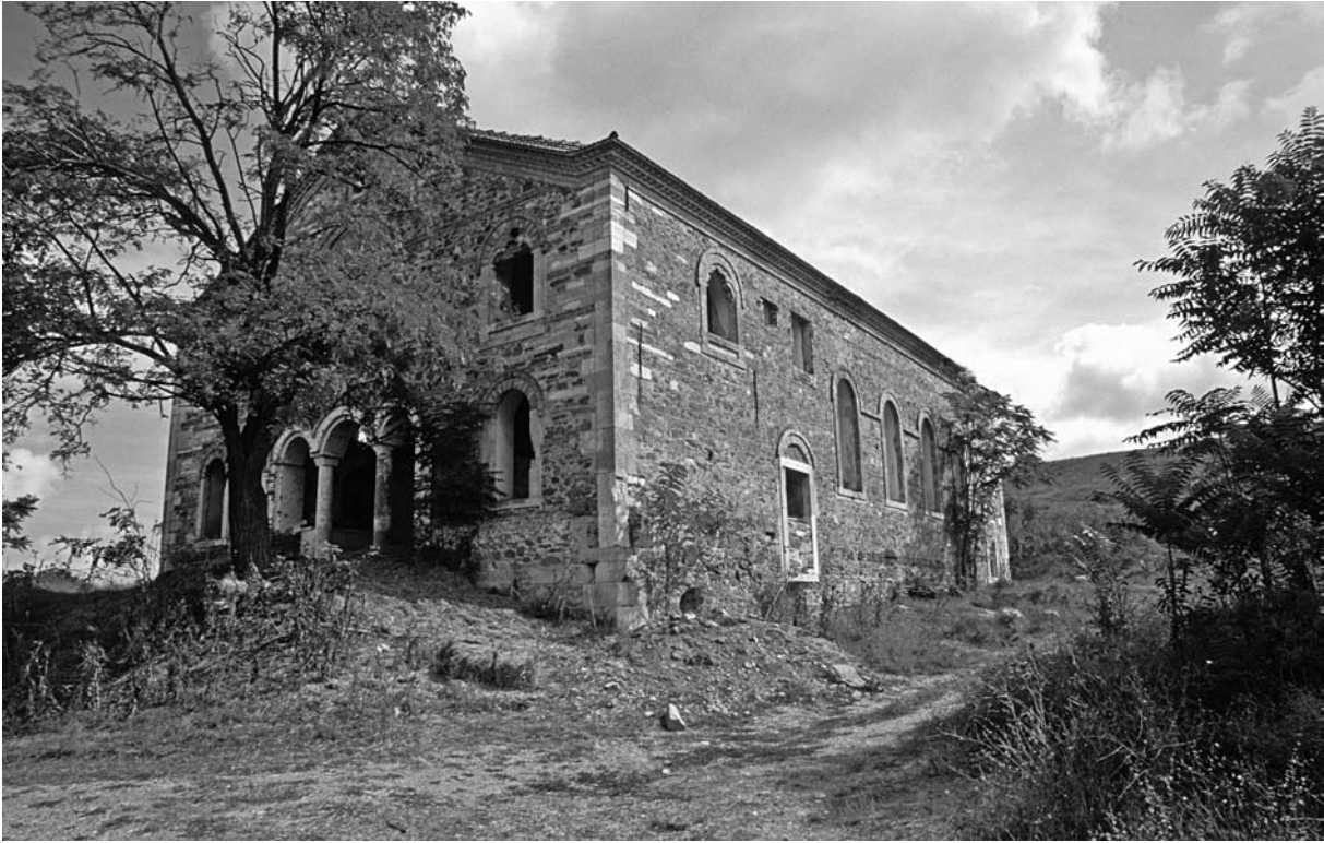
22 Değirmenköy, H. Paraskeuē von SW