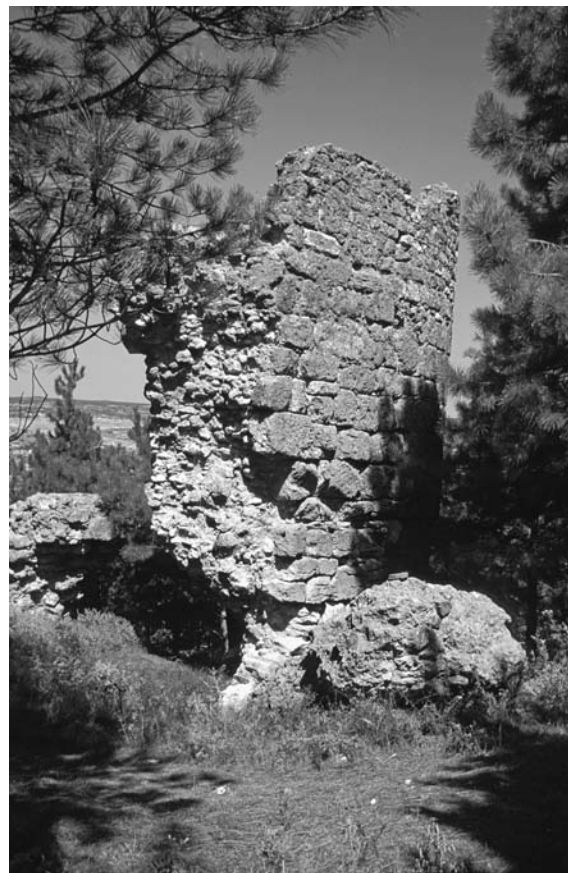
13 Bizyē (Vize), Mauerfragment n. unterhalb der Akropolis