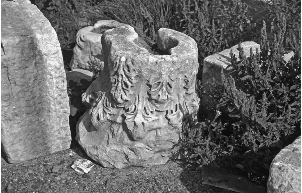
65 Hērakleia (Marmaraeğlisi), Kapitellfragment