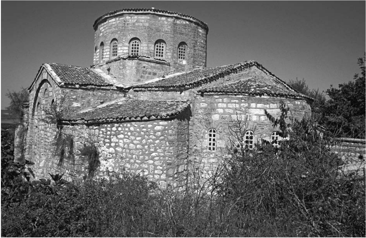
10 Bizyē (Vize), H. Sophia von SO