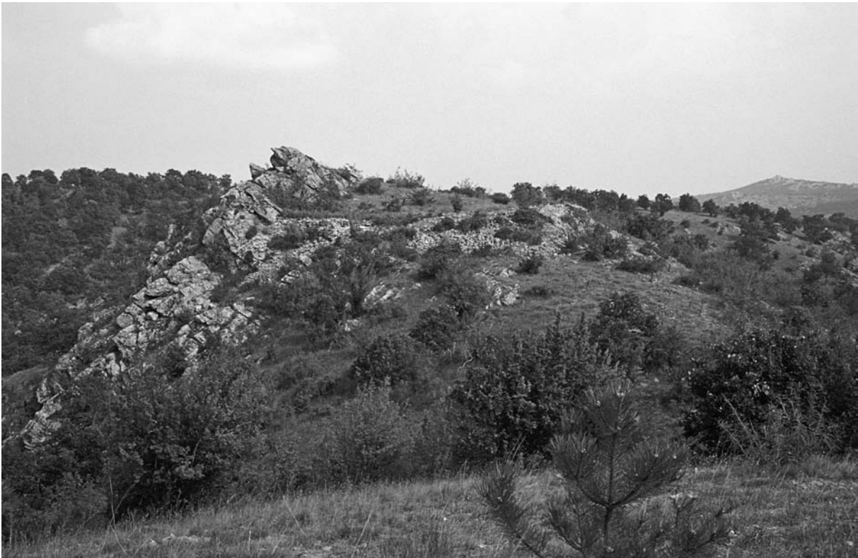
27 Demircihalil, Gözyaka Mevkiindeki Kale von W