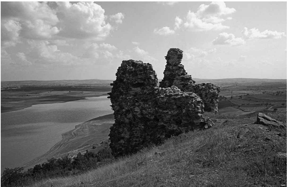
58 Garella (Altinyazi), SO-Turm oberhalb des Stausees