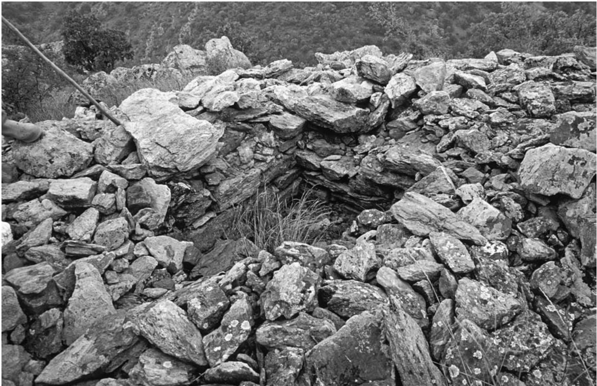
48 Erikler, Gebäude im Innern der Hasar Kale