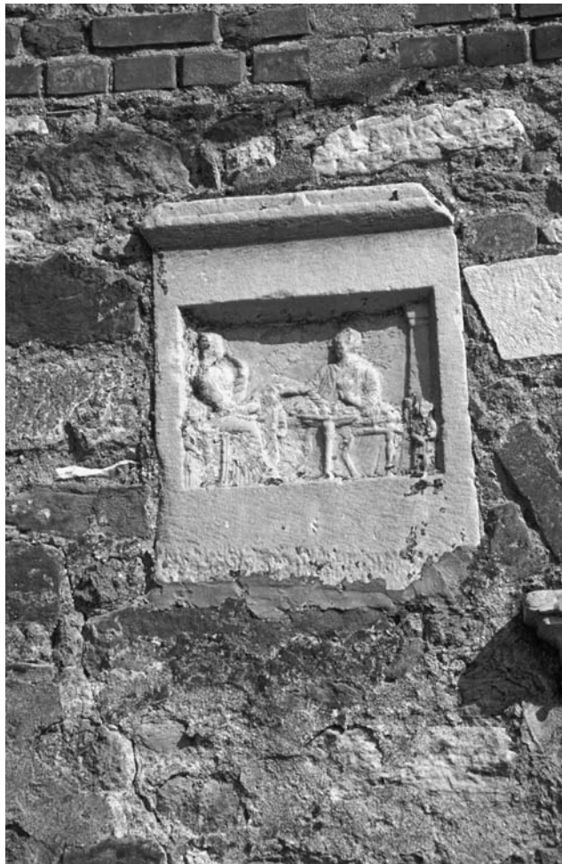
25 Deliōnes (Ortaköy), H. Dēmētrios, Detail der O-Mauer