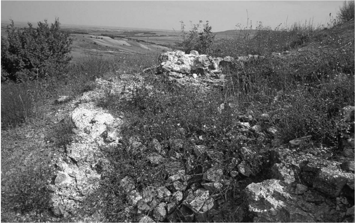
51 Ferhadanlı, Çinkale, N-Turm