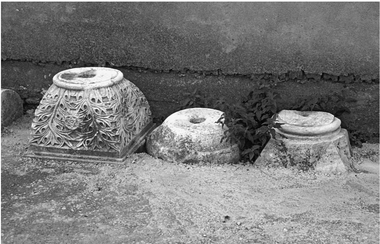
19 Chalkis (İnceik), Kapitelle