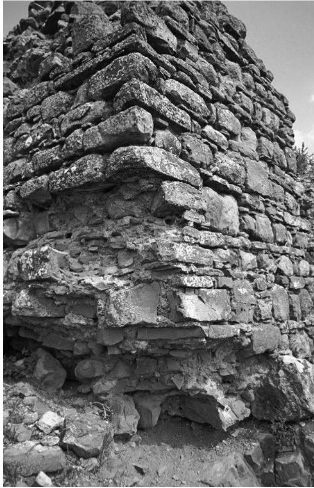
43 Elmalı, Palaiokastron, Bastion im SO, Außenseite