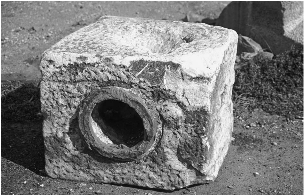
66 Hērakleia (Marmaraeğlisi), Teil der Druckwasserleitung