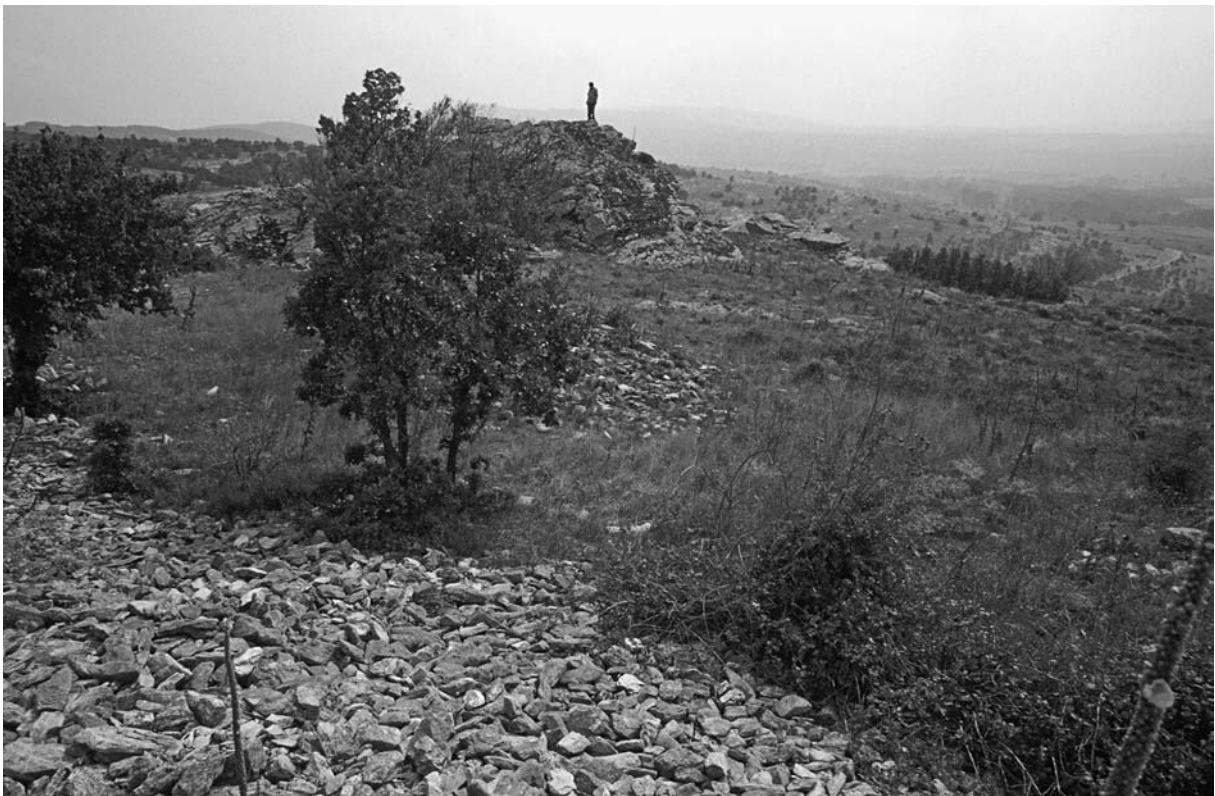
61 Hediye (Armağan), Büyük Kale, Blick ins Burginnere nach SO