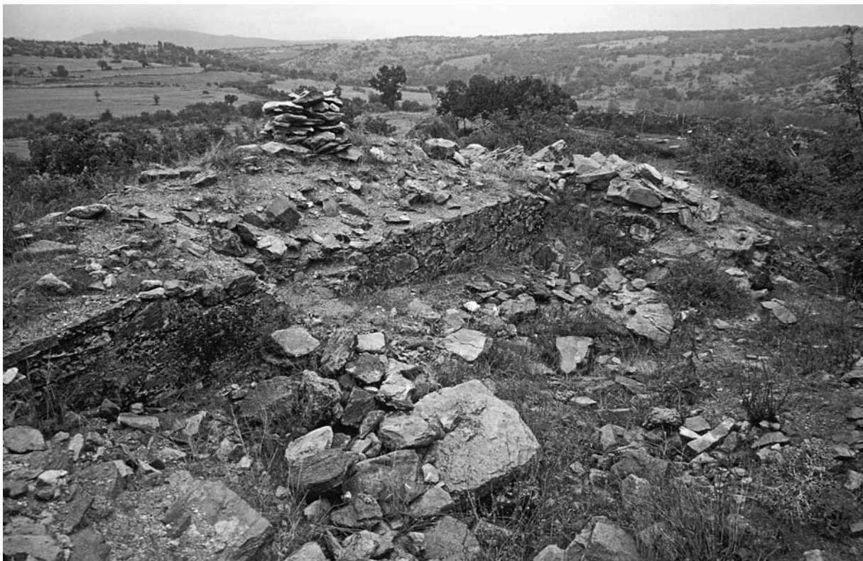
46 Erikler, Kirchenfundamente im W des Dorfes