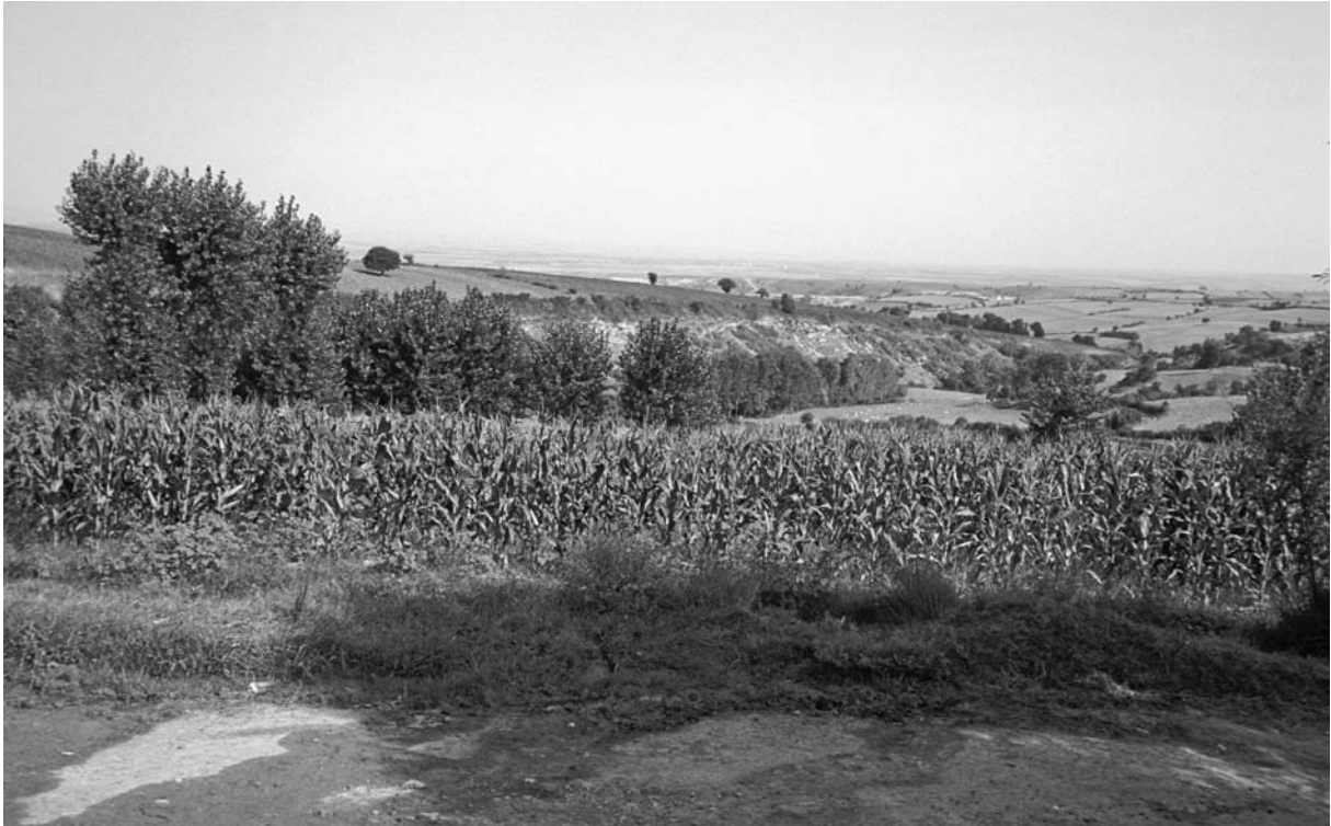
4 Aproi (Kermeyan), Siedlungsplatz von SW