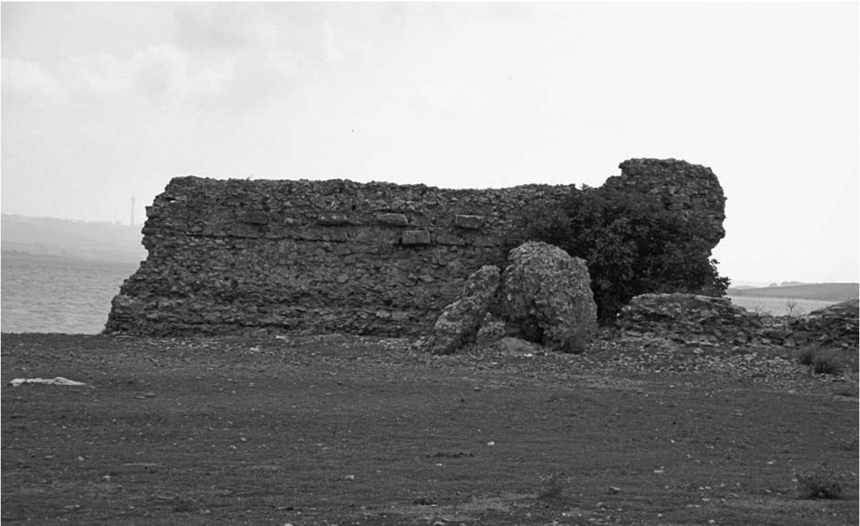
3 Ahmediye, O-Mauer, Innenseite