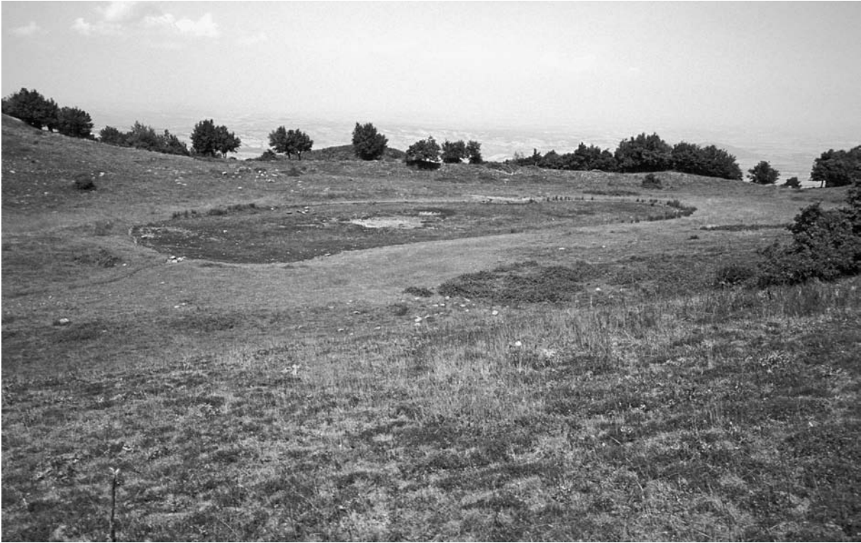
49 Eudēmion (Uçmakdere), Kartalkaya nw. des Dorfes