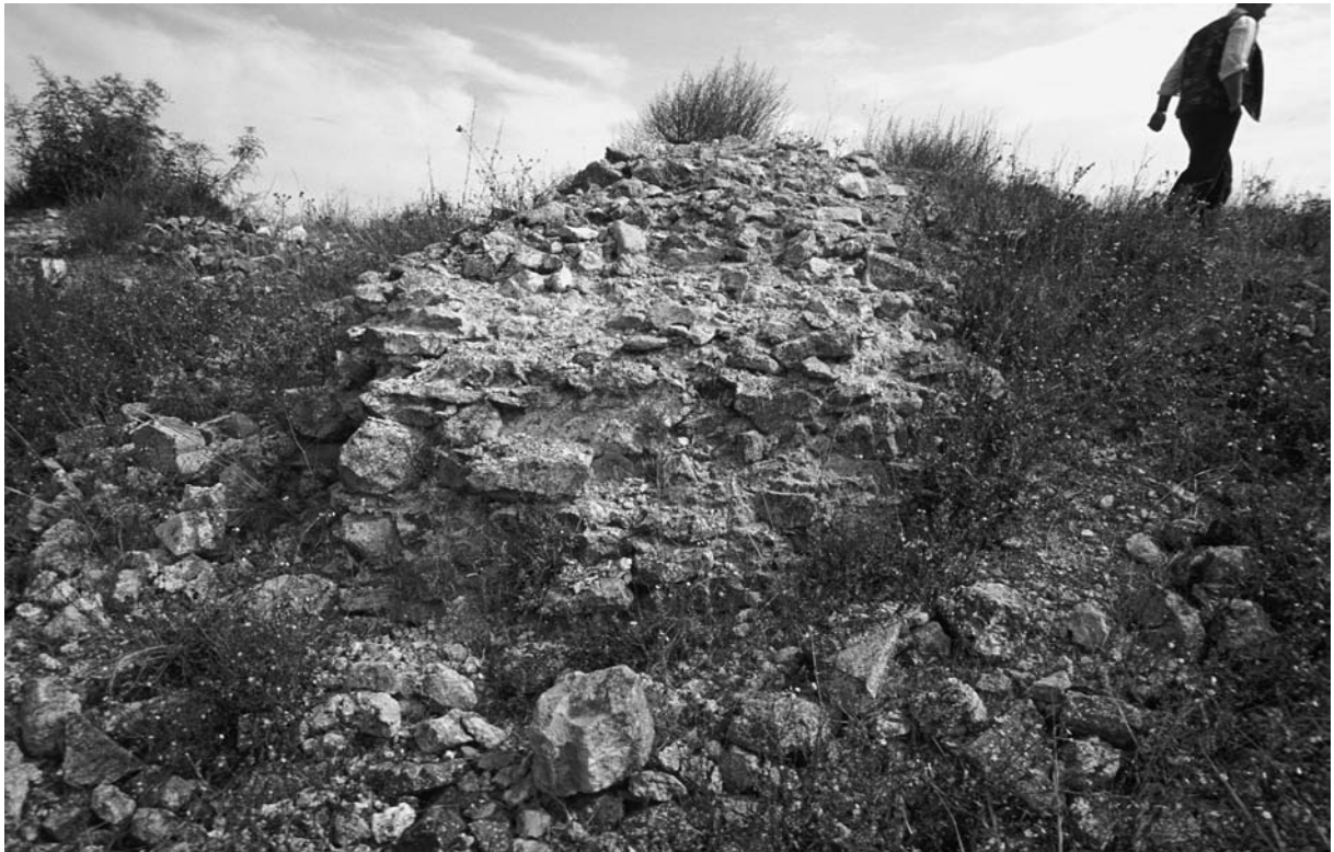
52 Ferhadanlı, Çinkale, N-Turm, Außenseite