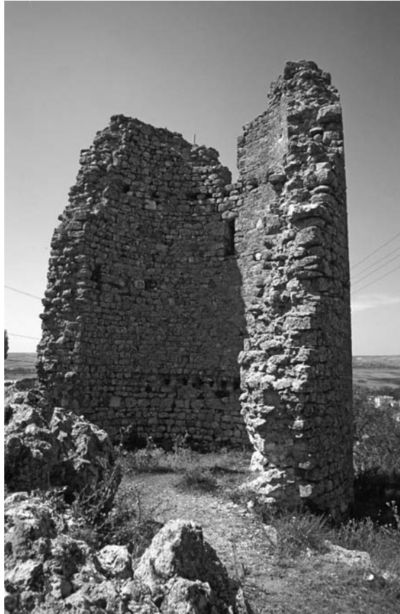
12 Bizyē (Vize), Turm auf der Akropolis