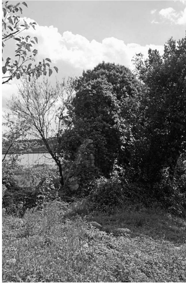
31 Derkos (Durusu), O-Mauer, Innenseite