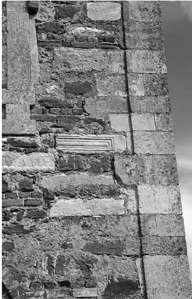
23 Değirmenköy, H. Paraskeuē, Detail der N-Mauer