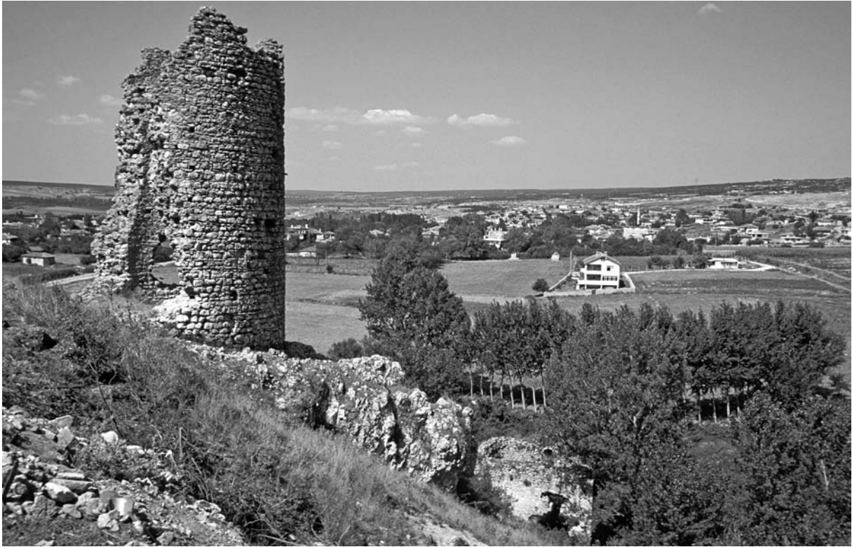
14 Bizyē (Vize), Rundturm unterhalb der Akropolis von NO