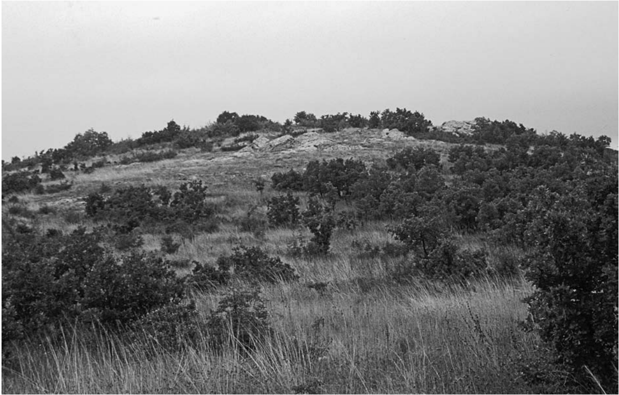
47 Erikler, Hasar Kale von NO