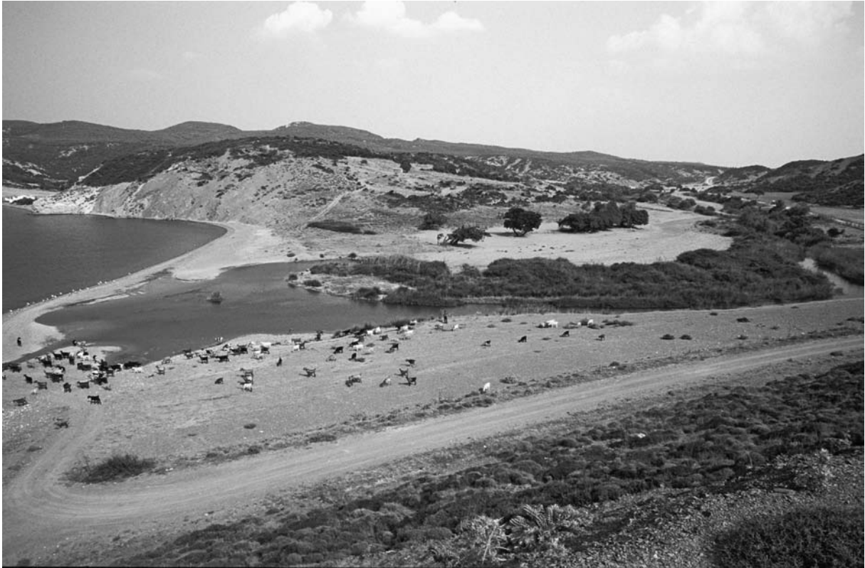
35 Drabos (Ece Limani), Mündung des Kurtulmus Dere von W