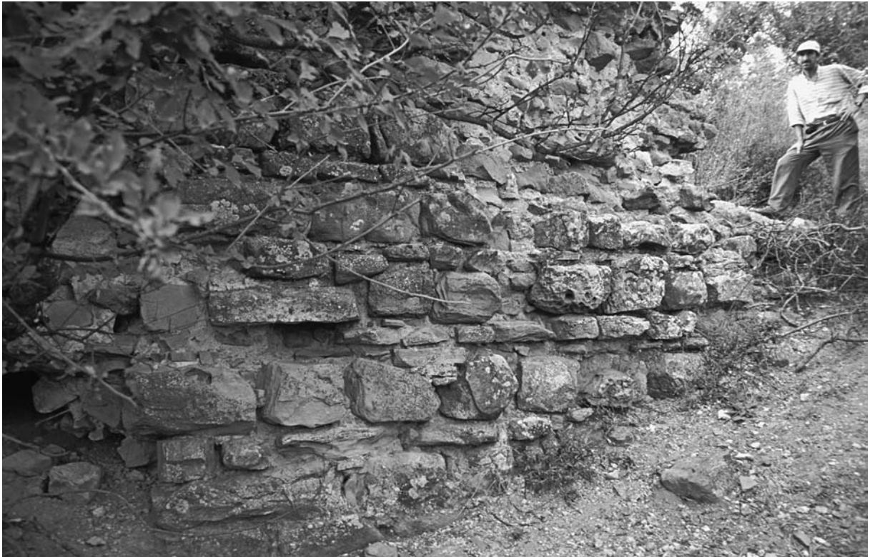
44 Elmalı, Palaiokastron, O-Mauer, Innenseite