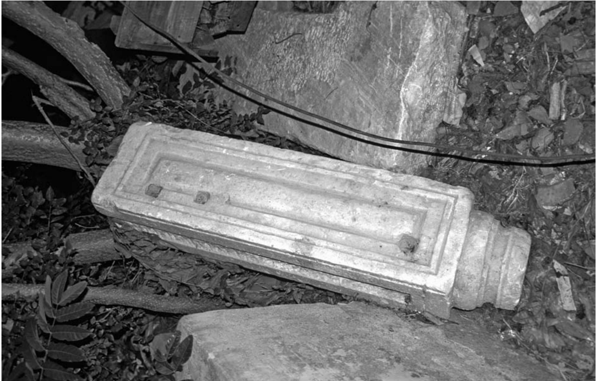
67 Hērakleitsa (Ereğlisi), Schrankenpfeiler