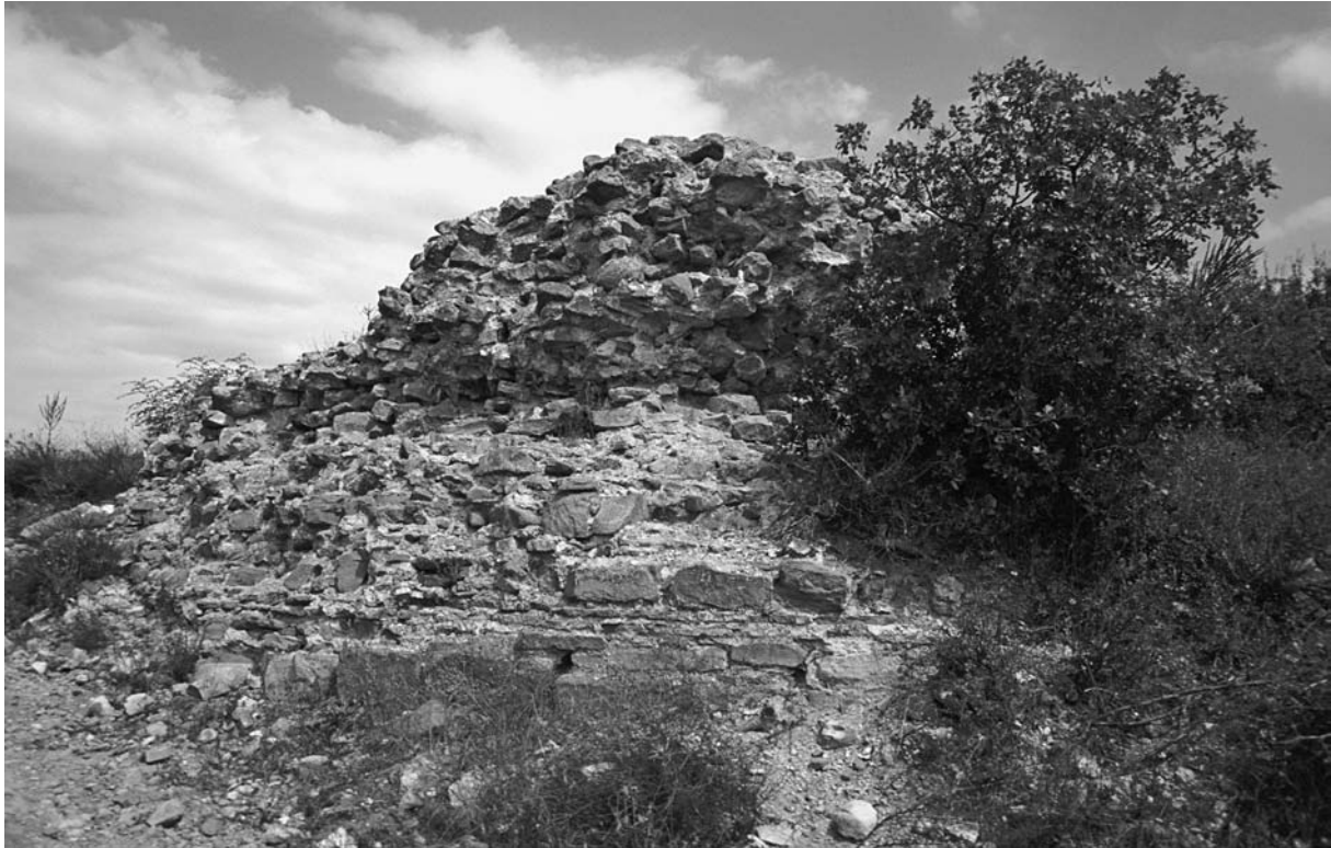
45 Elmalı, Palaiokastron, S-Mauer mit Turmrest