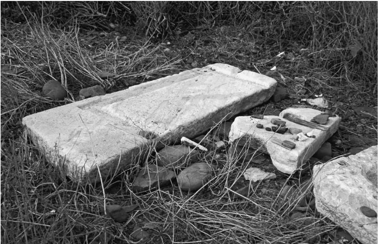
56 Ganos (Gaziköy), Architekturfragmente