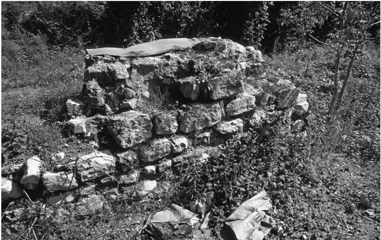
32 Derkos (Durusu), Mauerrest im Stadtgebiet