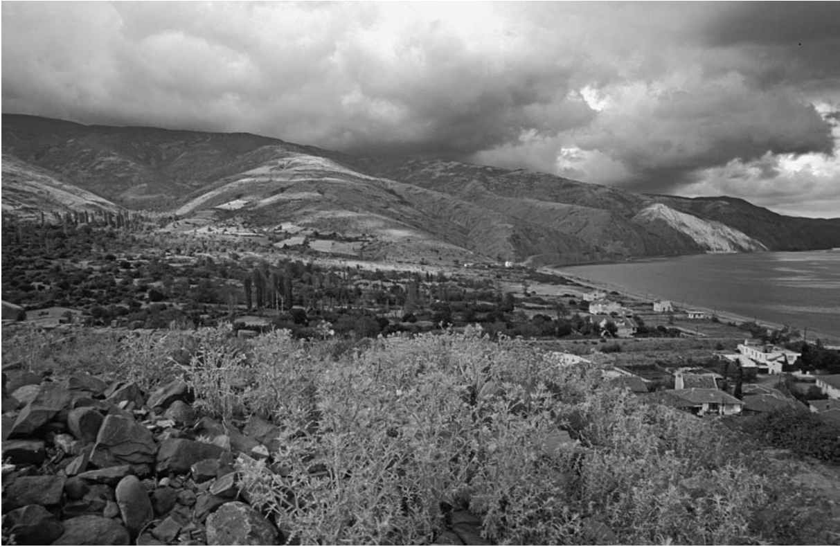
55 Ganos (Gaziköy), Blick von der Akropolis auf den Işıklar Dağı