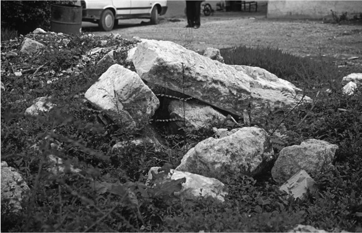
37 Dursunköy, Quader am sö. Dorfausgang