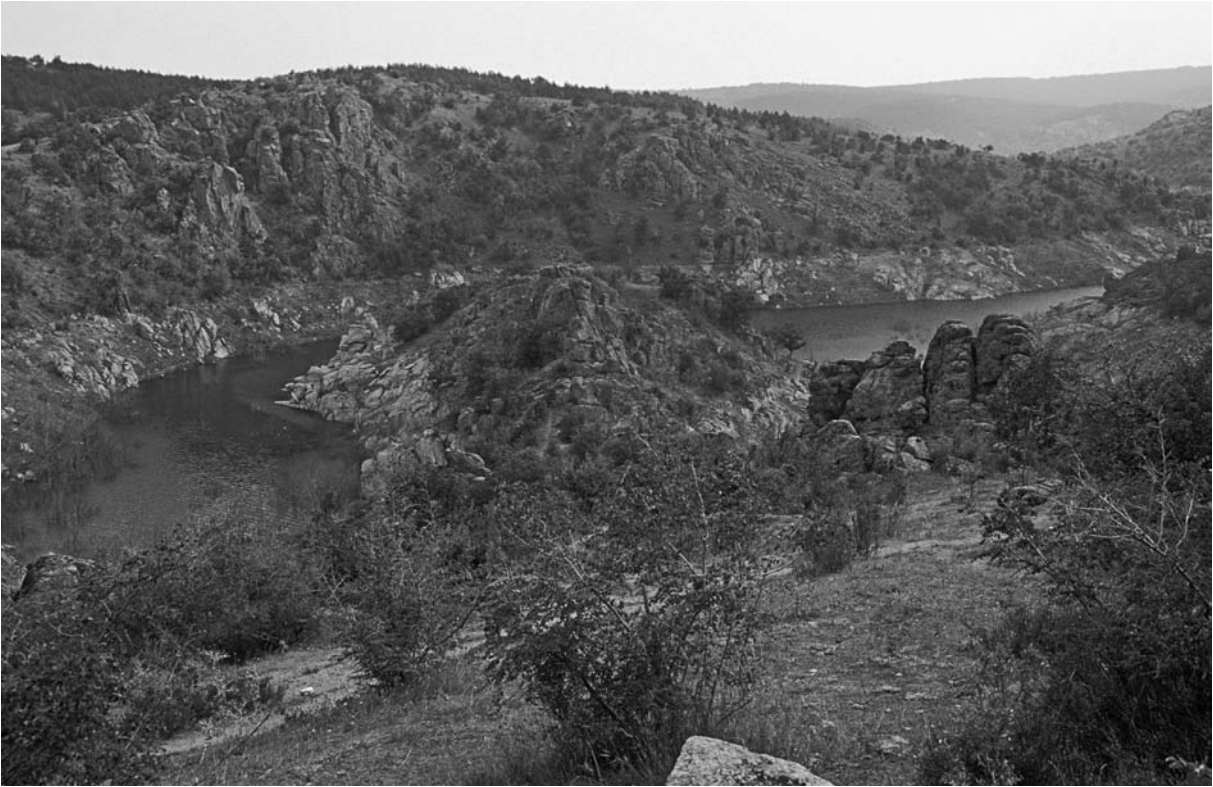
26 Demircihalil, Burunucu Mevkii Kalesi, Ansicht von NW