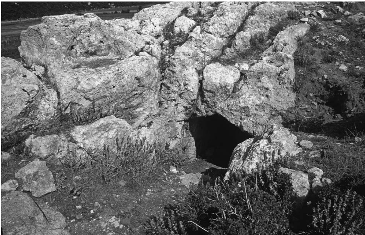
68 İbrikbaba, Höhleneingang auf der Akropolis