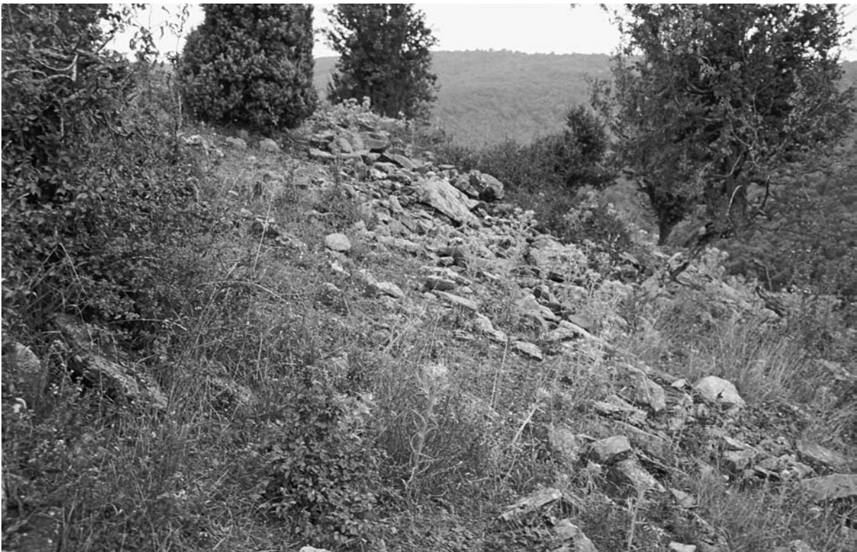
7 Beyoğlu, Reste der S-Mauer