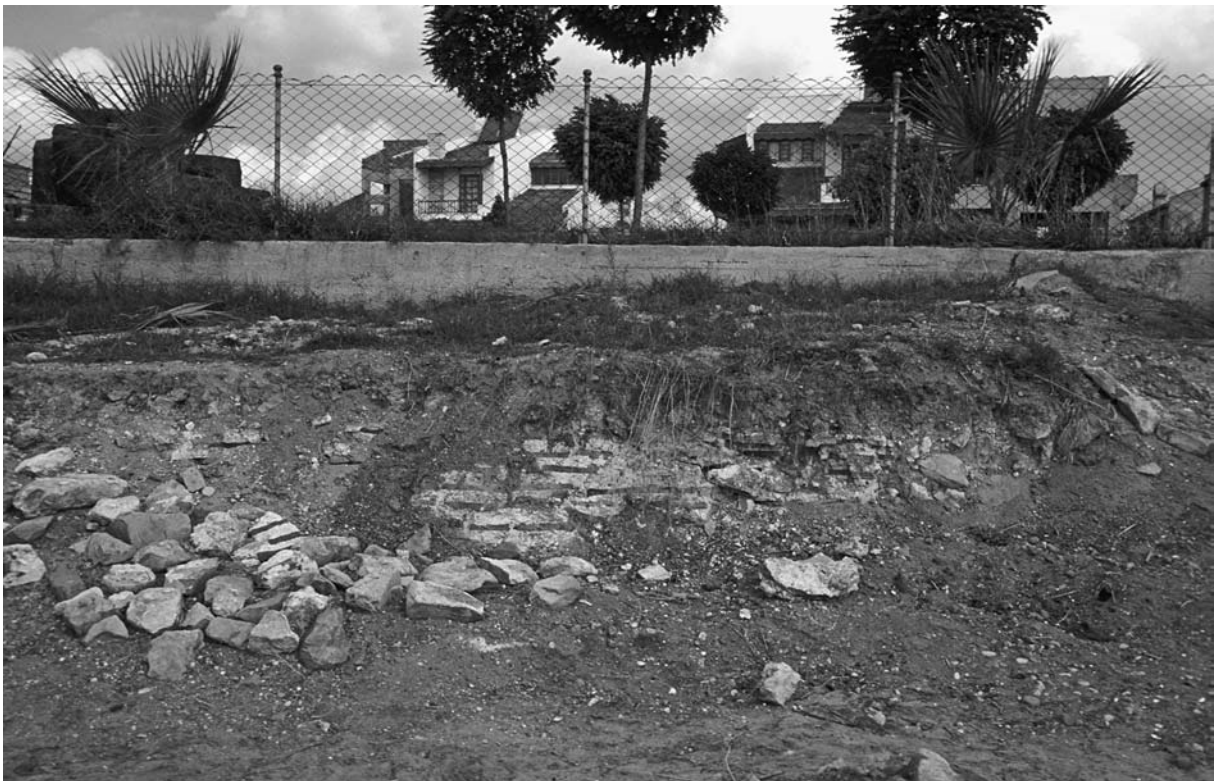
21 Daneion (Kinaliköprü), Mauerreste am Meeresufer von S