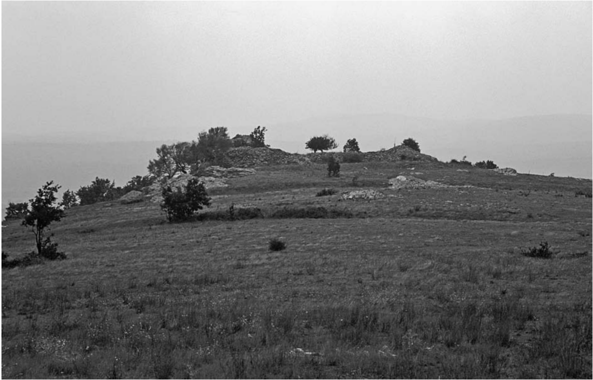
60 Hediye (Armağan), Büyük Kale von NW