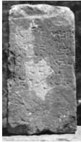
Abb. 2 Weihung aus Alt-Olympos