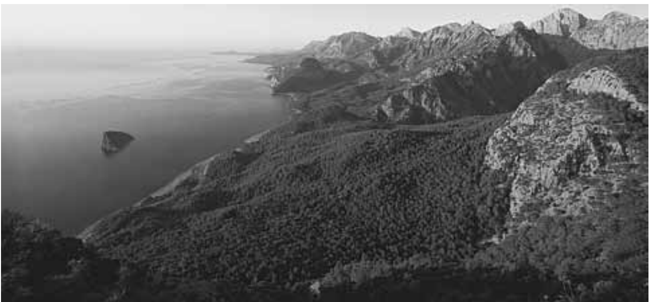
Abb. 6 Das von Äolern besiedelte Gebiet zwischen Antalya und Kemer