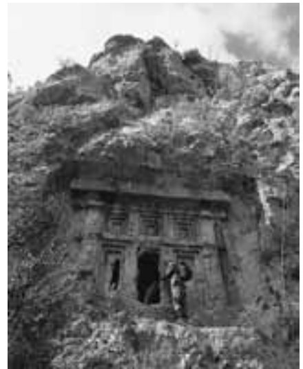
Abb. 5 Felsgrab von Asarpınar bei Erentepe