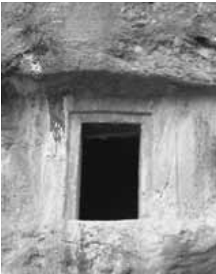
Abb. 4 Felsgrab von Andızlitaş mit Dialektinschrift