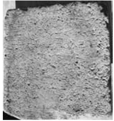
Abb. 3 Proxenedekret aus Olbia