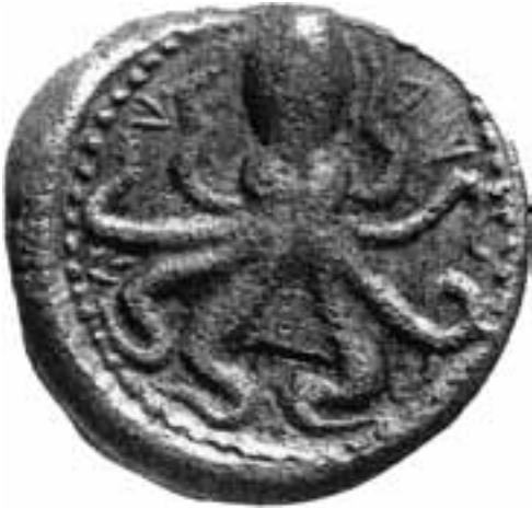
Abb. 1 Münze von Gagai (Athenaeum 90, 2002, 75)