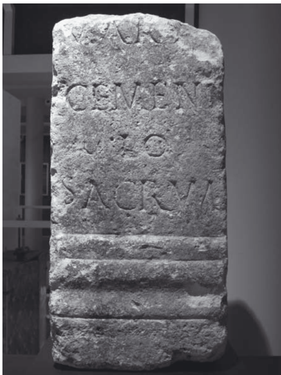
Fig. 3: Ara de Mars Cemenilus (León, Museo Arqueológico de León).