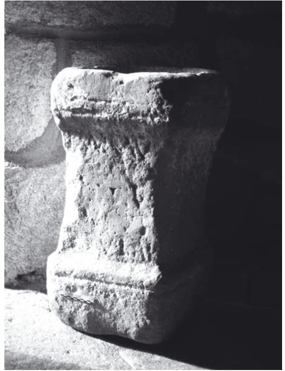
Fig. 6: Ara conservada en la iglesia de Pedrosa (Cualedro, Orense; © M. Ramírez Sánchez).