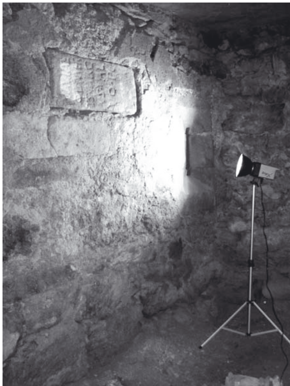
Fig. 1: Inscripción de Navia: ubicación en el muro este de la casa rectoral de San Martiño de Lesende (Lousame, La Coruña; © M. Ramírez Sánchez).