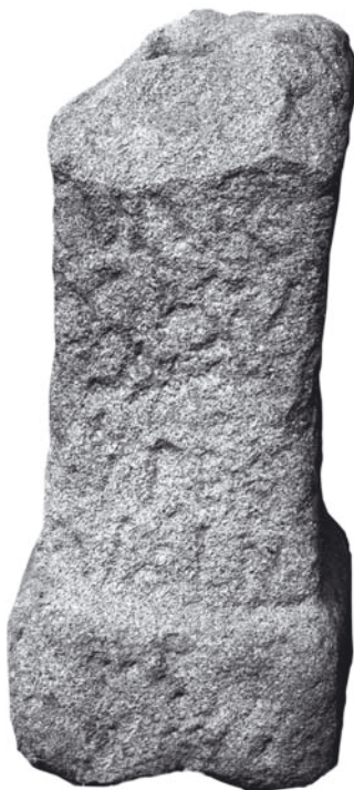
Fig. 7: Ara de Rabal (Oimbra/ Orense, Museo Arqueológico de Orense).