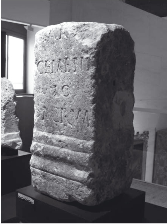
Fig. 5: Ara de Mars Cemenilus: vista lateral (León, Museo Arqueológico de León).