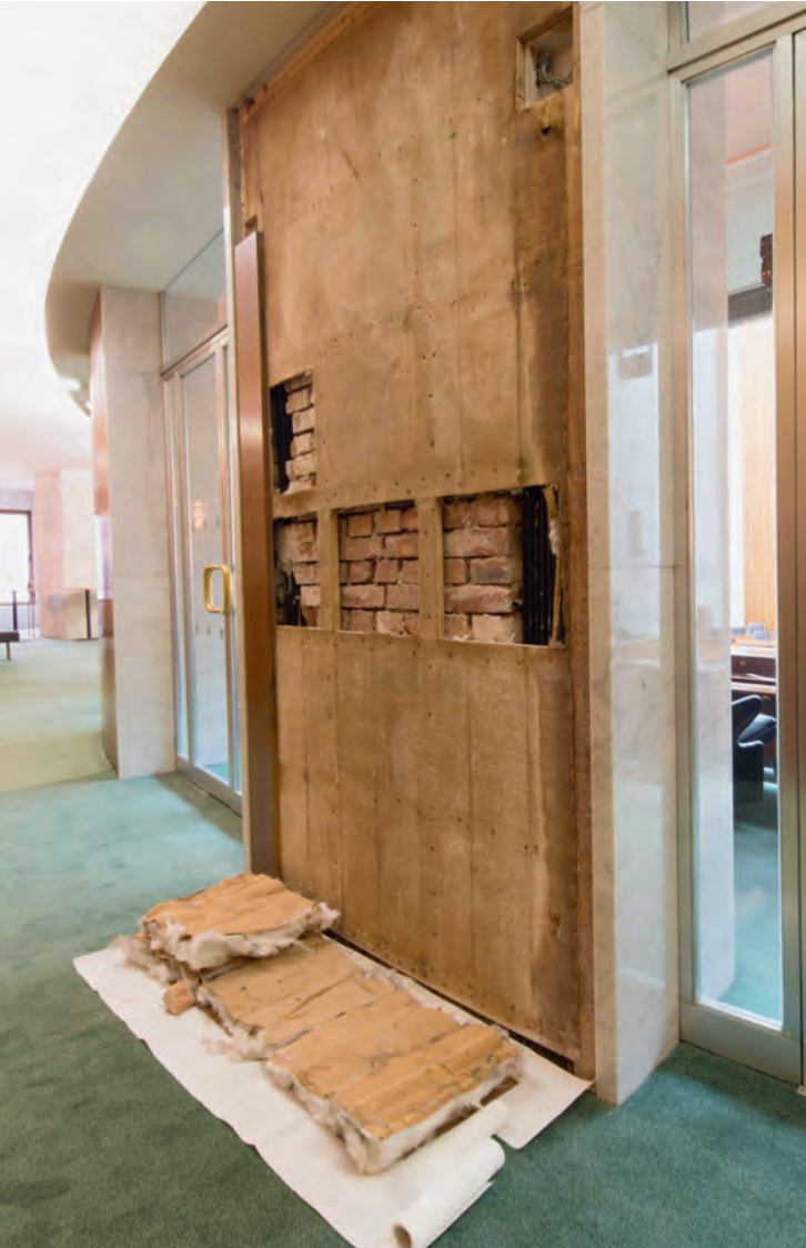
Abb. 2: Befundöffnung und Probedemontage Paneele im Couloir, 2016

Die Befundflächen wurden zu folgenden Detailfragen der Konservierungs- und Restaurierungsmaßnahmen angelegt und fotografisch dokumentiert: