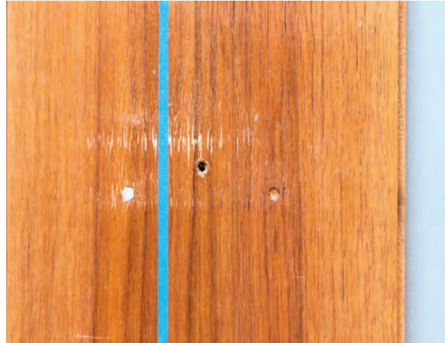
Abb. 3: Detail der Befundfläche, links Zwischenzustand nach Kittung eines Bohrlochs, rechts Vorzustand