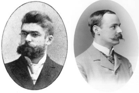
Abb. 1: Linkes Bild: Carl W. Wirtz (aus: Portraitgalerie der Astronomischen Gesellschaft, 1904) — Rechtes Bild: Karl Schwarzschild (aus: H.H. Voigt (Hrsg.): Karl Schwarzschild, Gesammelte Werke, Bd. 1)

Die Sternwarte besaß um die Wende vom 19. zum 20. Jahrhundert einen Meridiankreis mit 132/1500 mm, einen Vertikalkreis, ein großes Heliometer von 217/3000 mm, einen Refraktor von 270/3400 mm mit einem photographischen Rohr 156/2940 mm. Es scheint, als ob letzteres auf Initiative eines der ersten Assistenten, Samuel Oppenheim, ca. 1890 angeschafft wurde, und es ist das Instrument, mit dem die im Folgenden erwähnten Beobachtungen gewonnen wurden.