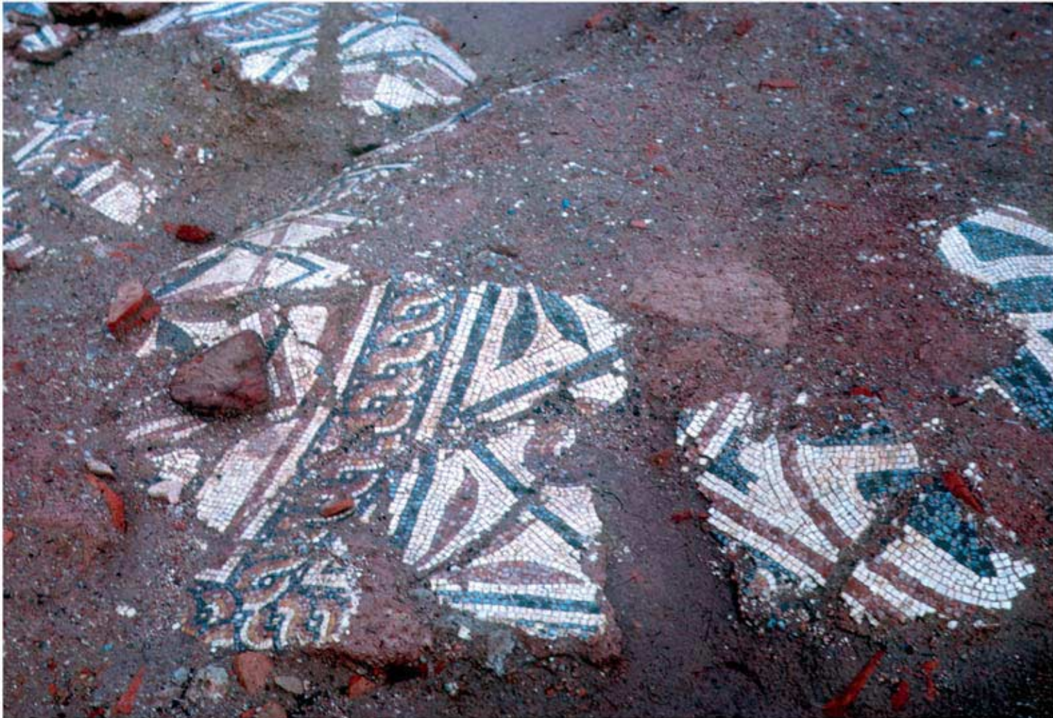
114.1: Mosaik aus Raum 9.2. Detail Flechtbandgitter