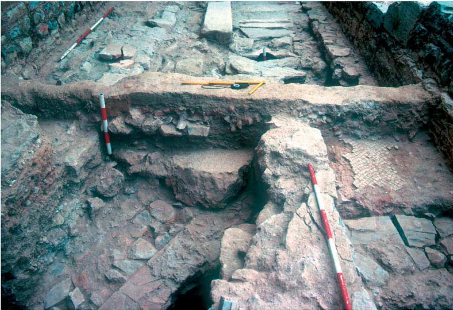
113.1: Mosaikfragment aus Raum N 2. Ansicht von Ost. Grabung 1992