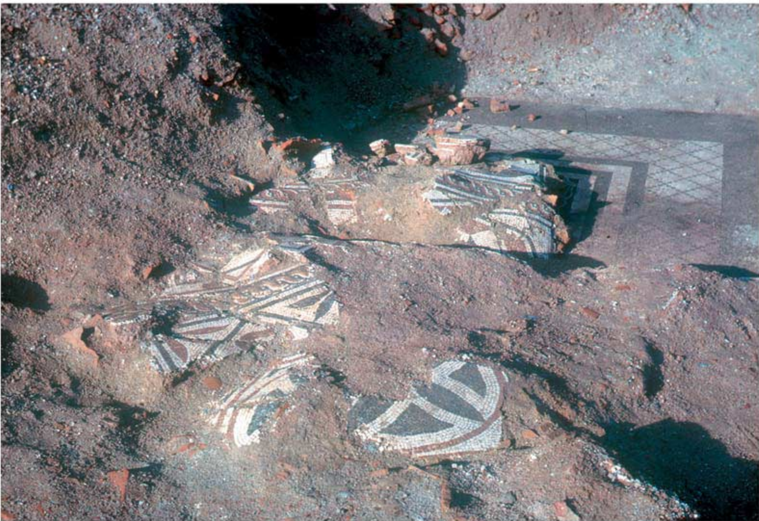
113.2: Mosaik aus Raum 9.2. Ansicht von Ost