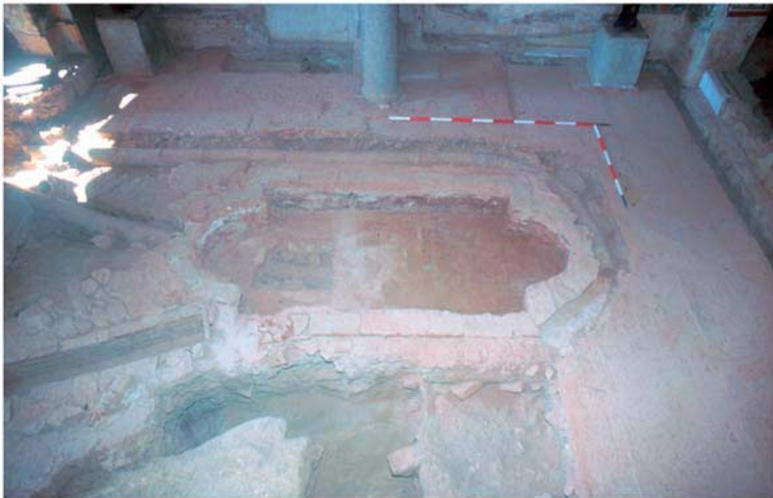
135.2: Hof 21, Nymphaeum mit Tonrohrwasserleitungen und Kanal