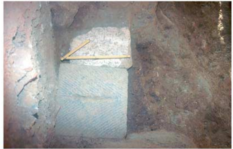
134.2: Hof 21, Vorbebauung, Türschwelle aus Spolien, Reste eines Lehm-bodens