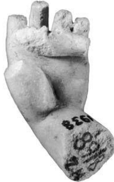
144.3: S 18 Gekrümmte linke Hand