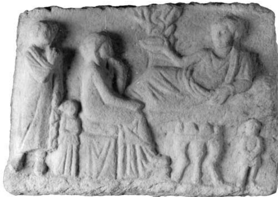
138.3: S 4 Totenmahlrelief