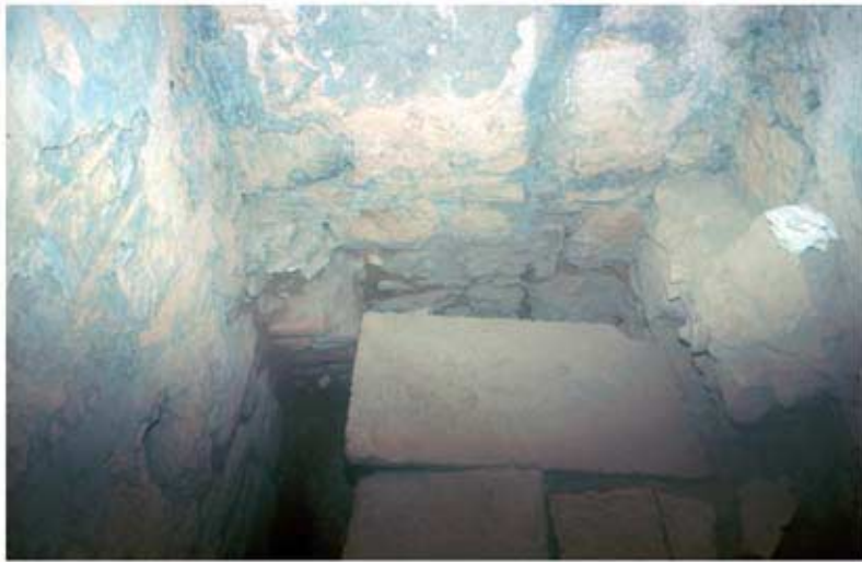
134.1: Latrine 4a, Kanäle