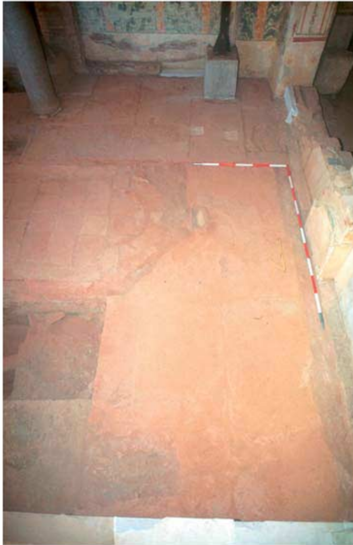
136.1: Hof 21, Westseite, Abdrücke des älteren Marmorbodens