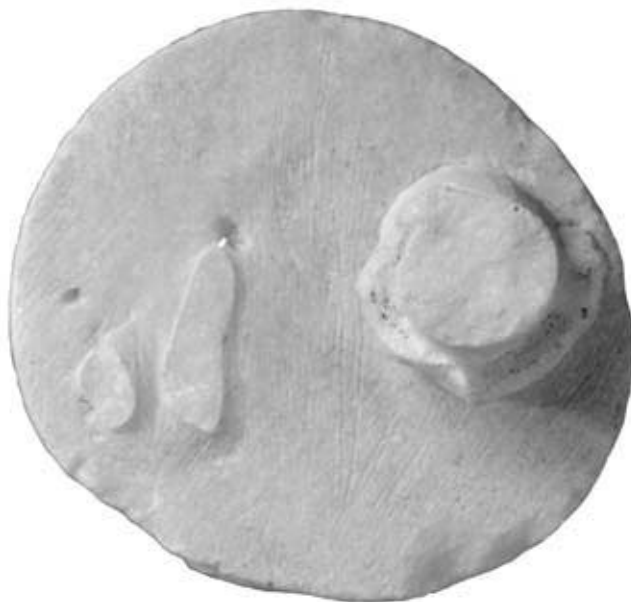
140.2: S 11 Runde Basis einer Statuette (Hygieia)