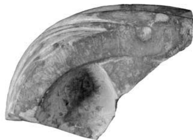
140.3: S 12 Fragment einer weiblichen Gewandbüste