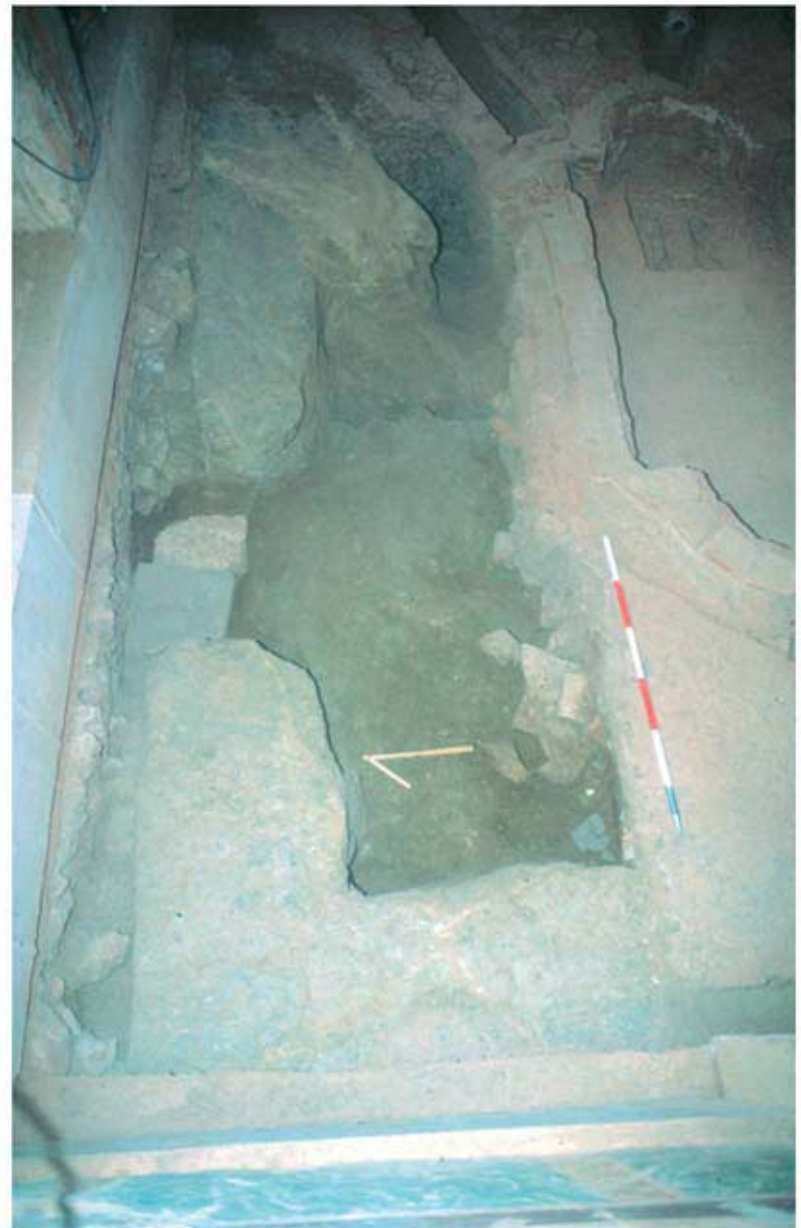
134.4: Hof 21, nördlich des Nymphaeums im Vordergrund die Hausgrube mit Schwelle, dahinter die Grube des Bauopfers