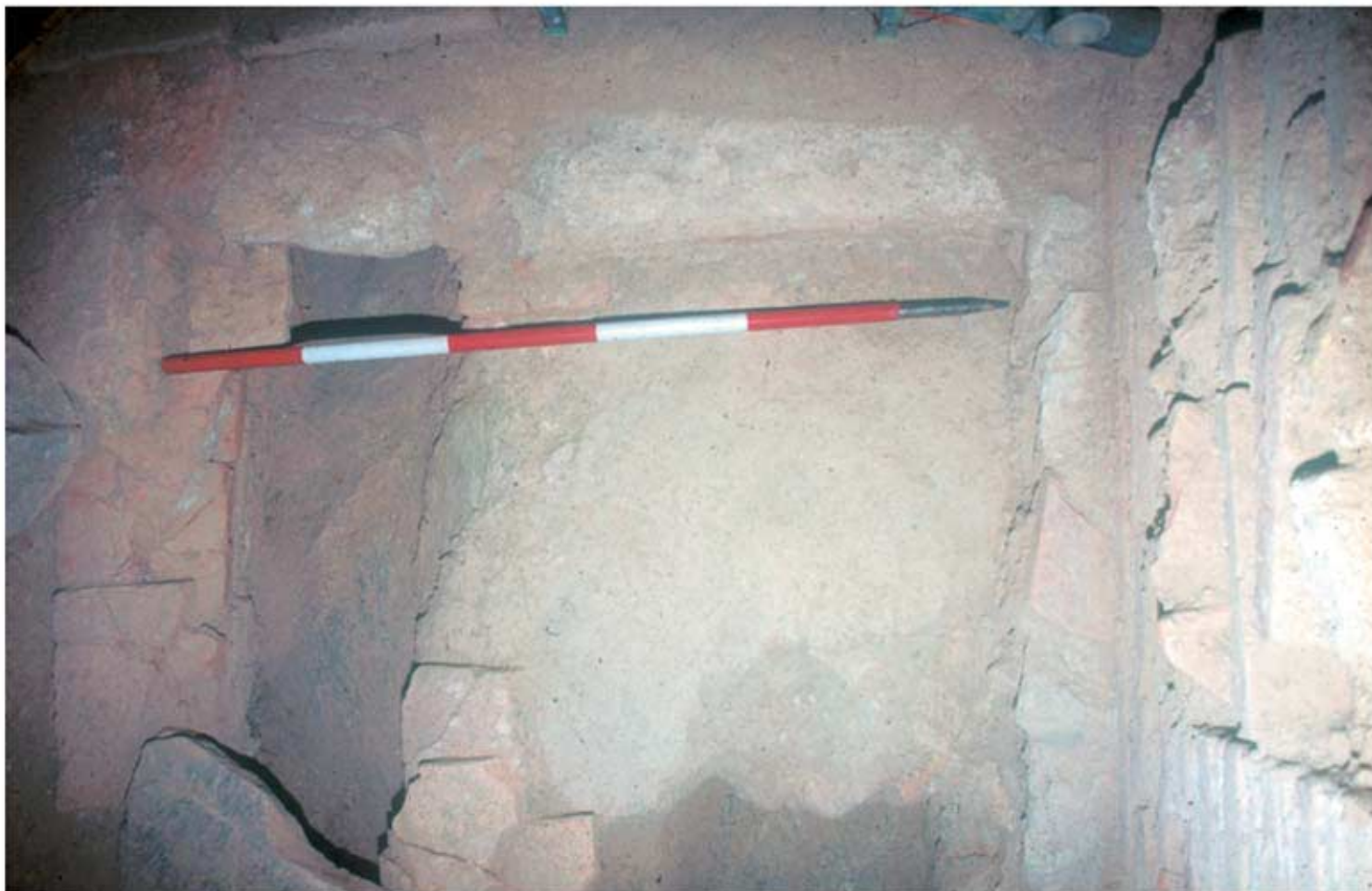
136.3: Raum 14a, Mörtelboden und Kanal