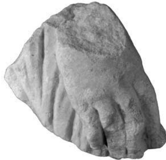
144.4: S 23 Überlebensgröße rechte Hand