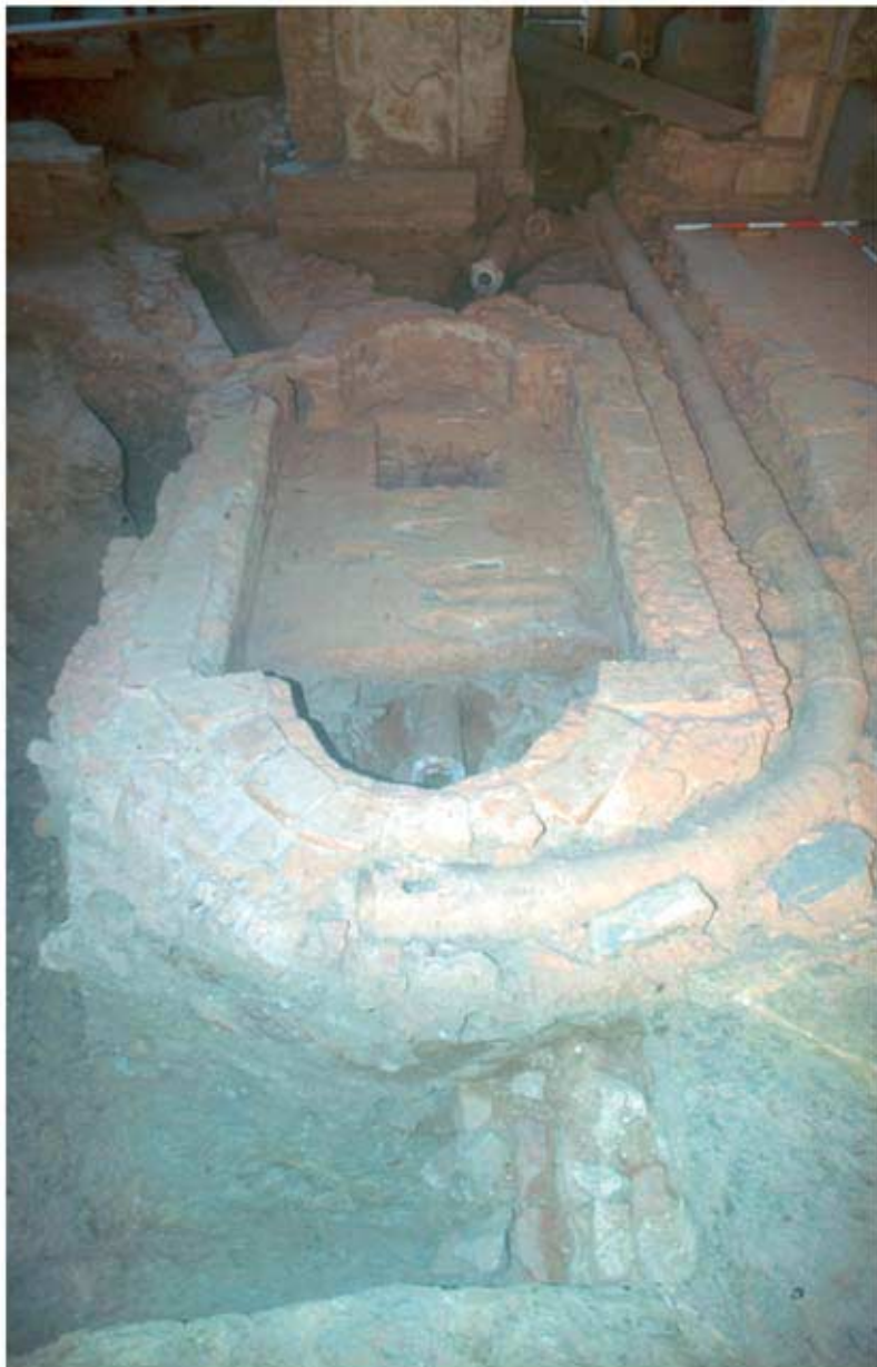
134.3: Hof 21, Vorbebauung, SW-Ecke der Hausgrube mit Ziegelauf-mauerung