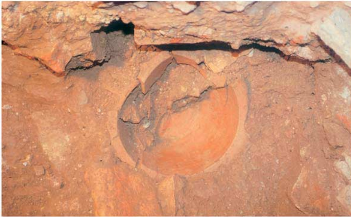
135.1: Hof 21, Bauopfer der Bauphase I'