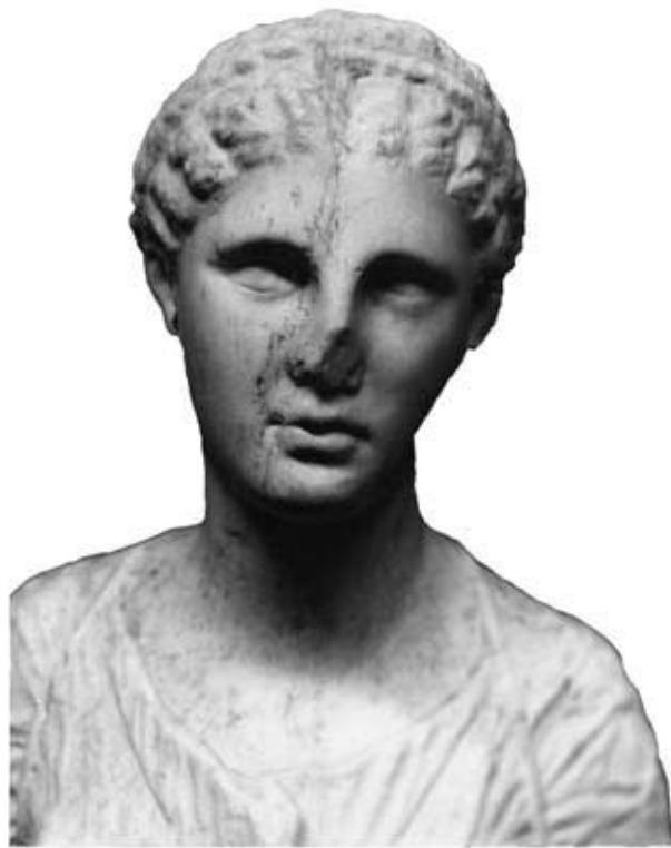
139: S 5 Artemisstatue