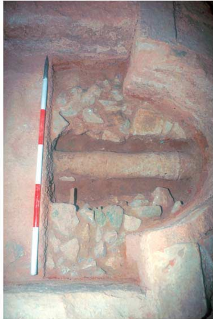
136.2: Hof 21, Nymphäum, ältere Leitung unter dem Becken