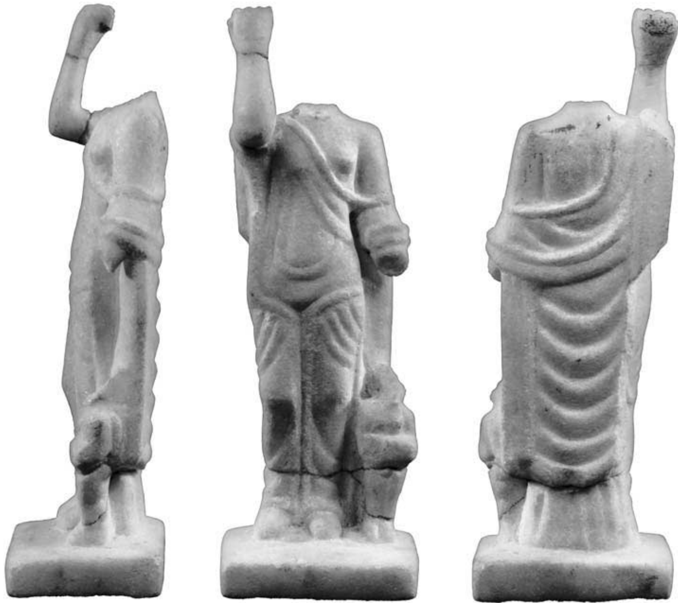
142.1: S 14 Aphroditestatue mit Beifigur