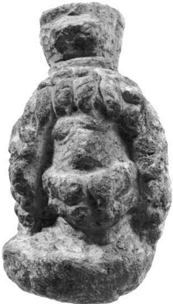
144.2: S 20 Sarapisköpfchen