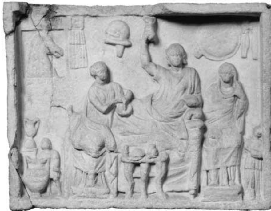
138.2: S 3 Totenmahlrelief