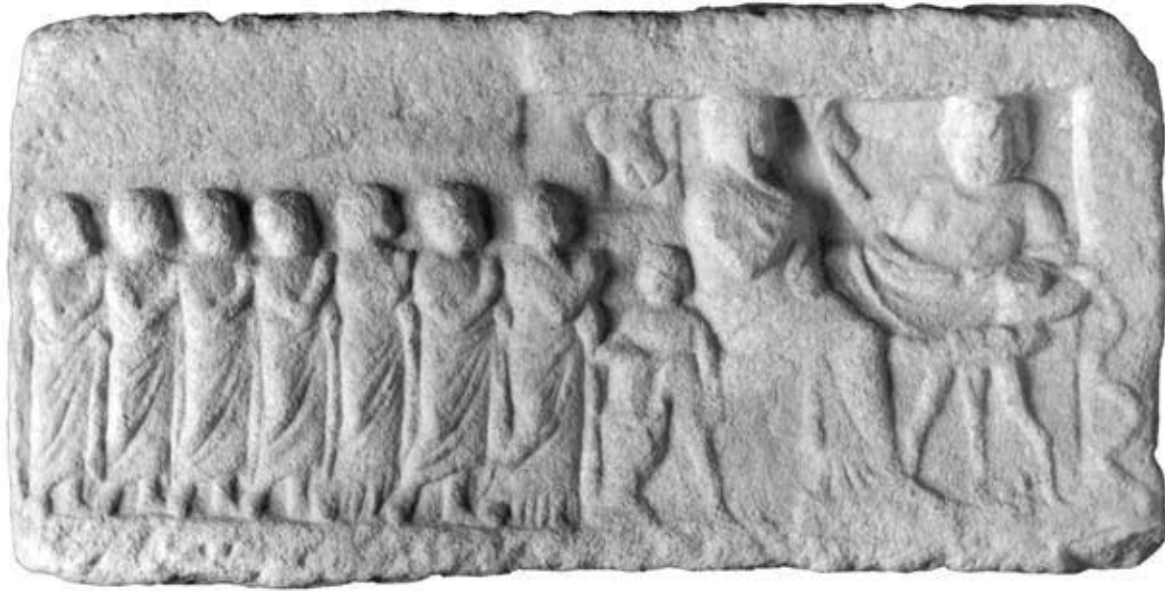
138.1: S 2 Totenmahlrelief