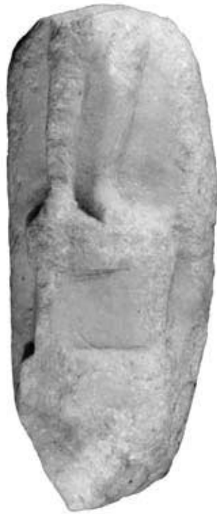
140.1: S 10 Skulpturenfragment