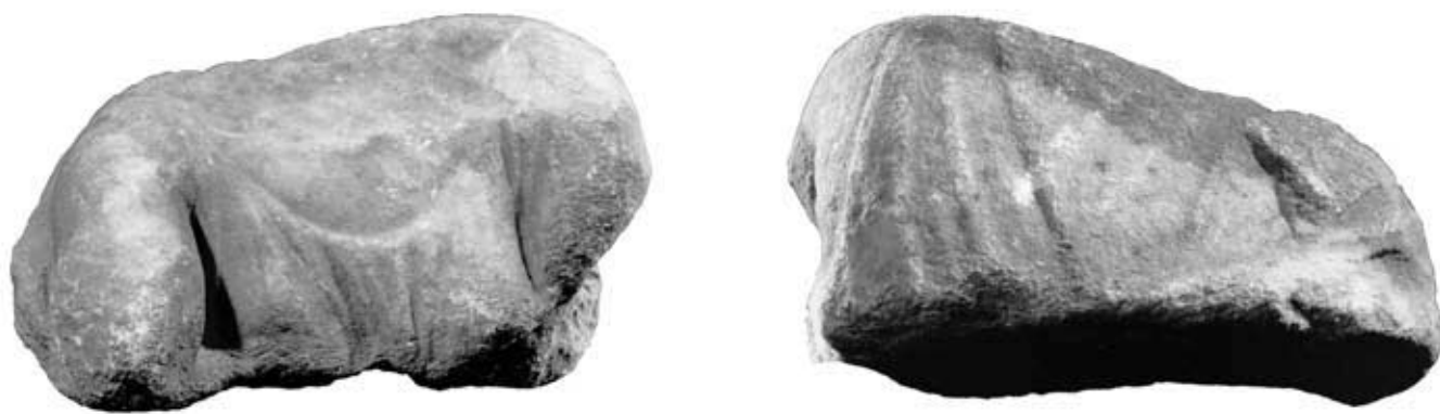
142.2: S 15 Oberkörper einer weiblichen Gewandfigur