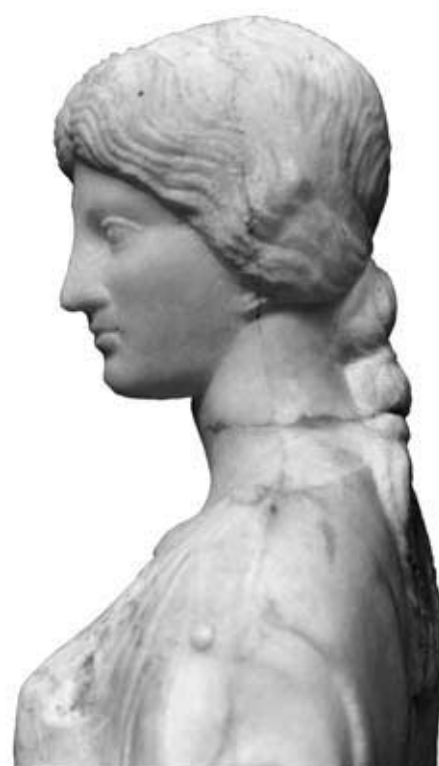
143: S 17 Artemisstatuette