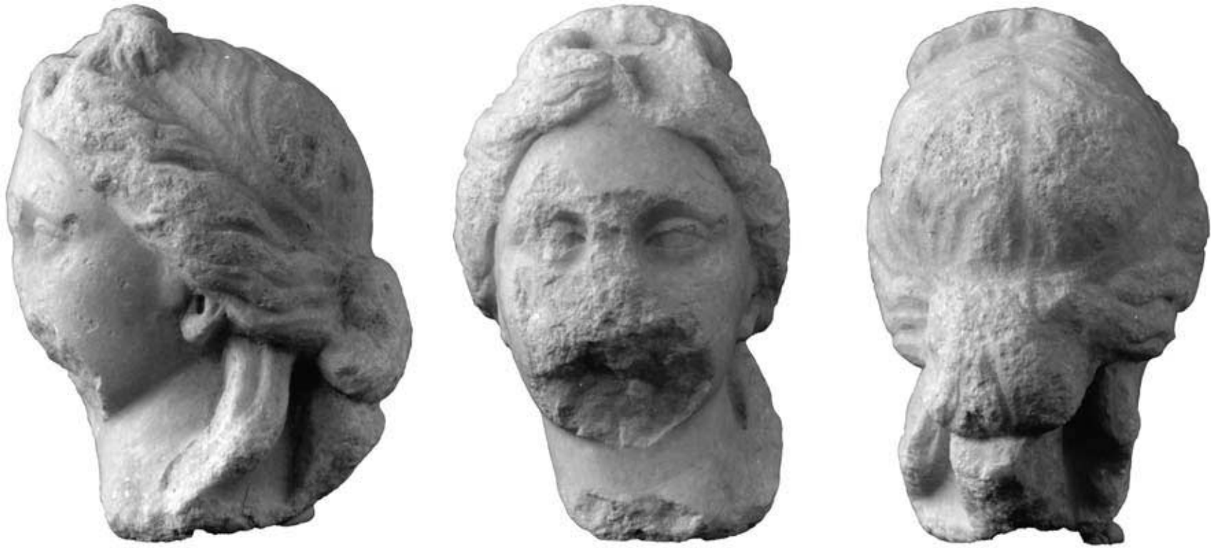
141.1: S 9 Aphroditeköpfchen