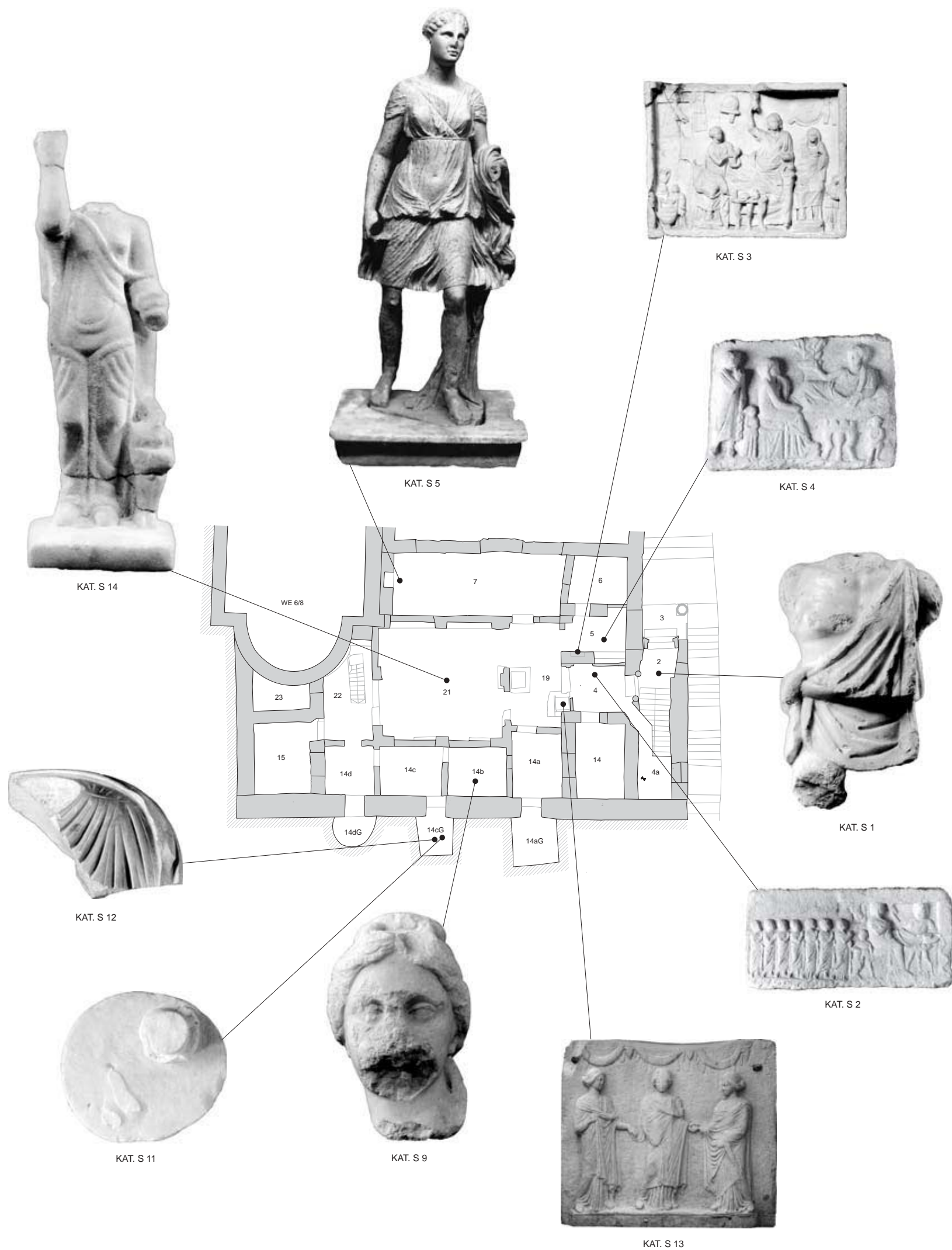
145: Fundverteilungsplan der Skulpturen aus dem Erdgeschoß