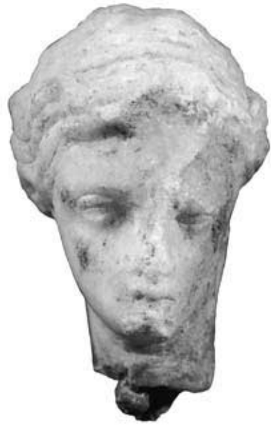
144.1: S 19 Weibliches Köpfchen