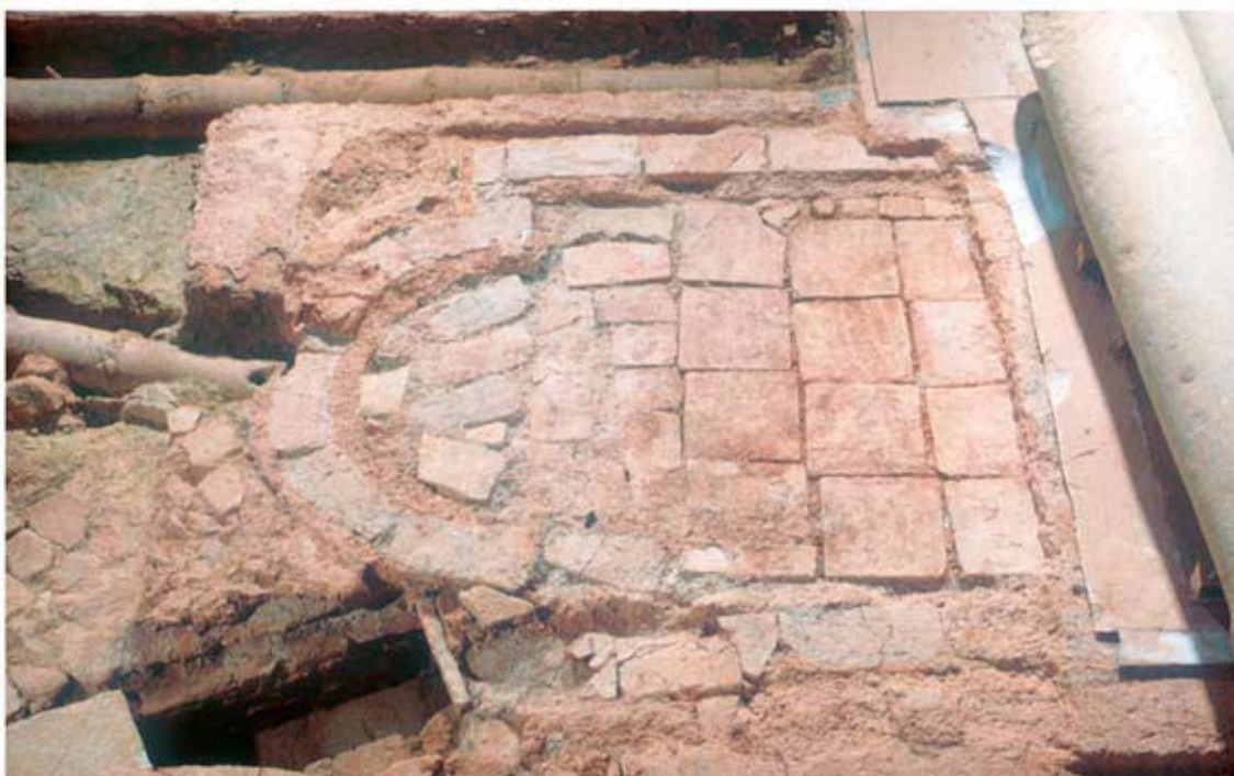
135.3: Hof 21, Ostteil des Nymphaeums mit Ziegelverfüllung