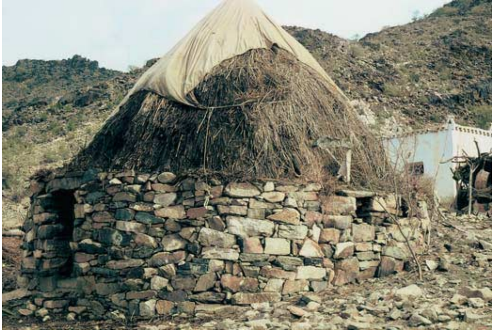
Abb. 49: Mischform in al-Tawq, Steinmauer mit Strohdach