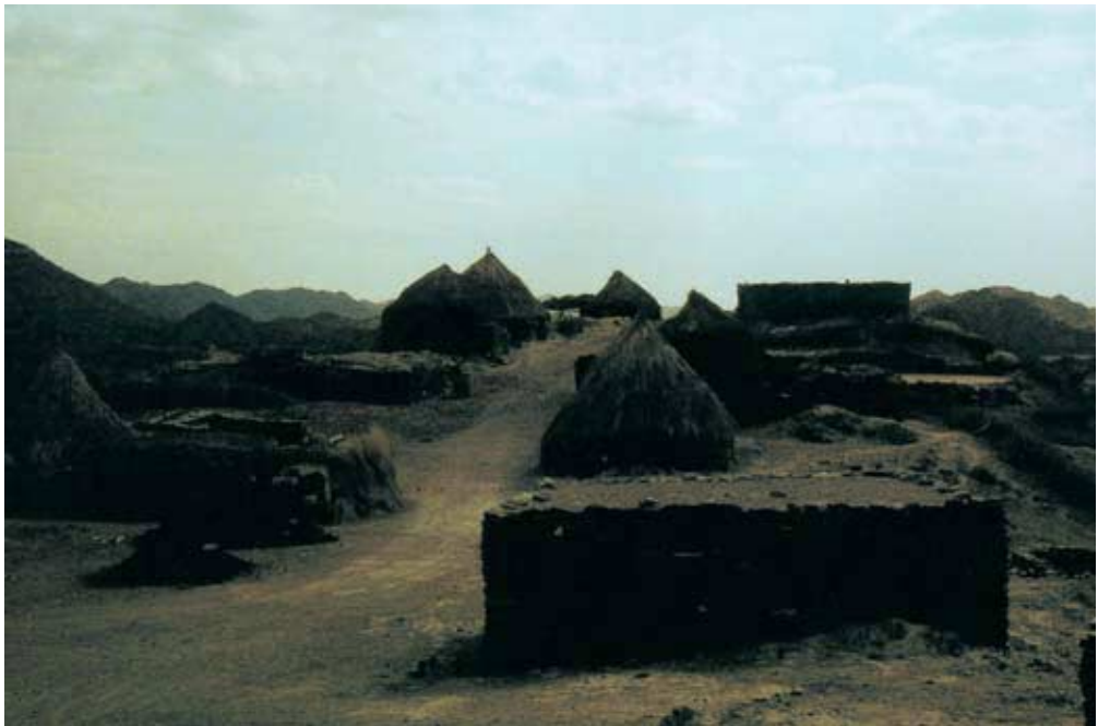
Abb. 50: Şurayhât, im Vordergrund das Steinhaus des Bürgermeisters