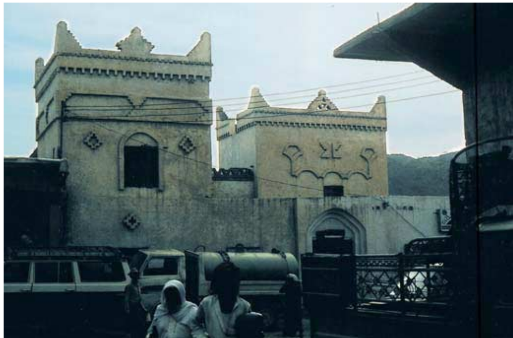
Abb. 39: „Küstenstil“ anhand des alten Verwaltungssitzes von al-Mandaq