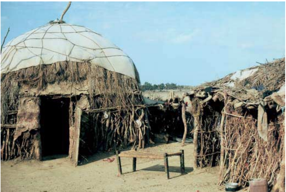
Abb. 46: Wohnhütte und Werkstatt (rechts) in al-Maghāribā