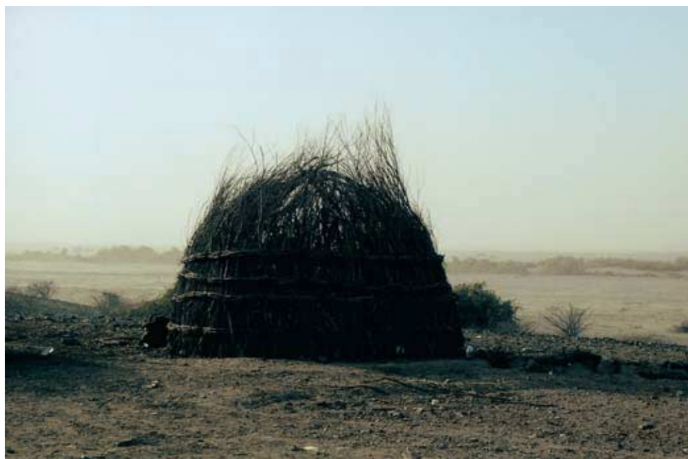
Abb. 48: Kuppelhütte der Al 'Abādila-Halbnomaden, während des Aufbaus