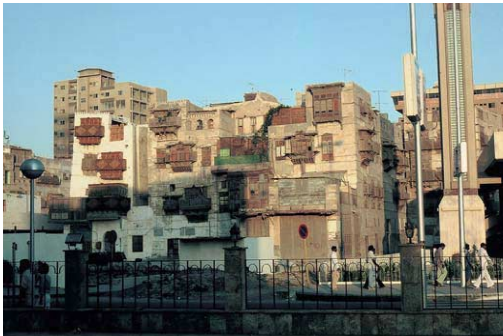
Abb. 35: Jidda: Ältere, 4- bis 5geschoßige Wohnhäuser mit mushrabiya