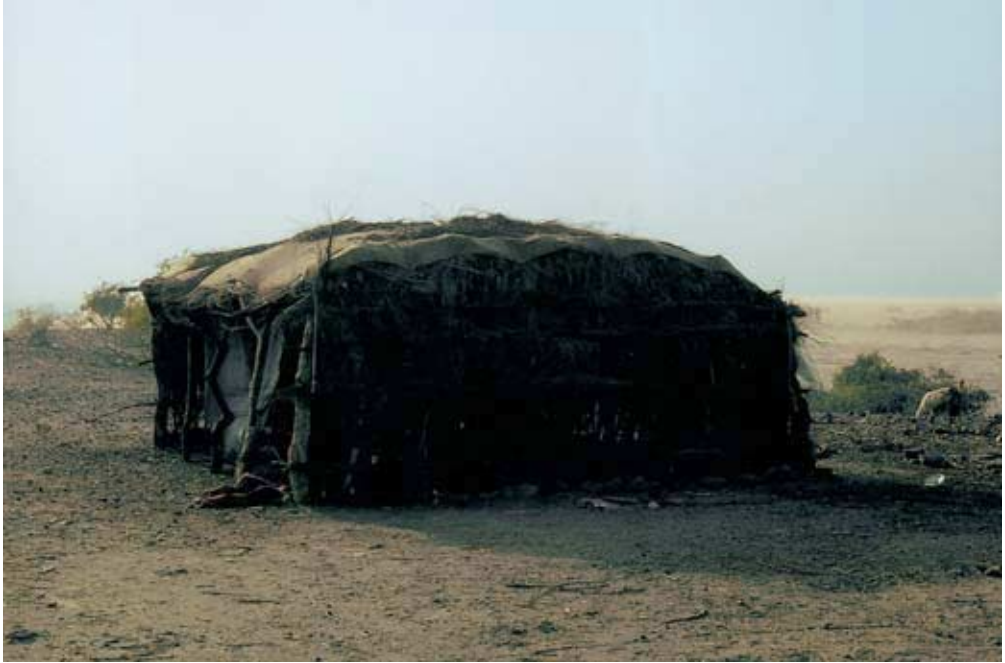
Abb. 41: Längshütte im Khabt bei al-Qunfudha (Wohnhaus)