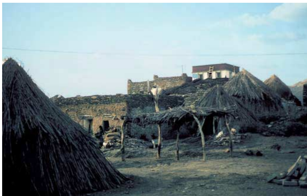
Abb. 40: ʿushsha mit rundem Grundriß und Marktstand in Khamis al-Qawz