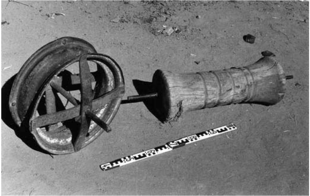
Abb. 25: Brunnenrad (Autorad) und Walze