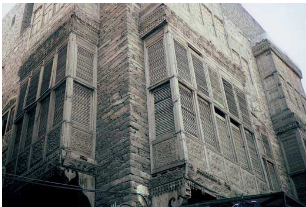
Abb. 36: al-Ta'if: Alte Wohnhäuser