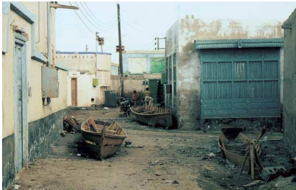
Abb. 31: Niedrige Wohnhäuser und Werkstätten im Südteil von al-Qunfudha