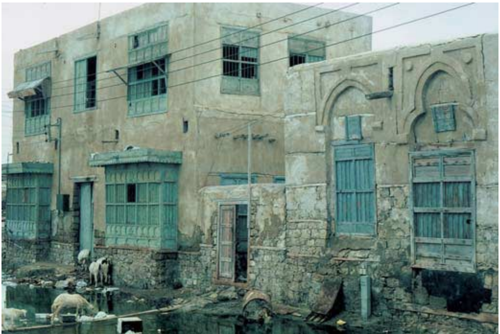
Abb. 30: Verlassenes Wohnhaus einer reichen Händlerfamilie im Norden von al-Qunfudha