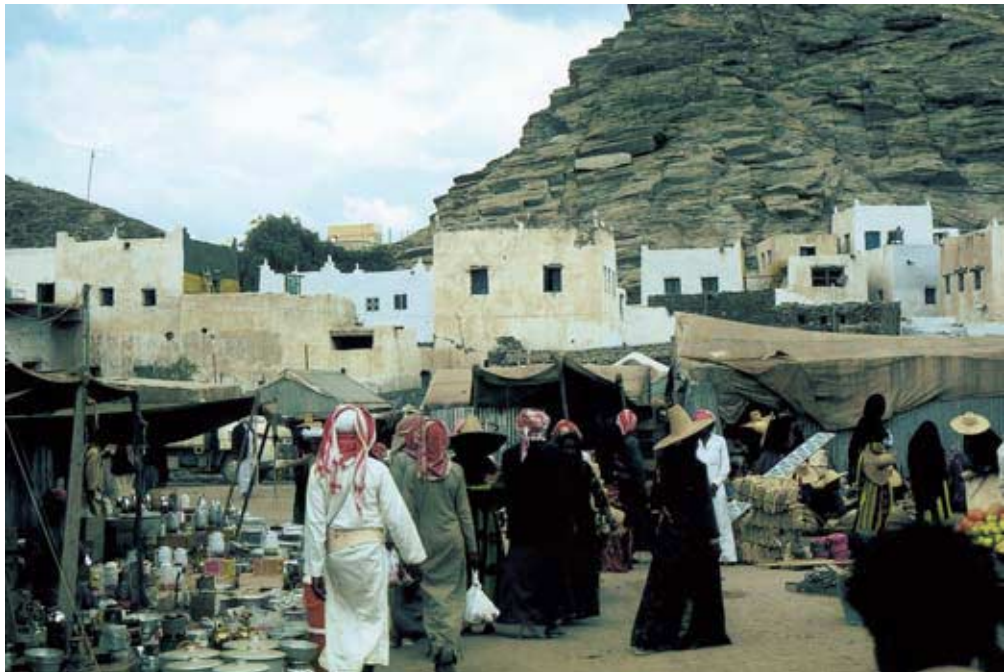
Abb. 38: „Küstenstil“ mit Lehmziegeln im Inneren der Küstenebene: Markt-, Amts- und Wohngebäude von Maḥāʿil