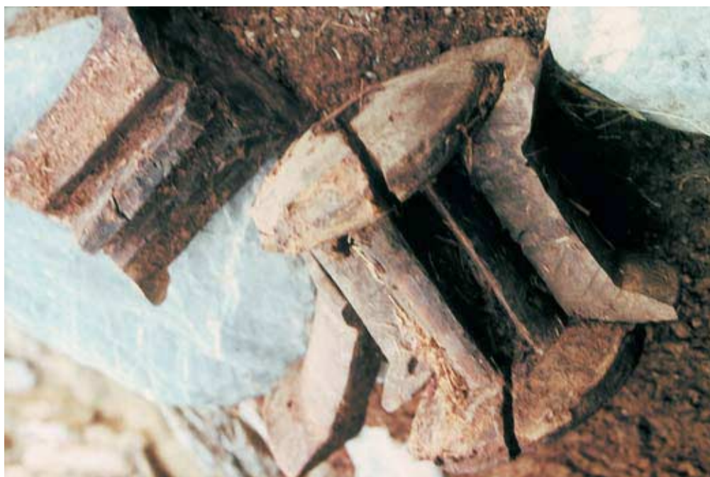
Abb. 24: Mahalla-Typus, Innenansicht