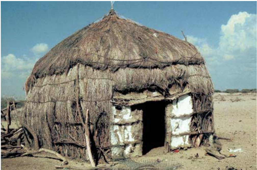
Abb. 42: ʿushsha mit quadratischem Grundriß und getünchter Türseite bei Khamis al-Baḥr (Geschäft)