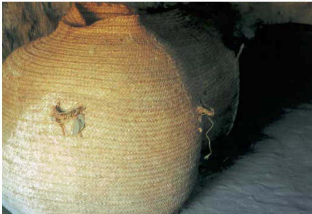
Abb. 27: Gefüllte Vorratskörbe