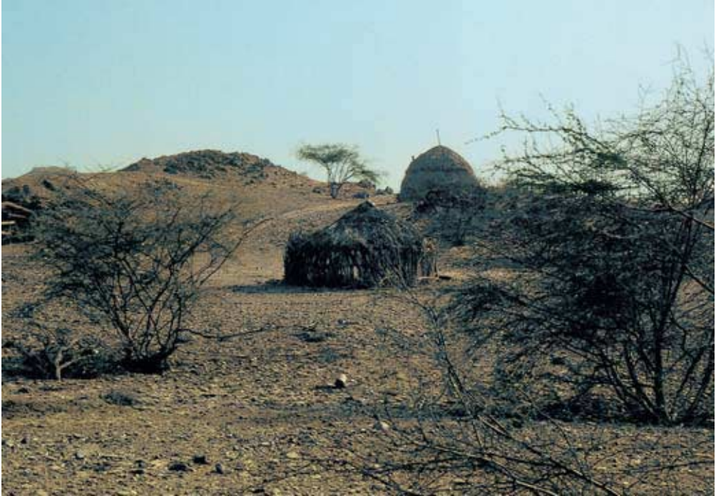
Abb. 45: Runde Einzelhütte bei al-Fāṭīsh