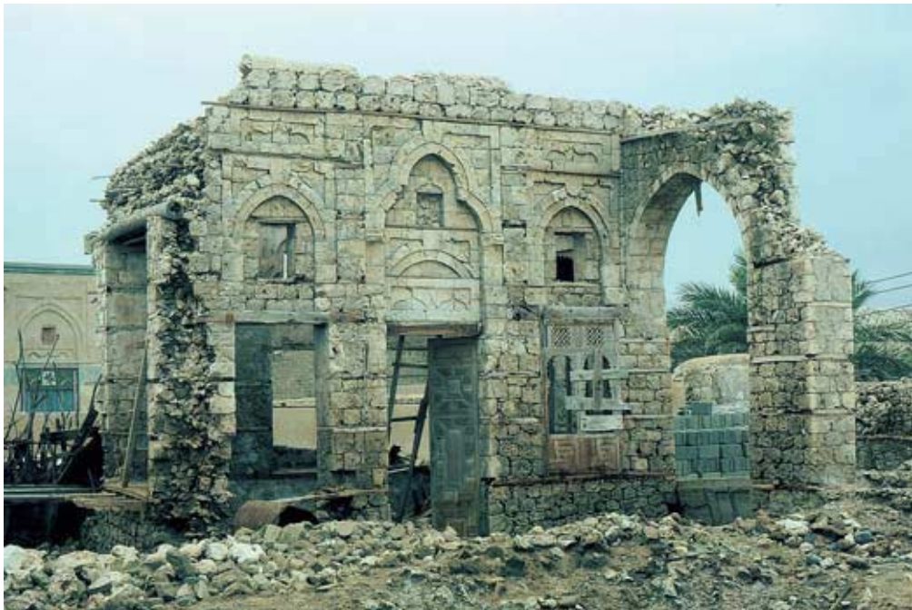
Abb. 34: Zerstörter Palast in al-Qunfudha mit „echtem Bogen“