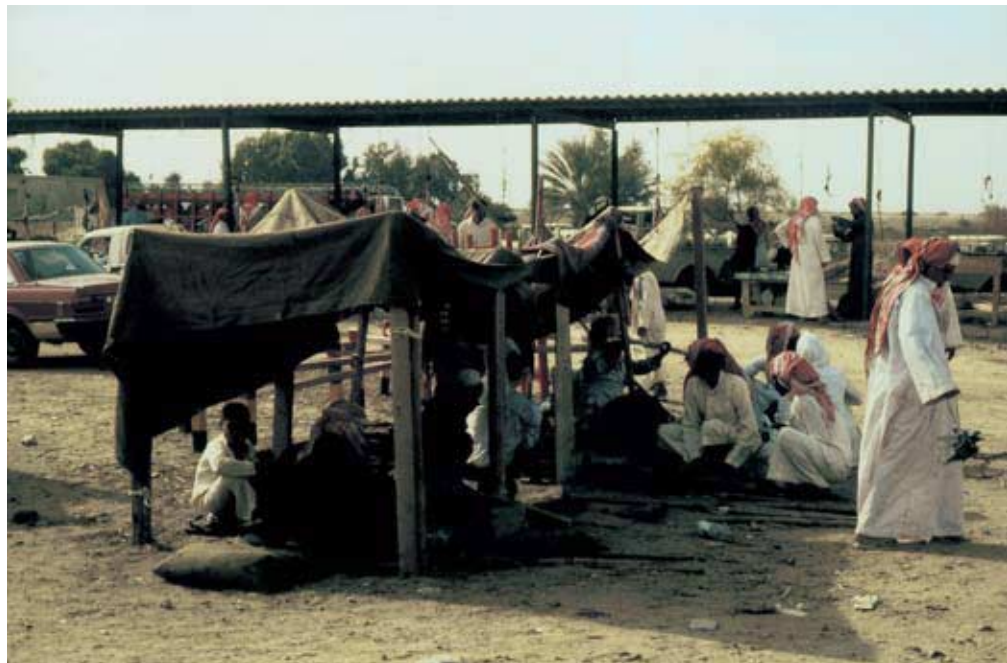
Abb. 43: Marktschirme in Khamis al-Qawz