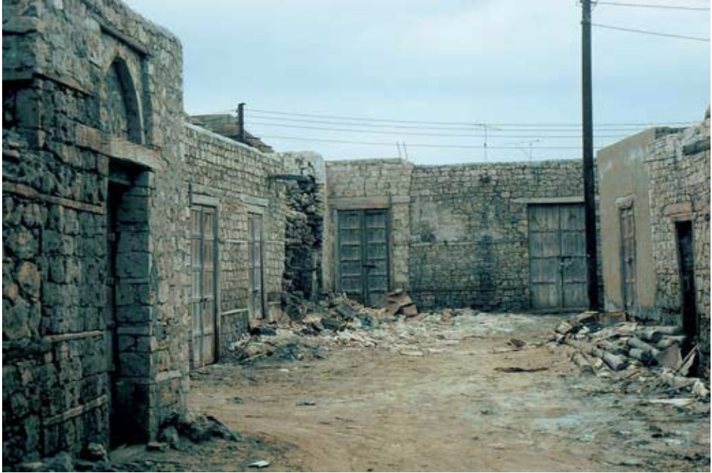
Abb. 29: Altes Marktareal von al-Qunfudha