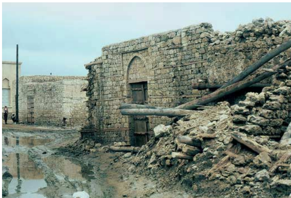
Abb. 32: Von Überschwemmungen größtenteils zerstörtes Lagerhaus beim Markt von al-Qunfudha