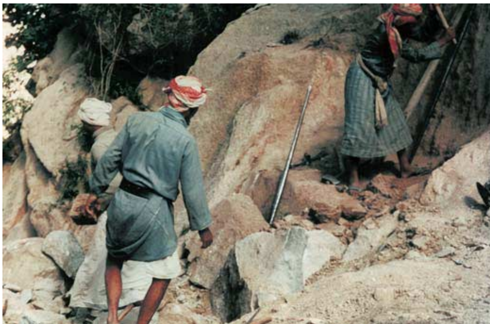
Abb. 28: Bauern beim Steinbrechen für Feldmauer