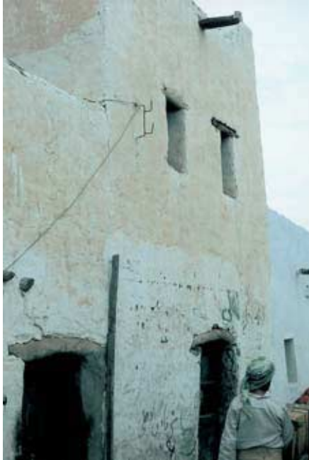
Abb. 37: „Küstenstil“ mit Ziegelbauten: Makhwāʿ, Verwaltungsgebäude