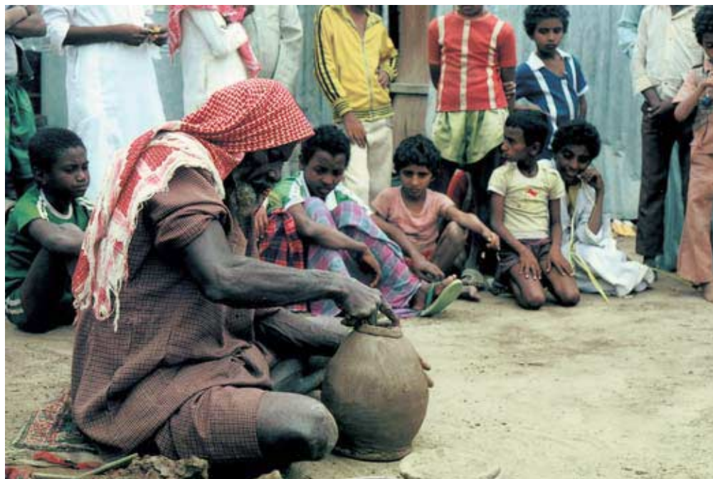
Abb. 47: Töpfer in al-Maghariba