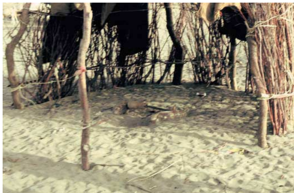
Abb. 44: Gebetsplatz im W. Ahsiba