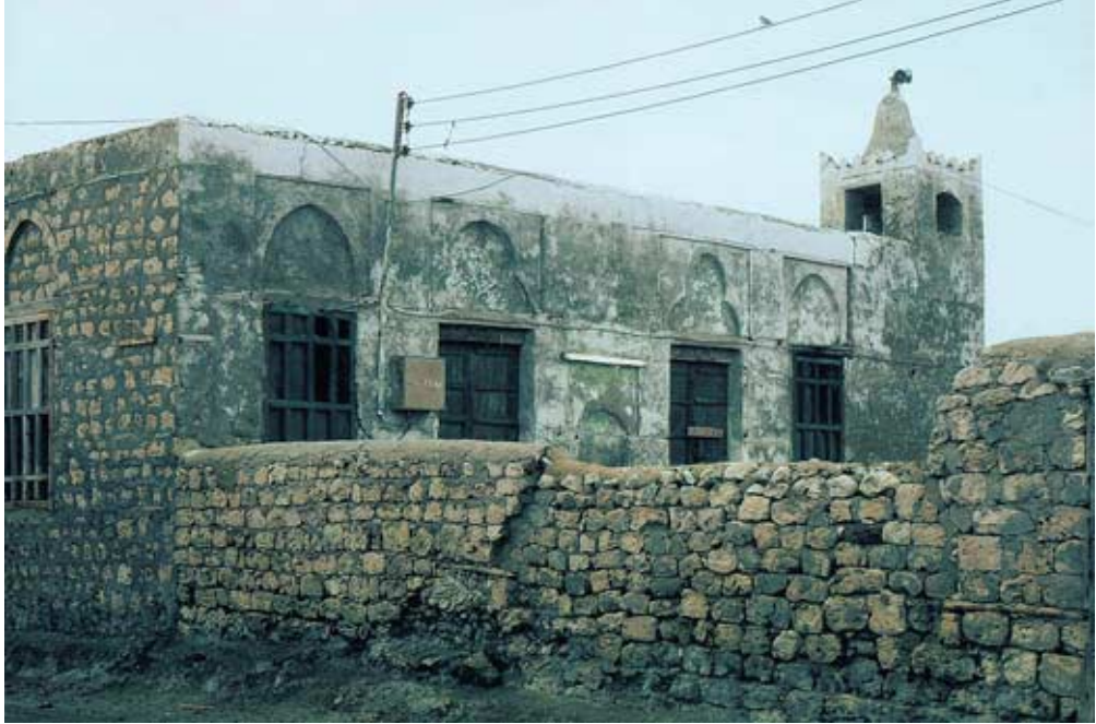
Abb. 33: Alte Moschee von al-Qunfudha