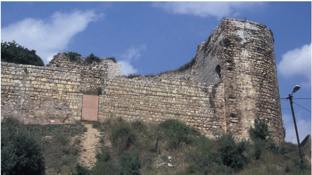
211 Nikētiatou Phrurion, äußerer Mauerring, Südostecke