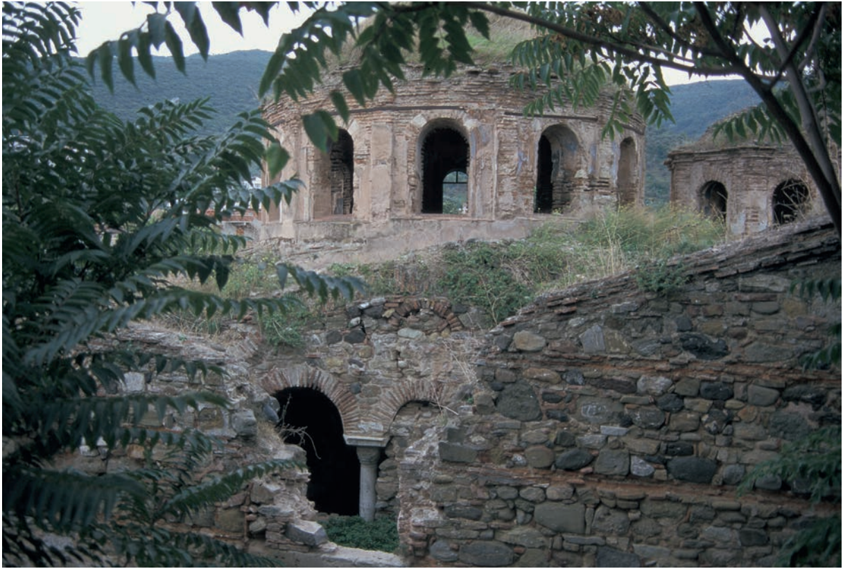
292 Sykē, Michaelskirche, Zentralraum mit Hauptkuppel von Norden