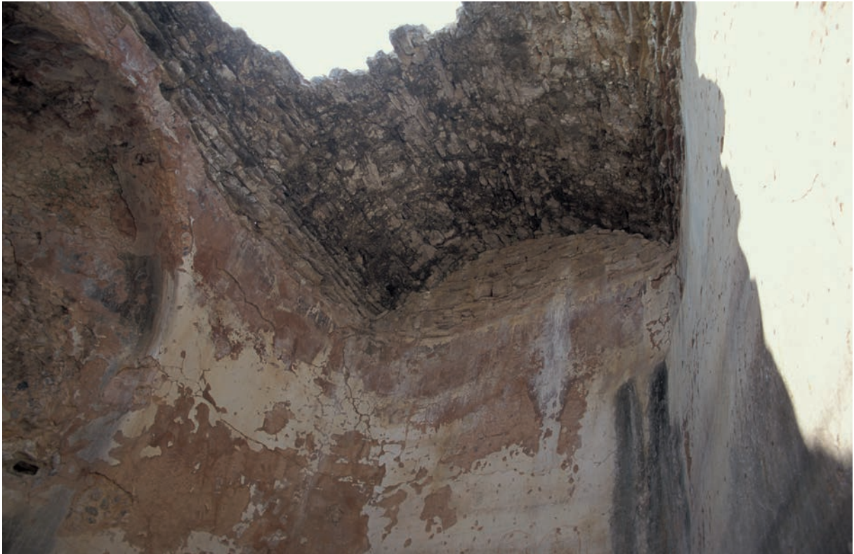
135 Kremastē, überwölbte Zisterne