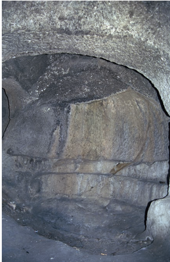
242 Persi Köyü, Kapelle, Apsis mit Synthronon