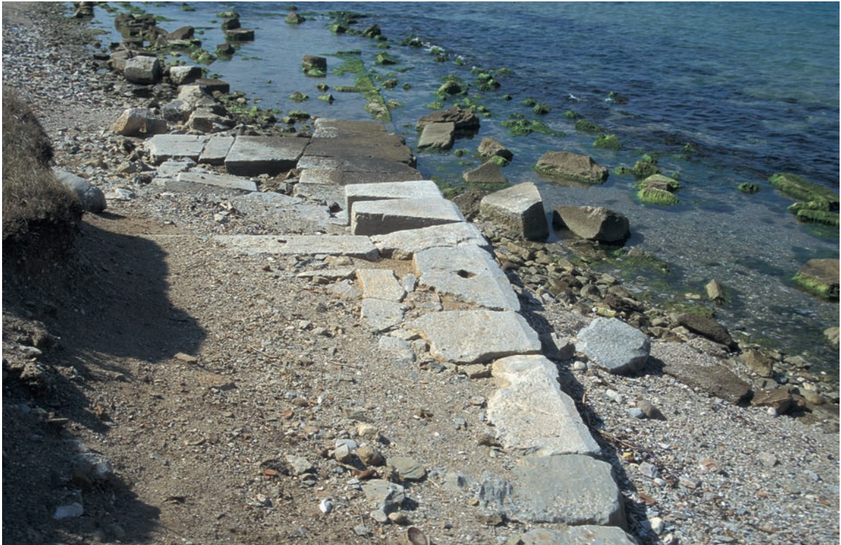
228 Parion, Kaimauern am Nordhafen