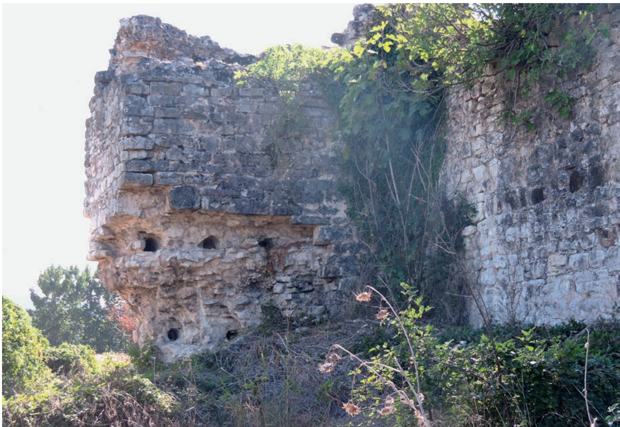
87 Harmantepe Kalesi, Kurtine und Turm (Balkenlöcher)