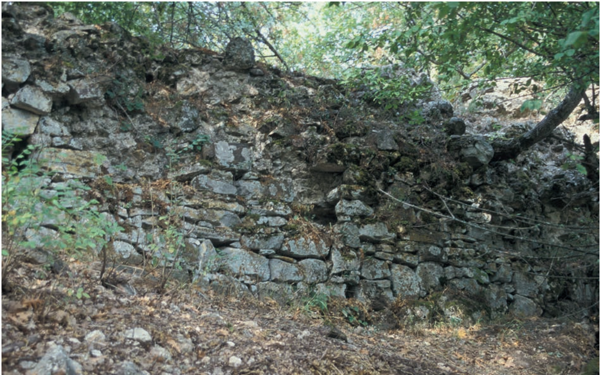
275 Sapan Kalesi, Kurtine