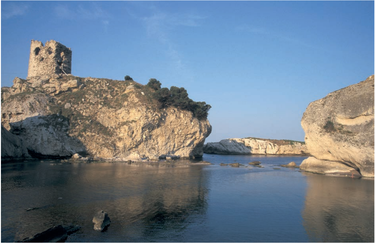
64 Chēlē (2), Ocaklı Ada mit osman. Turm und möglichen Resten einer alten Mole (2000)