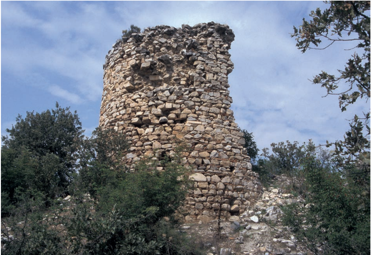
25 Ağaçhisar, Turm der Burg