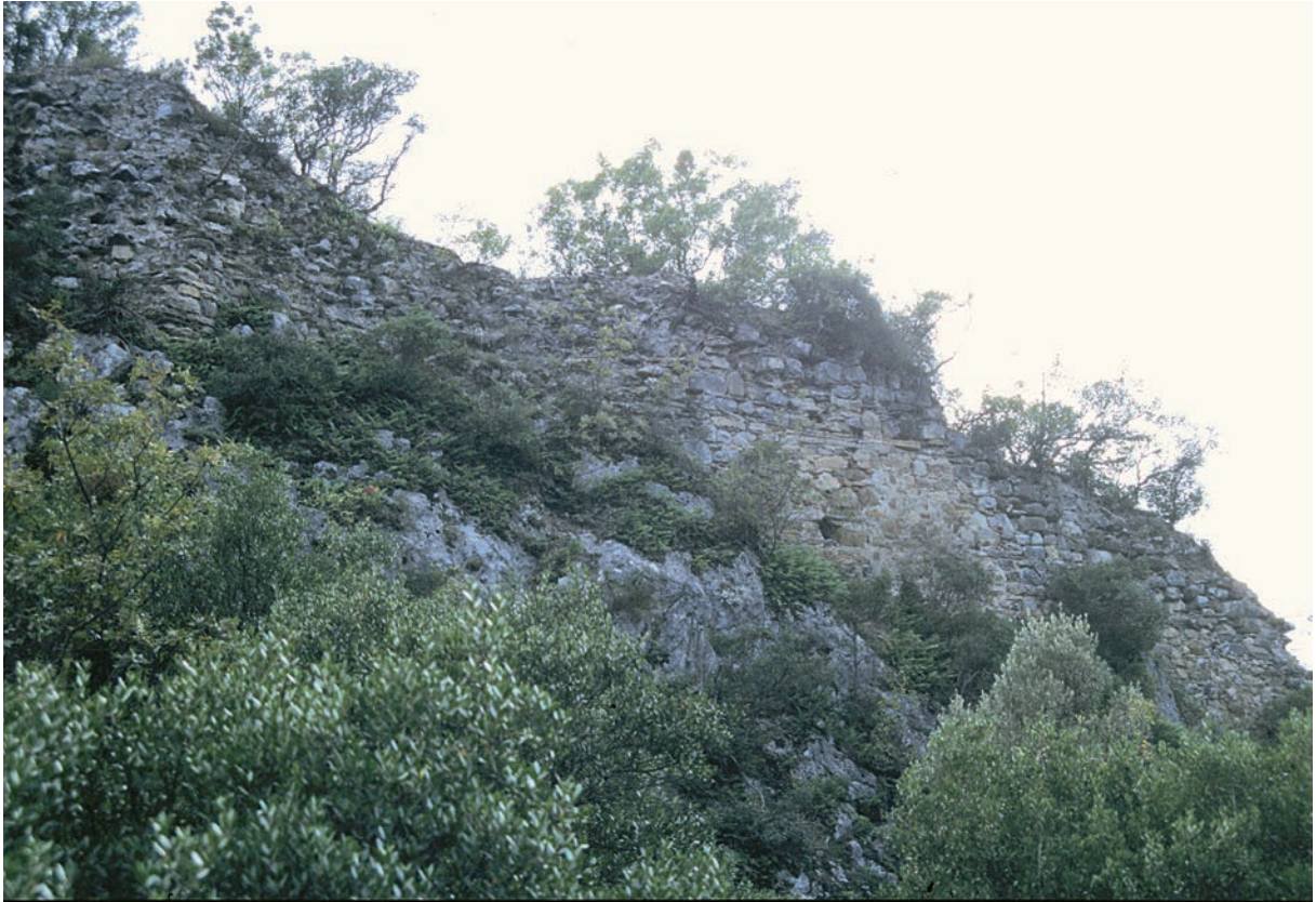
218 Osmaniye, Burgmauer