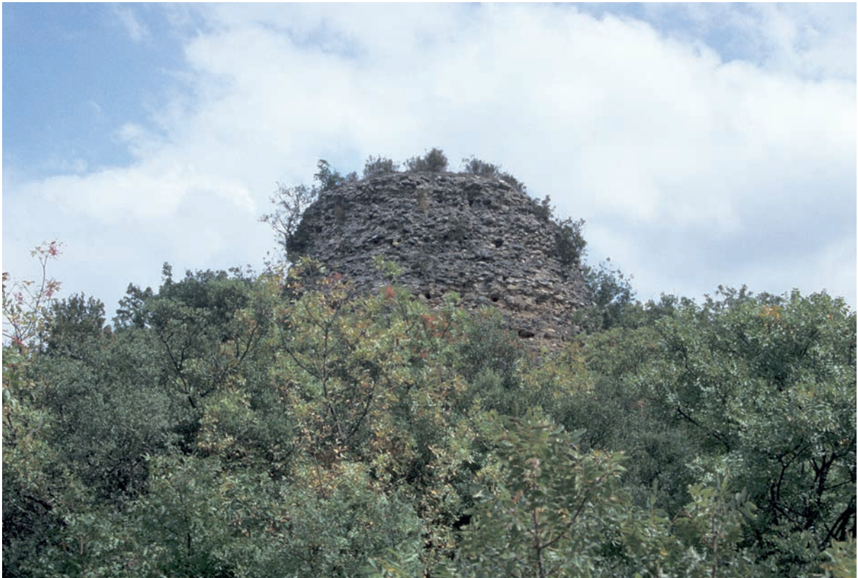
118 Kestelek, Turm der Burg