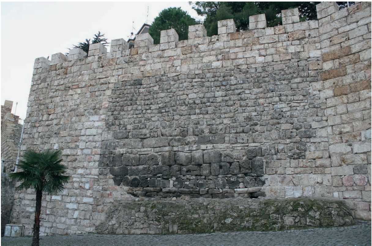
255 Prusa, dasselbe Stück der byz. Stadtmauer nach weitgehendem Wiederaufbau (2009)