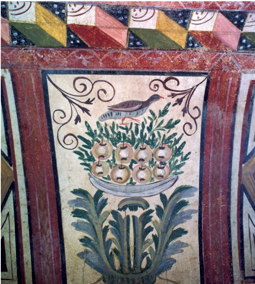
207 Nikaia, frühchristl. Hypogäum, Rebhuhn vor den Beschädigungen