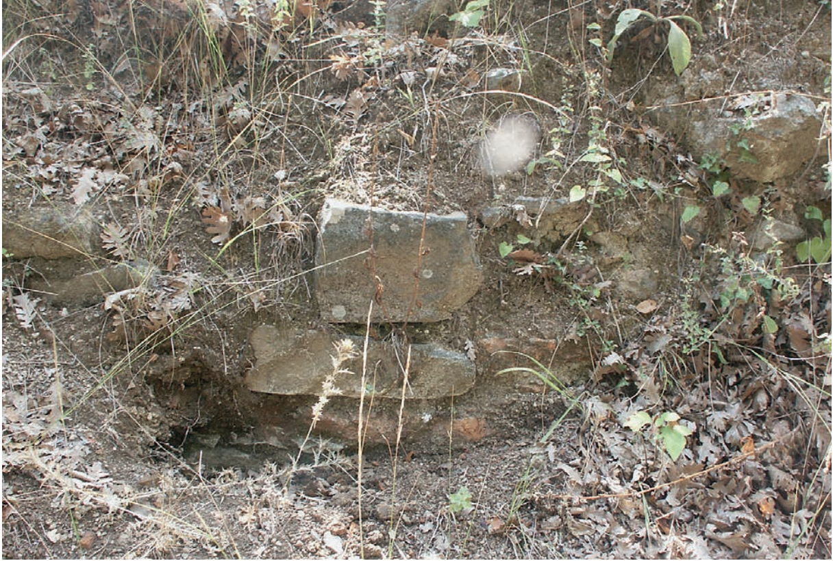
58 Çataltepe, Mauerreste der Kirche