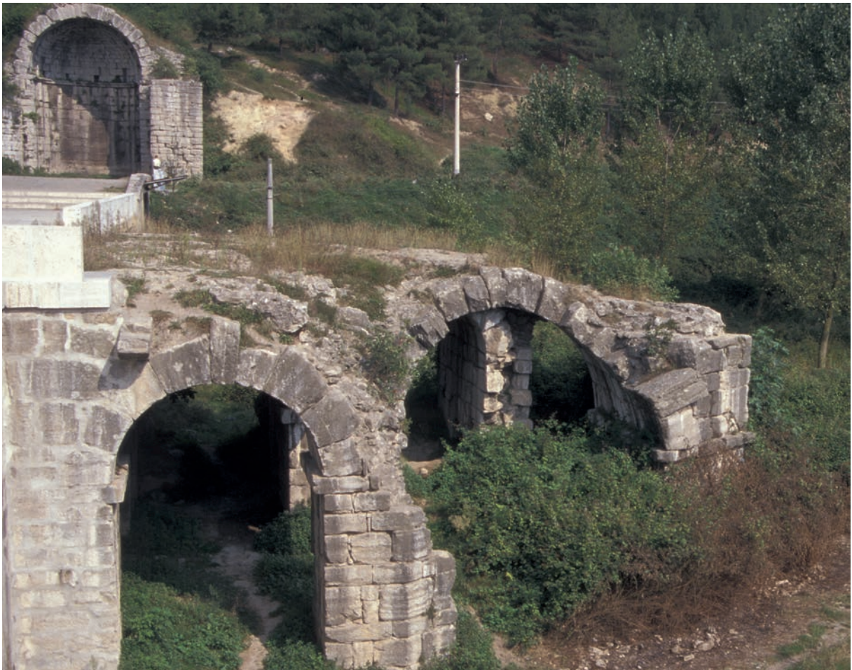
239 Pentegephyra, Anbau im Süden, im Hintergrund das apsidiale Gebäude