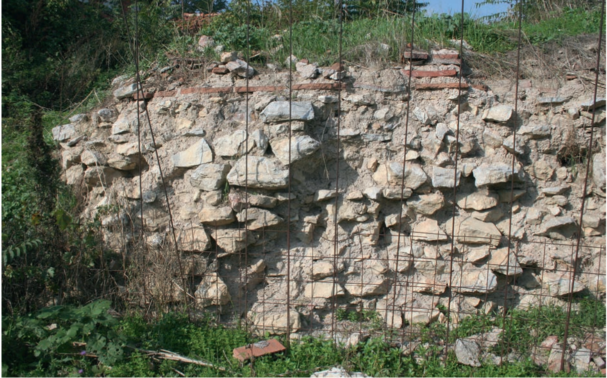
190 Neokaisareia, byz. Bau (Befestigung?) mit antiken Quadern