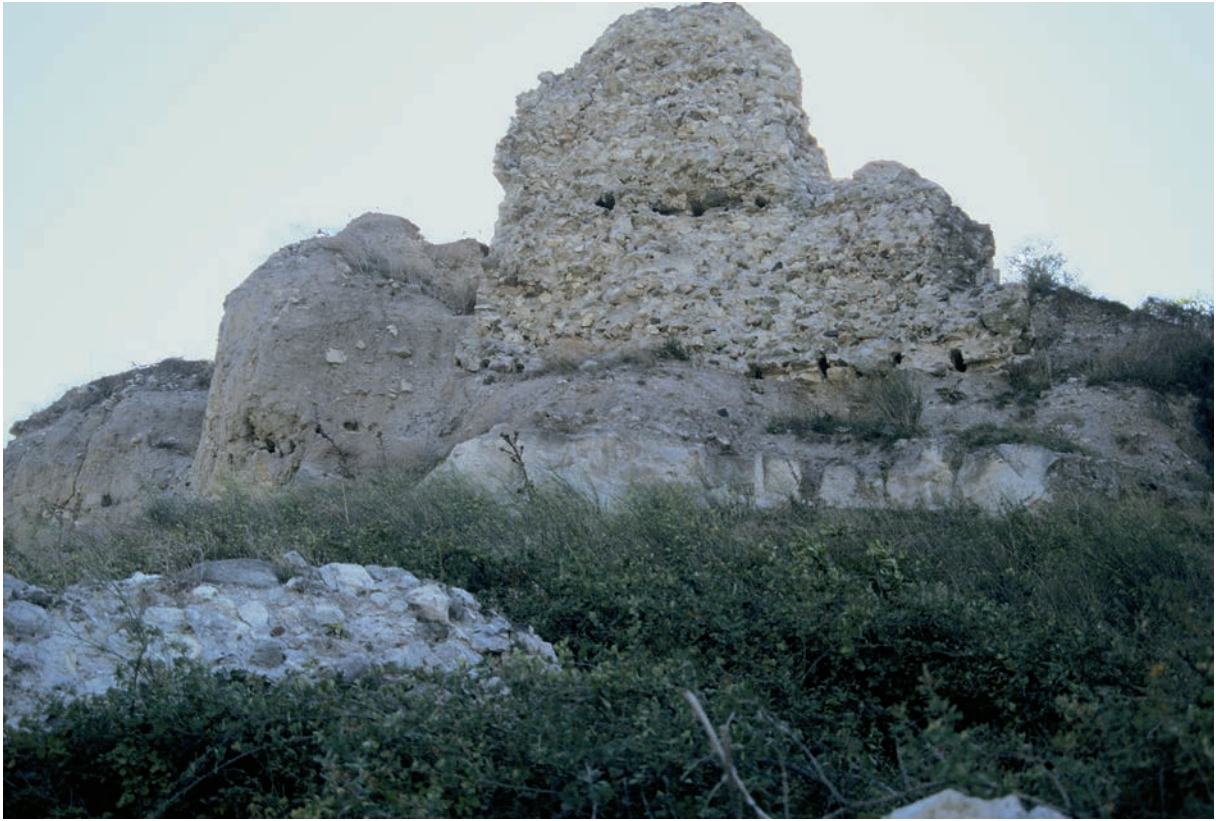
290 Sultançayır, Burg, Gußkern des Mauerwerks