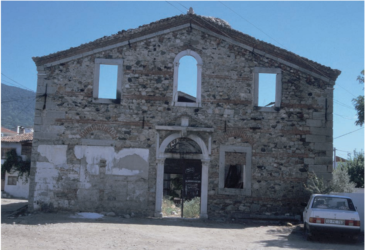
269 Rodia, neuzeitliche Kirche von Westen