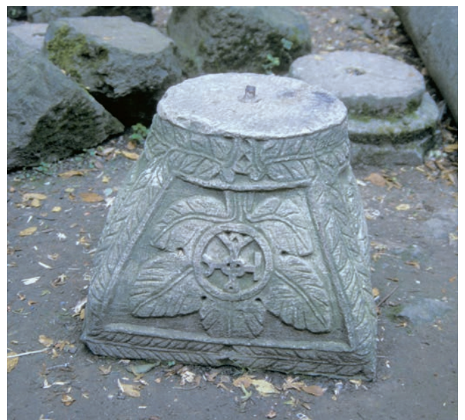
260 Pythia, Exedra, Korbkapitell mit Monogramm der Kaiserin Sophia