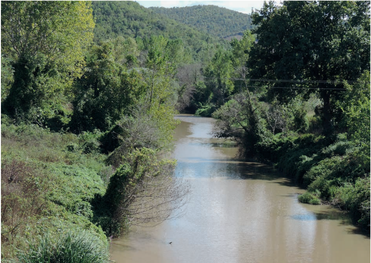
264 Rēbas (1), Mittellauf