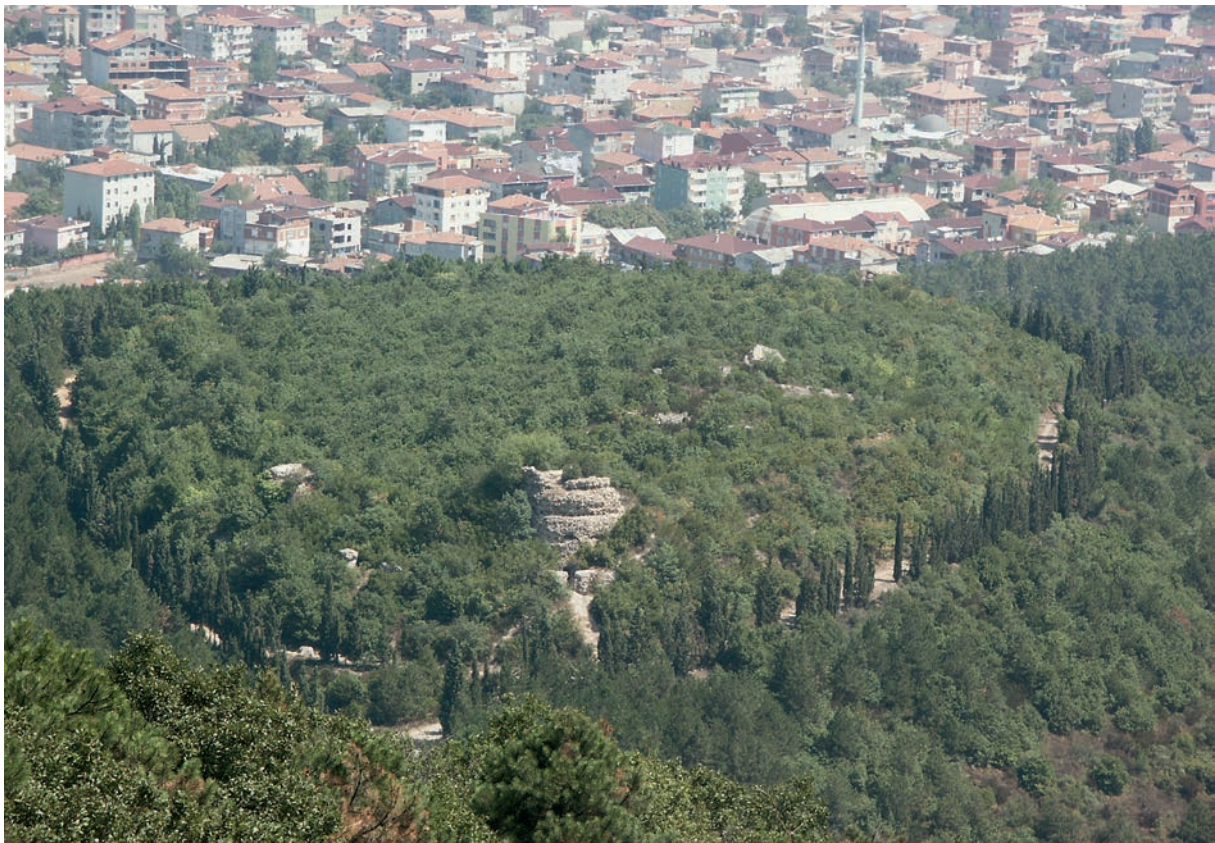
22 Aetos (Aydos Dağı), Blick von oben auf die Burg