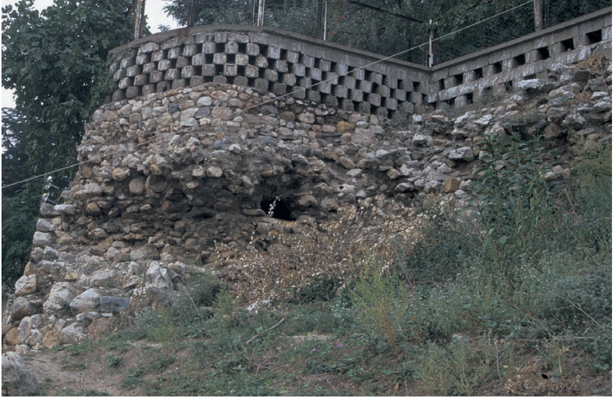
117 Kestel, Burg