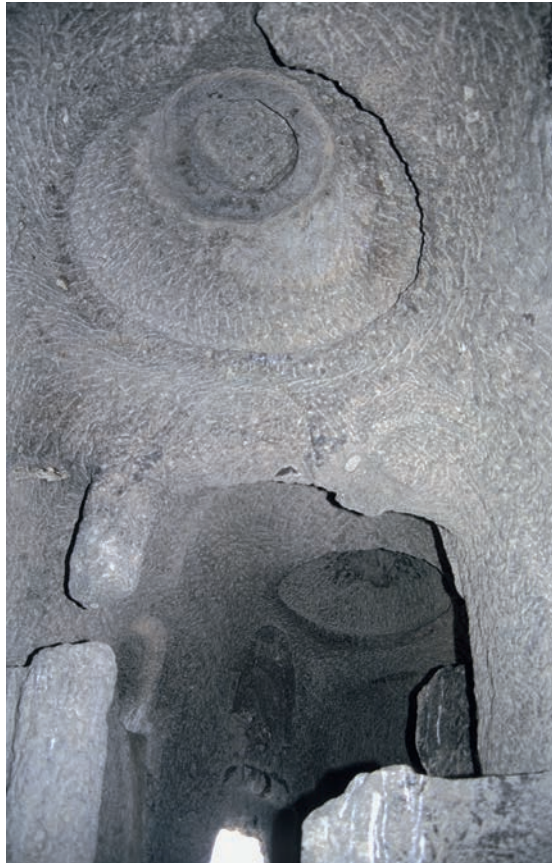
243 Persi Köyü, Kapelle, Kuppeln über Haupt- und Altarraum