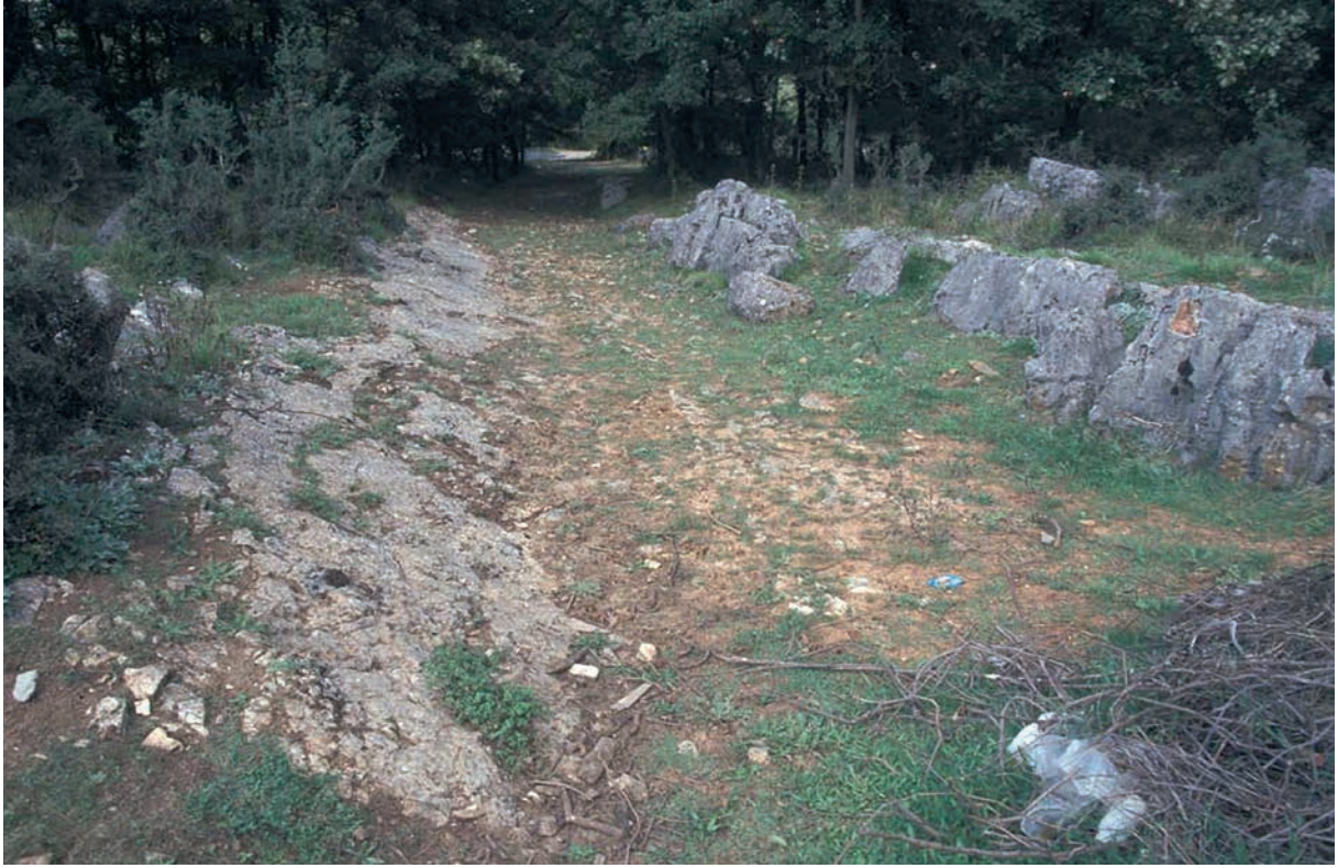
15 Alte Straße bei Yazımanayır