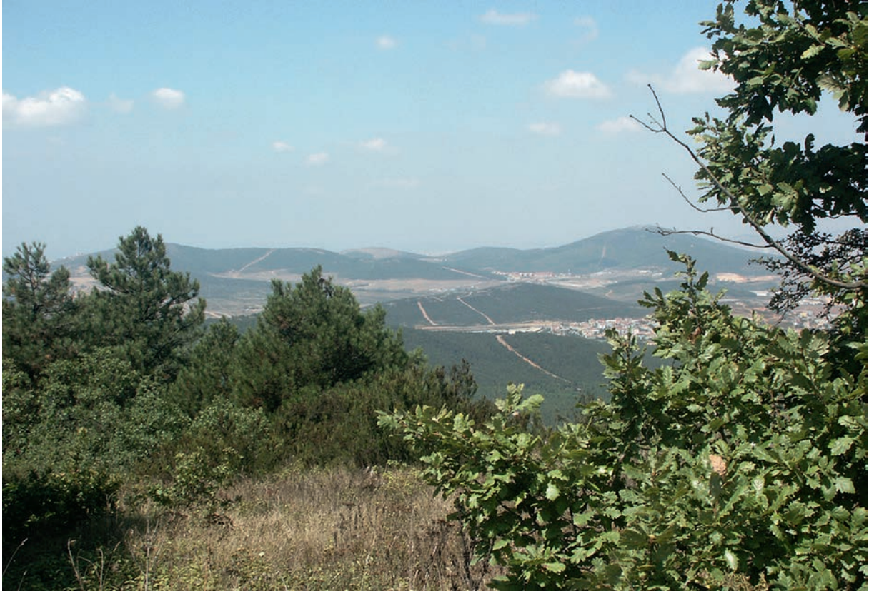
1 Hügelland der Bithynischen Halbinsel: Blick vom Aydos Dağı