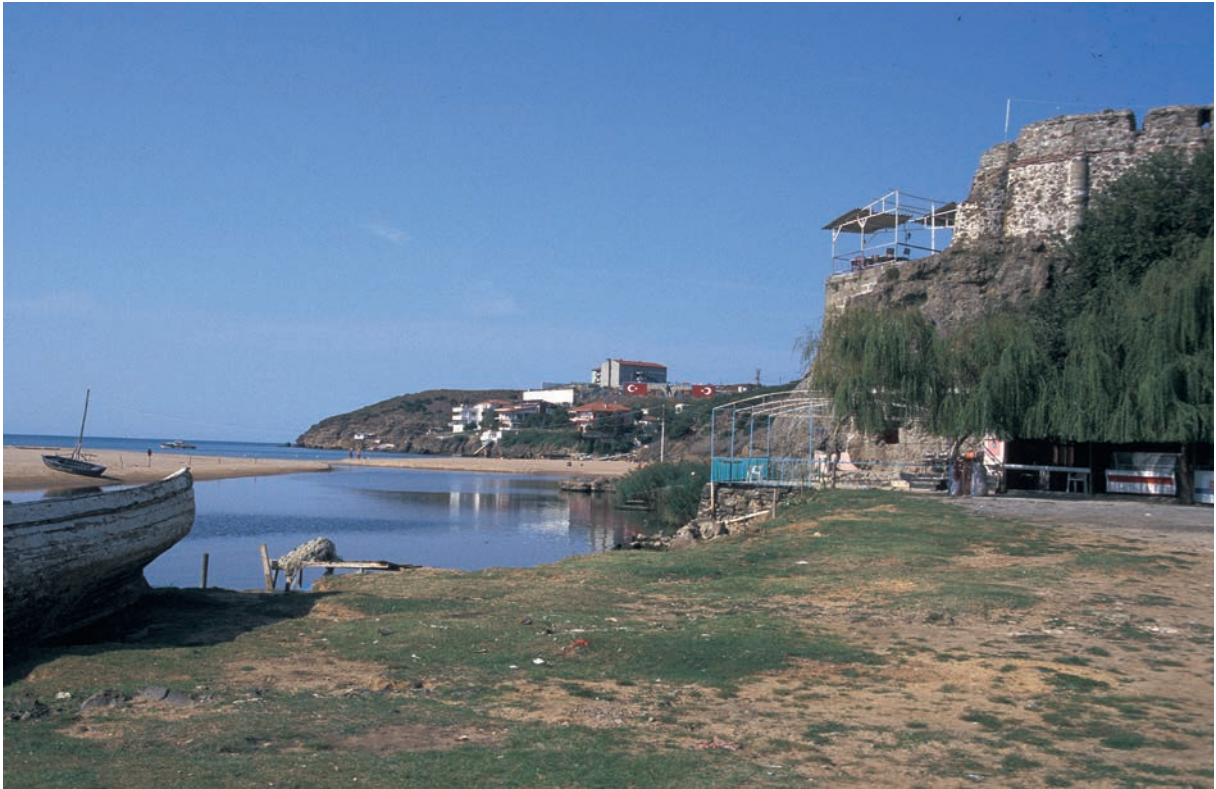
261 Rēbas (1), Mündung des Flusses (2000)