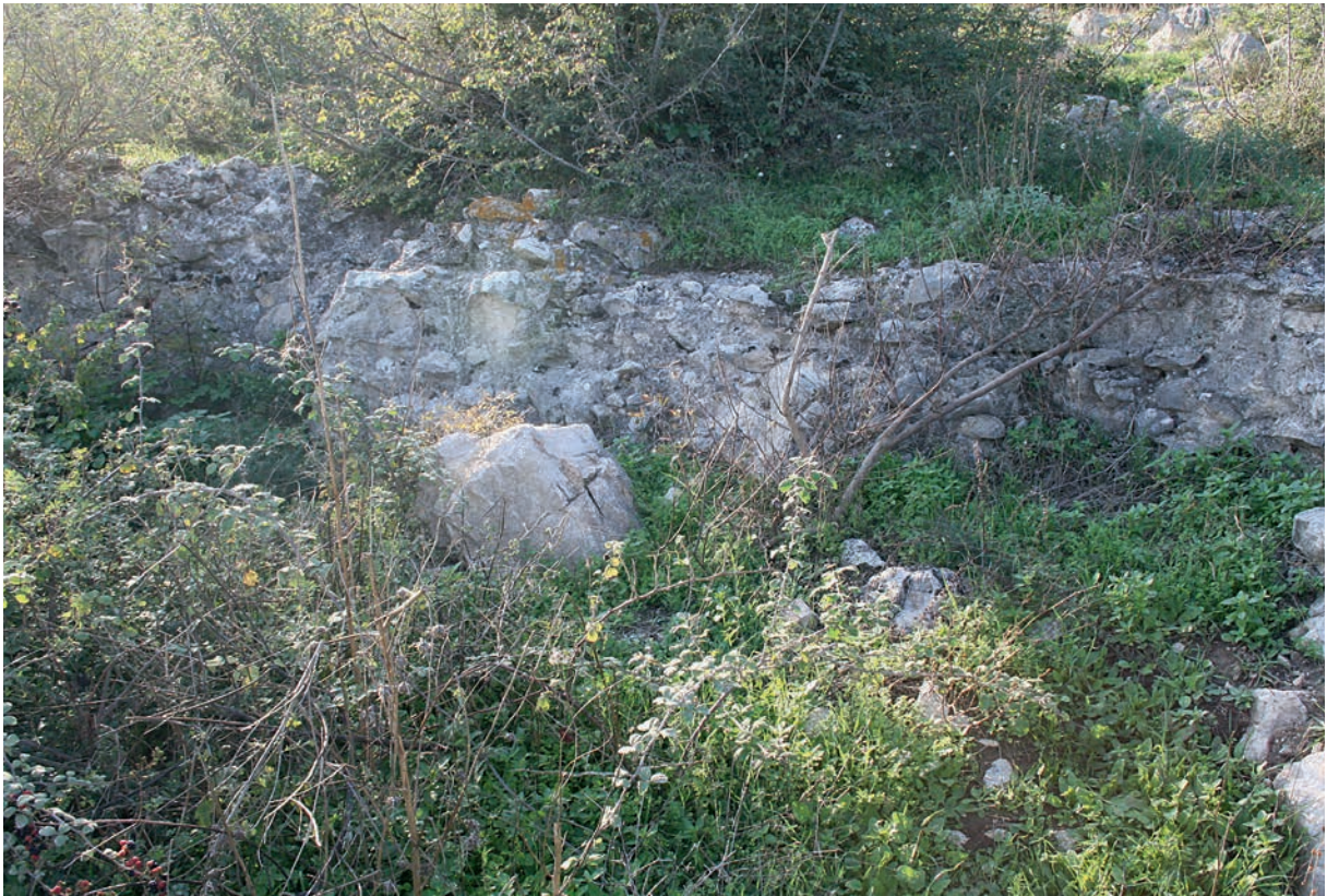
110 Karaođlan, byz. Ummauerung