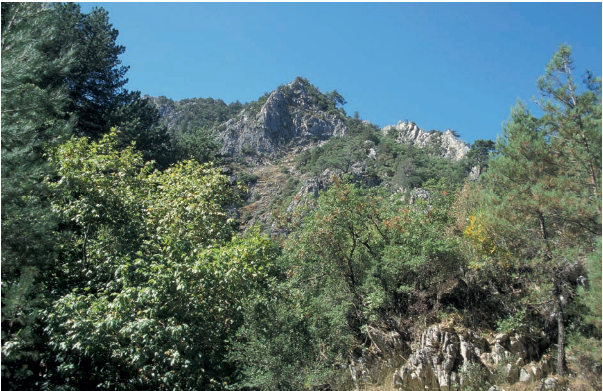
4 Idē, Gipfelregion