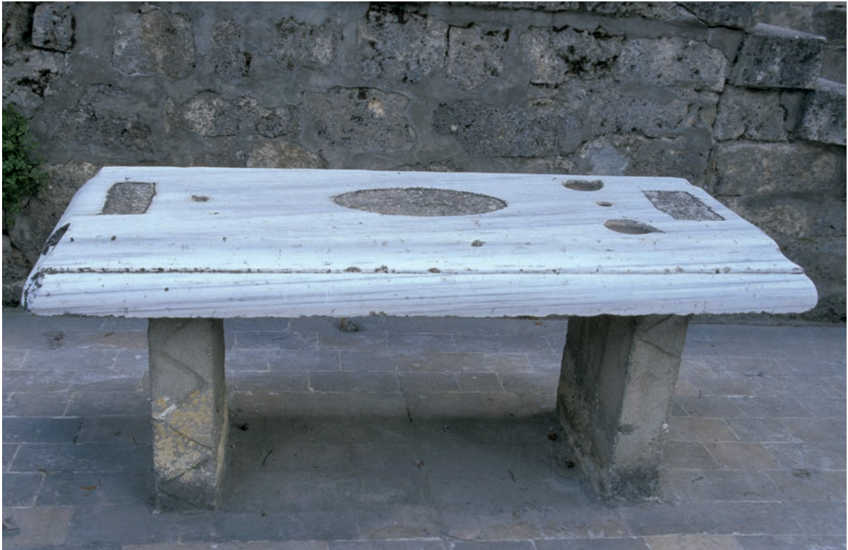
79 Göynük, profilierte Marmorplatte, in Zweitverwendung als Aufbahrungstisch („musalla taş“)