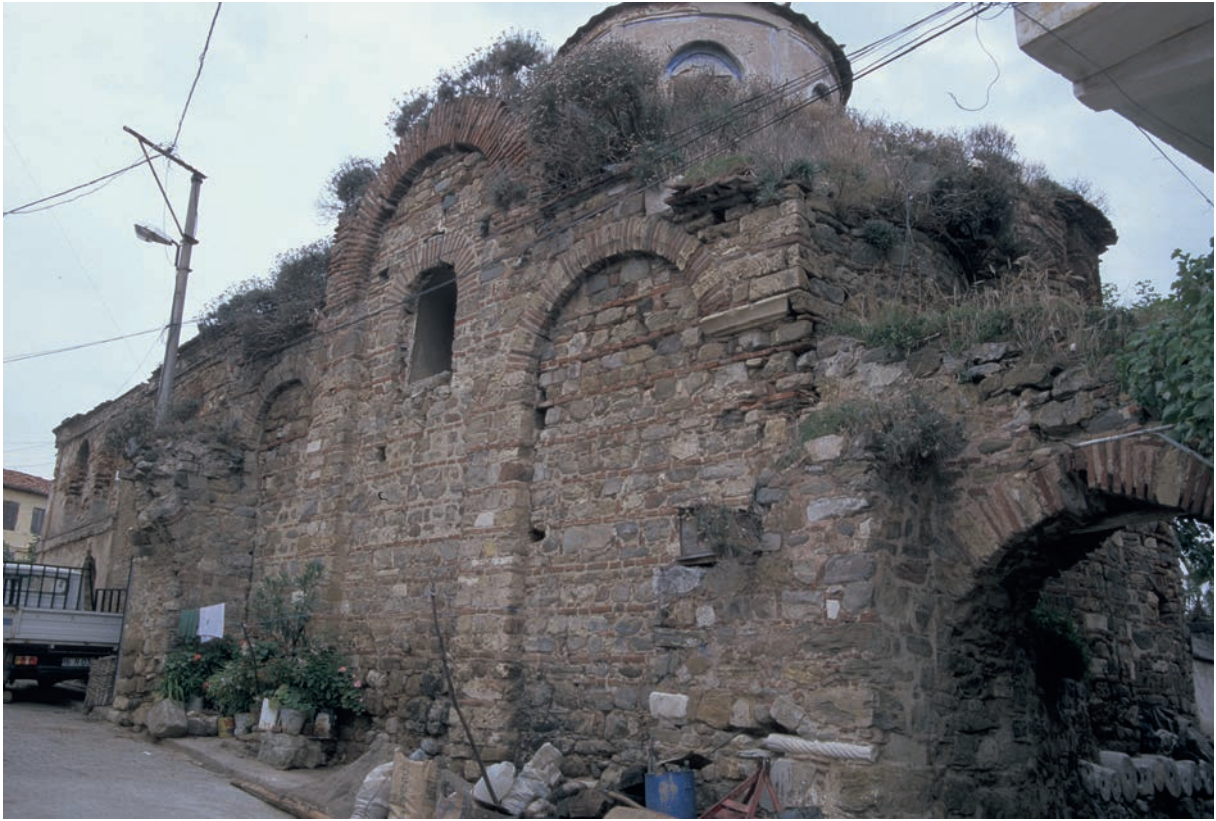
316 Trigleia, Panagia-Pantobasilissa-Kirche von Südosten