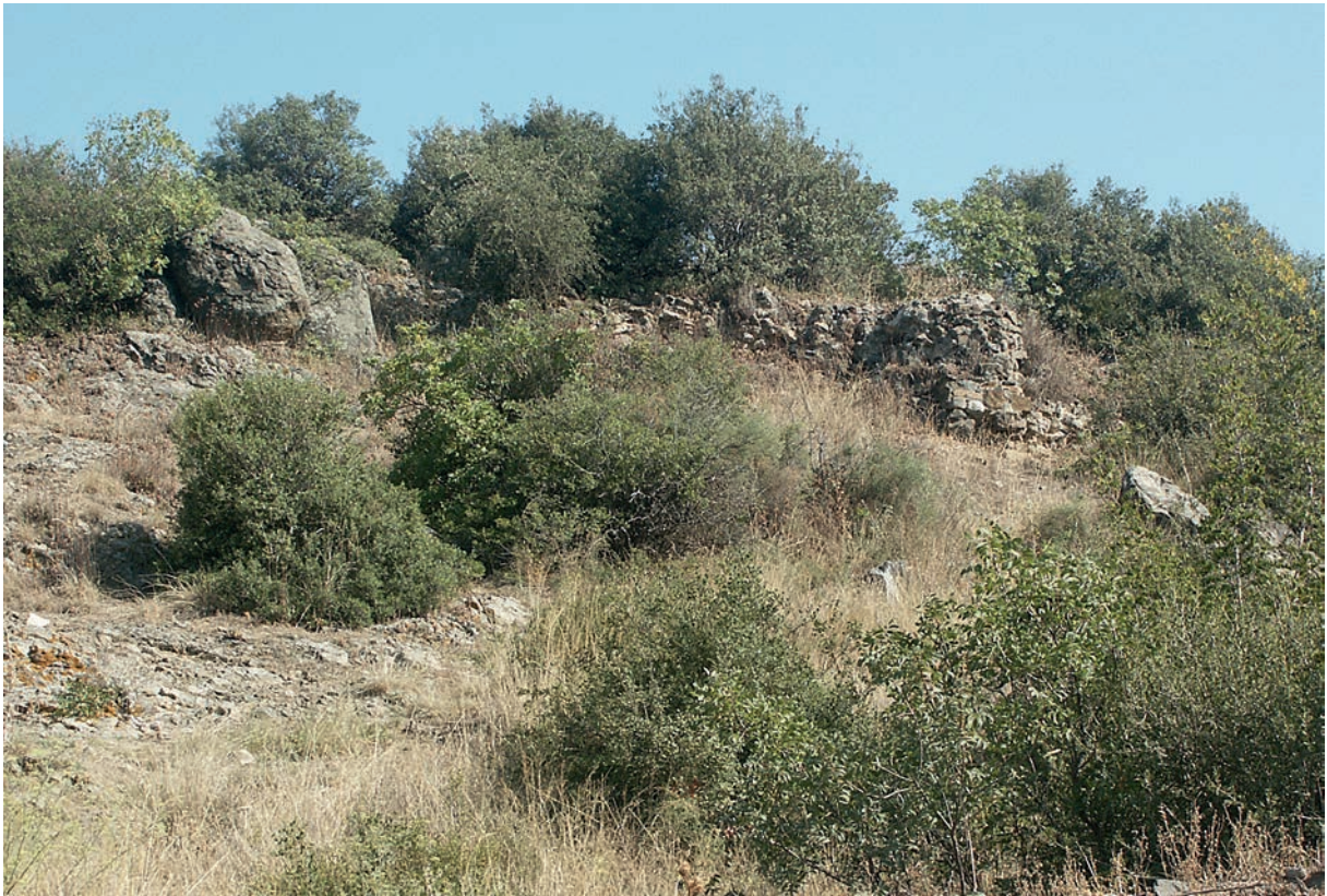
108 Karacakaya (Lokus?), byz. Befestigung