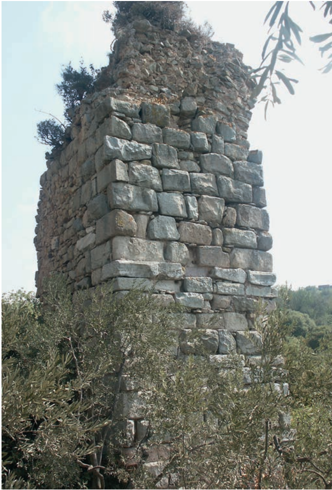
139 Kyzikos, Amphitheater