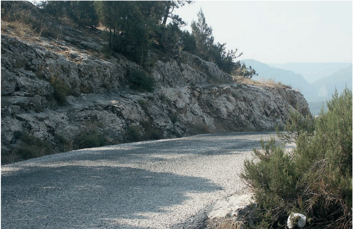
11 In den Fels geschlagene Reste der Pilgerstraße zwischen Nikaia und Leukai