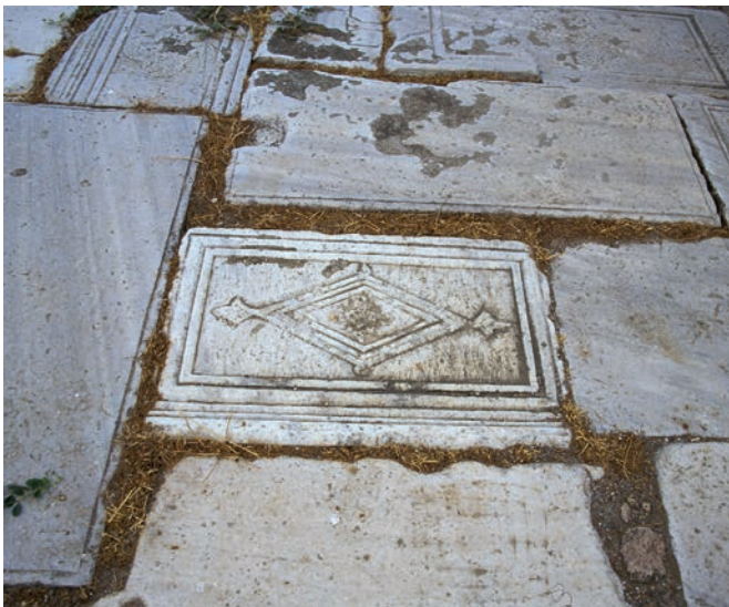
310 Tragasai, Spolien an der Murat Hüdävendigâr Camii