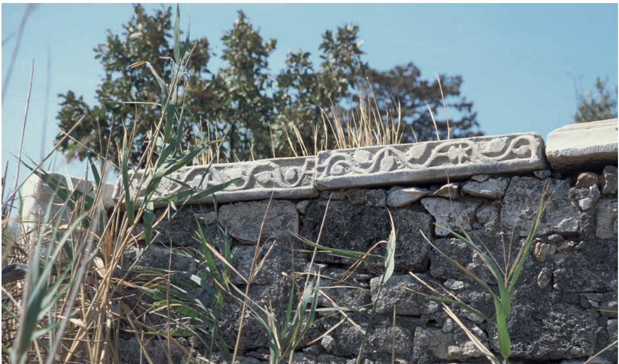
129 Kösedere, Spolien auf der Friedhofsmauer