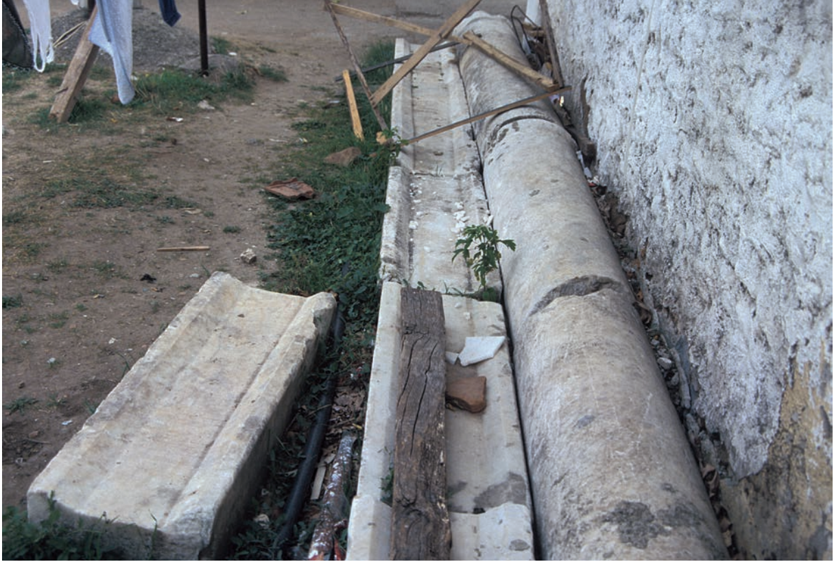
103 Ilca (1), Spolien