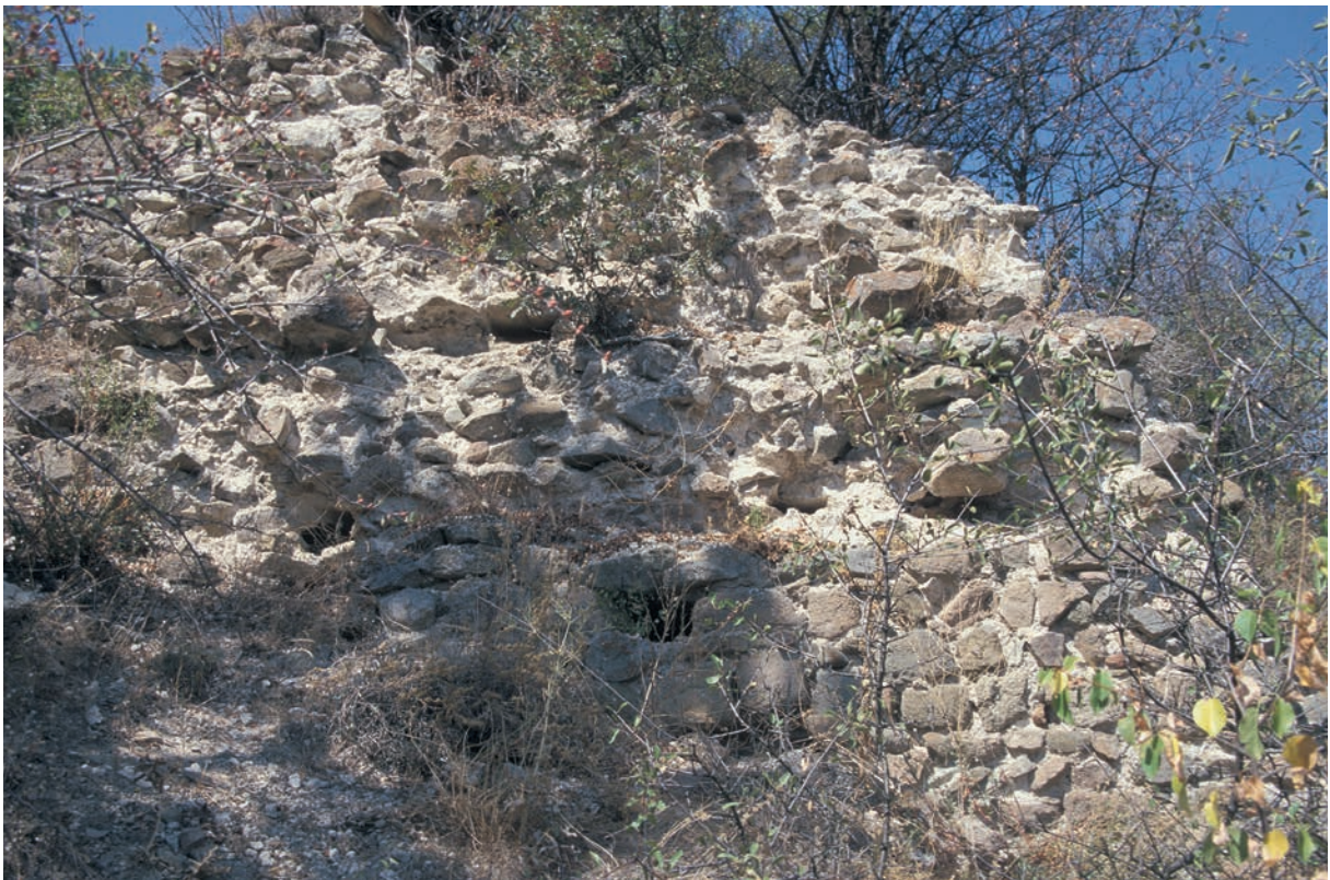
176 Modrēnē, Burg, osman. Mauer