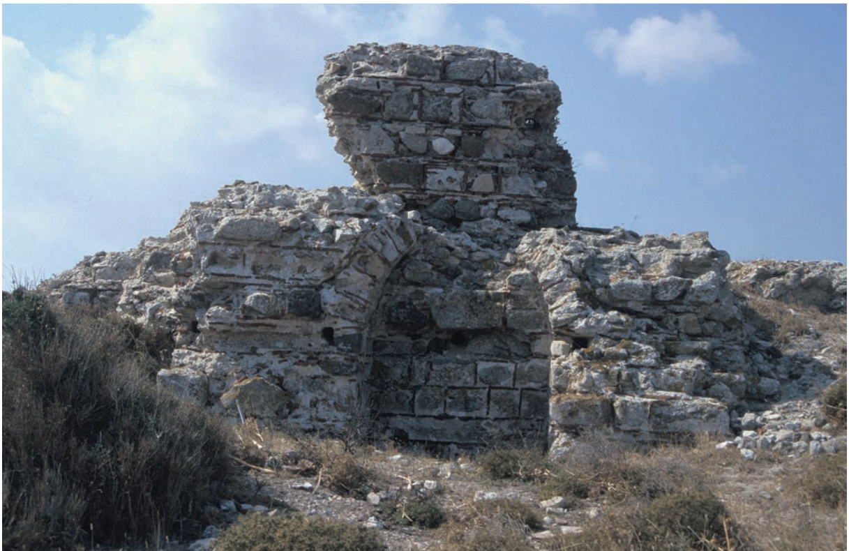
235 Pēgai, Zitadelle