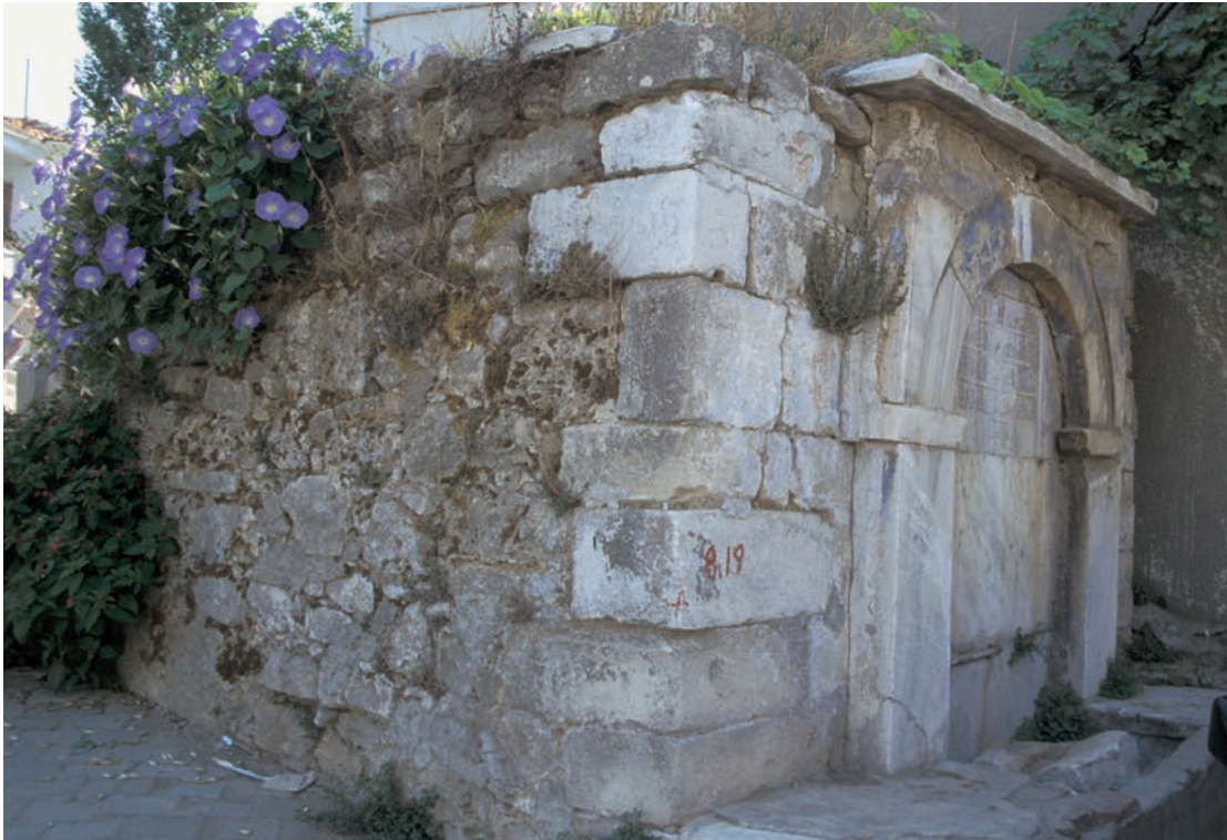
144 Lampsakos, Brunnen mit Spolienquadern und einem Stück byz. (?) Mauerwerk