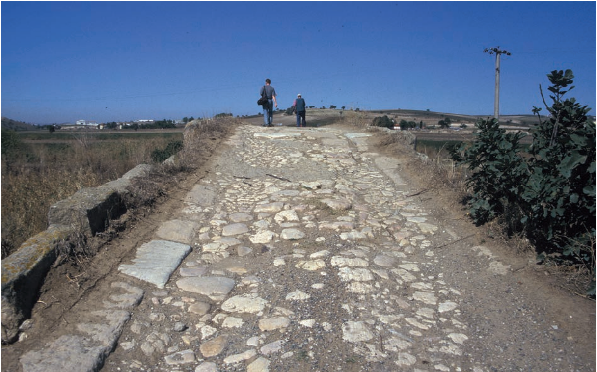
308 Tolypē, alte Brücke, Pflasterung