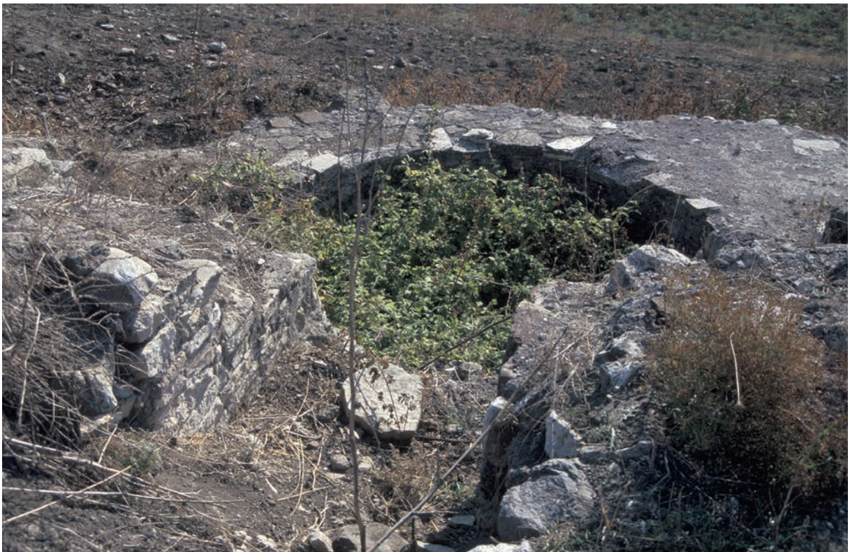
74 Daskyleion (2), byz. Befestigung