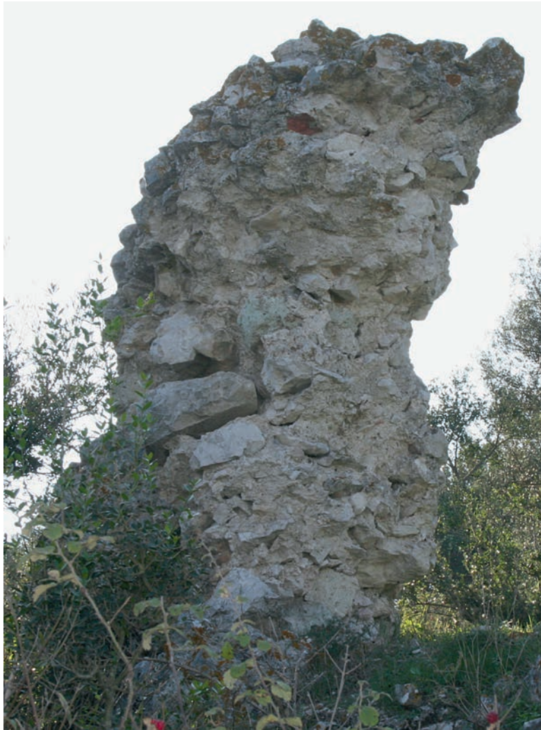
111 Karaoğlan, byz. Ummauerung