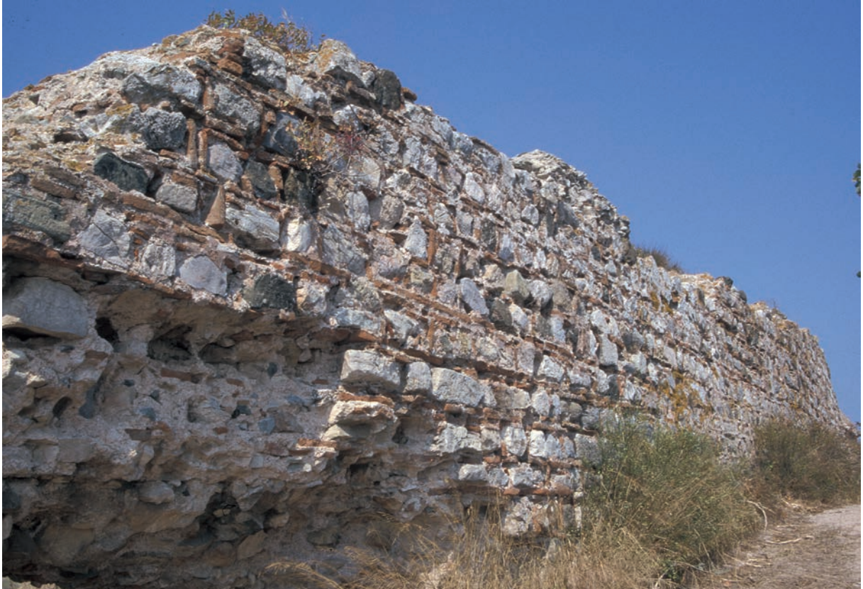
234 Pēgai, Kurtine der Stadtmauer, Innenseite