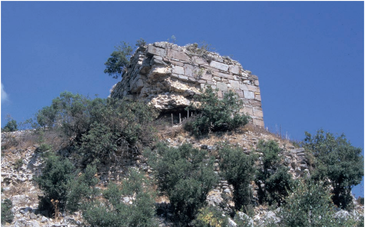
219 Palaia, Südturm der Burg