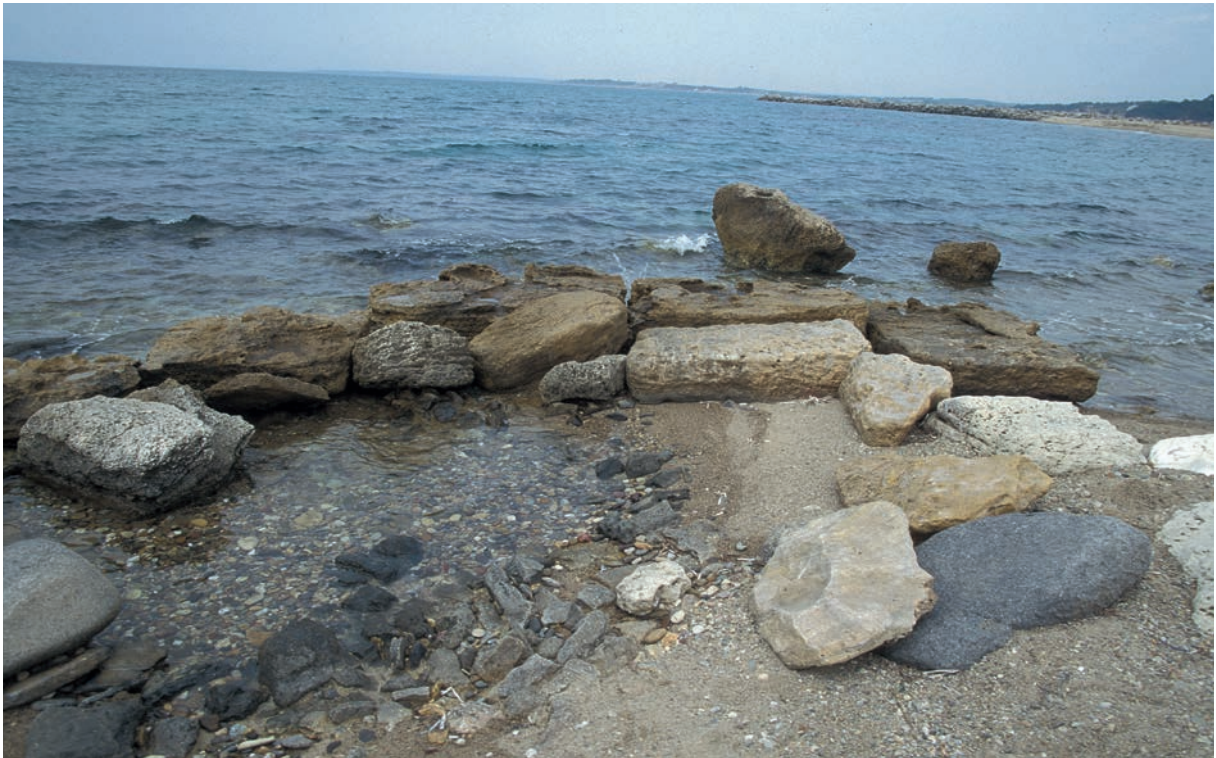
321 Trōas (1), Molenreste am äußeren Hafenbecken