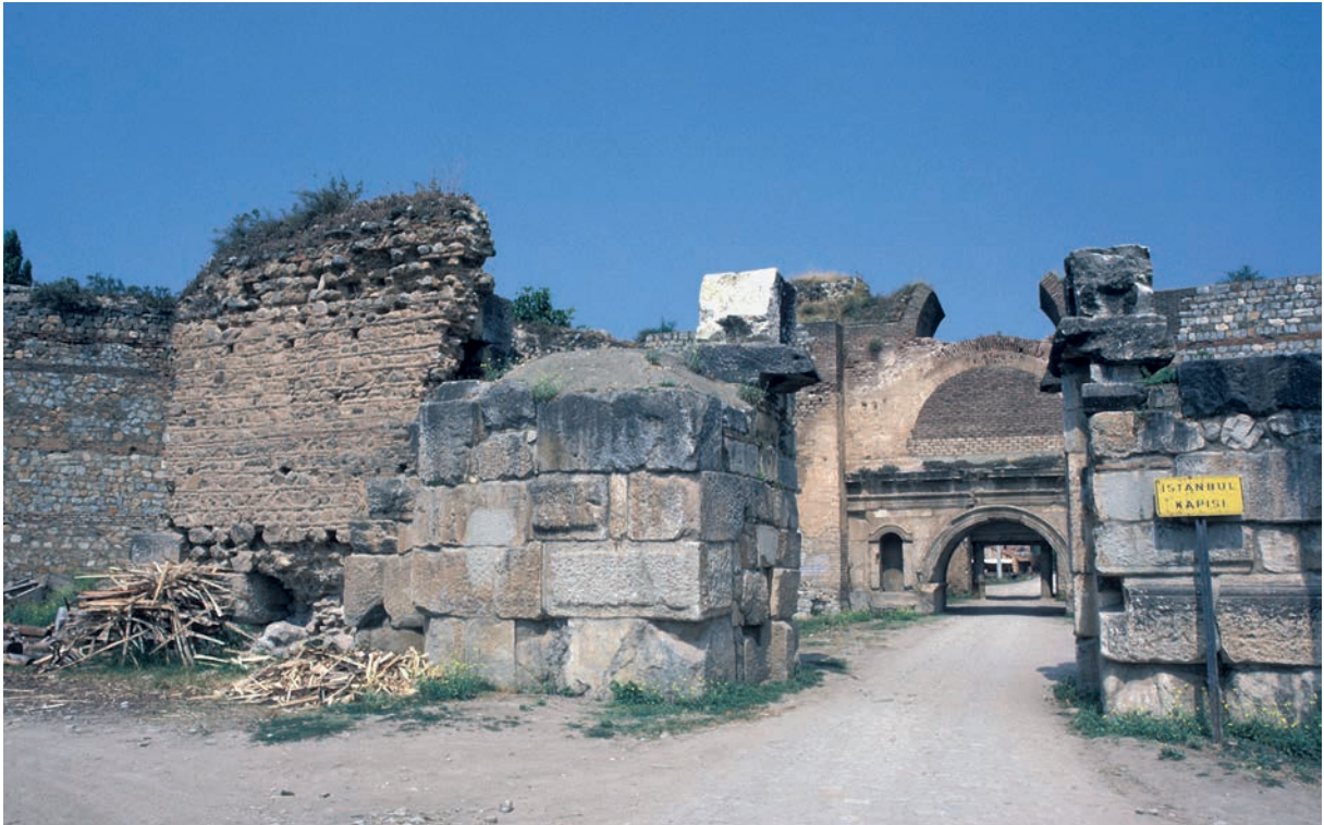
194 Nikaia, İstanbul-Tor