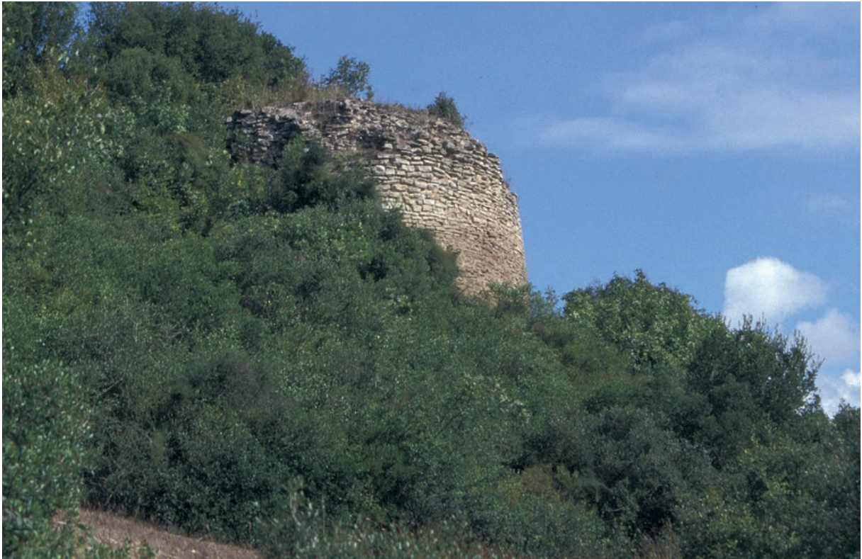
322 Xerigordos, Turm 4 (Zählung Foss) des Mauerringes