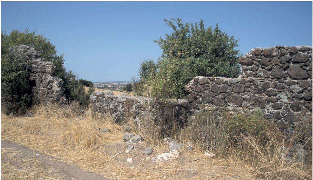
123 Kızıltepe, Aquädukt