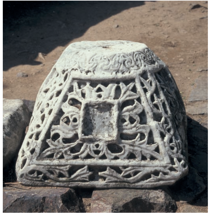
170 Metamorphōsis Christu auf Antigonu Nēsos, Korbkapitell