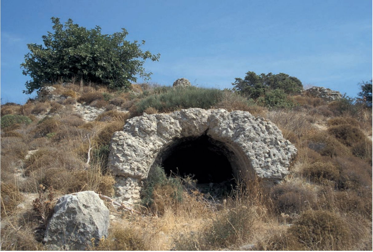
27 Aianteion, Baureste des Tumulus