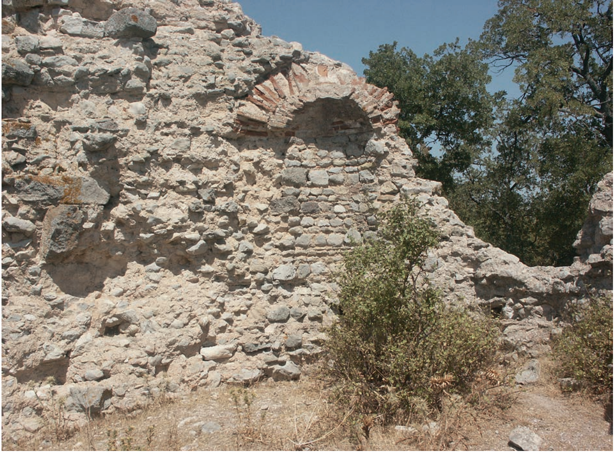
50 Babayaka Kalesi von innen