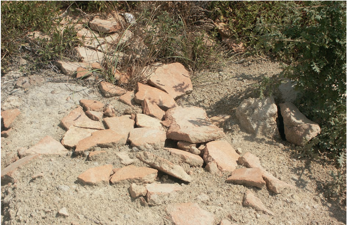
60 Çataltepe, Ziegelgrab