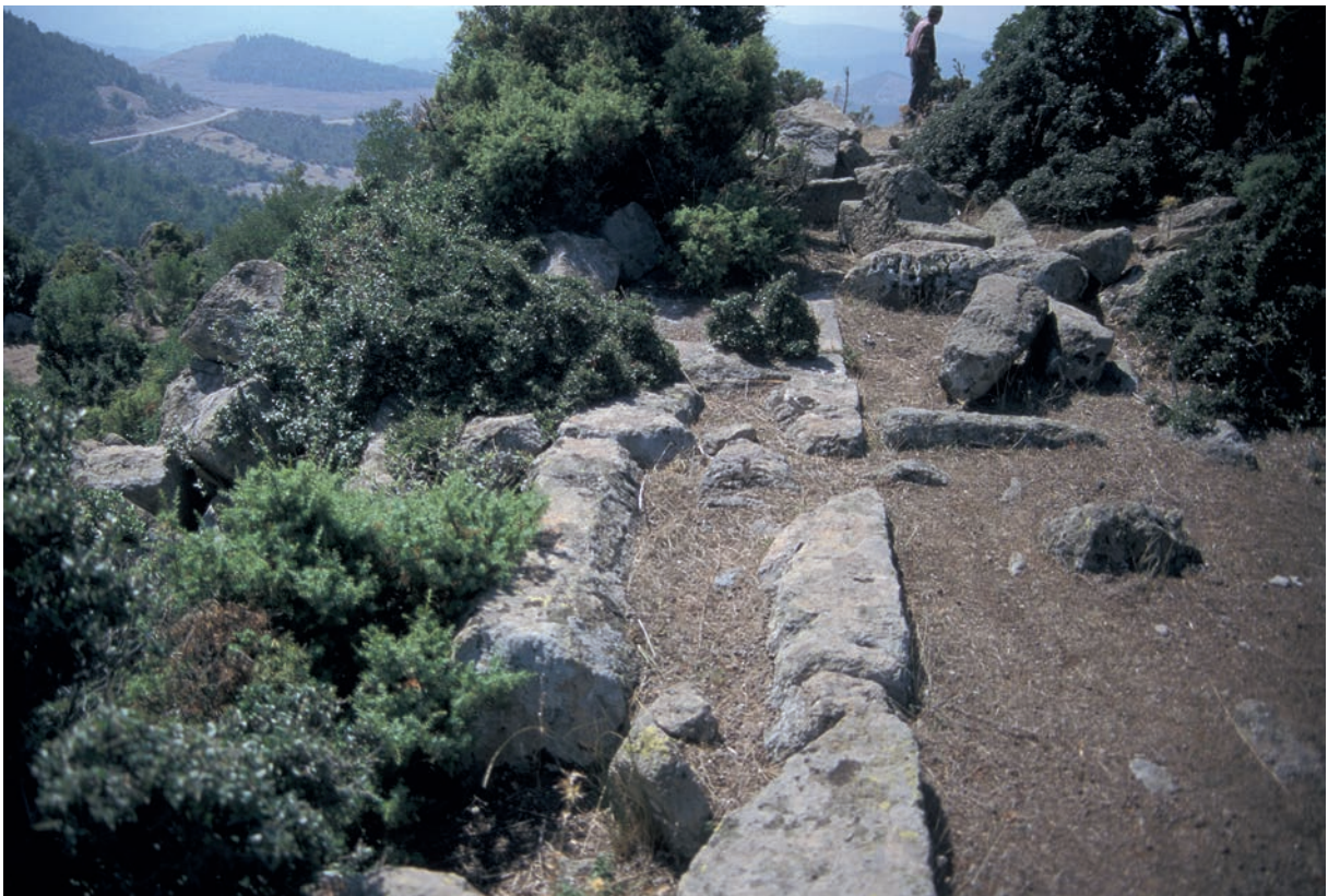
78 Eyüpbükü, Fundamentsteine der Befestigungsmauer