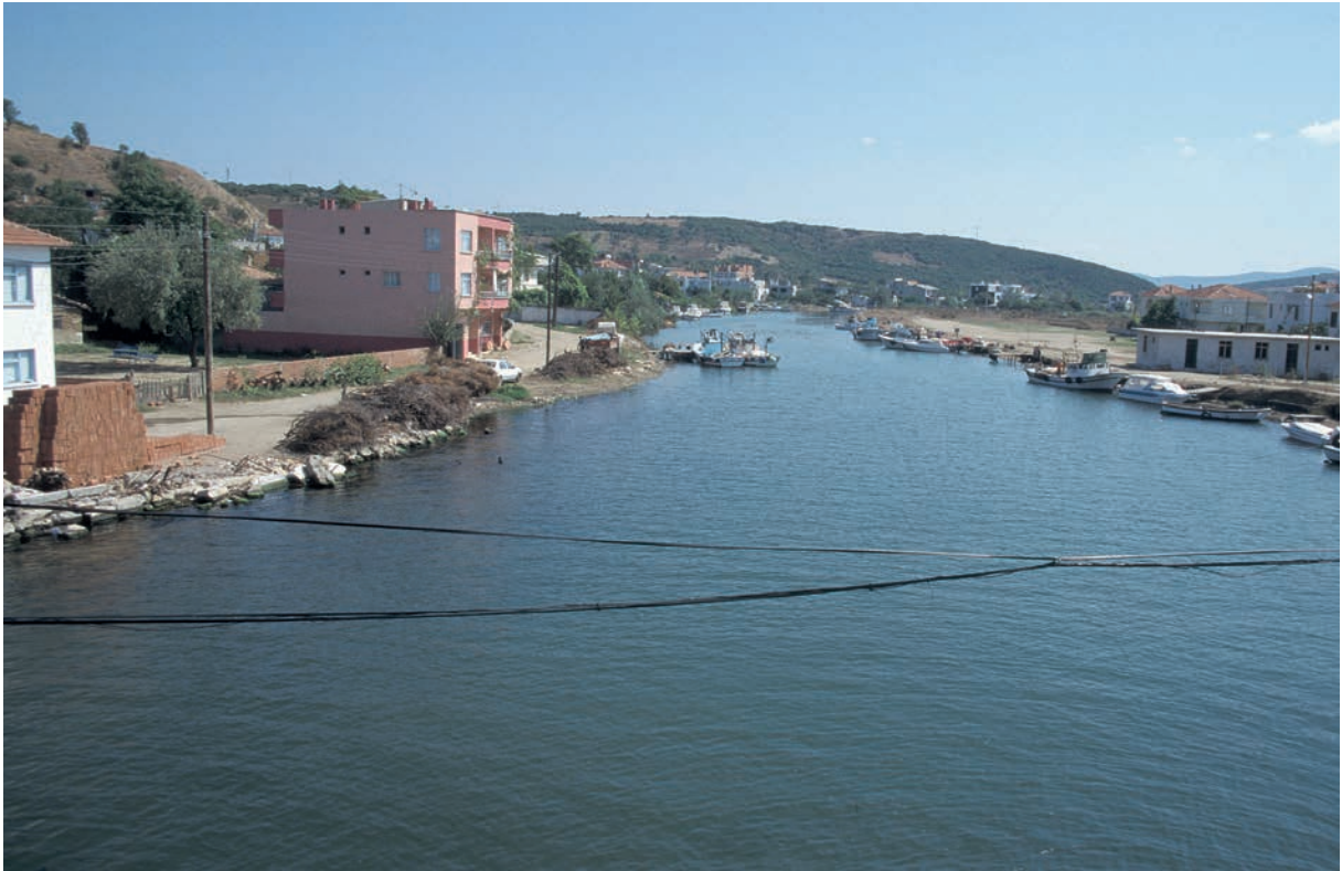
230 Parion, Kemer Çayı nahe der Mündung (Flußhafen)