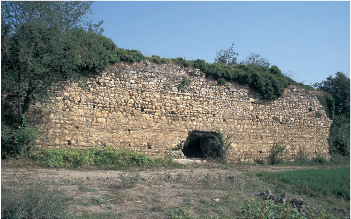
122 Kite, Ummauerung