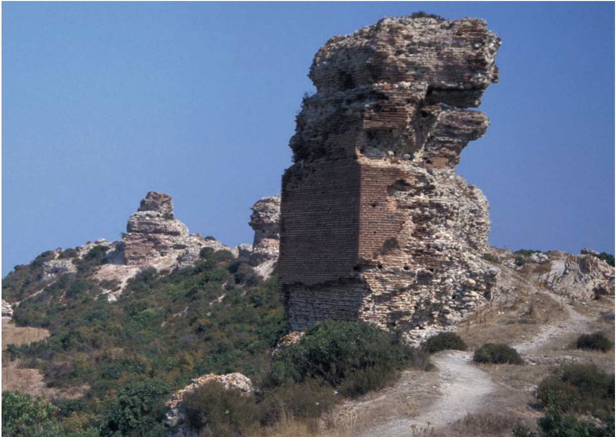
231 Pēgai, Turm der Stadtmauer