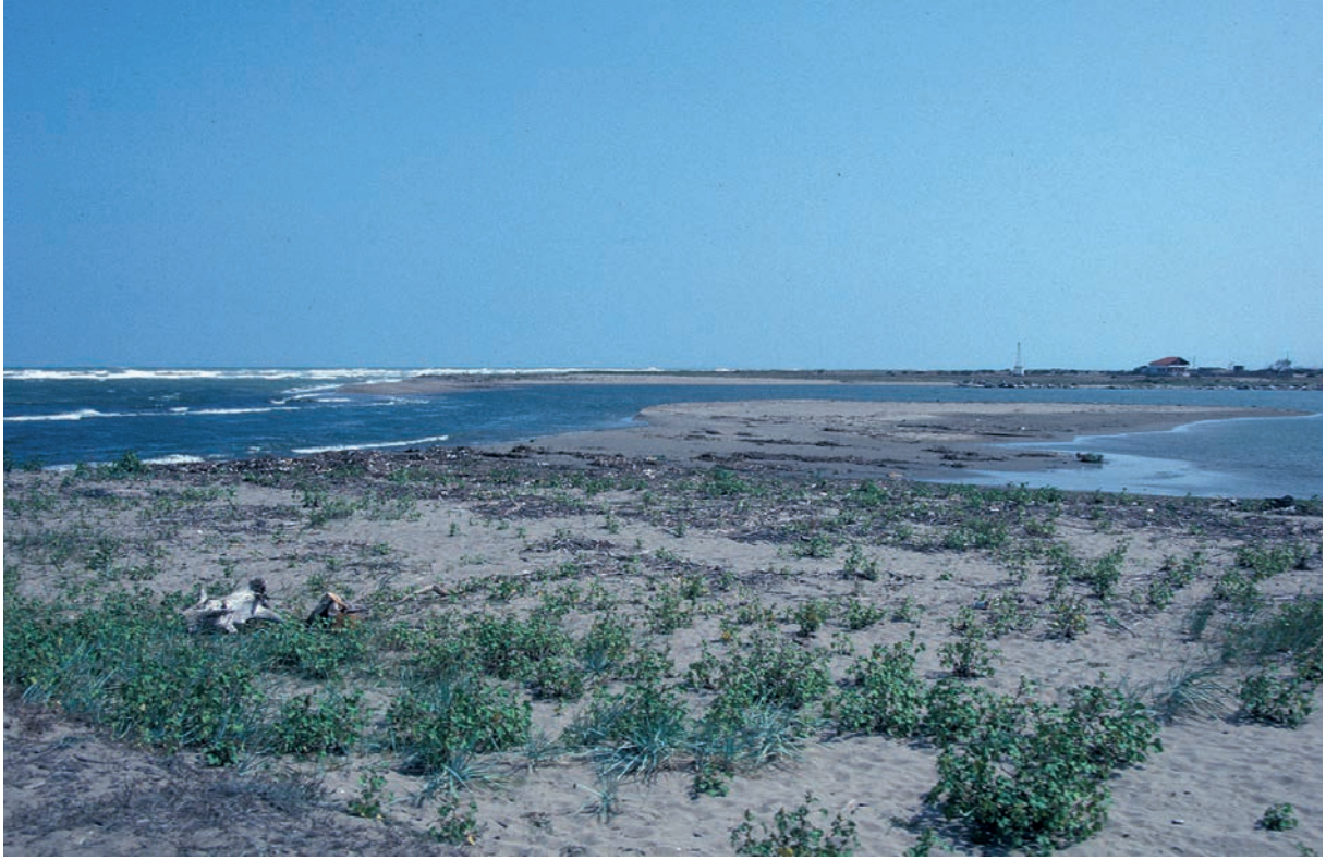
274 Sangarios, Mündung