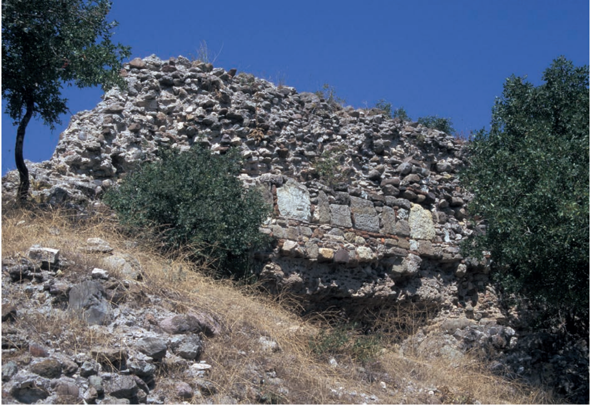
54 Bigadiç, Burg, Kurtine