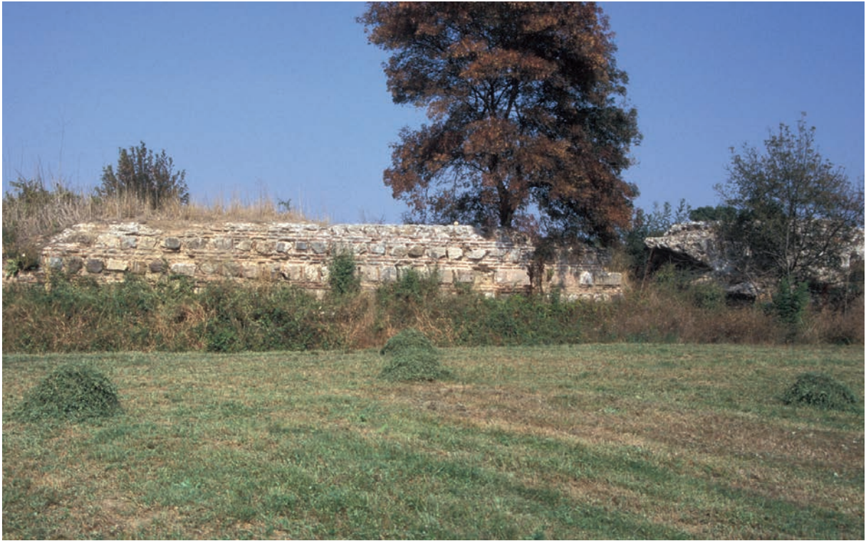
34 Akköprü, Brücke über den Granikos, erhöhter Straßendamm