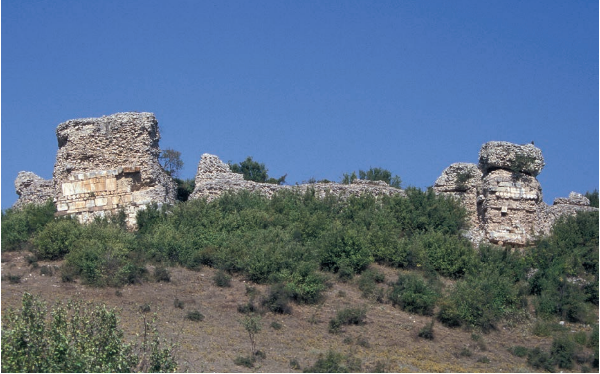
246 Poimanēnon, Südmauer der Festung mit zwei Türmen