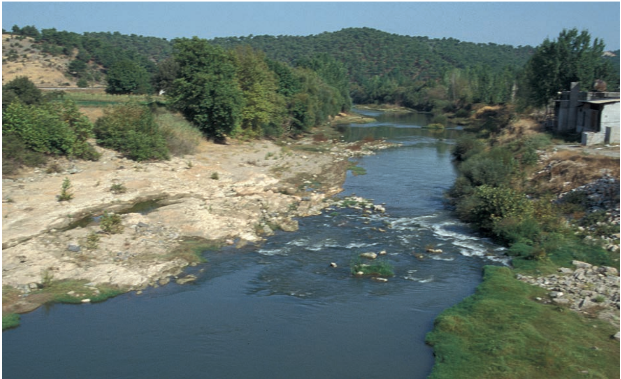
283 Skamandros (2), Mittellauf bei dem gleichnamigen Bistum