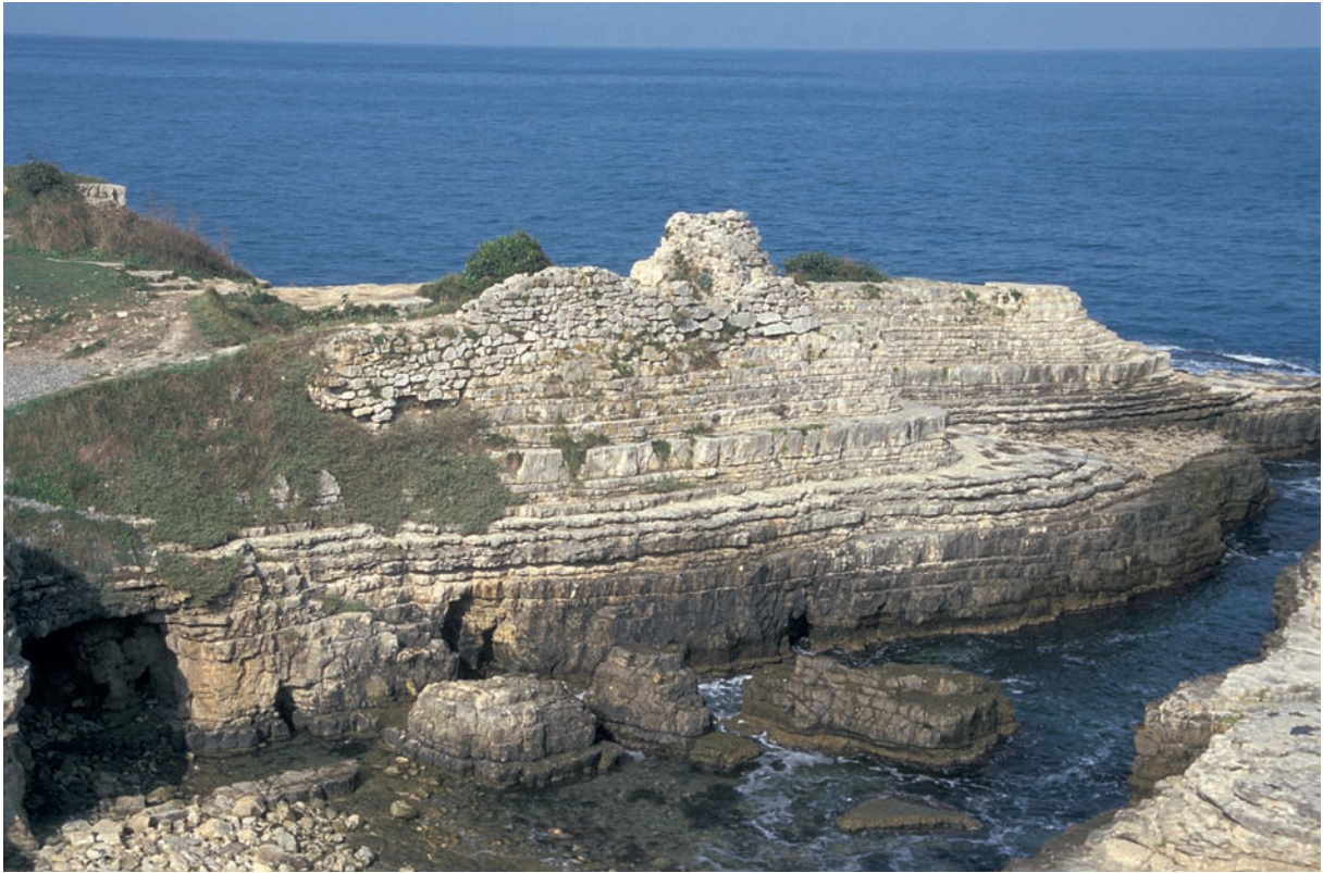
113 Karpē, byz. Befestigung