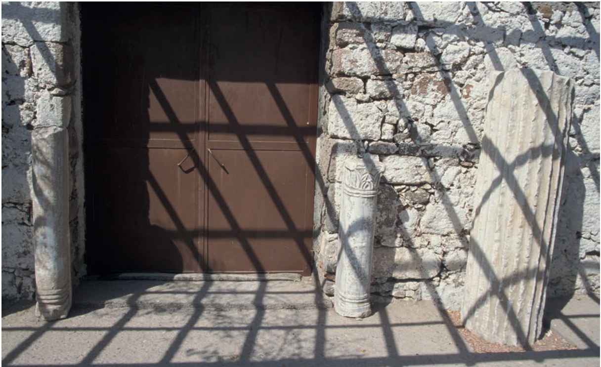
285 Sminthē, antike und byzantinische Architekturfragmente