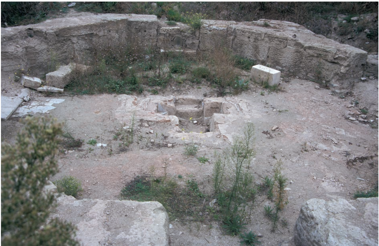
37 Apameia, Baptisterium