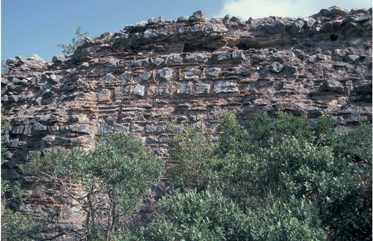
115 Kayapa, Zisterne von außen