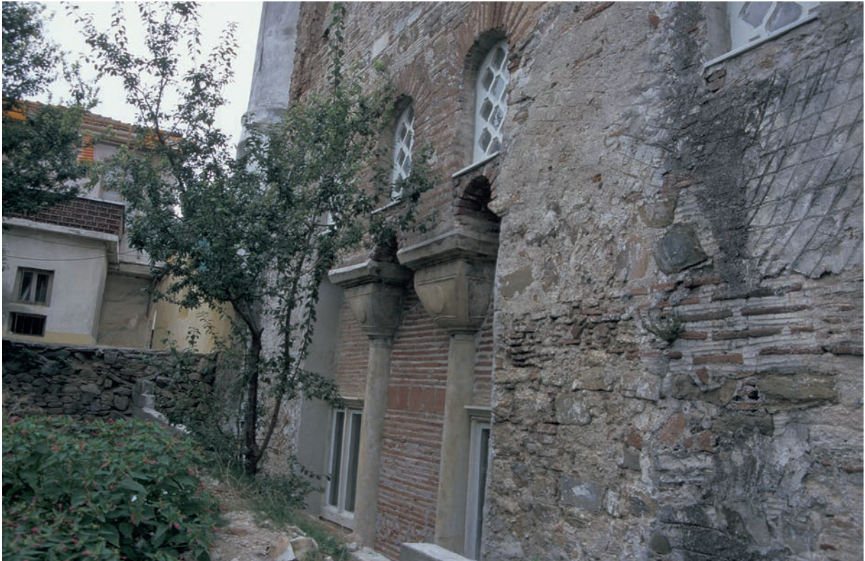
314 Trigleia, Christus-Kirche (Fatih Camii), Nordwand