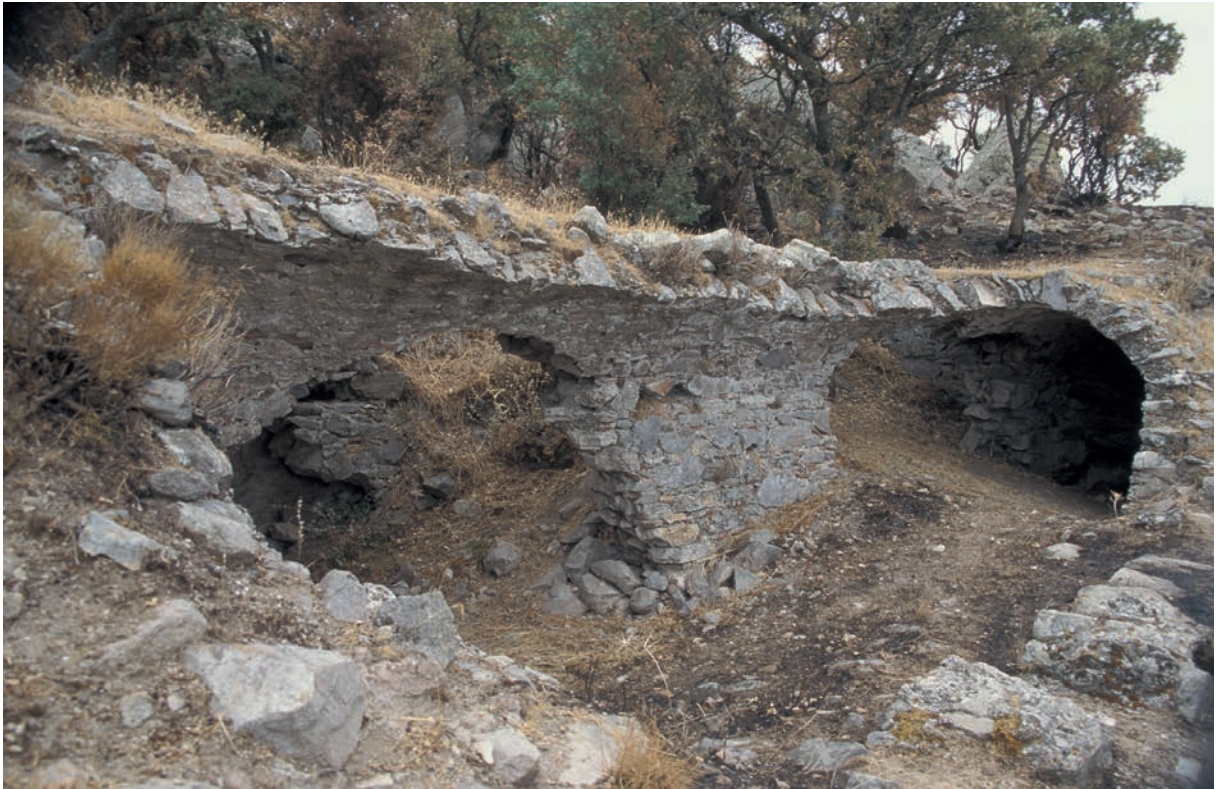
124 Kızkalesi, Gebäude auf dem Gipfel