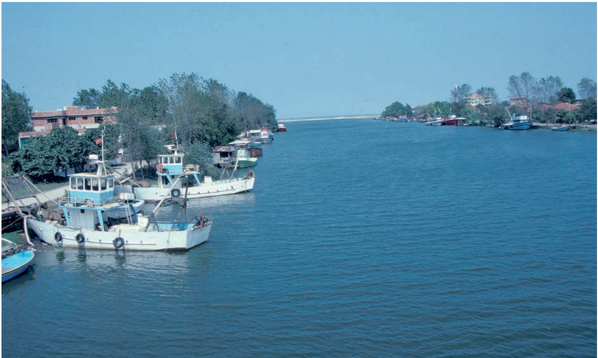
273 Sangarios, Unterlauf und Mündung