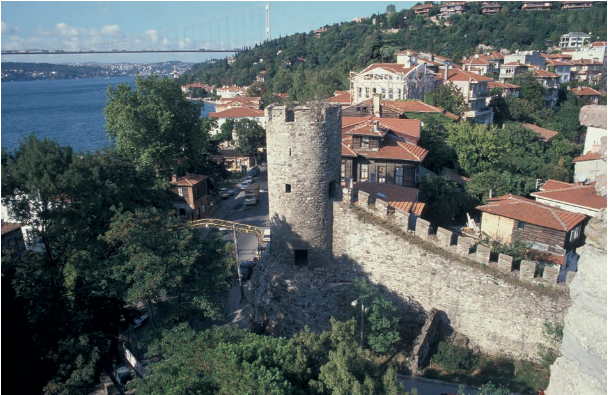
250 Potamōnion, osman. Festung Anadolu Hisari, Blick auf den Bosporos nach Norden