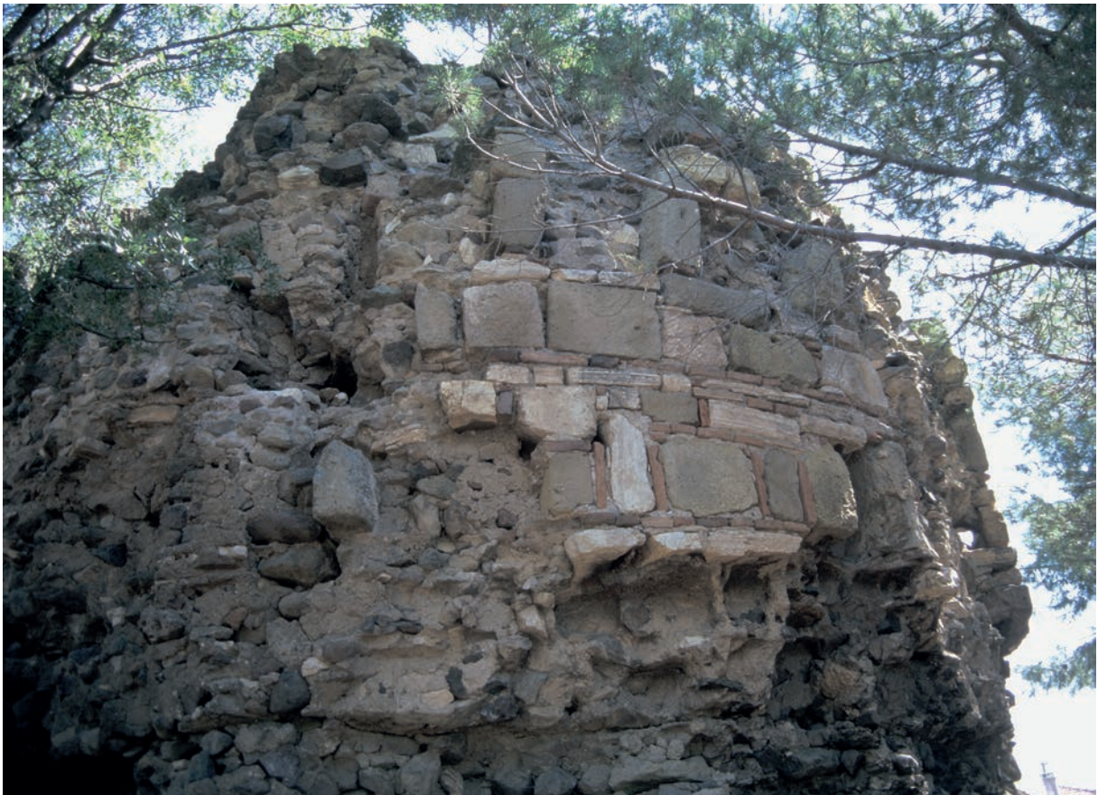
53 Bigadiç, Burg, Außenschale eines Turmes