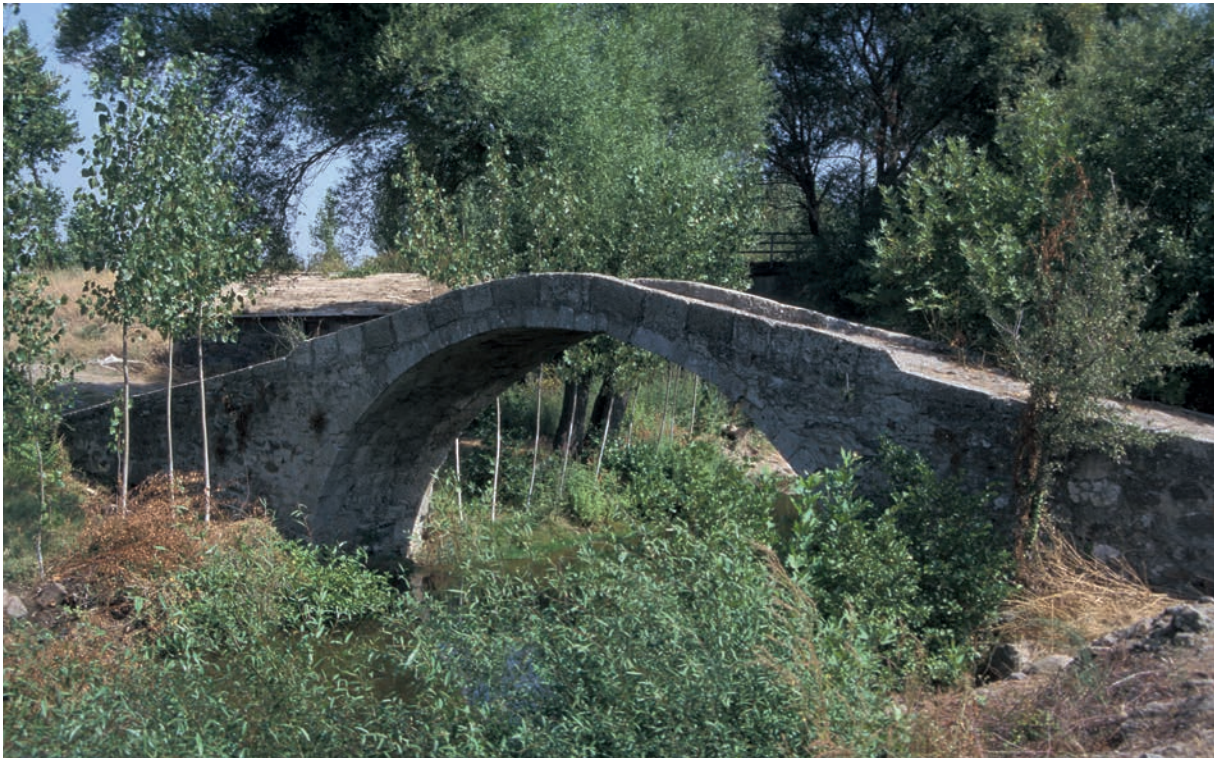
143 Lakku Mitata, osmanische Brücke 2