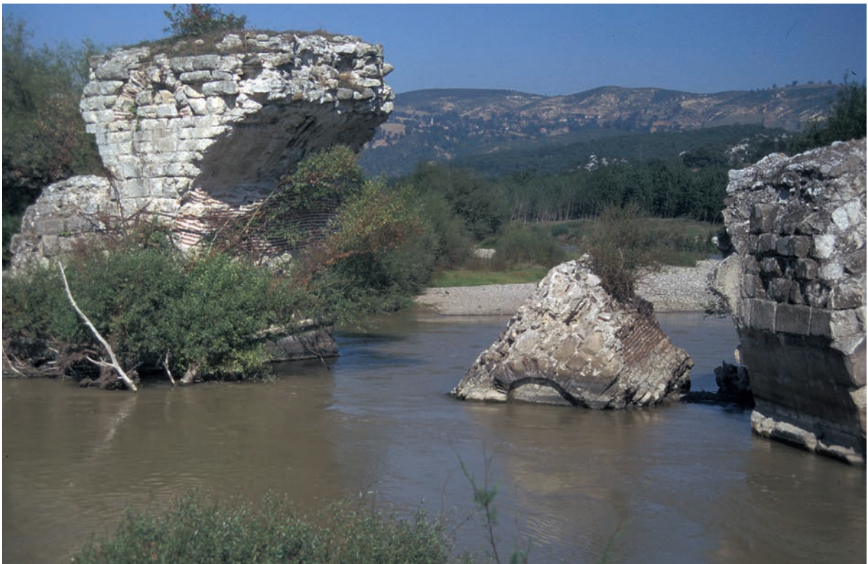
287 Sultançayır, Brücke, Pfeiler