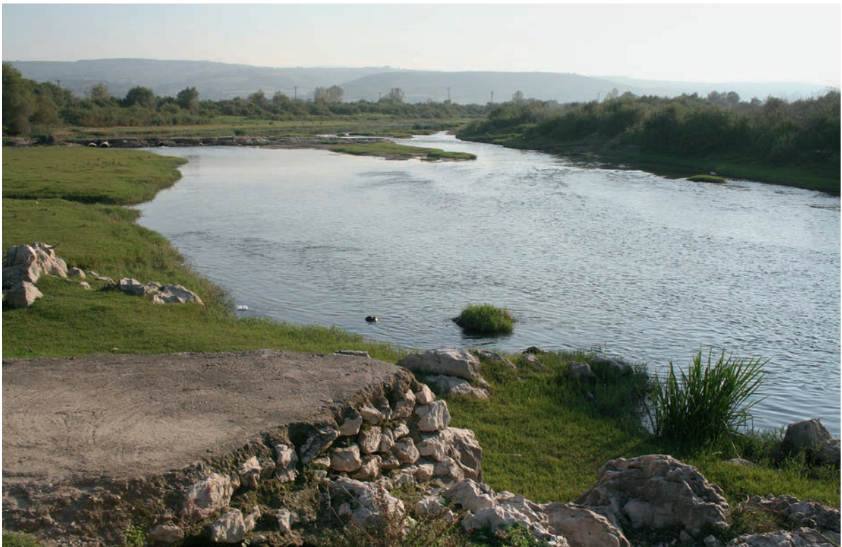
6 Ryndakos bei Karaođlan