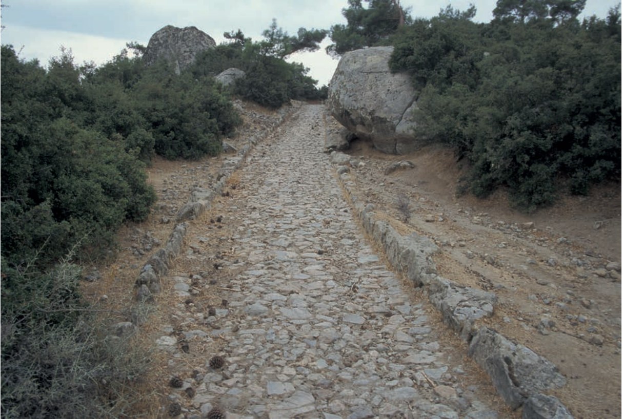
127 Kızkalesi, Kaldırım