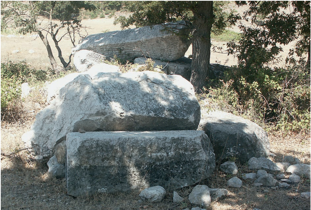
104 İlyasca, antike Steine in der Flur Kilise Yeri