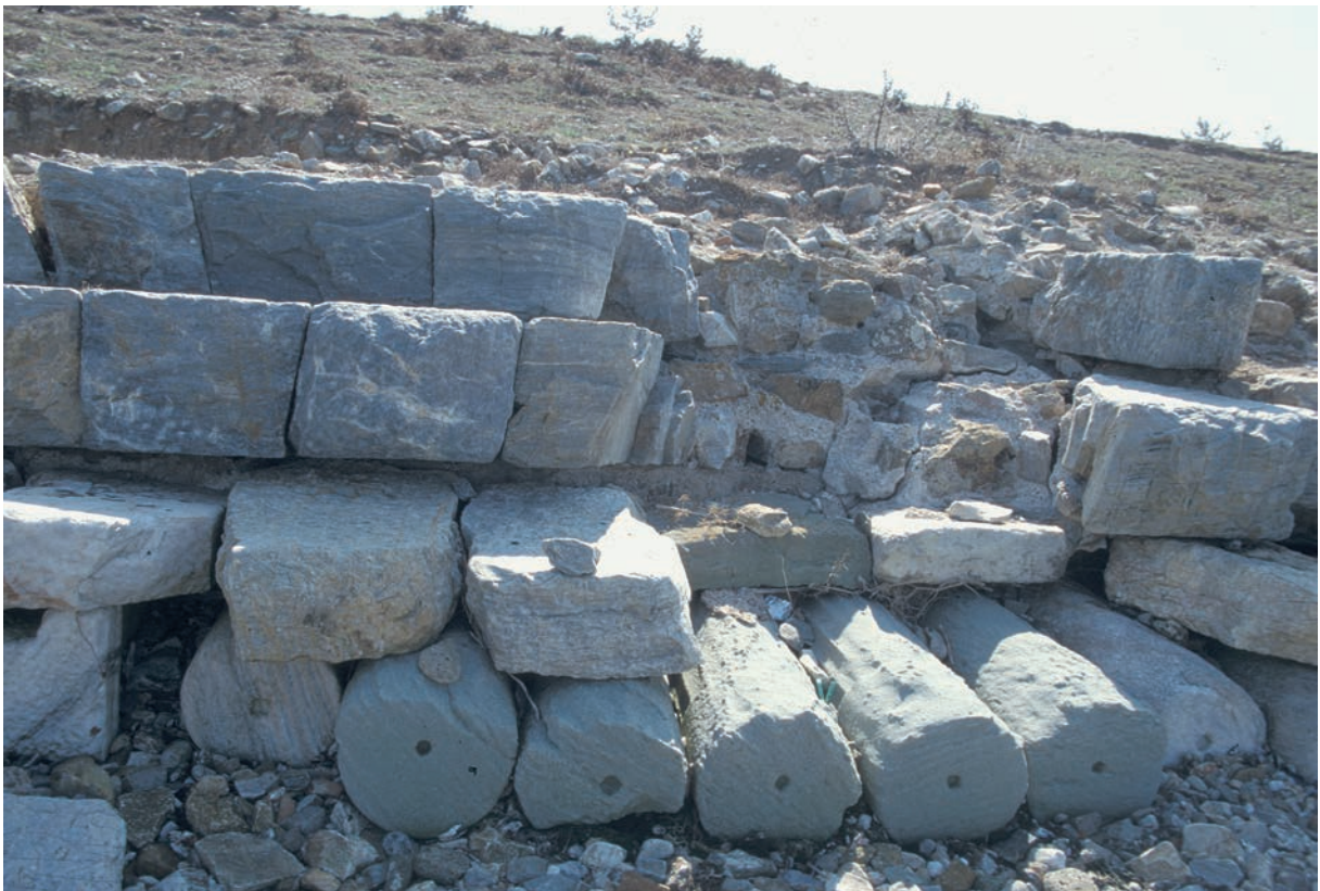
225 Parion, Kai- oder – cher – Befestigungsmauern am Nordhafen