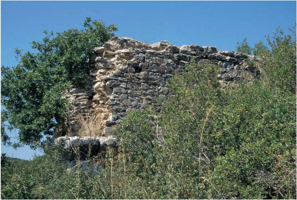
226 Parion, römischer Aquädukt