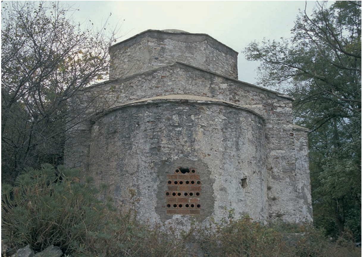
213 H. Nikolaos (2), Kirche von Osten