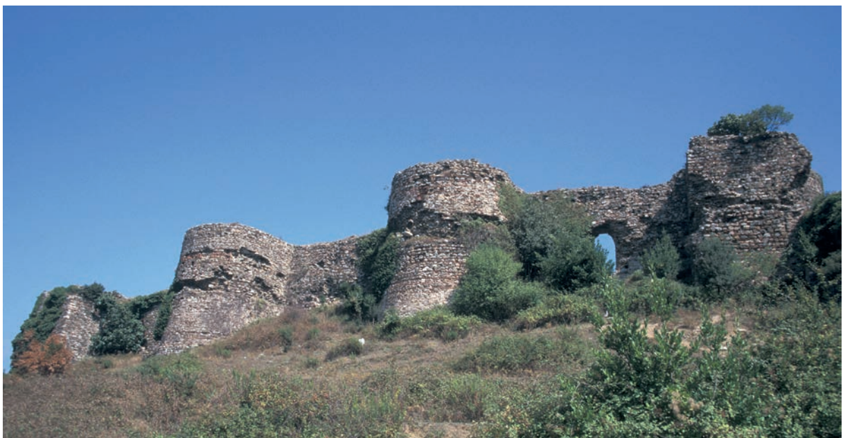
97 Hieron, Festung, Oberburg von Westen