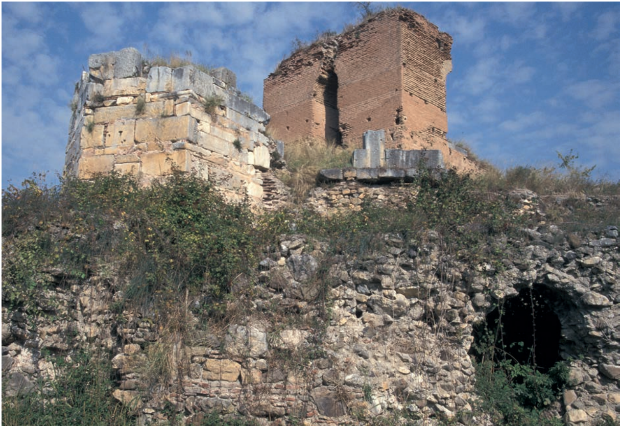
195 Nikaia, Vormauer, dahinter Bastion Kaiser Alexios' I. und Turm Kaiser Theodōros' I. Laskaris