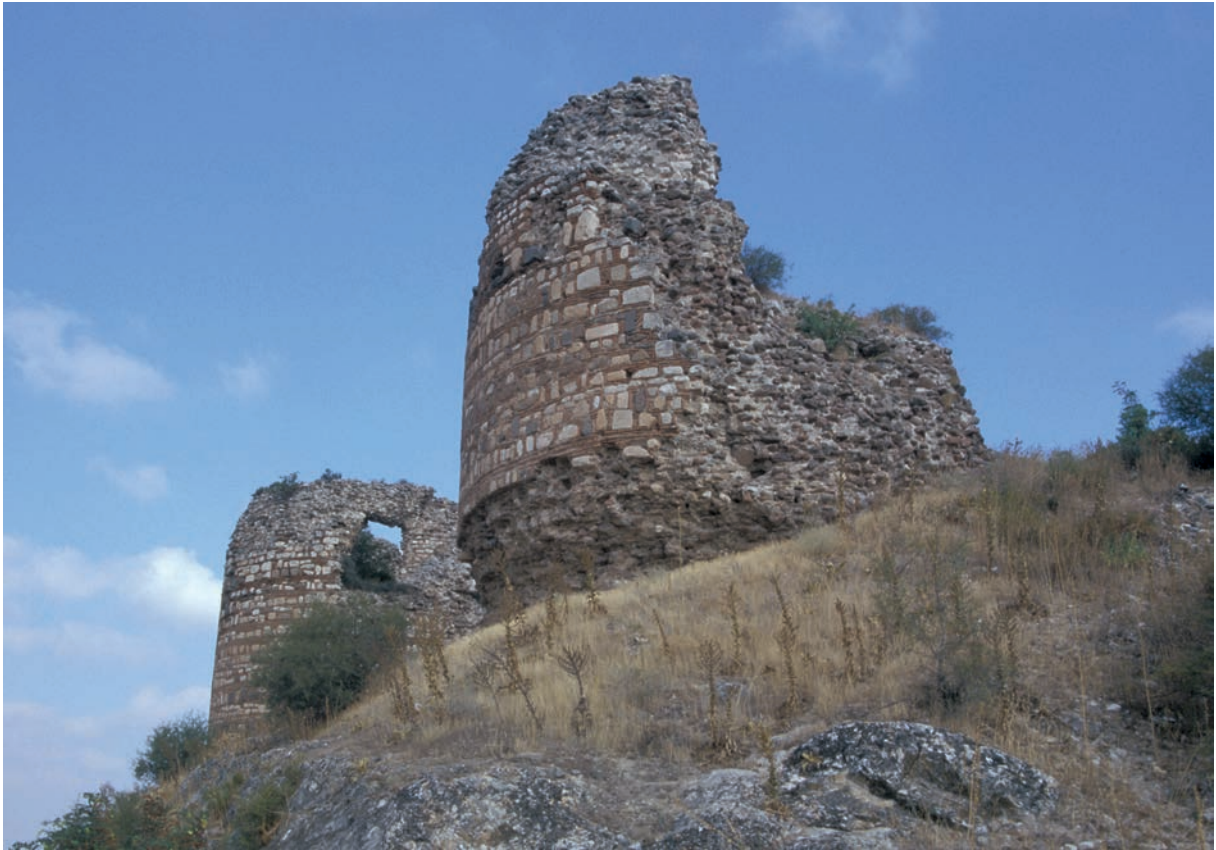
19 Achyraus, Türme der Befestigung