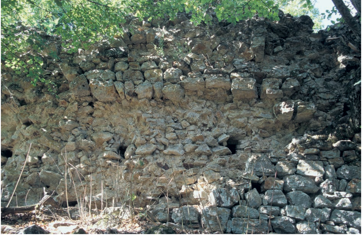
276 Sapan Kalesi, Kurtine, Detail des Mauerwerks