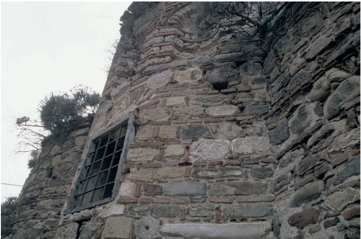
317 Trigleia, Panagia-Pantobasilissa-Kirche, Apsis