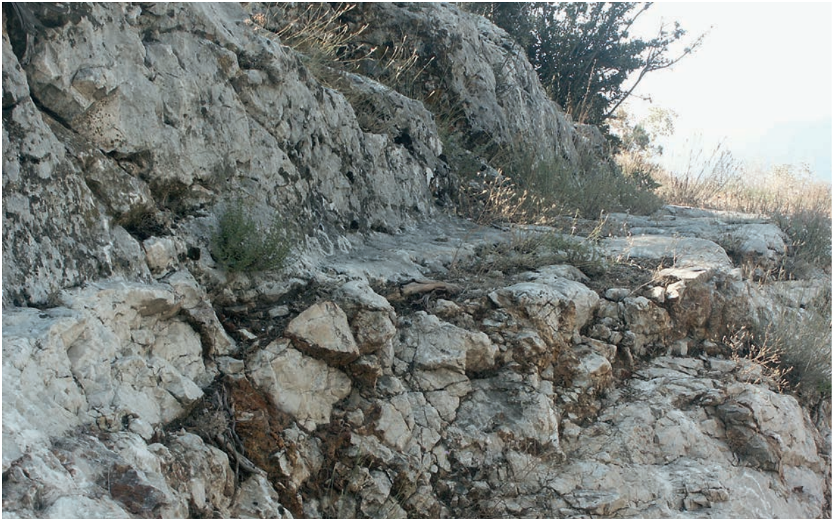
12 In den Fels geschlagene Reste der Pilgerstraße zwischen Nikaia und Leukai