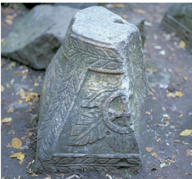
259 Pythia, Exedra, fragmentarisches Korbkapitell mit Monogramm des Kaisers Justin II.