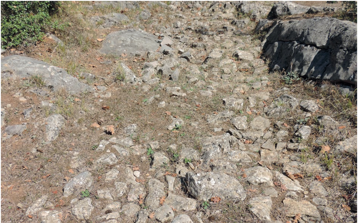
16 Alte Straße bei Yazımanayır