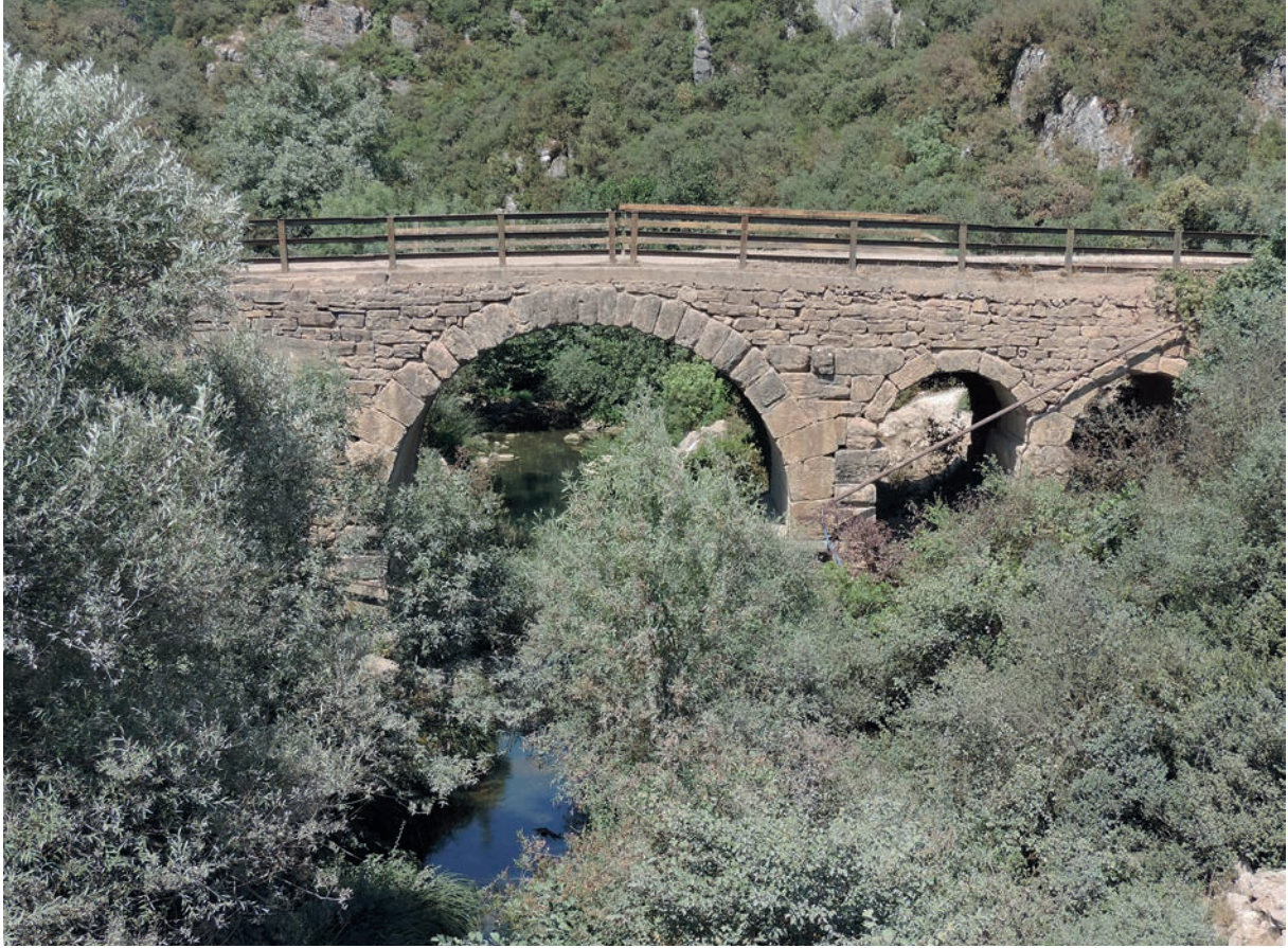
294 Taşköprü (1), alte Brücke von Süden