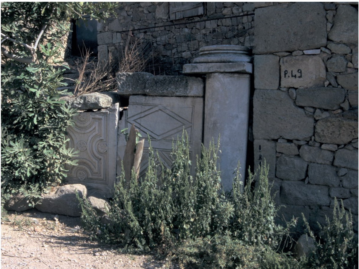
99 Hisarköy, byz. Architekturfragmente