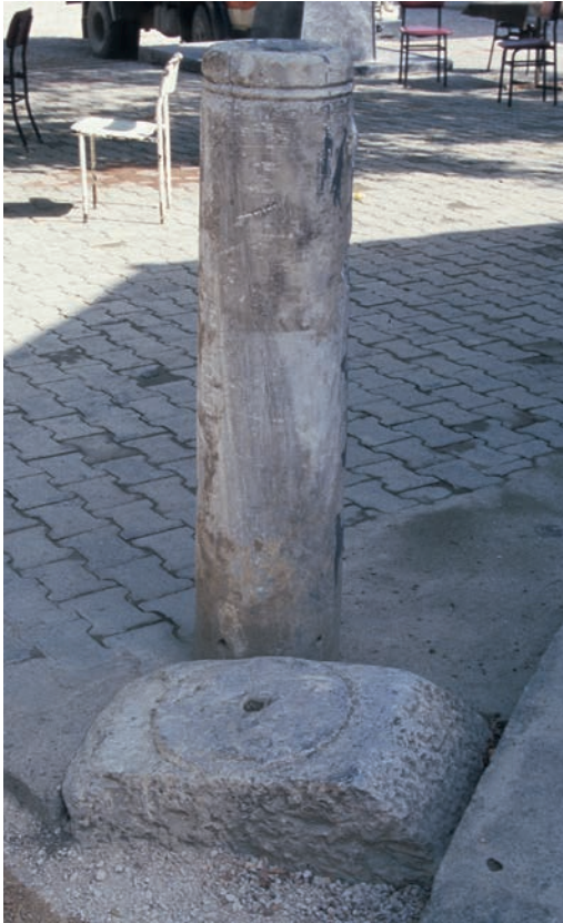
187 Neokaisareia, Säule und unvollständig bearbeiteter Kämpfer (?)