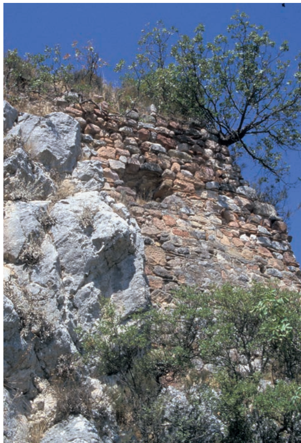
245 Pionia, Turm der Burg