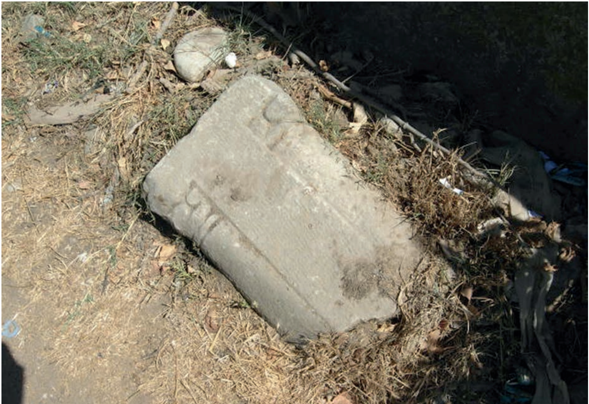
91 Havutça, Doppelsäule