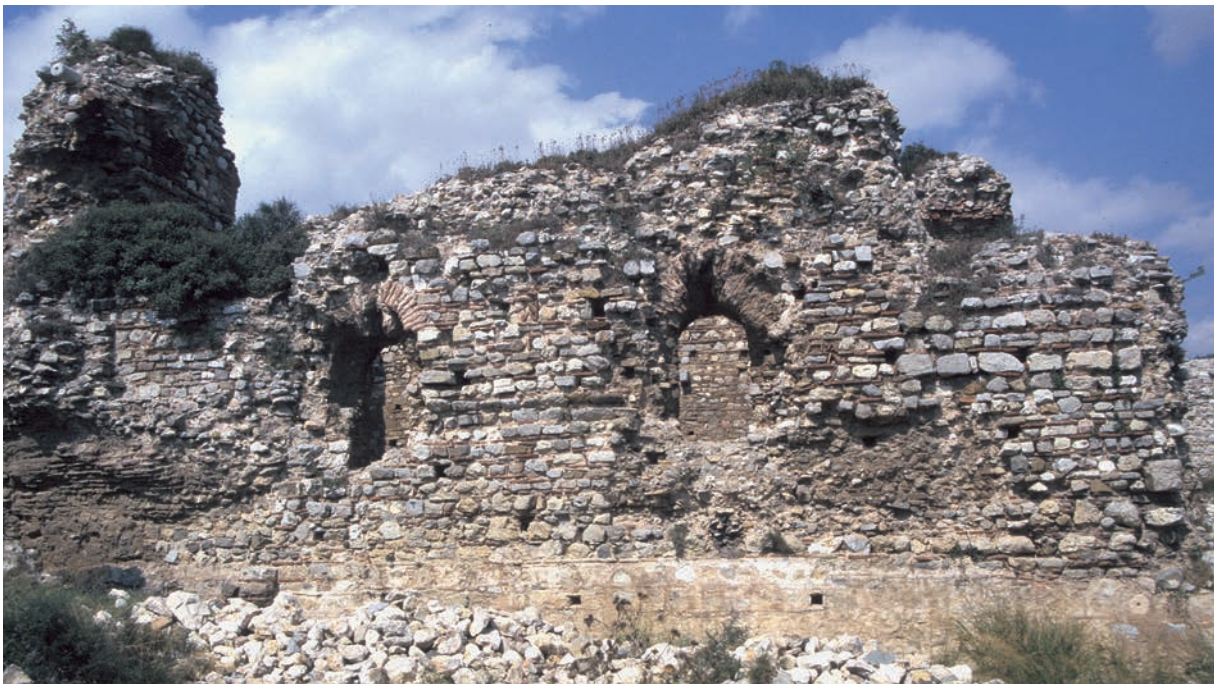
209 Nikētiatu Phrurion, Palastgebäude von Süden mit Fenstern