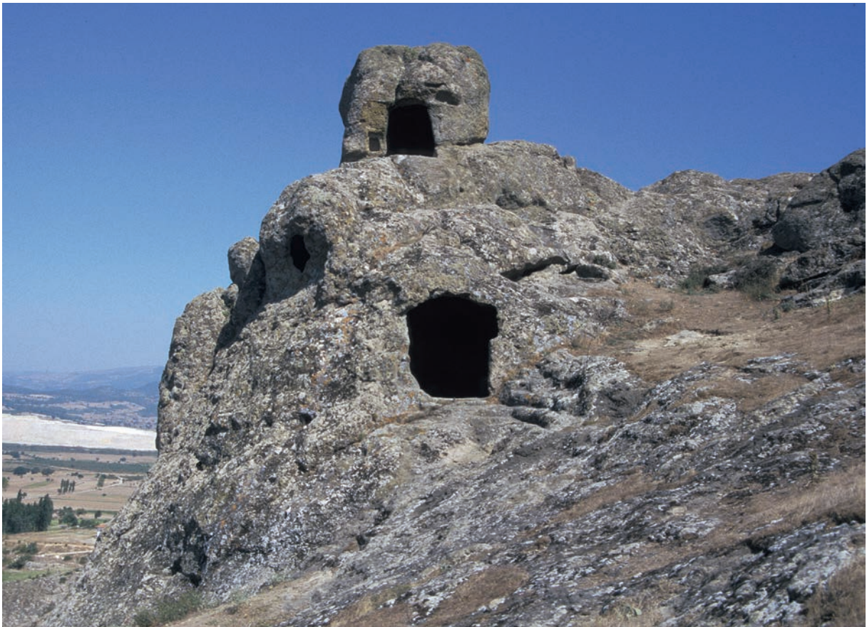
241 Persi Köyü, Einsiedelei von Westen