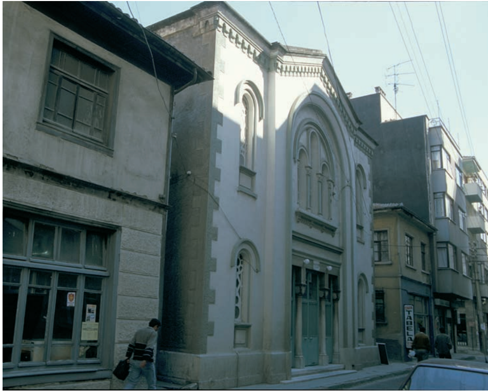
119 Kios, neuzeitliche Kirche Panagia Pazarıotissa (jetzt Balıkpazarı Camii)