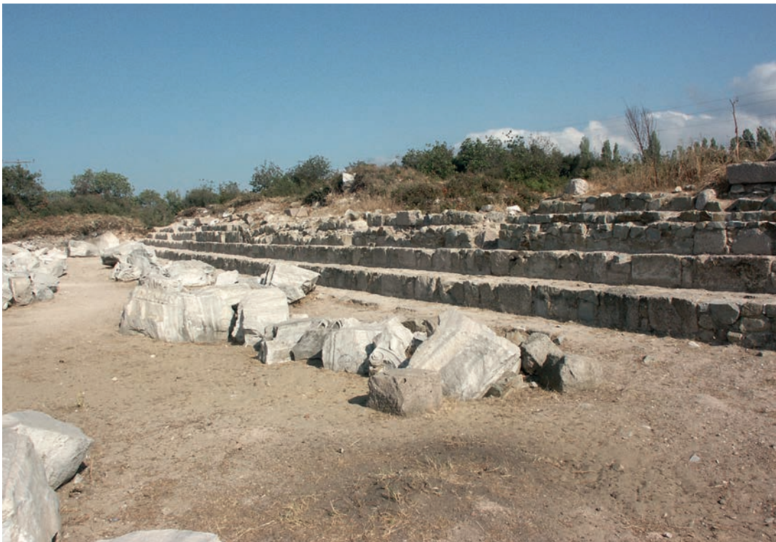
141 Kyzikos, Hadrianstempel