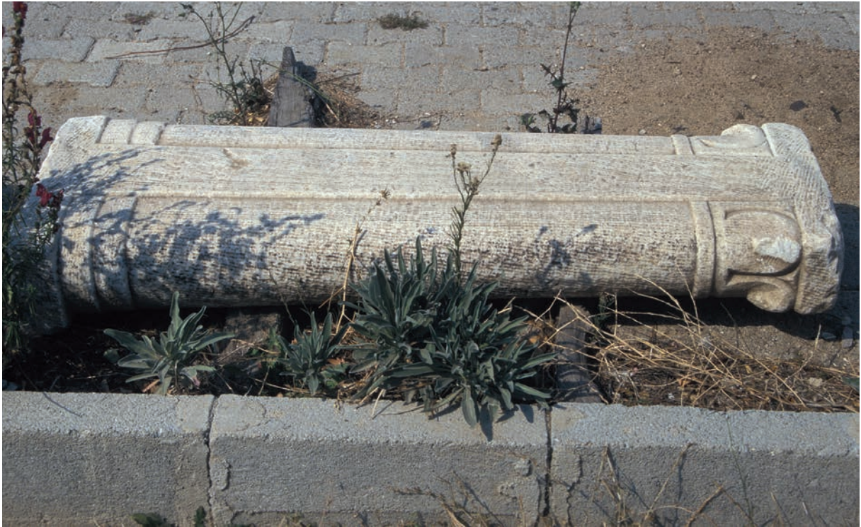
252 Priapos, Doppelsäule (vielleicht von einer Fundstelle der Umgebung)