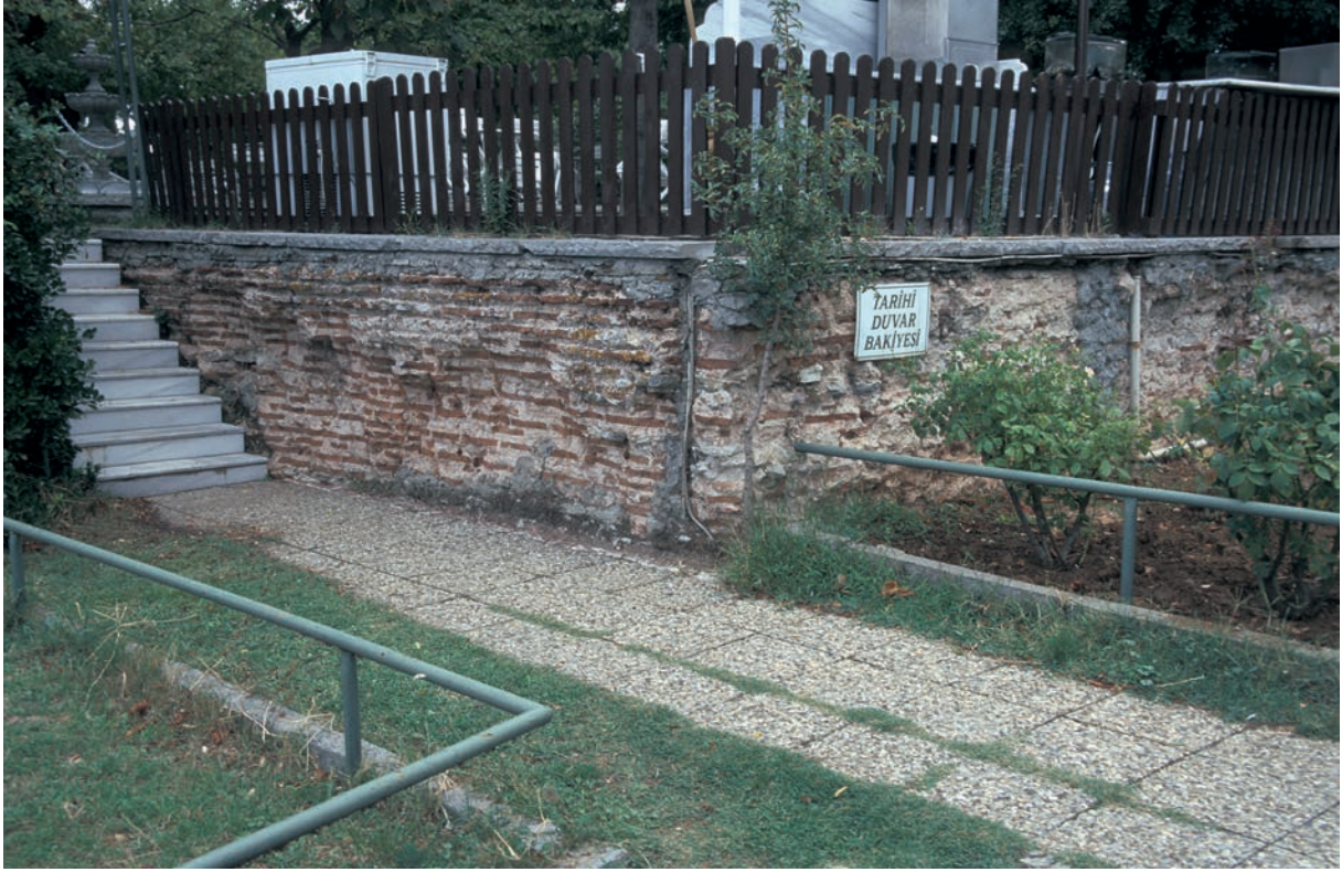
94 Hiereia (1), Rest der Zisterne