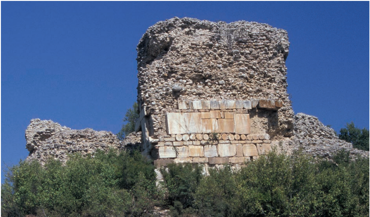
247 Poimanēnon, Turm der Südmauer (Detail)