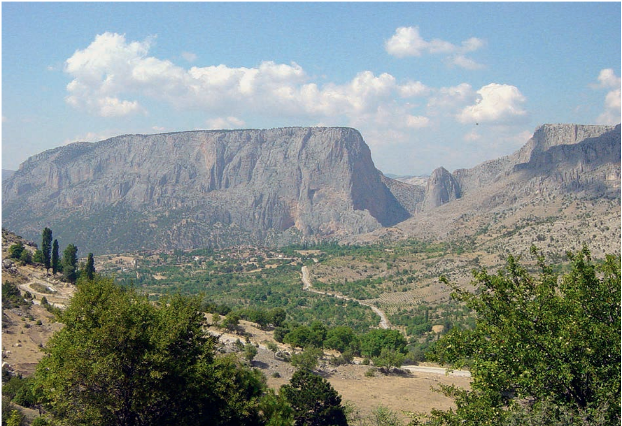
85 Harmankaya, namengebende Felsformation