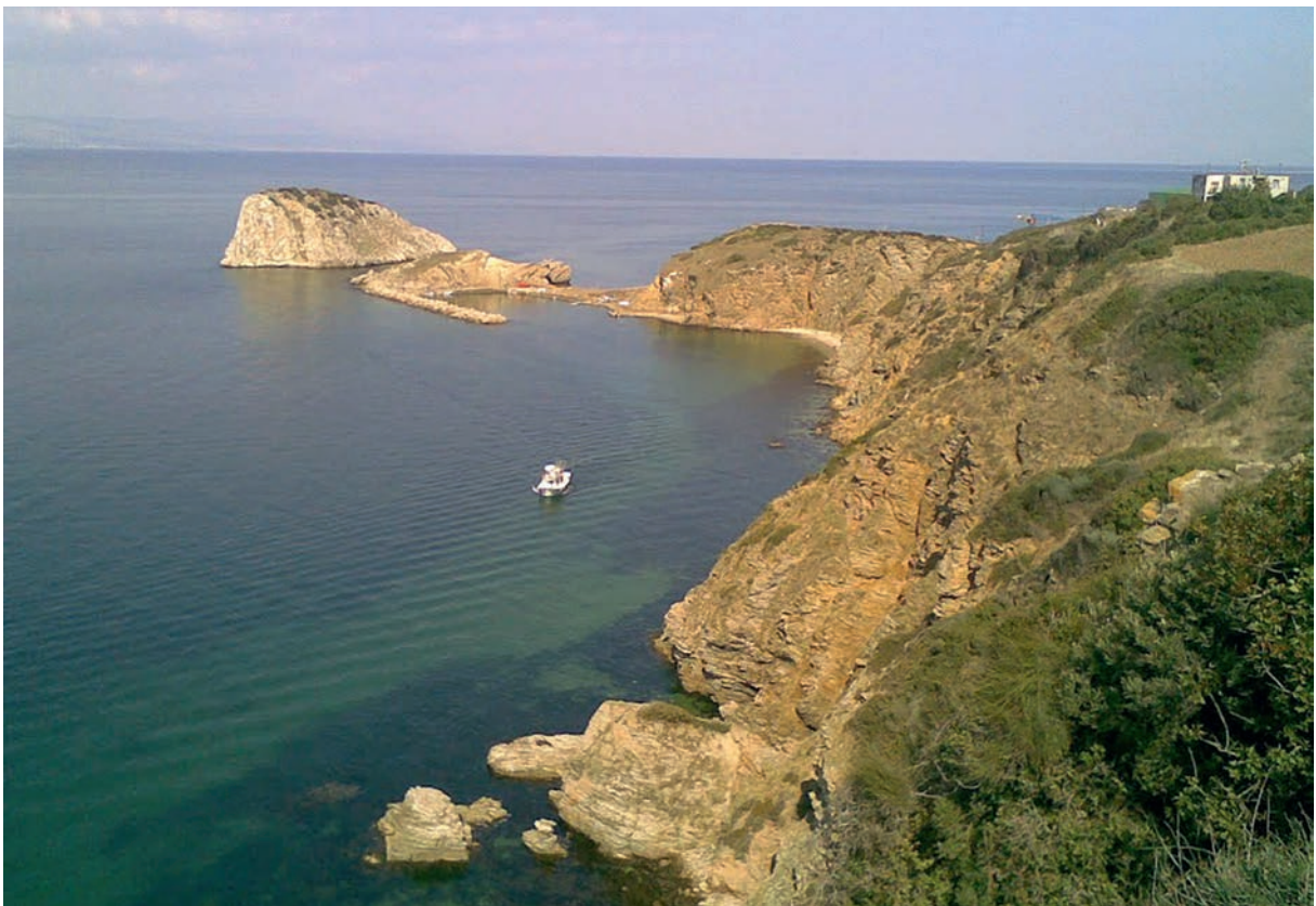
82 Halas, Blick auf die Insel