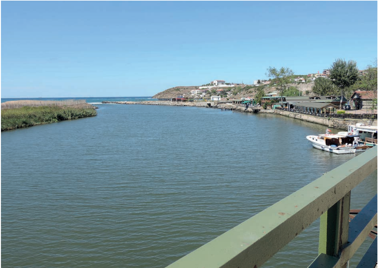
262 Rēbas (1), Unterlauf und Mündungsgebiet (2013)