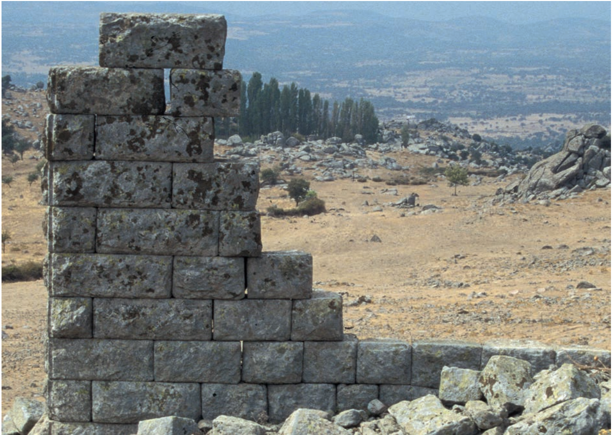
182 Neandria, hellenistisches Gebäude