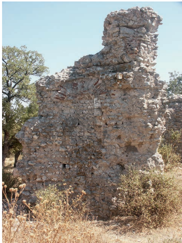
51 Babayaka Kalesi von innen