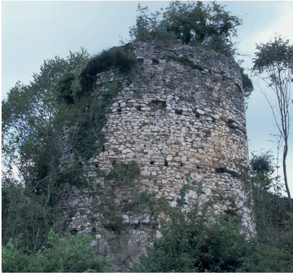
92 Heciz Kalesi, Turm