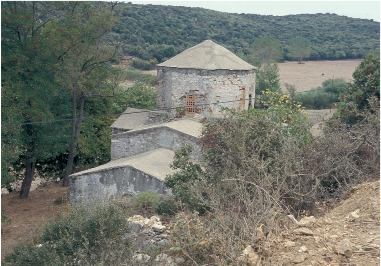
214 H. Nikolaos (2), Kirche von Südwesten