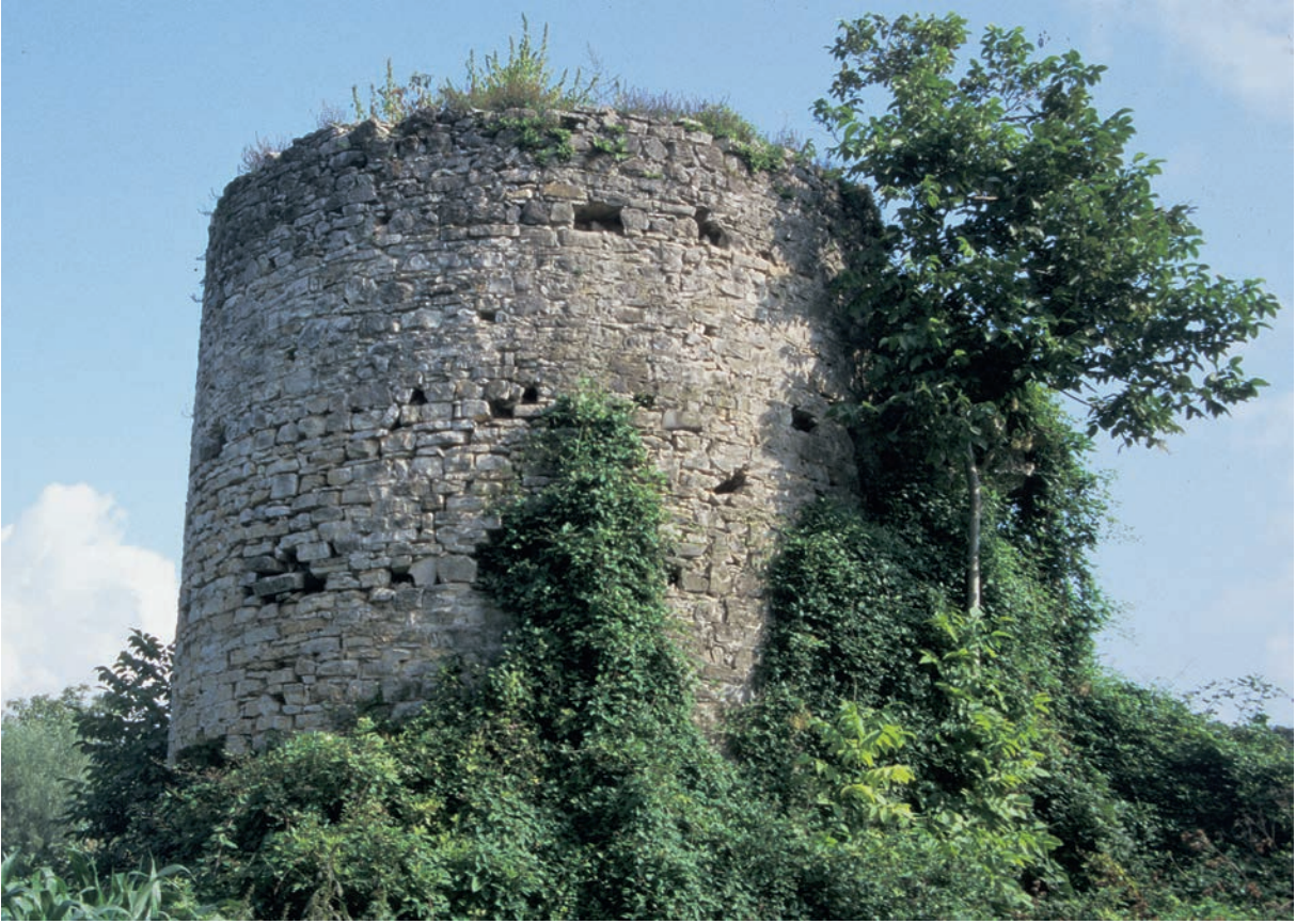
278 Seyfilar Kalesi, Turm