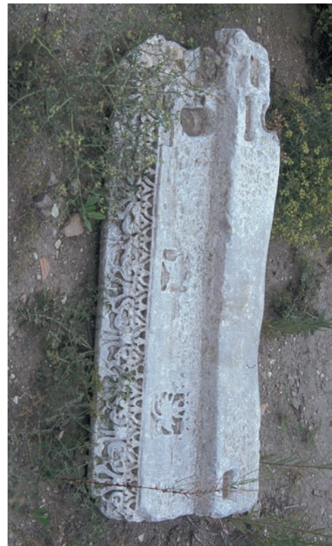
186 Neochōraki, antiker Gesimsblock, umgearbeitet als Türschwelle