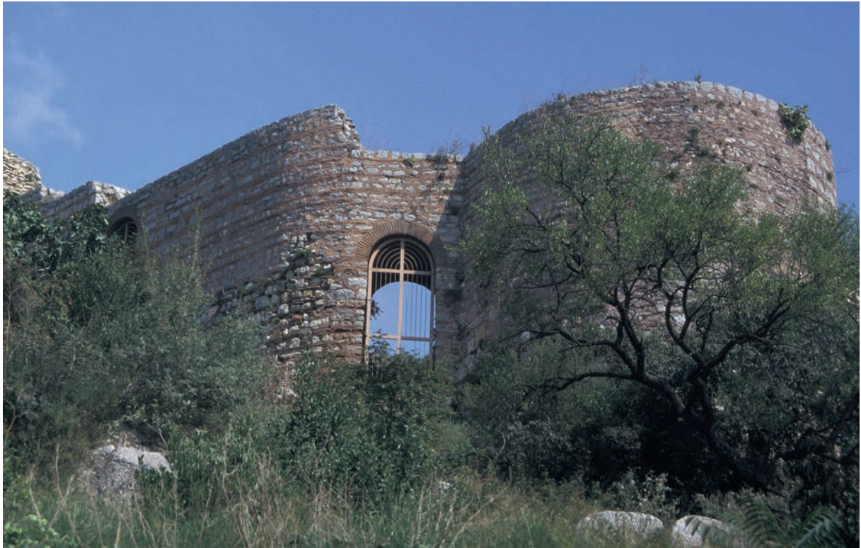
212 Nikētiatu Phrurion, äußerer Mauerring, Südwestecke