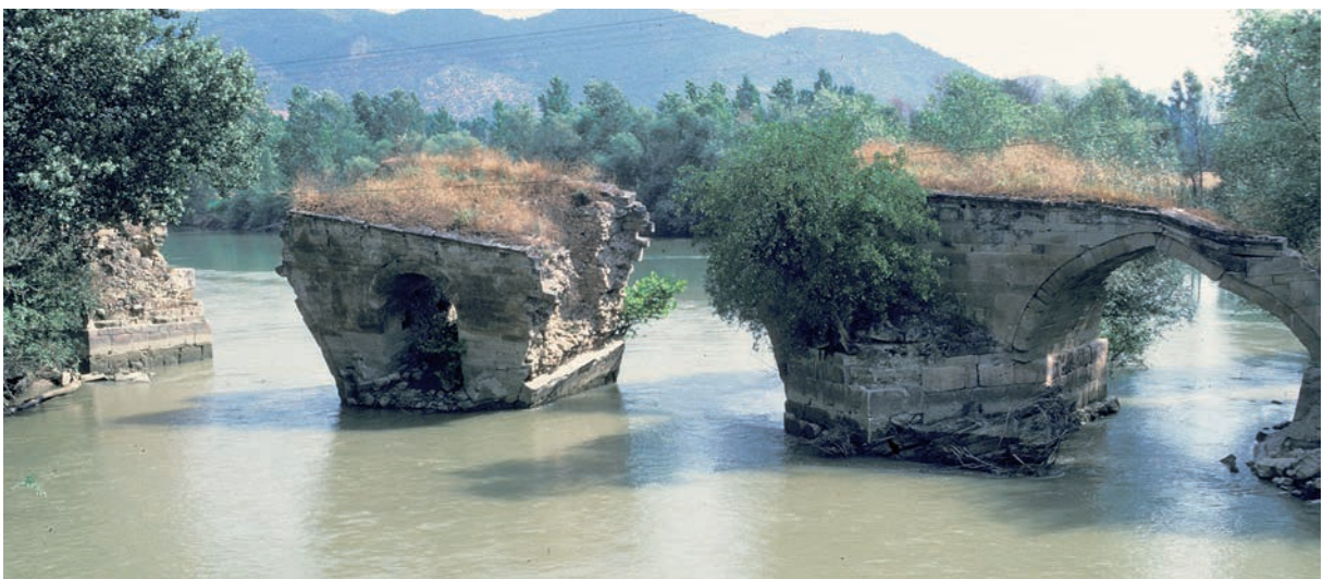
299 Taşköprü (2), alte Brücke, Flußpfeiler mit einsturzgefährdetem Bogen