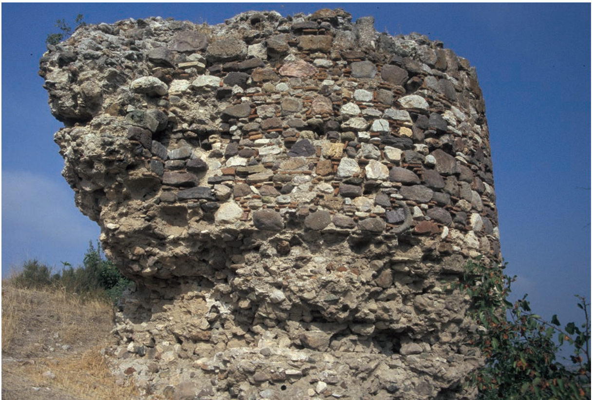
47 Attaos, Turm der Befestigung