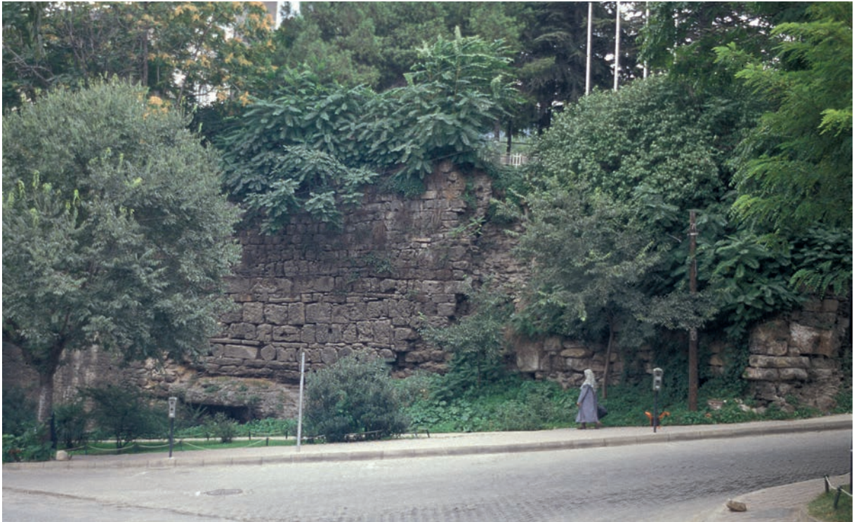
254 Prusa, byz. Stadtmauer (1997)