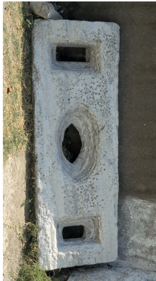
146 Lampsakos, Marmorplatte