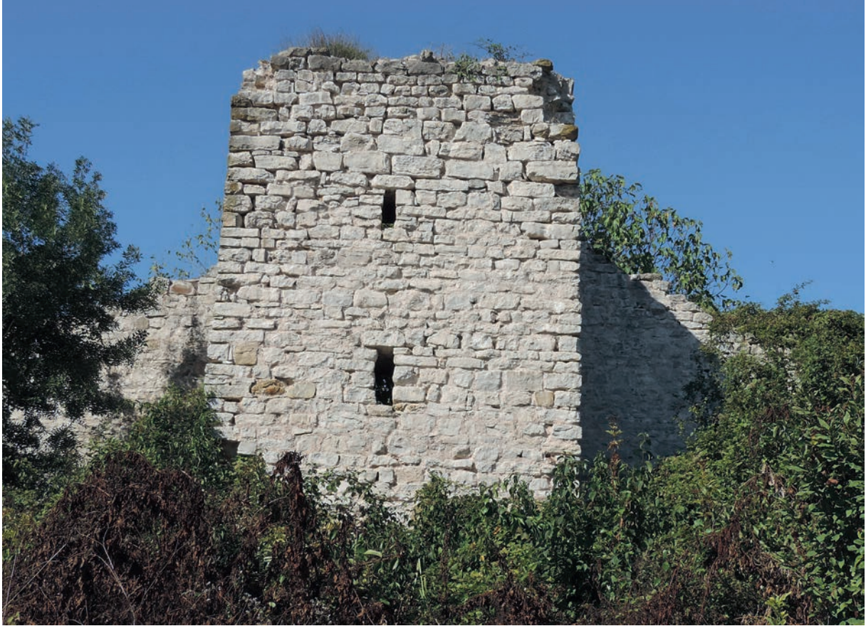
90 Harmantepe Kalesi, Turm mit Schlitzfenstern