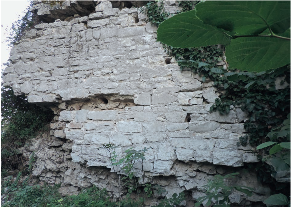
280 Seyfiler Kalesi, Kurtine, Detail des Mauerwerks