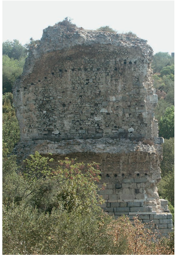
140 Kyzikos, Amphitheater