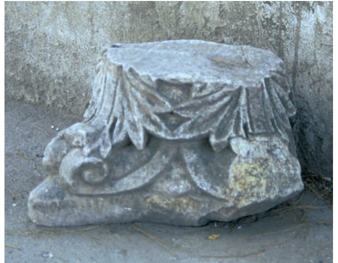
30 Akhisar, Kompositkapitell