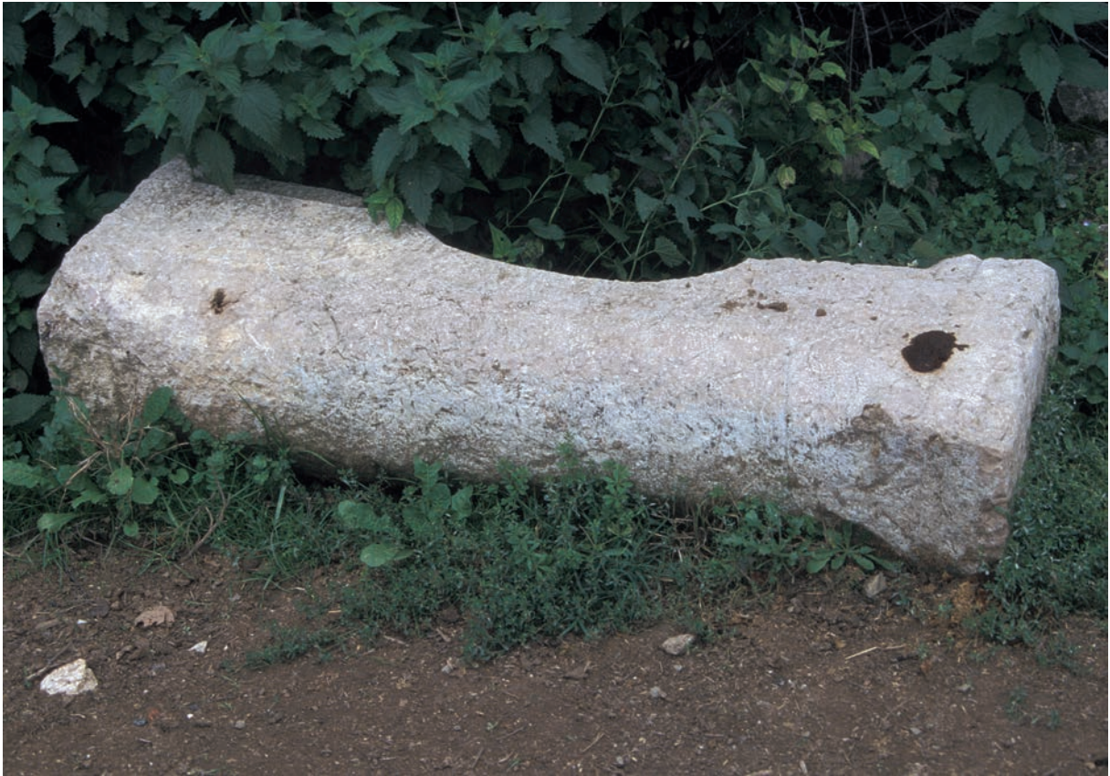
325 Yeniyrük, Doppelsäule