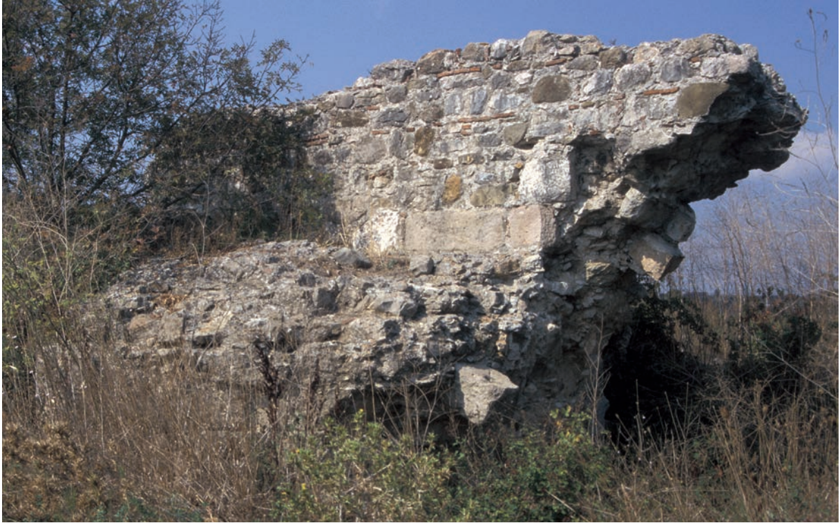
32 Akköprü, Brücke über den Granikos, Pfeiler