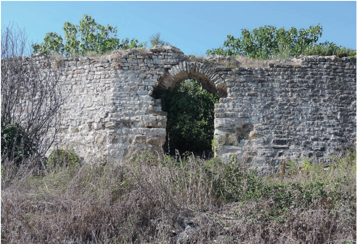
89 Harmantepe Kalesi, Kurtine mit Tor