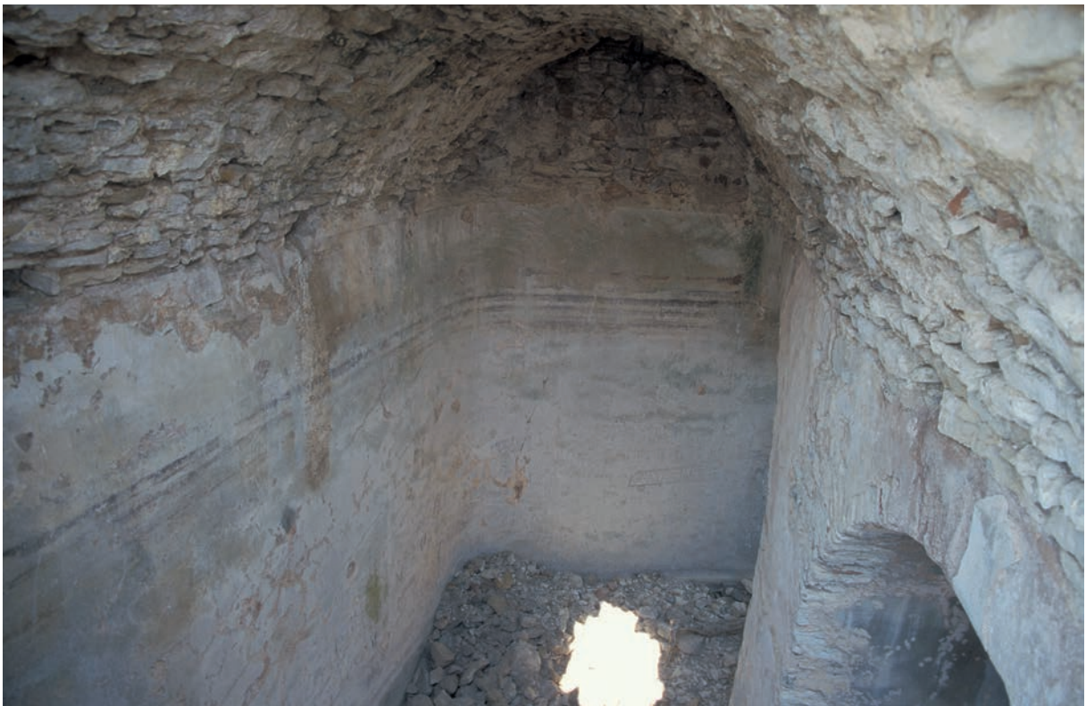
136 Kremastē, überwölbte Zisterne