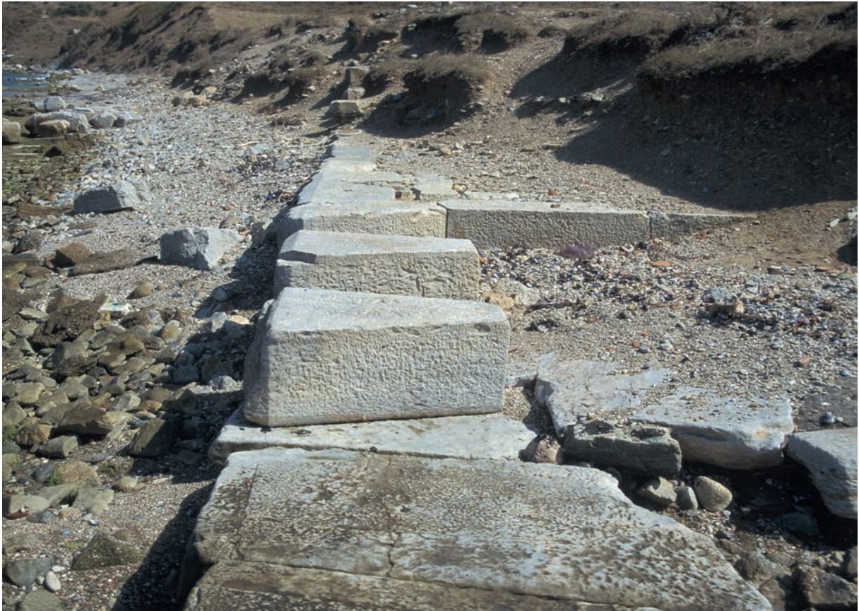
229 Parion, Kaimauern am Nordhafen