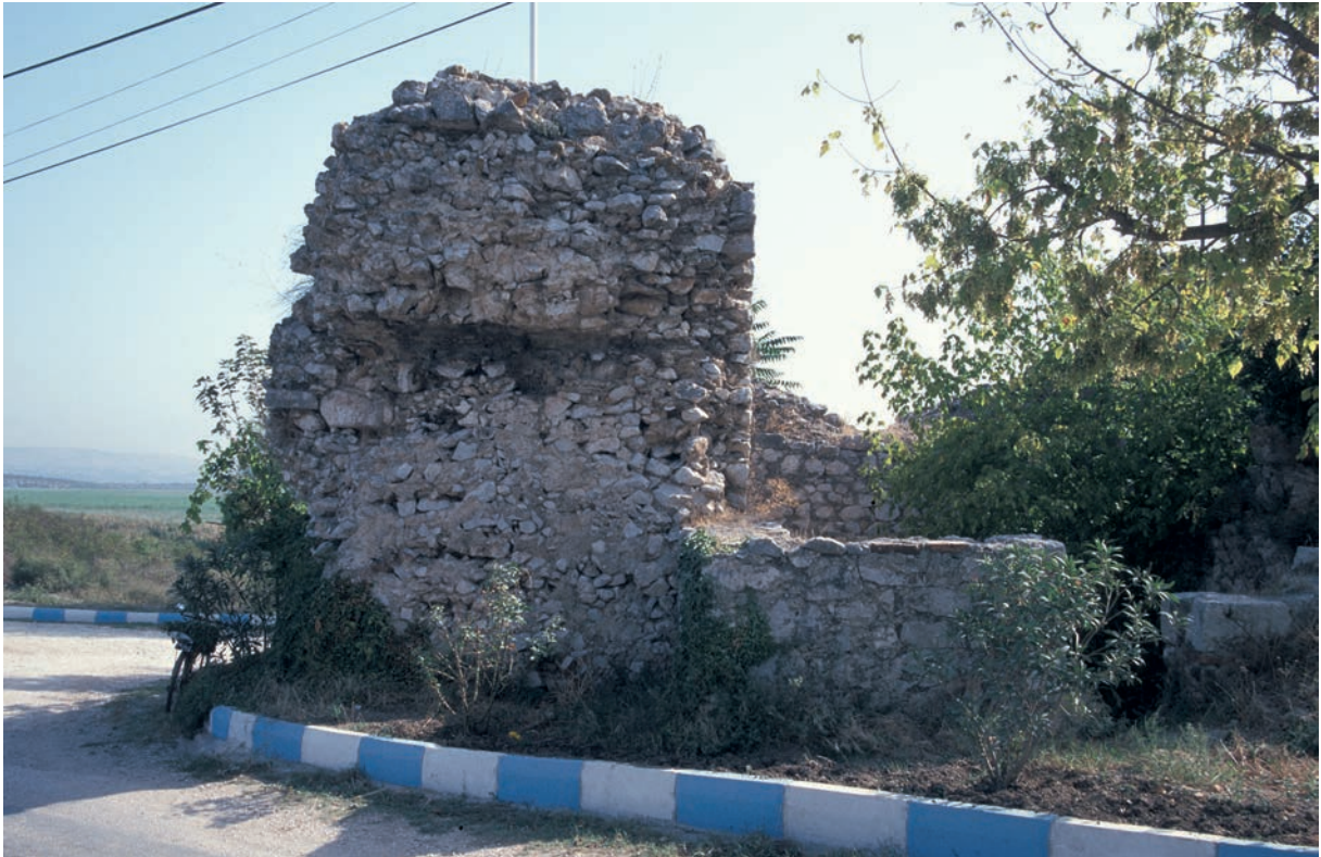
42 Apollōnias, byz. Ummauerung des Zamblak Tepe