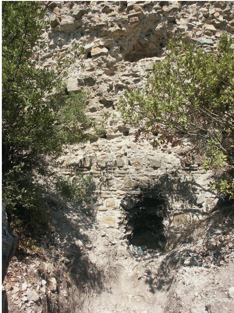
24 Actos (Aydos Dağı), NO-Turm