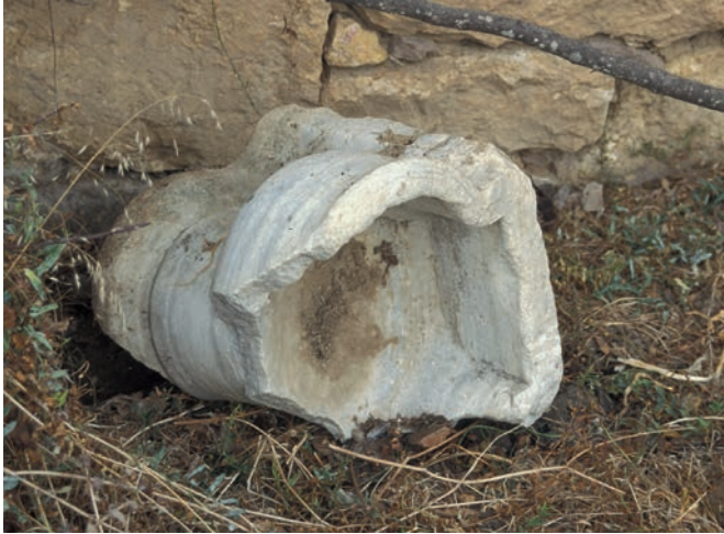
302 Tepeköy, Wasserschale aus Marmor (wohl osman.)