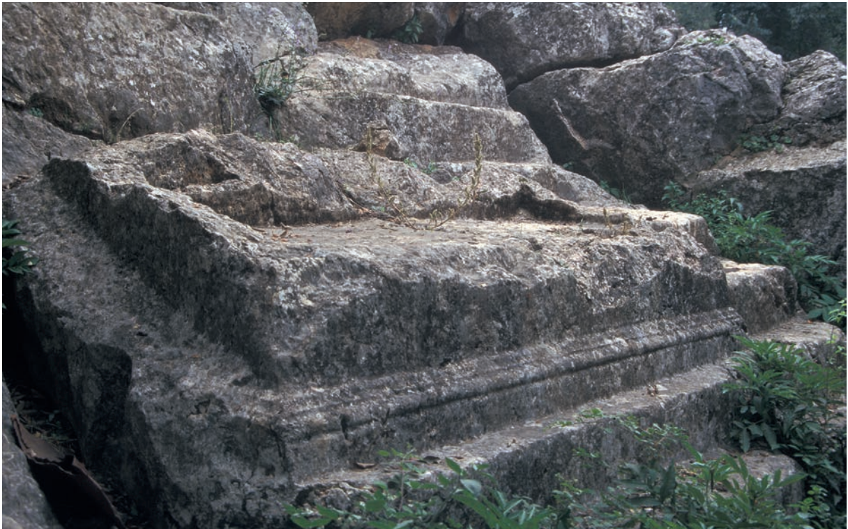
323 Yeniyürük, monumentale antike Grabanlage