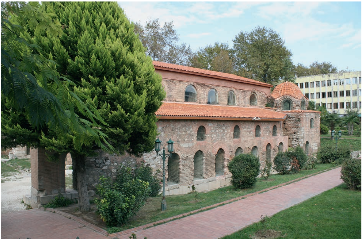
202 Nikaia, H. Sophia von SW, Zustand 2009