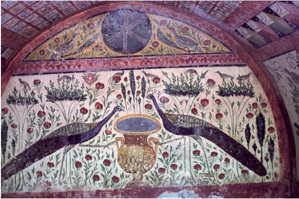
206 Nikaia, frühchristl. Hypogäum bei Elbeyli, Pfauen vor den Beschädigungen