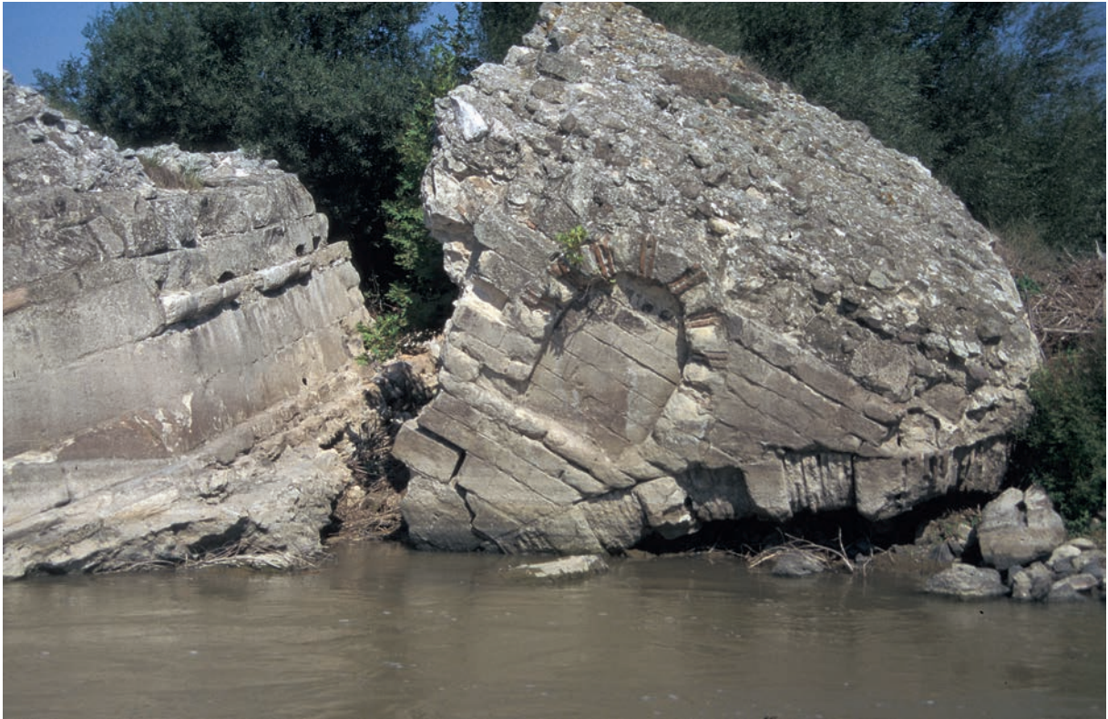
288 Sultançayır, Brücke, verstürzte Pfeiler