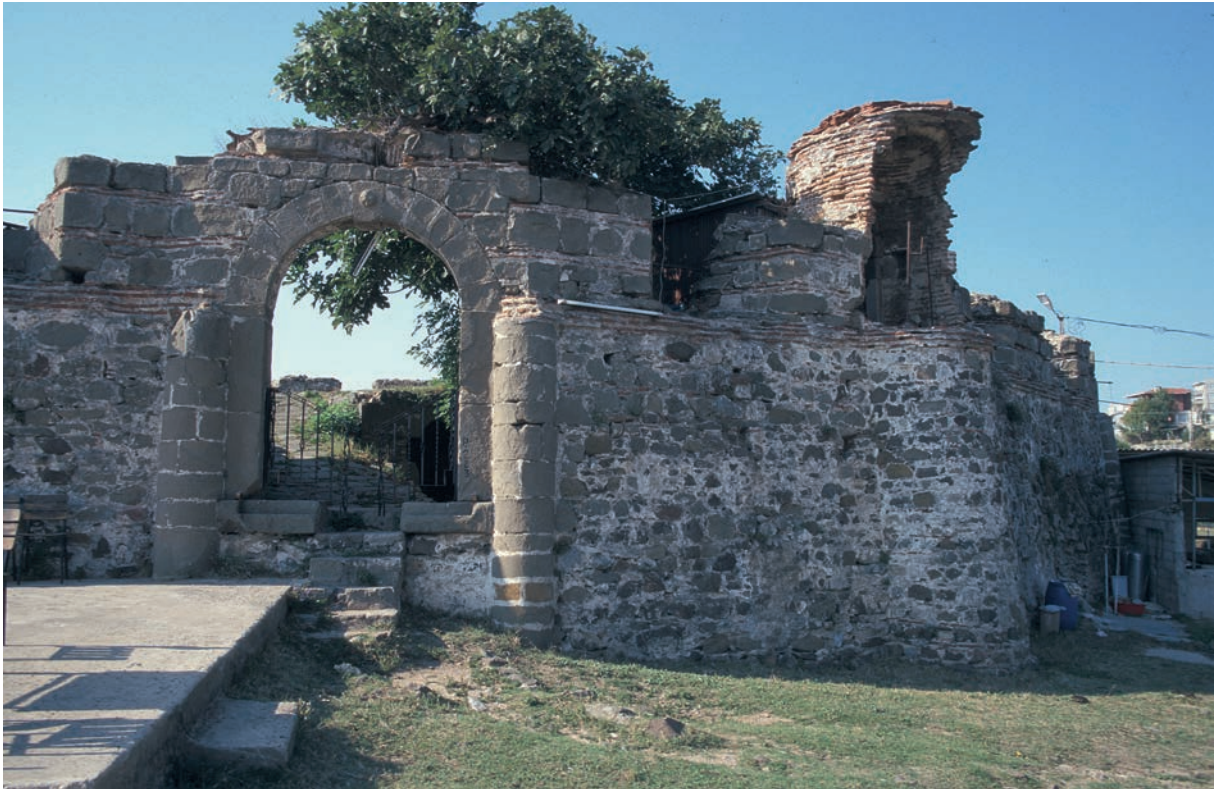
267 Rēbas (1), osmanische Burg, Eingang