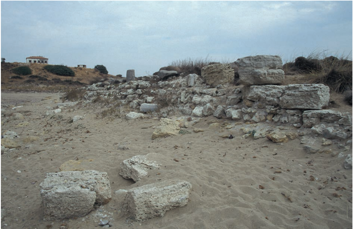
320 Trōas (1), Reste des nördlichen Wellenbrechers am äußeren Hafen