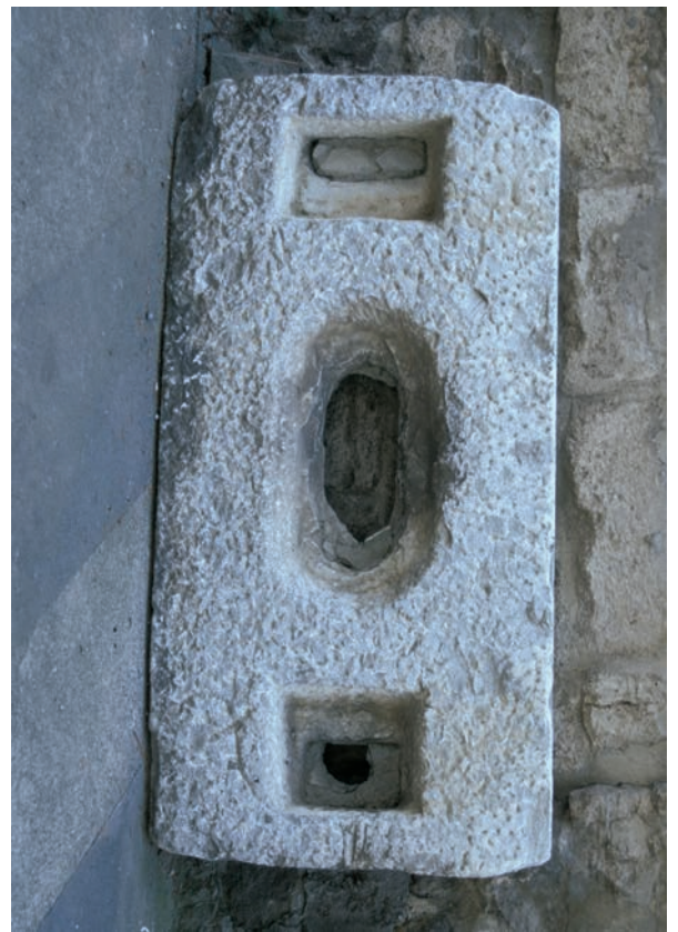
174 Modrënë, Platte