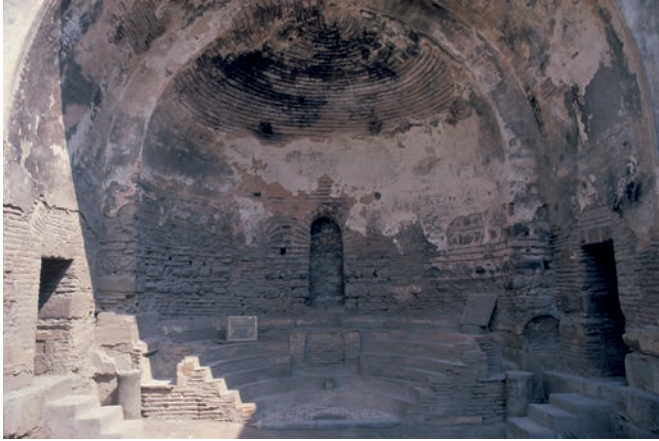
203 Nikaia, H. Sophia, Hauptapsis mit Synthronon, Zustand 1997