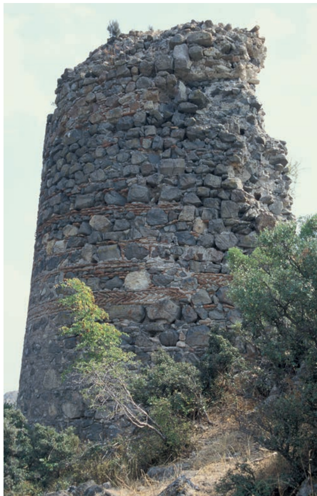
131 Kremastē, Turm 2