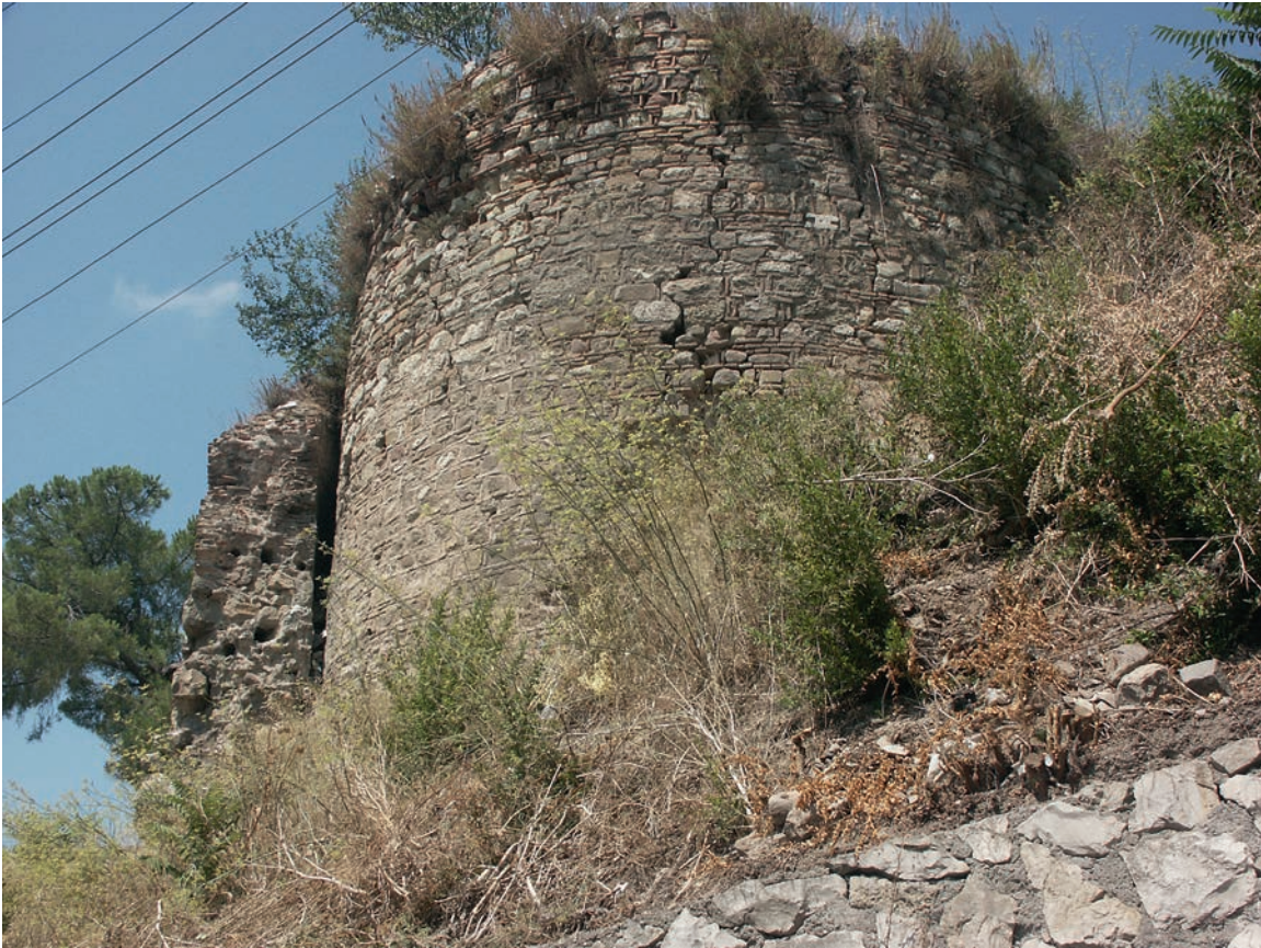
216 Nikomēdeia, Turm 16 (Zählung Foss) mit späterer Verstärkung durch neue Außenschale