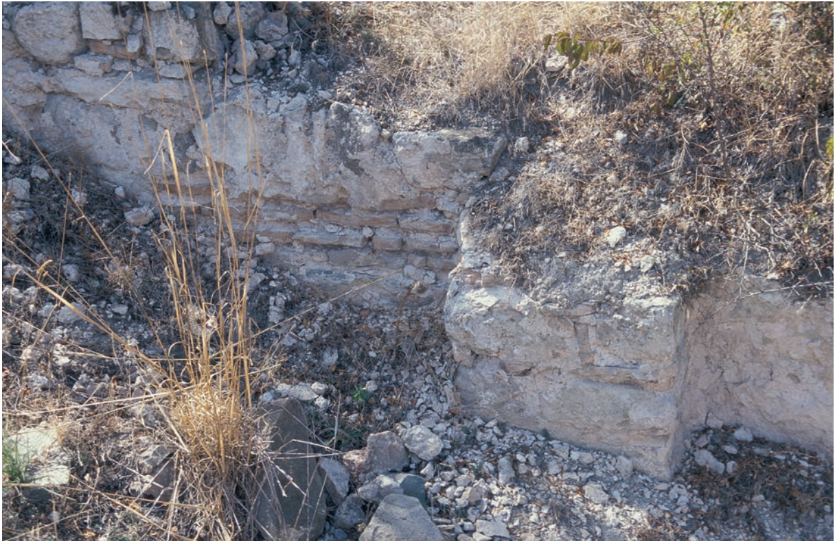
175 Modrēnē, Burg, Rest einer (byz.?) Mauer