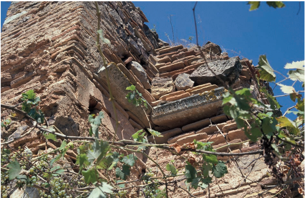
168 Metamorphōsis Christu auf Antigonu Nēsos, mittelbyz. Gesims in situ