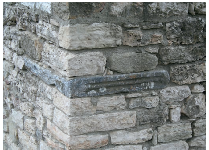
121 Kıranışıklar, Şahinbaba Türbesi, byz. Architekturfragment