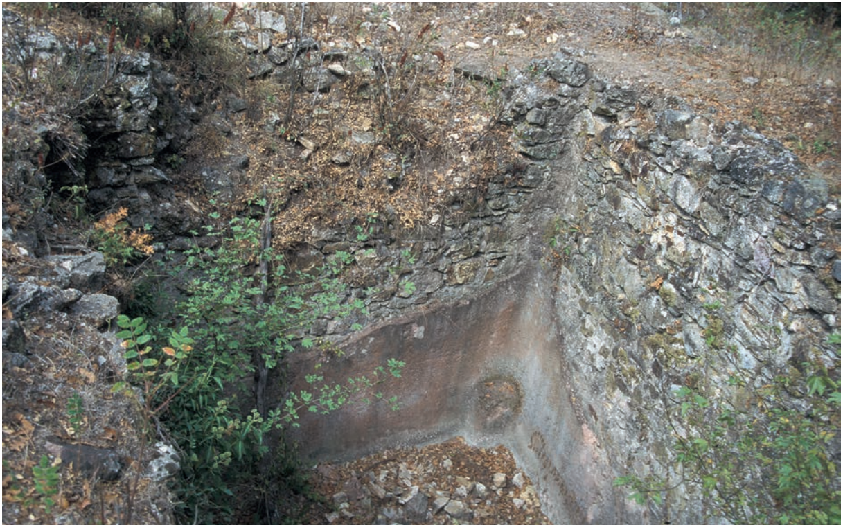
277 Sapan Kalesi, Zisterne