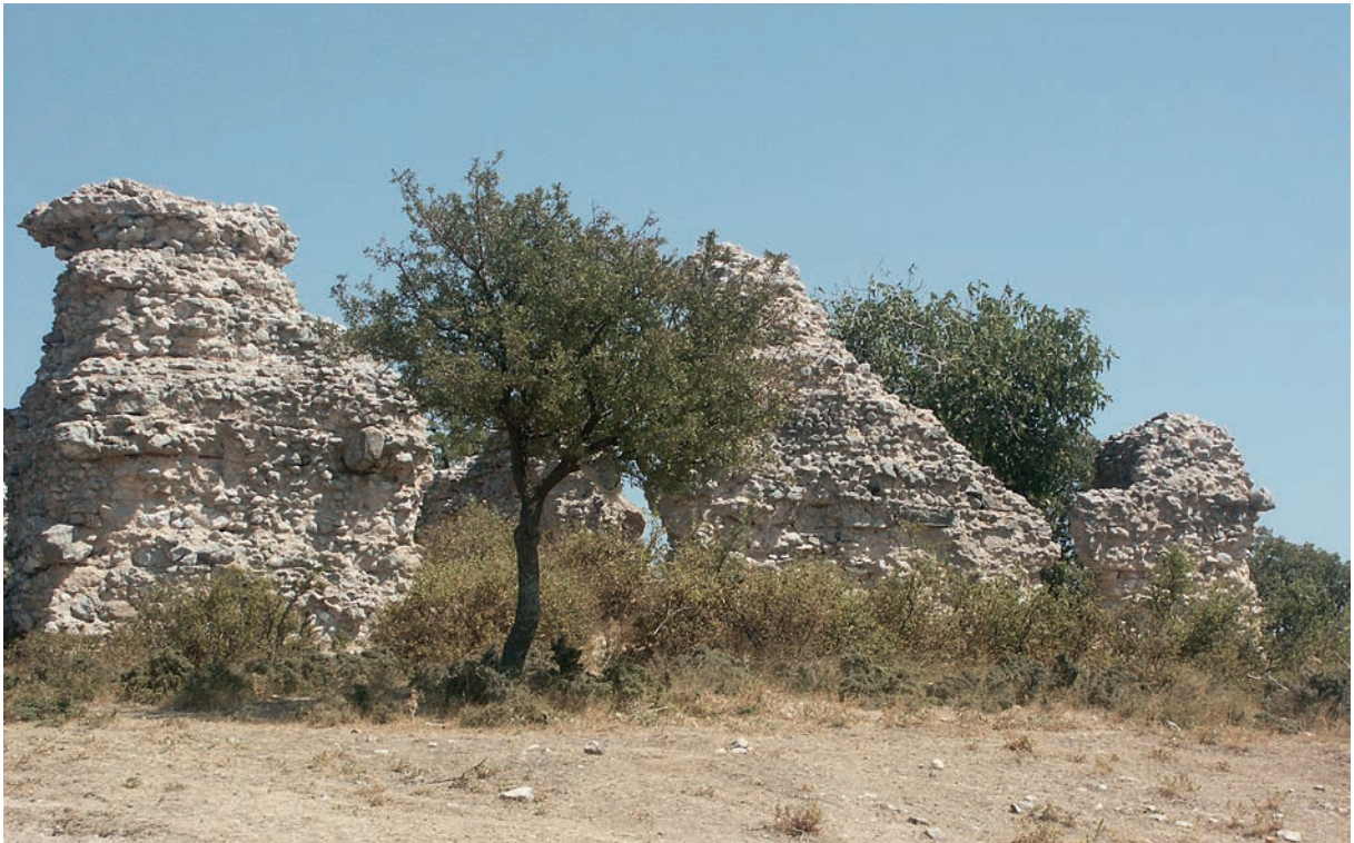
49 Babayaka Kalesi von außen