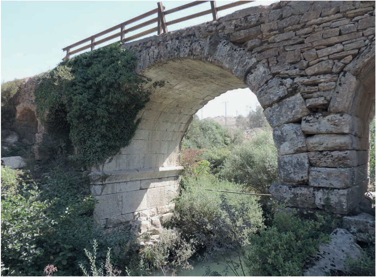
296 Taşköprü (1), alte Brücke, zentraler Bogen