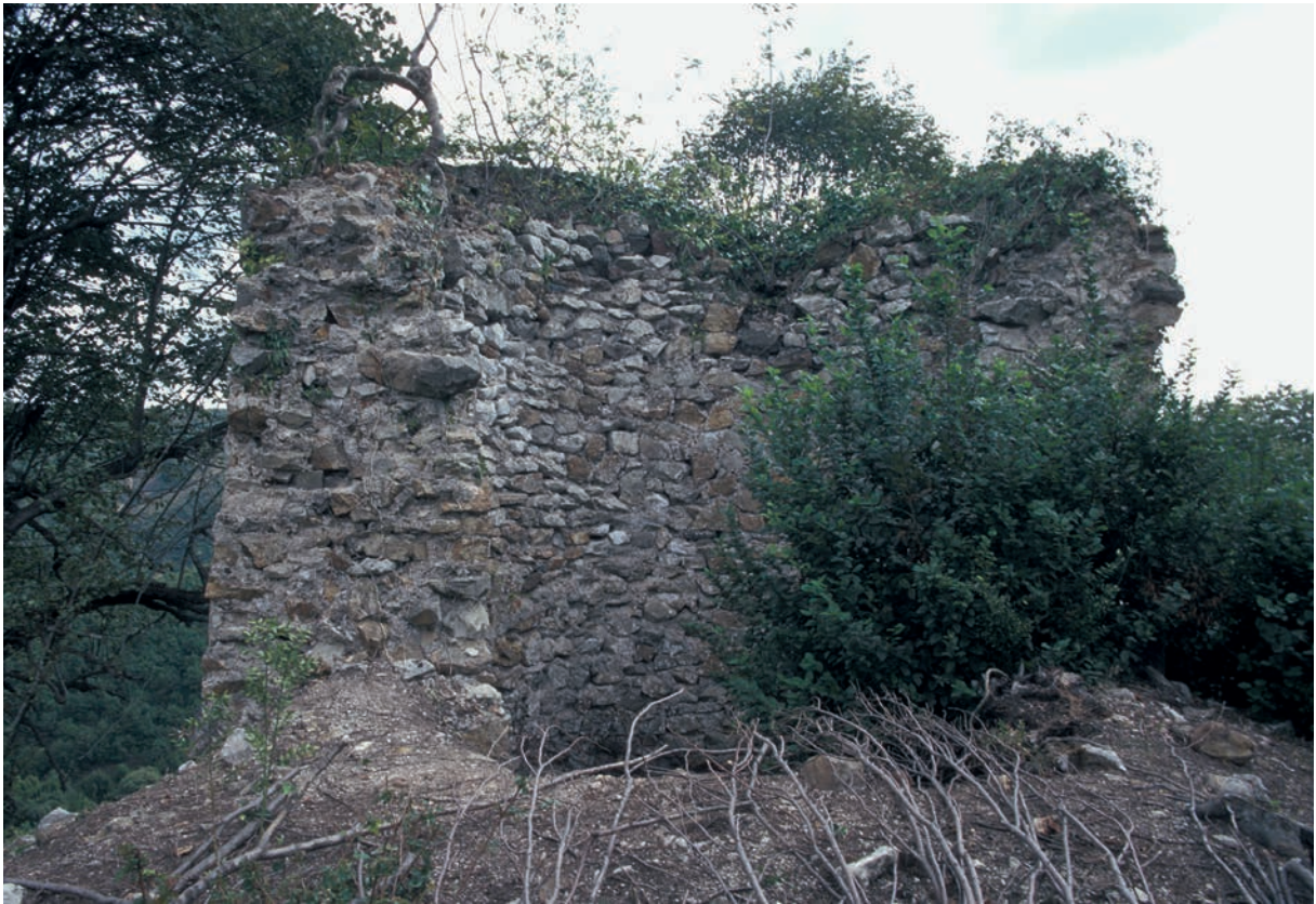
93 Heciz Kalesi, Turm, Innenseite