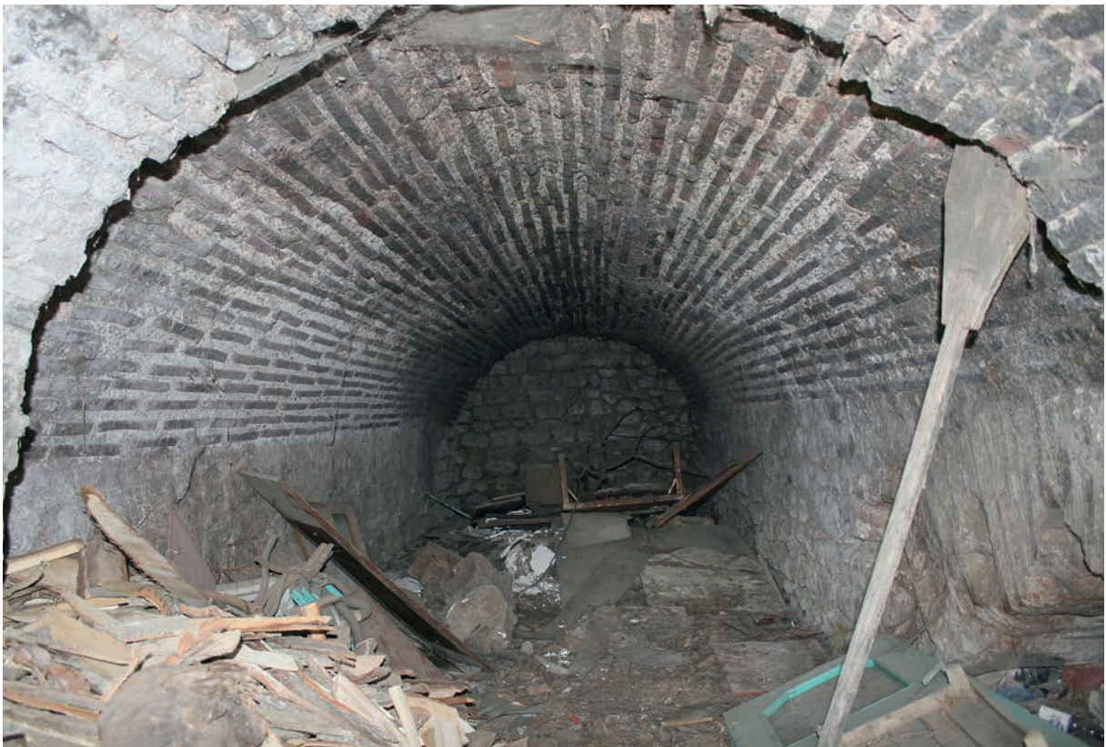
191 Neokaisareia, byz. Bau (Befestigung?) mit antiken Quadern, tonnenüberwölbter Raum