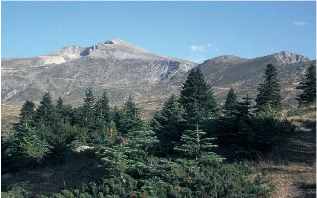
3 Olympos, Hauptgipfel