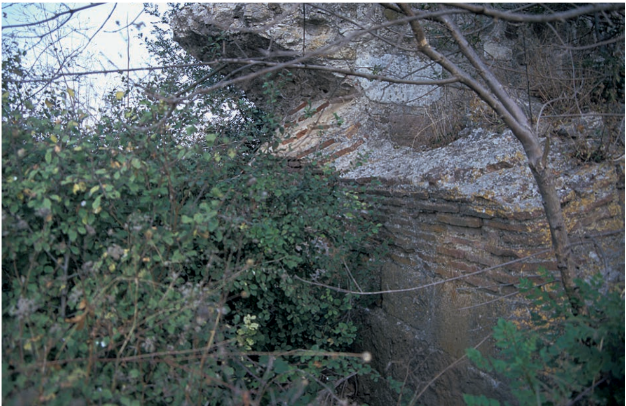
33 Akköprü, Brücke über den Granikos, Ansatz eines Bogens