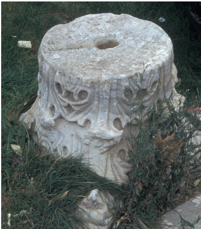
185 Neochōraki, Kompositkapitell