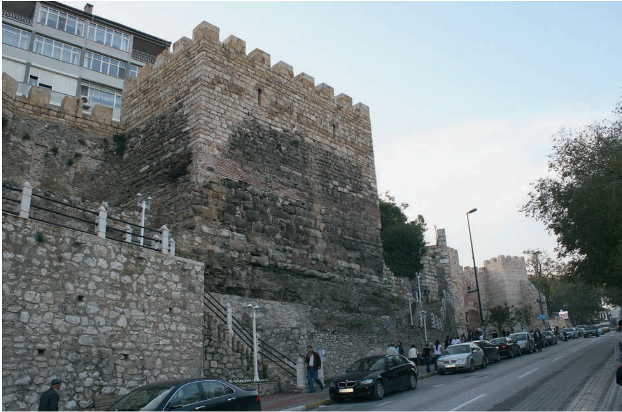
256 Prusa, teilweise wieder aufgebauter Turm der byz. Stadtmauer (2009)