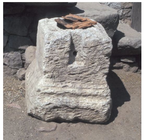
271 Sağırlar, antiker Stein, umgearbeitet zu Gegengewicht einer Mühle