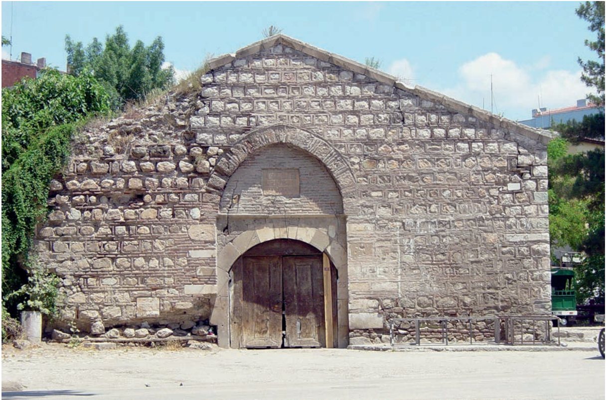
300 Tattaios, Spolien im osman. Han von Gölpazarı