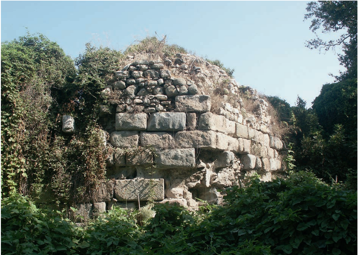
137 Kyzikos, Stadtmauern im S von außen