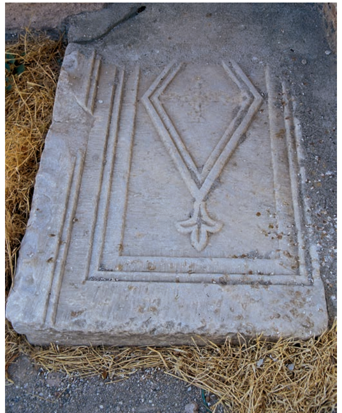
311 Tragasai, byz. Schrankenplatte an der Murat Hüdävendigâr Camii