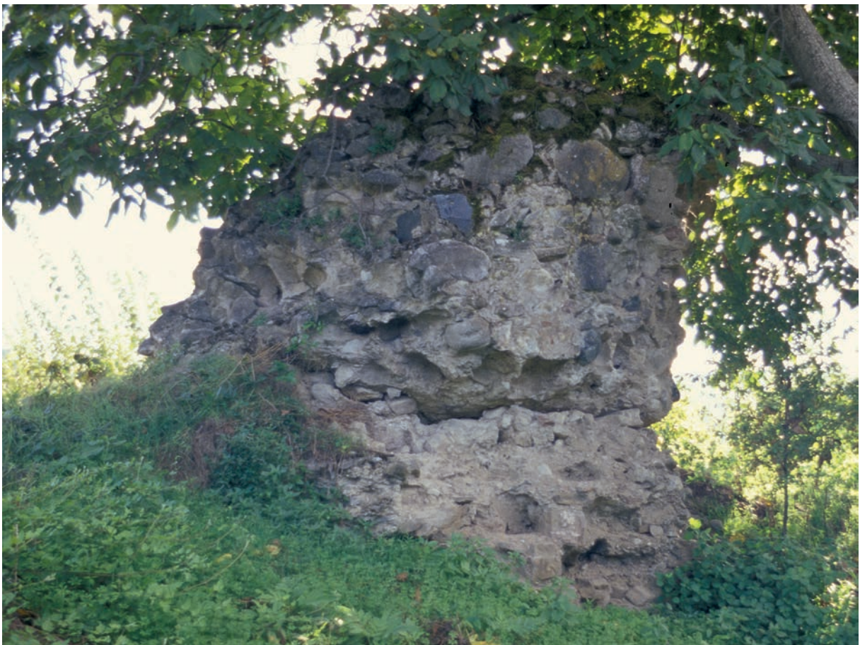
156 Makağā, Rest der Ummauerung