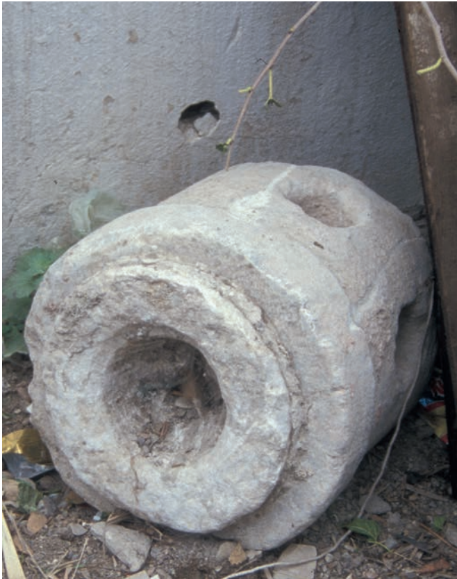
183 Neochōraki, Muffe einer steinernen Wasserleitung mit Verteilerauslässen