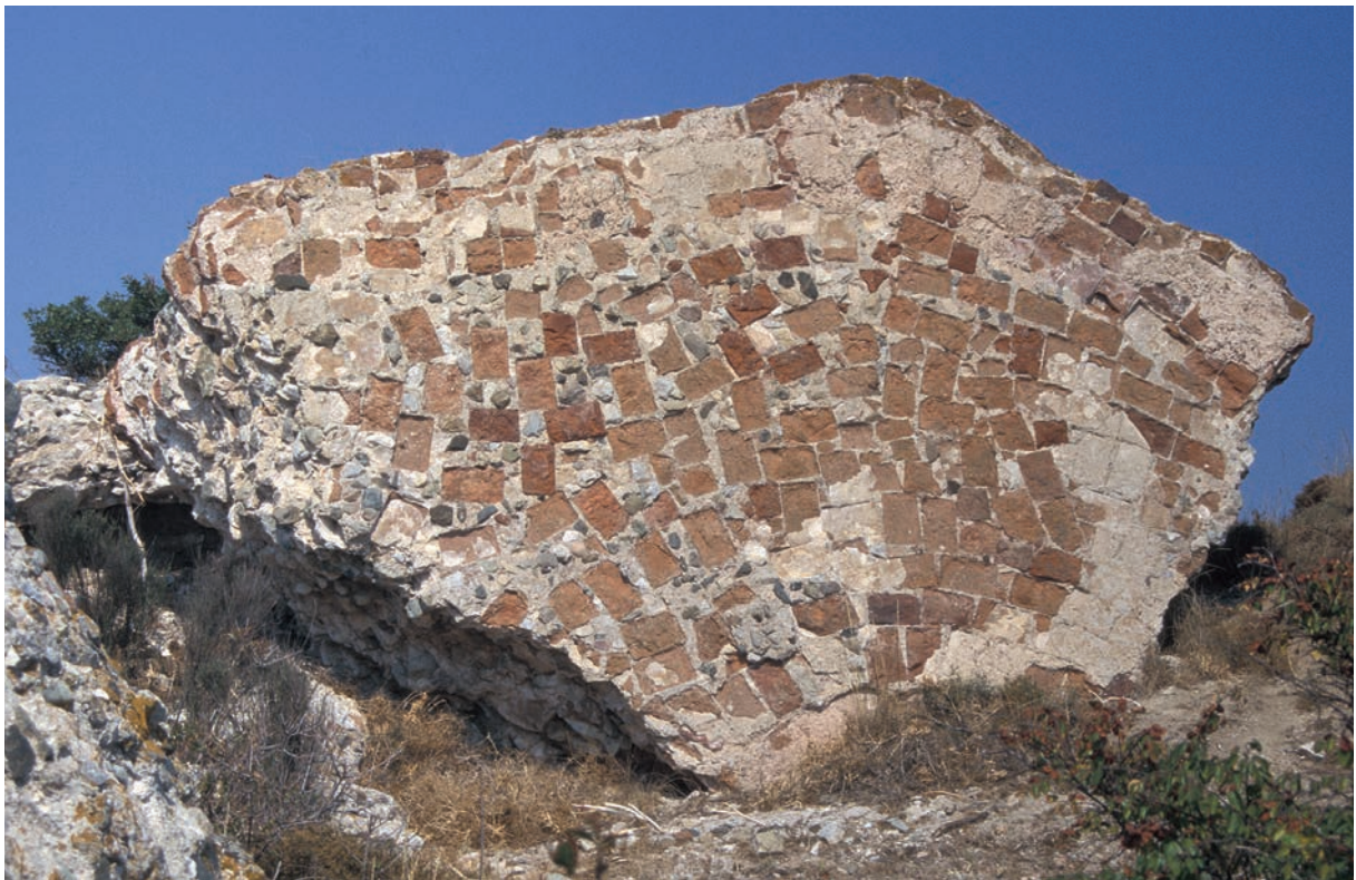
233 Pēgai, Turm der Stadtmauer, Plattform zum Aufstellen von Geschützen