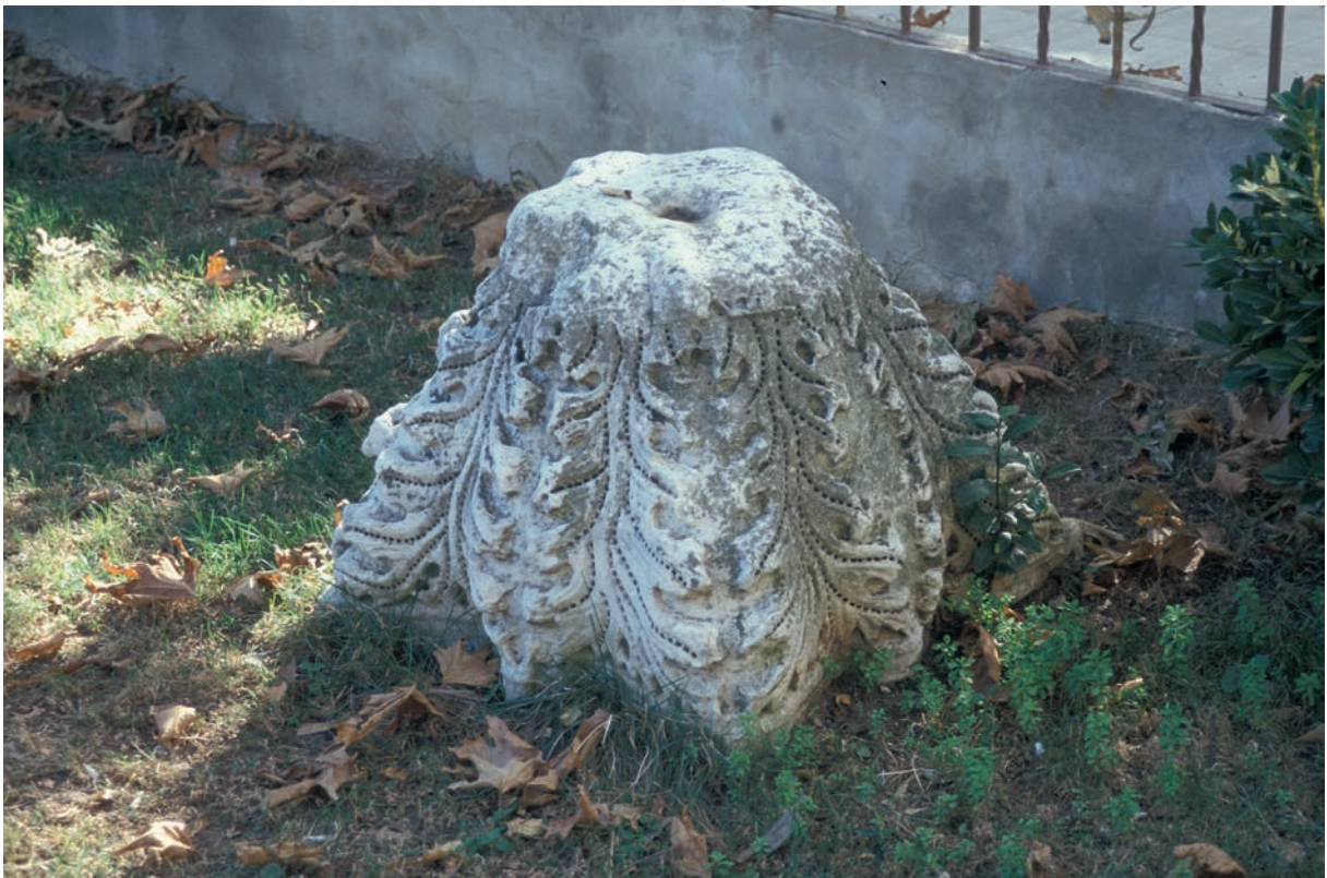
253 Prōtē, Genethlia Theotoku, Kapitell