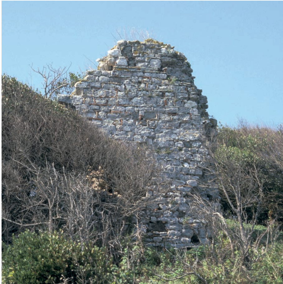
70 Daphnusia, Befestigung, byz. Rechteckturm