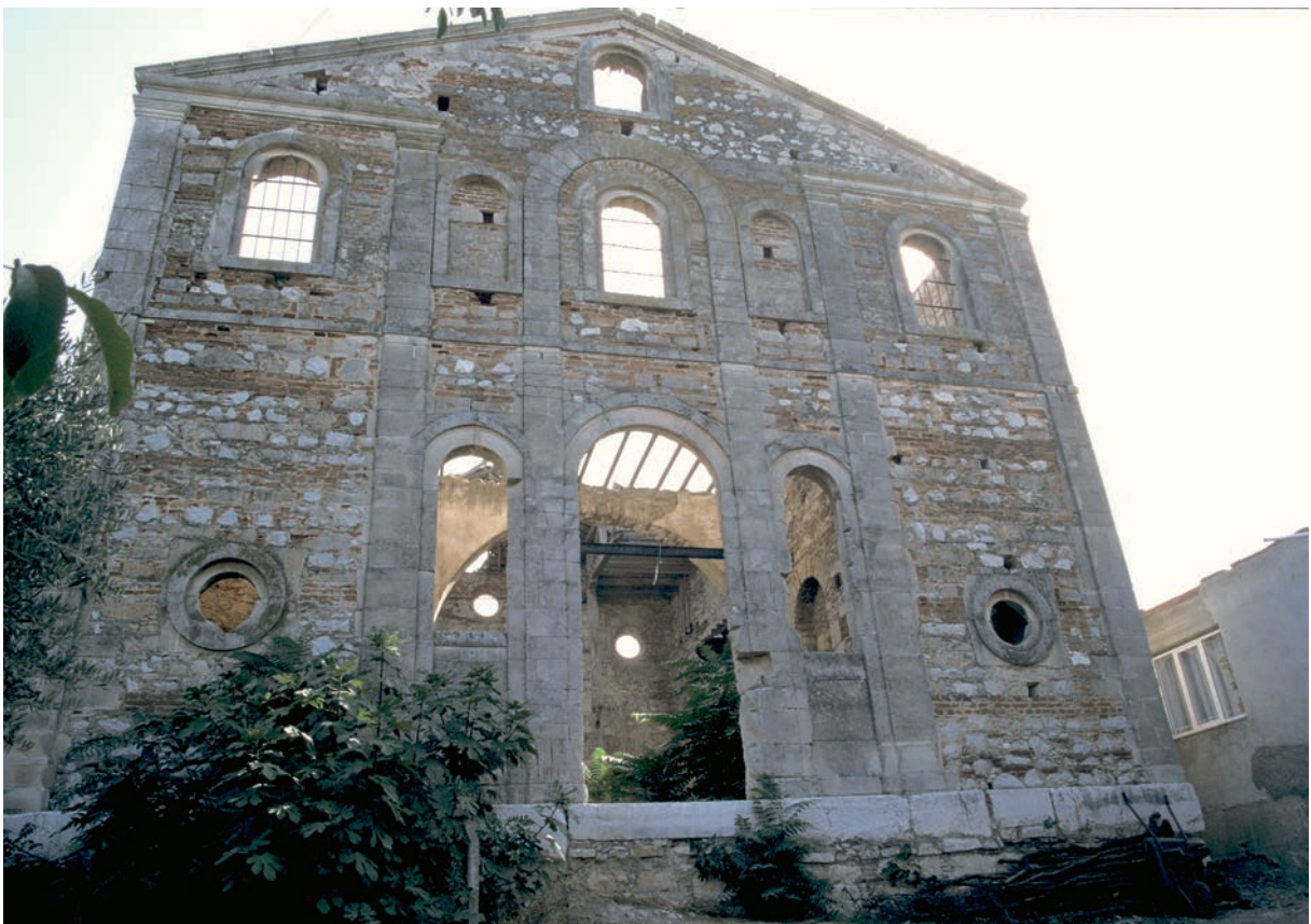
41 Apollōnias, neuzeitl. Kirche H. Geōrgios, Fassade