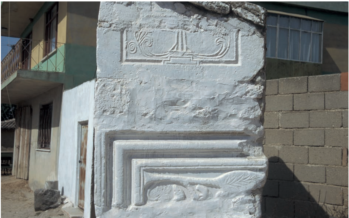
281 Skamandros (1), Schrankenplatten