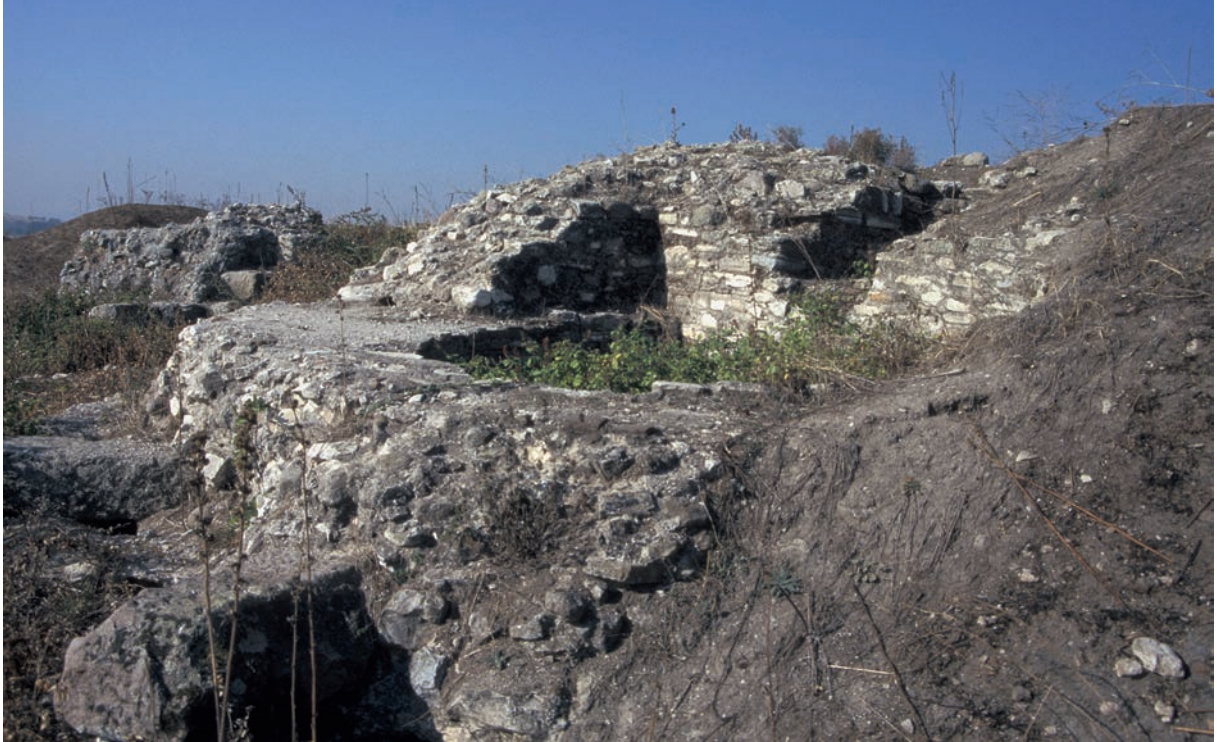
73 Daskyleion (2), byz. Befestigung