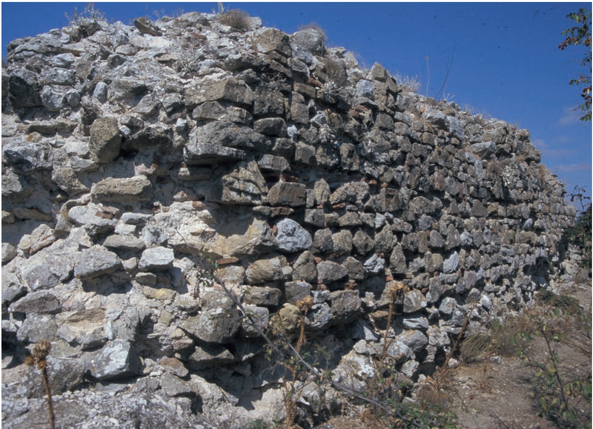
221 Palaia, Kurtine, nördlicher Teil