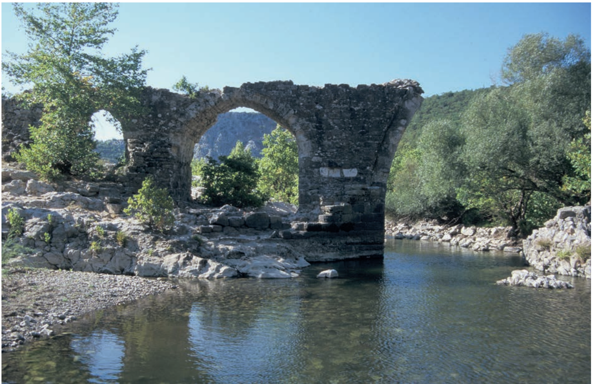
223 Palaia, alte Brücke