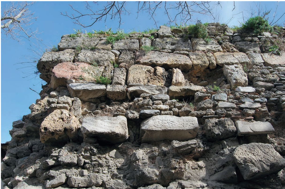
257 Prusa, byz. Stadtmauer mit späteren Reparaturen