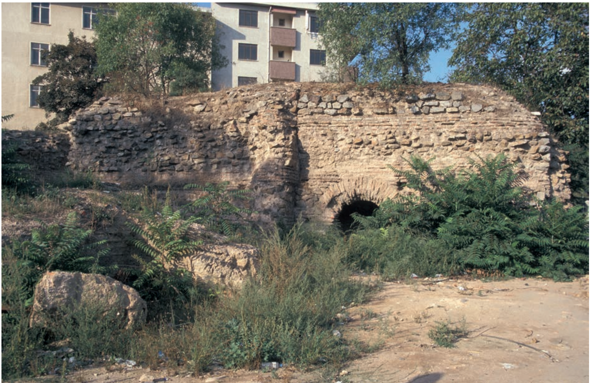
69 Damatrys, Ruinen des Palastes