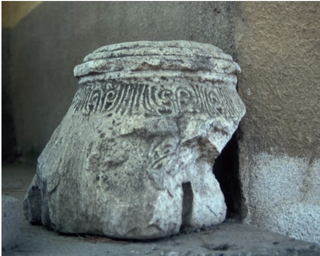
29 Akhisar, Kapitell