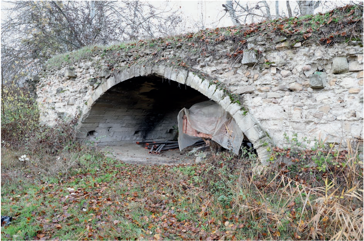
298 Taşköprü (2), alte Brücke, Nebenbogen