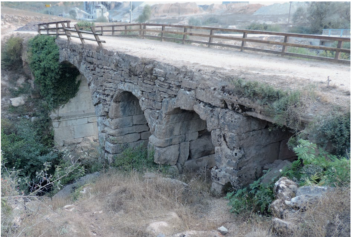
295 Taşköprü (1), alte Brücke von Norden