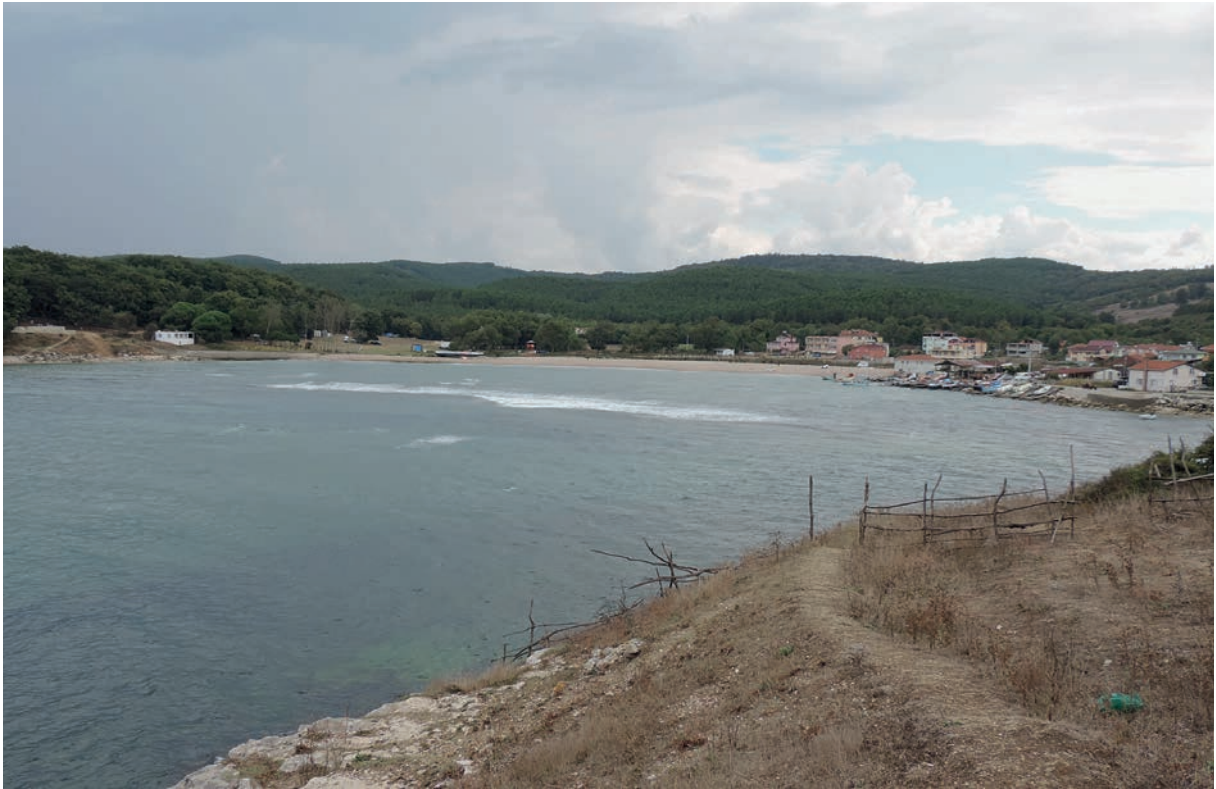
44 Astrabēkē, Hafenbucht