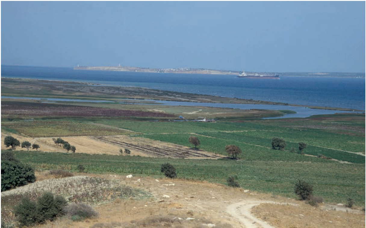
26 Aianteion, Blick vom Tumulus auf die Einfahrt in die Dardanellen