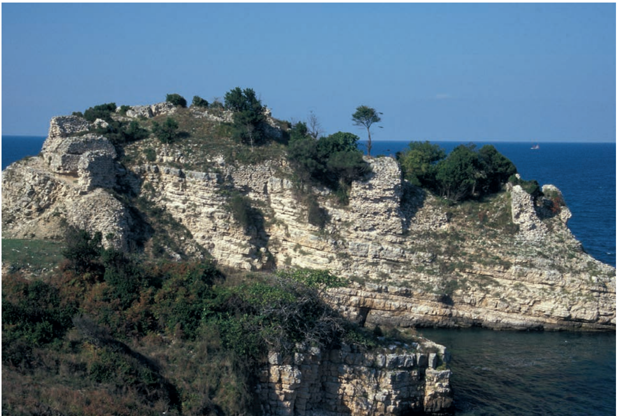
45 Astrabēkē, Burg von Süden