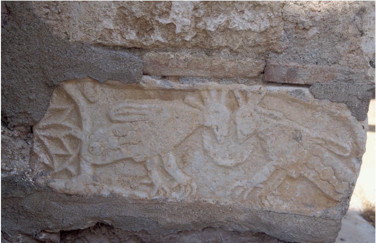
312 Tragasai byz. Architekturfragment mit Pfauen an der Murat Hüdâvendigâr Camii