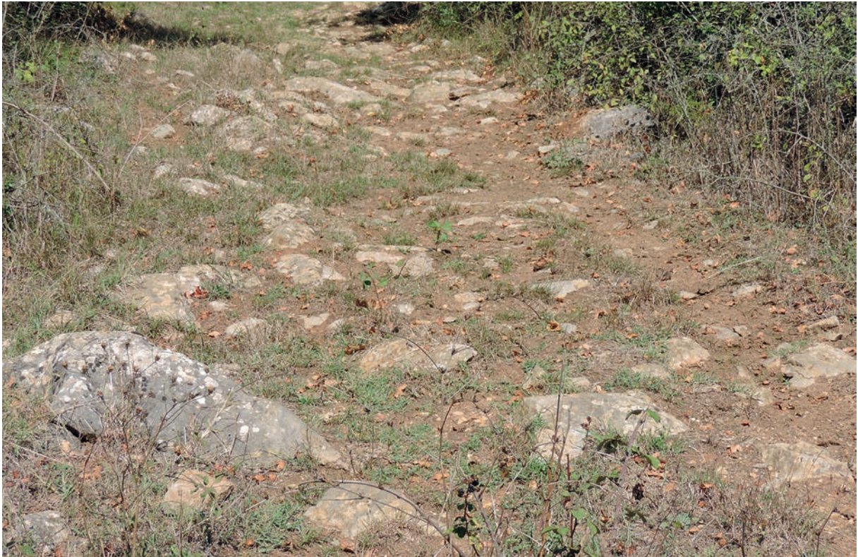
17 Alte Straße bei Yazımanayır