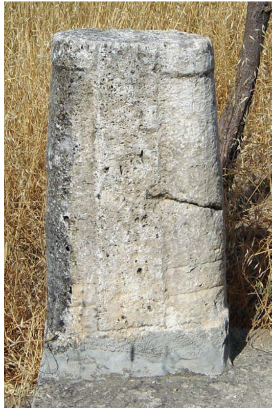
84 Harmankaya, Doppelsäule