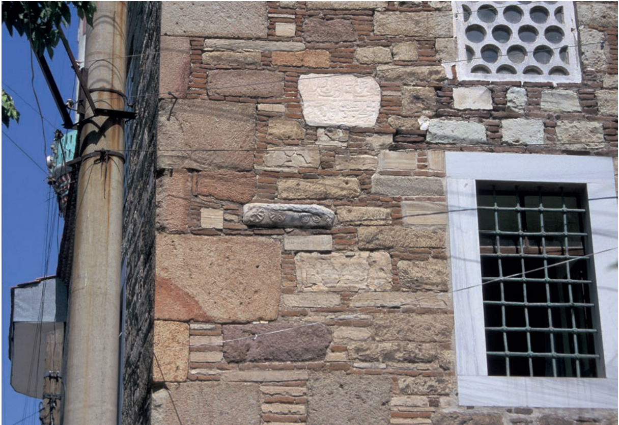
52 Bigadiç, Spolien in der Mauer der Moschee