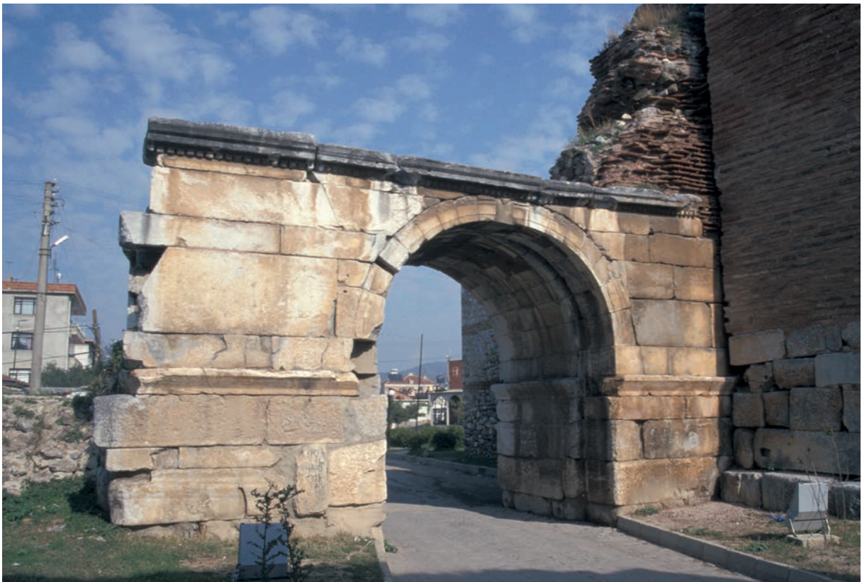
193 Nikaia, Yenişehir-Tor, Rest des röm. Torbogens