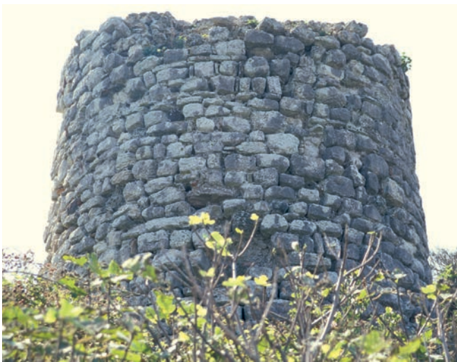
71 Daphnusia, Befestigung, byz. Rundturm