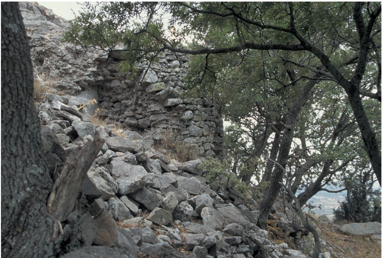
125 Kızkalesi, Turm