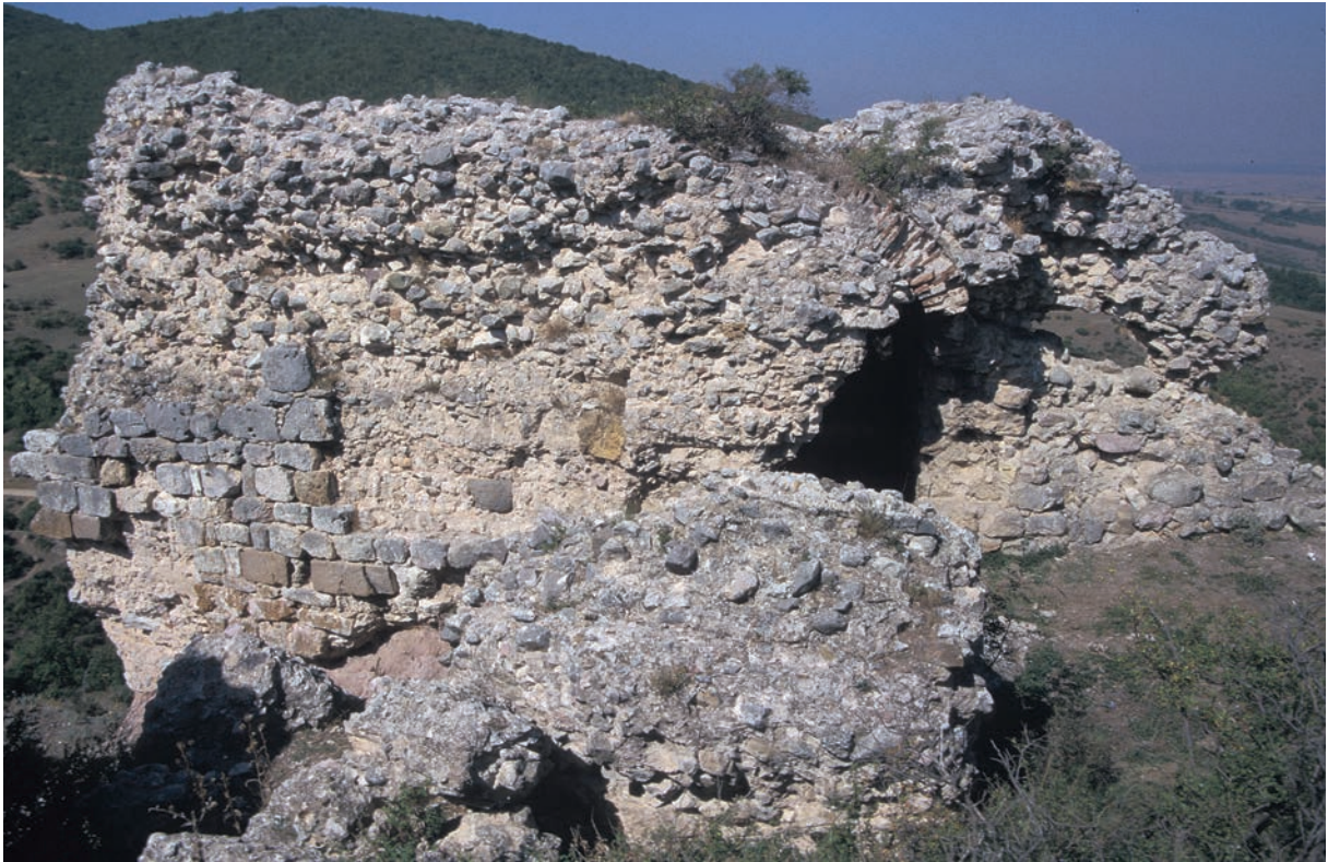
248 Poimanēnon, Rückseite eines Turmes