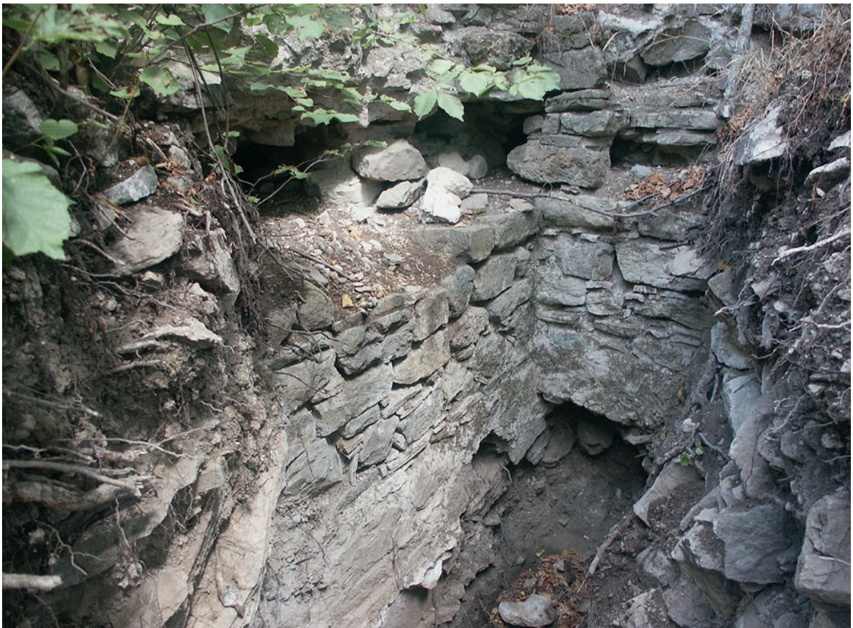
57 Çataltepe, Reste der Burg