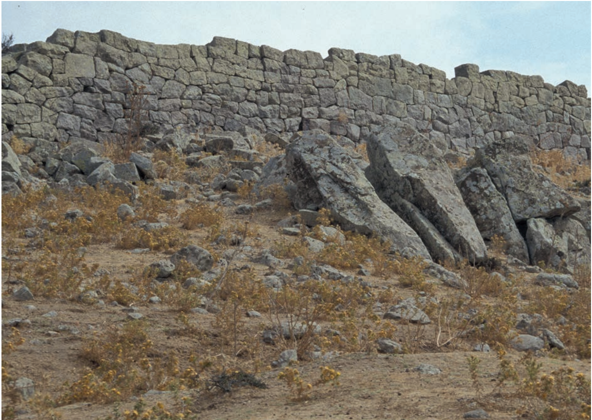
180 Neandreia, Stadtmauer