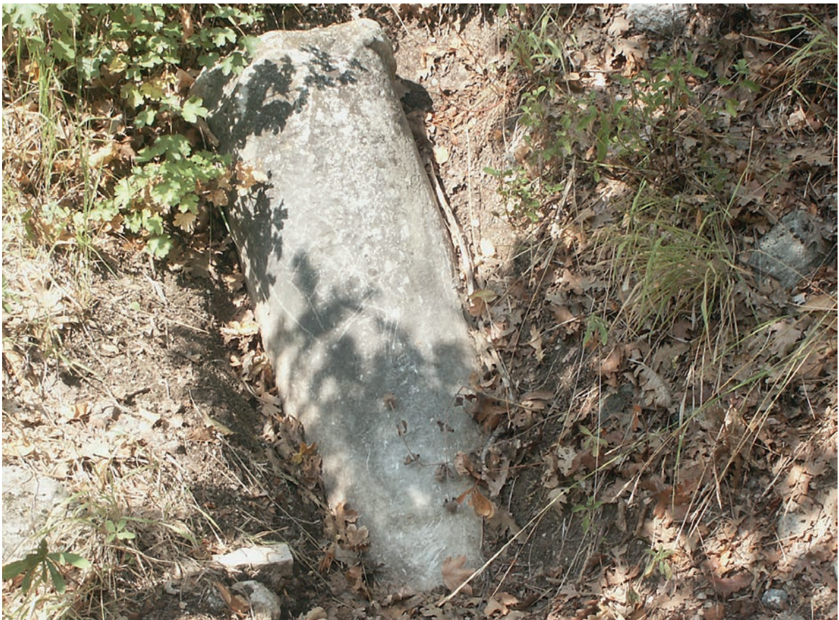
59 Çataltepe, Säule nahe der Kirche