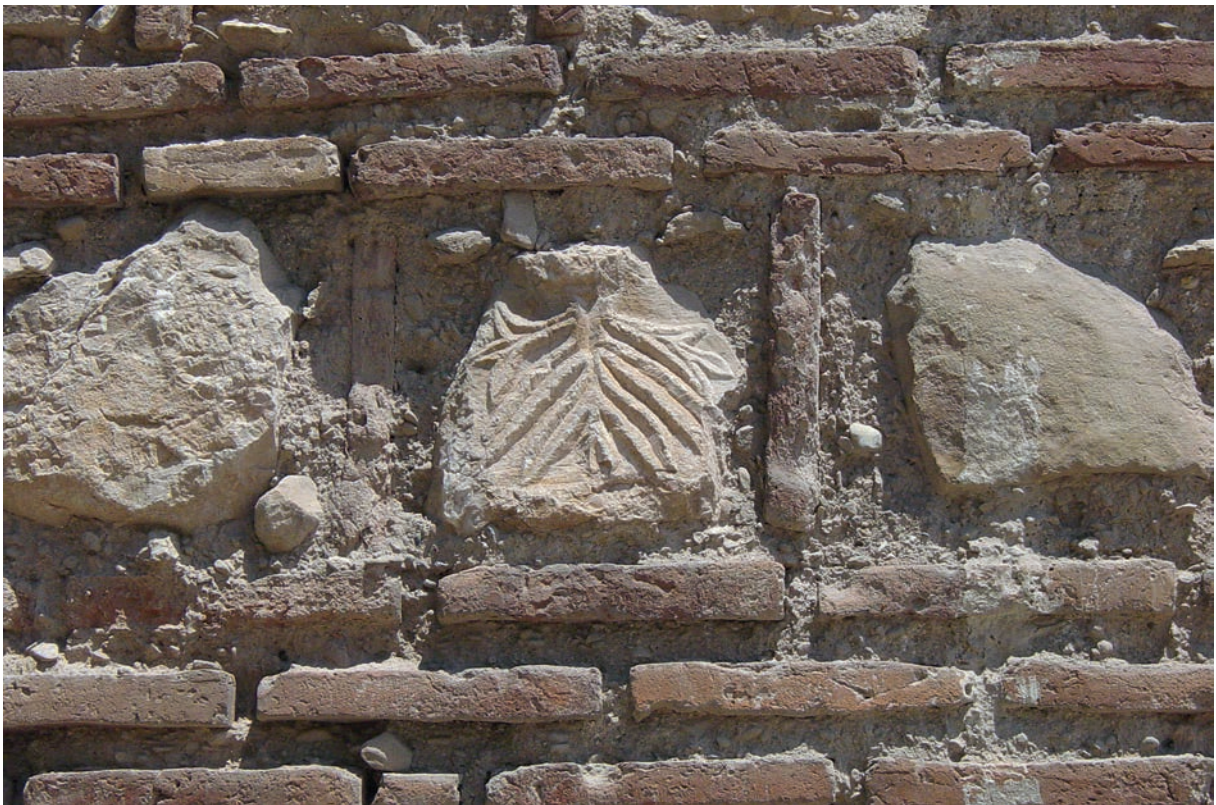
301 Tattaios, Spolien im osman. Han von Gölpazarı, Detail