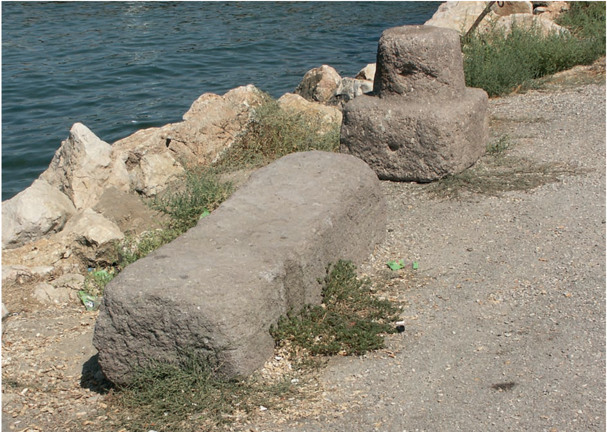
179 Musakça, Architekturfragmente