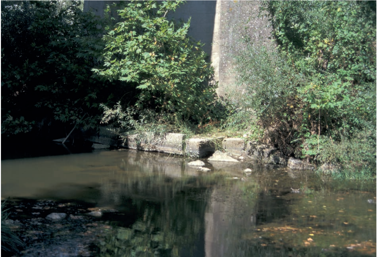
81 Güngörmez Köprüsü, Quader der alten Brücke