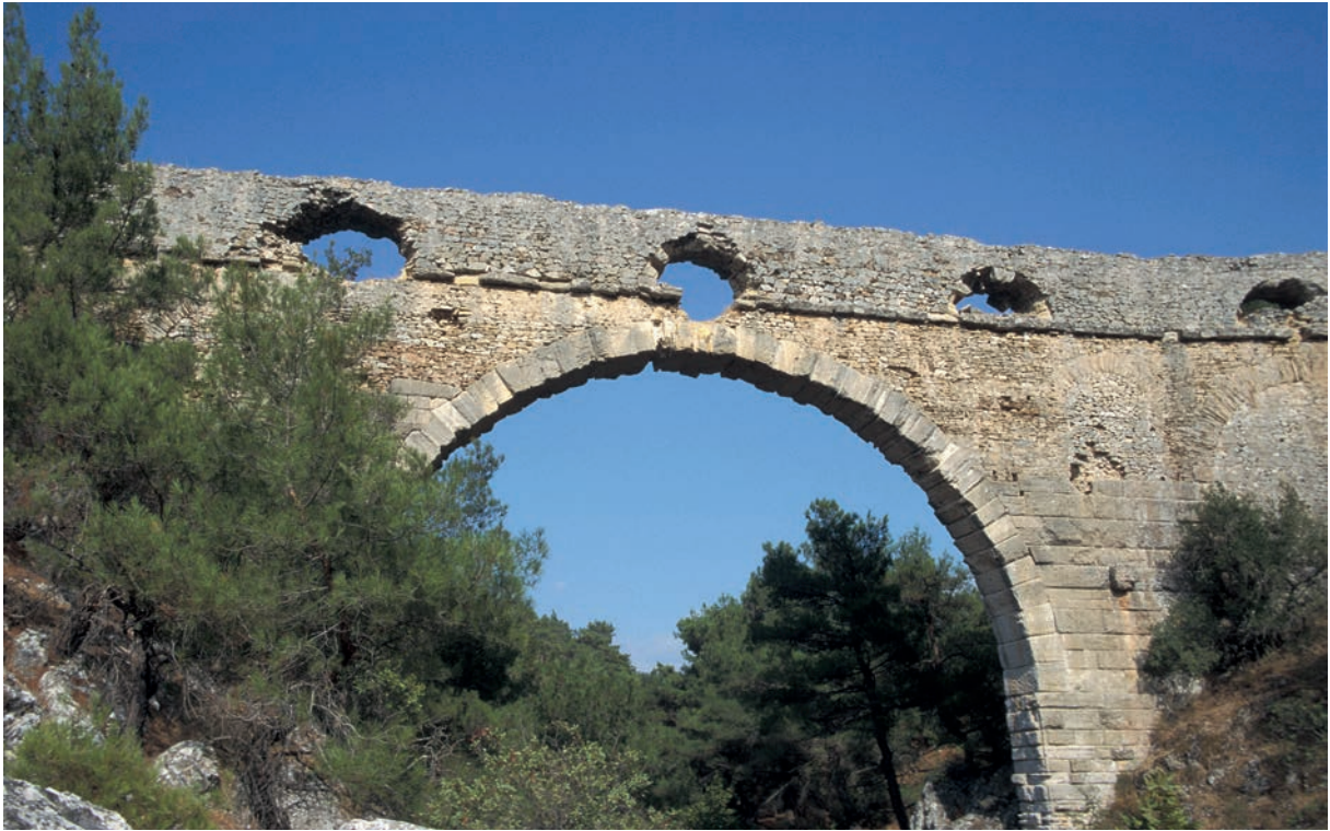
305 Thymbrios, Talbrücke des nach Ilion führenden Aquädukts