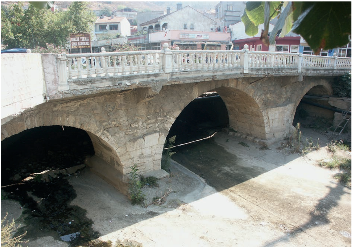
43 Armutlu, alte Brücke