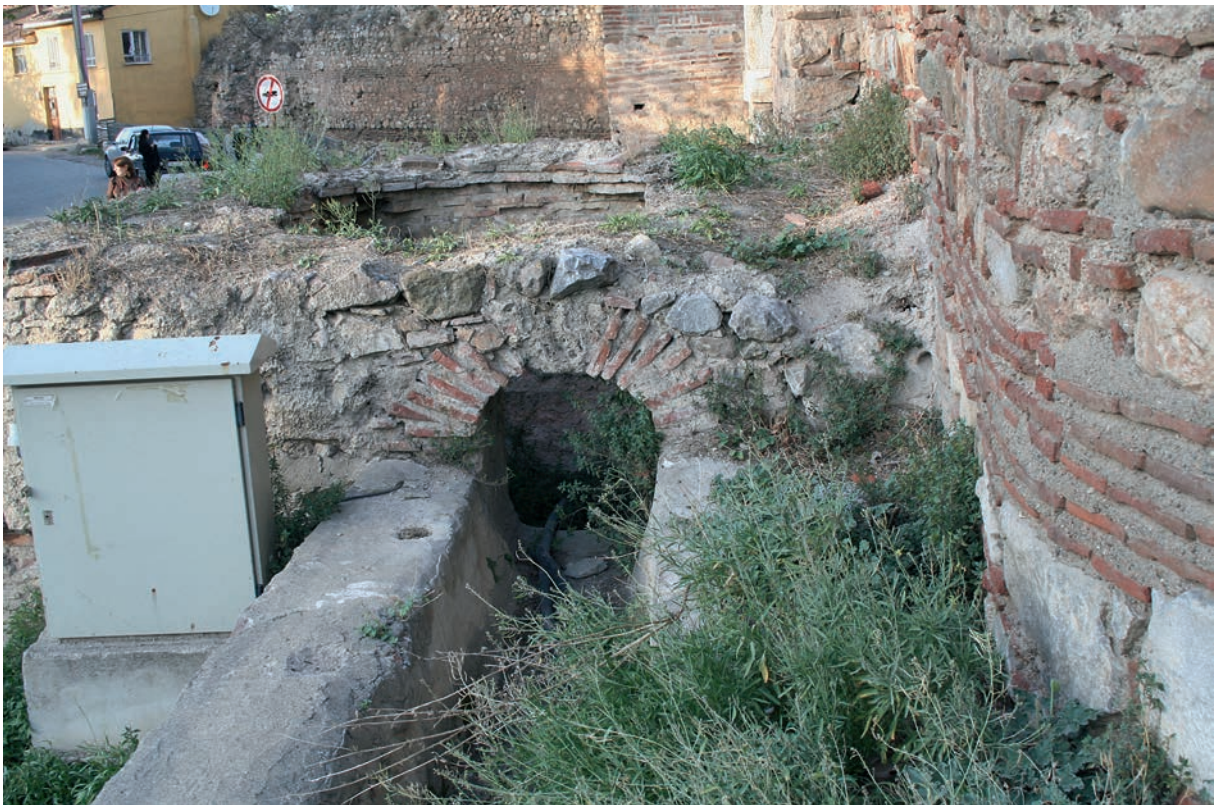
200 Nikaia, Aquädukt, Mündung des Wasserkanals in den Verteilerbehälter