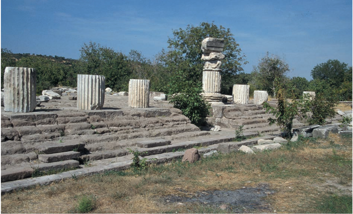
284 Sminthē, Tempel des Apollōn Sminthaios (Zustand 1999)