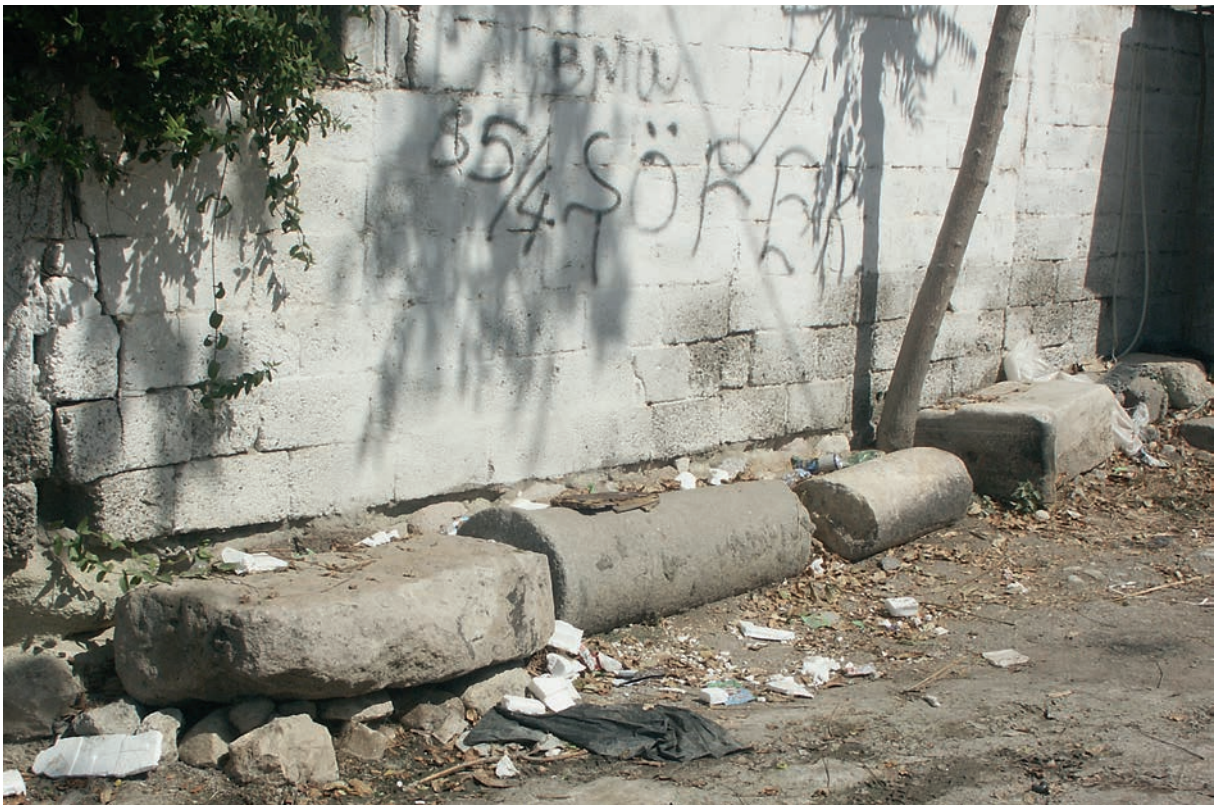
178 Musakça, Architekturfragmente