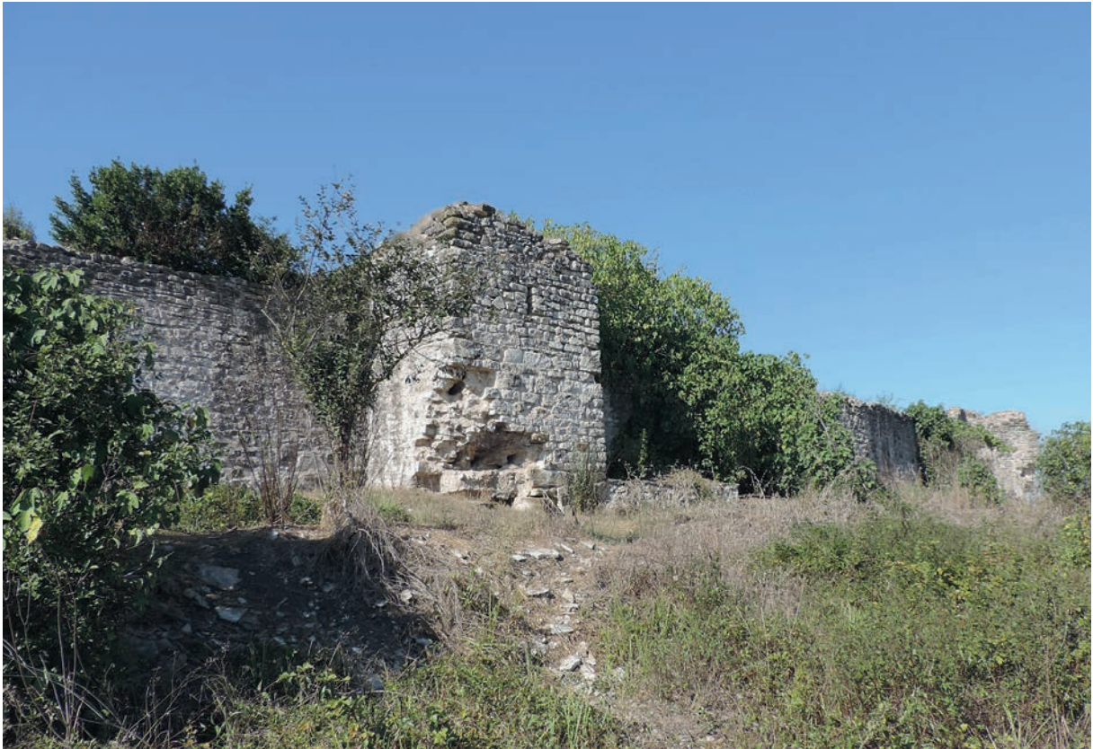
88 Harmantepe Kalesi, Kurtine und Turm