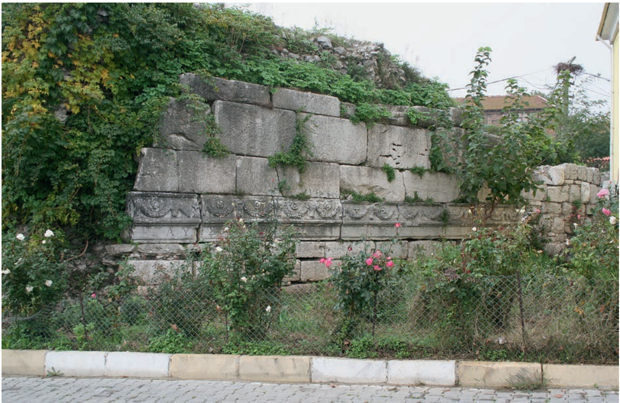
39 Apollōnias, byz. Stadtmauer aus antiken Spolien