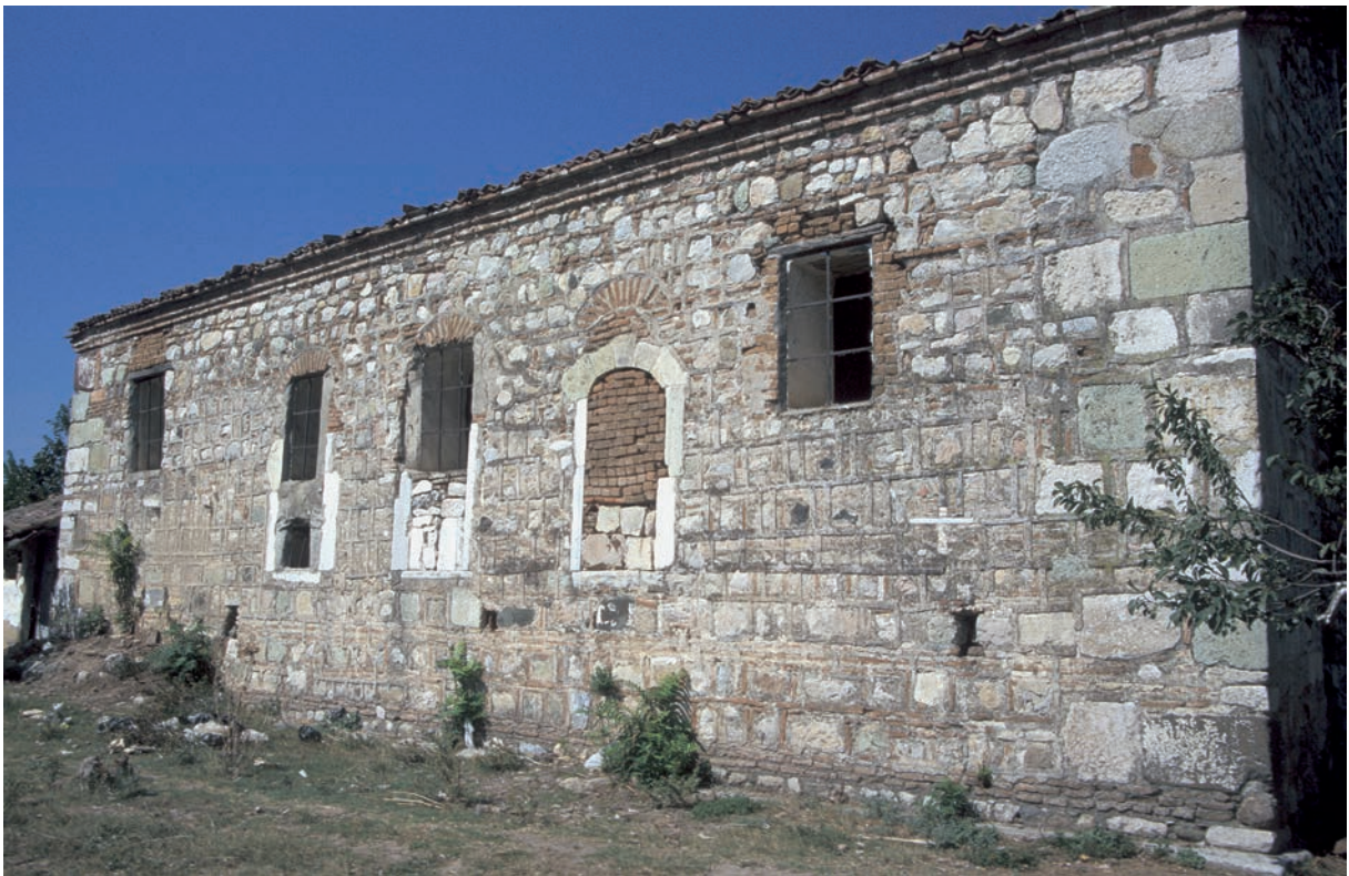
154 Lopadion, neuzeitliche Kirche