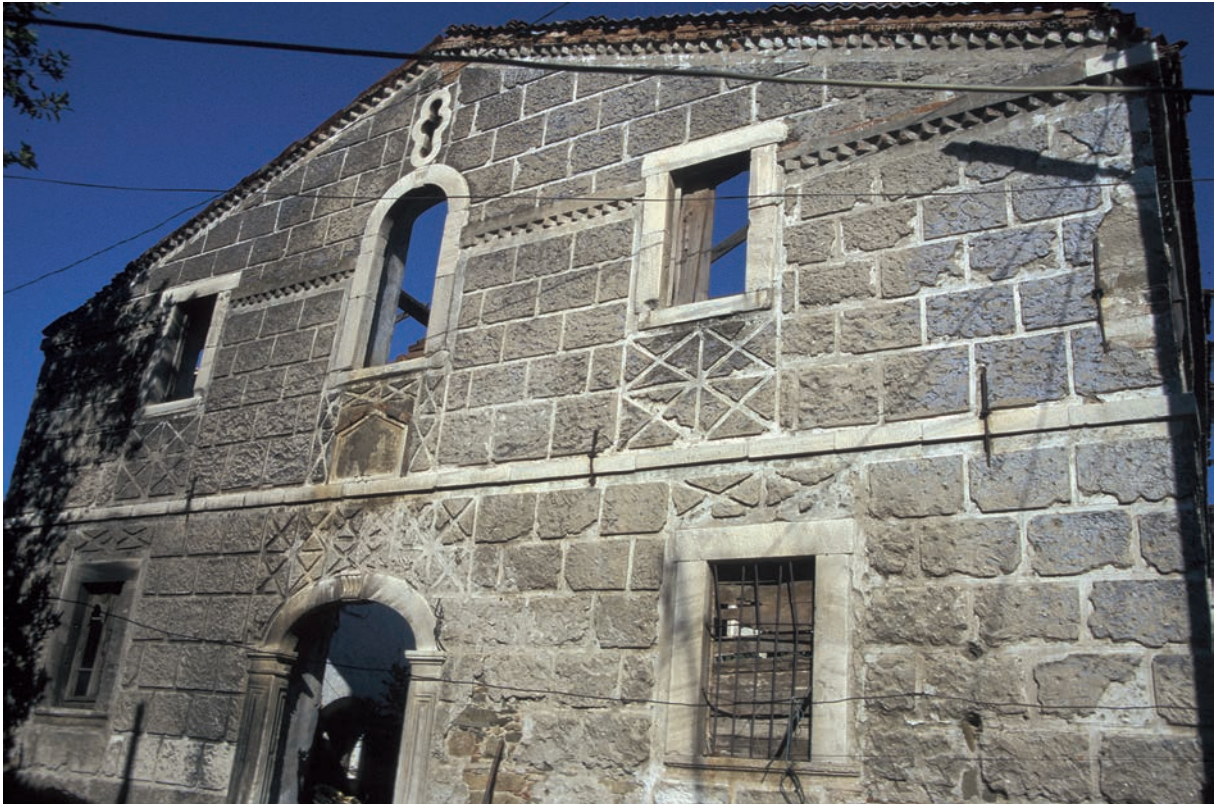
147 Langada, neuzeitliche Kirche, Westfassade