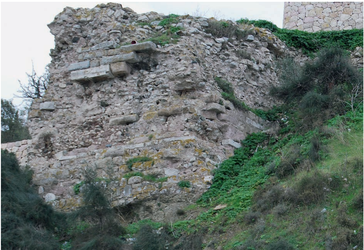
158 Melanos Akrōtērion, Turm der Befestigung