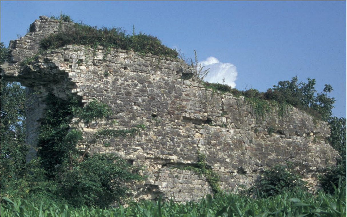
279 Seyfilar Kalesi, Kurtine