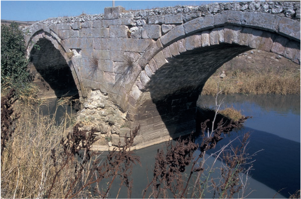
307 Tolypē, alte Brücke, Detail der Bögen