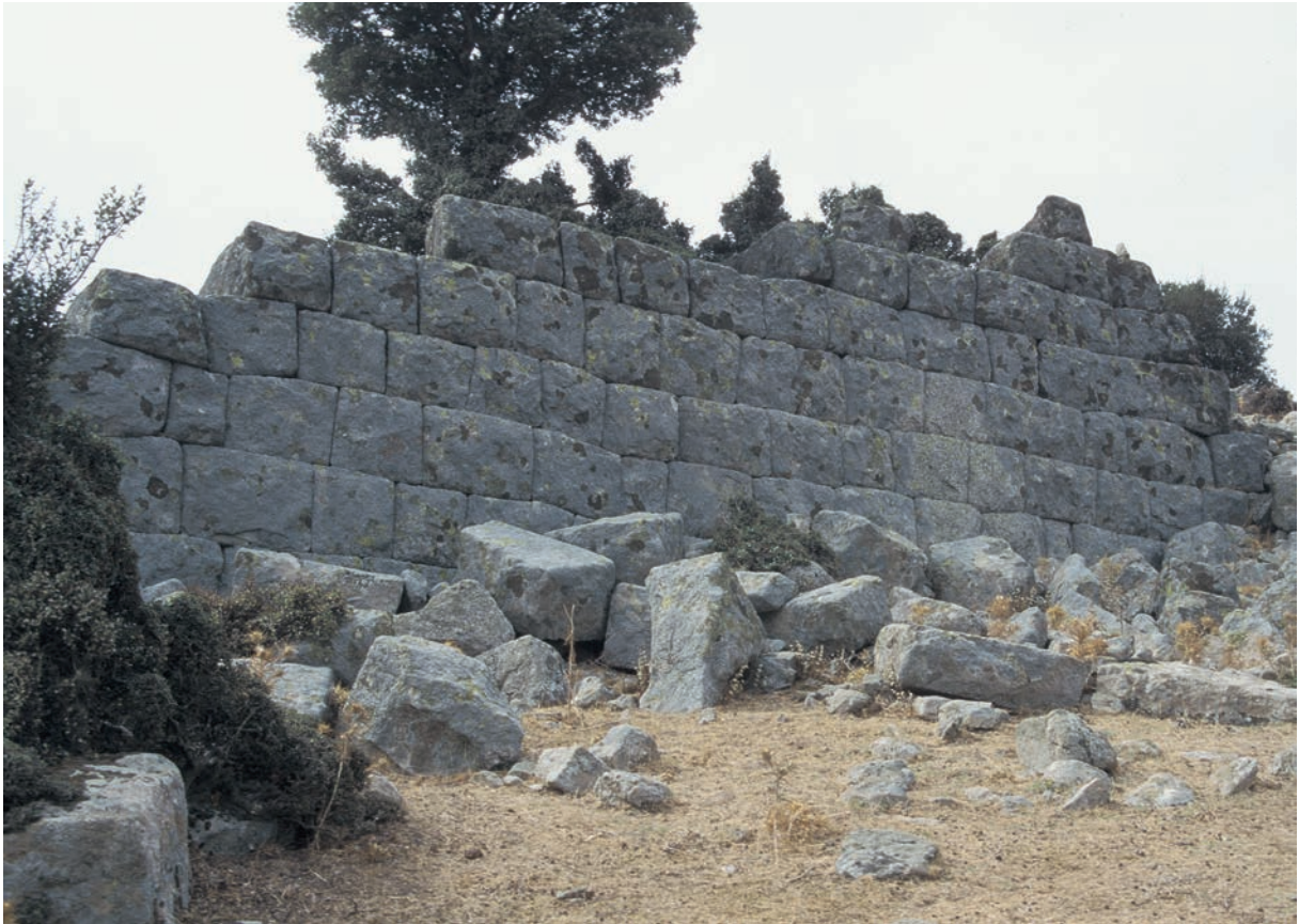
181 Neandria, Stadtmauer