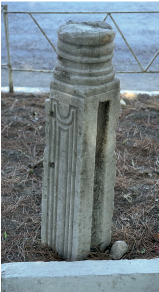
145 Lampsakos, Schrankenpfeiler