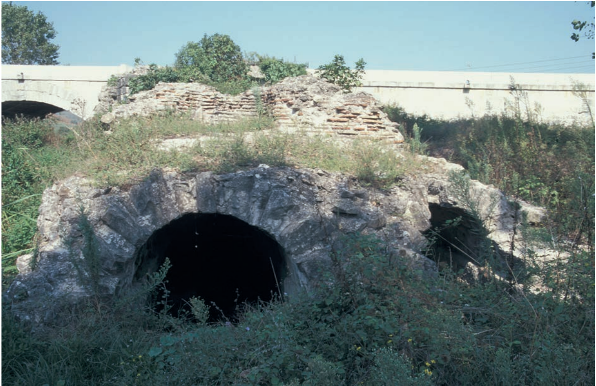
240 Pentegephyra, tunnelartige Vorbauten im Süden