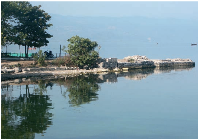
197 Nikaia, Kaimauern am See