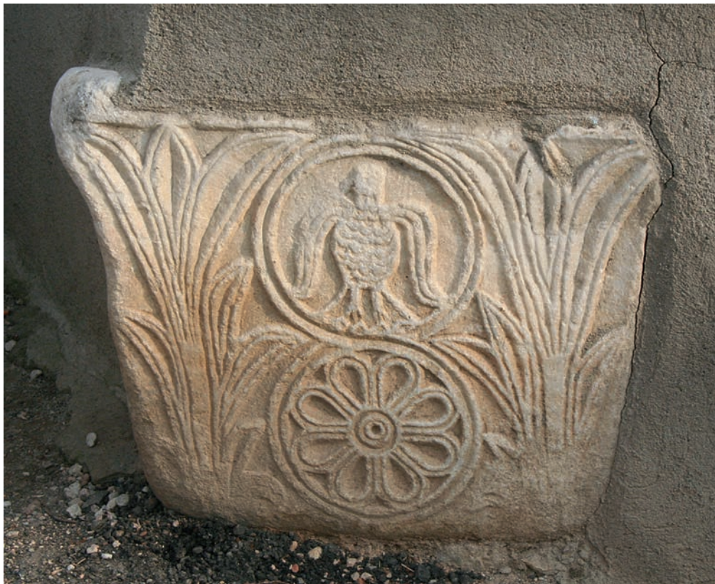
116 Kemaliye, mittelbyz. Kapitell