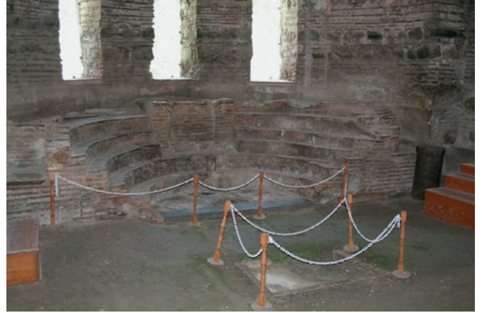
204 Nikaia, H. Sophia, Hauptapsis mit Synthronon, Zustand 2009