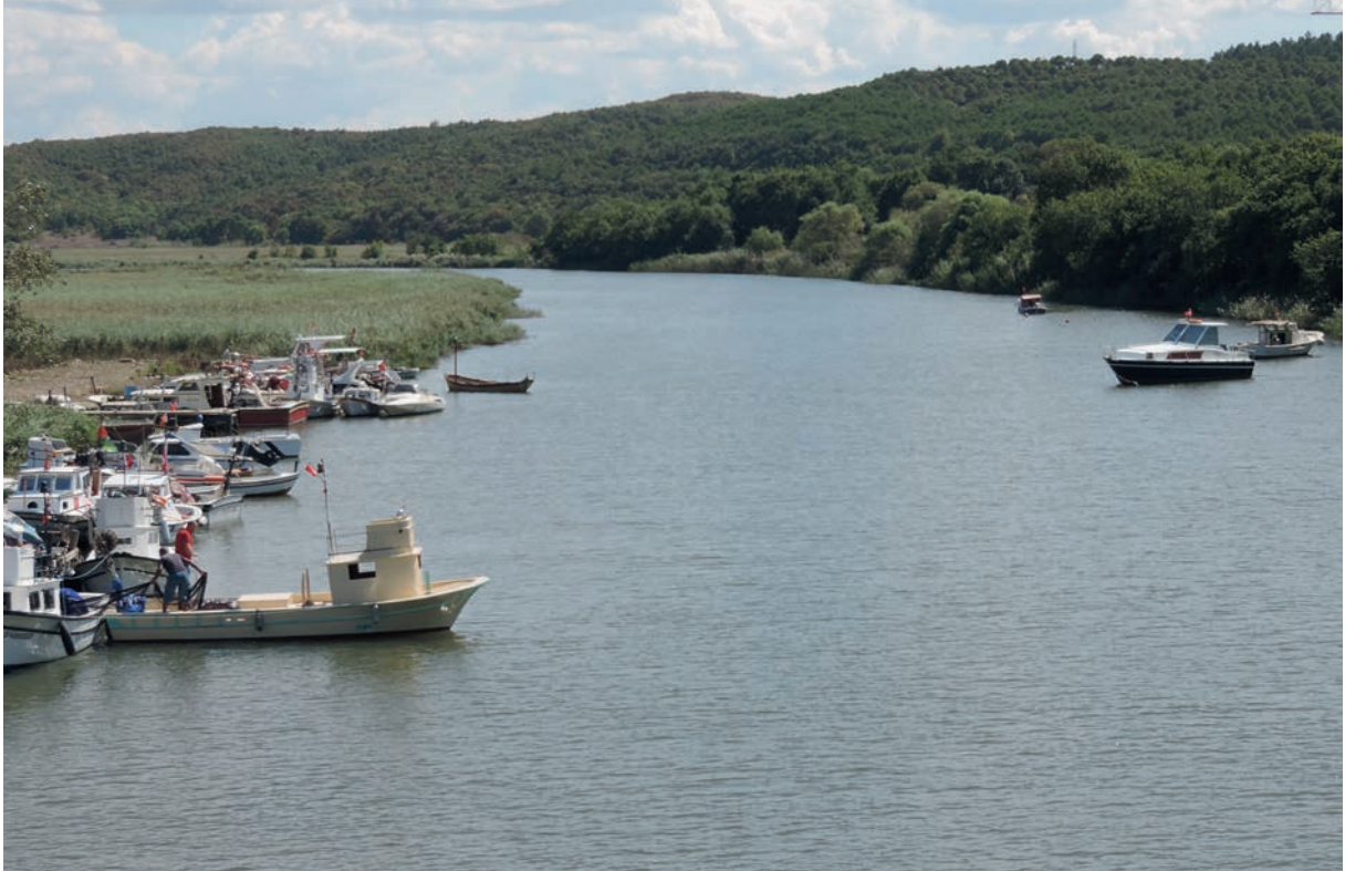
263 Rēbas (1), Unterlauf (2013), talaufwärts