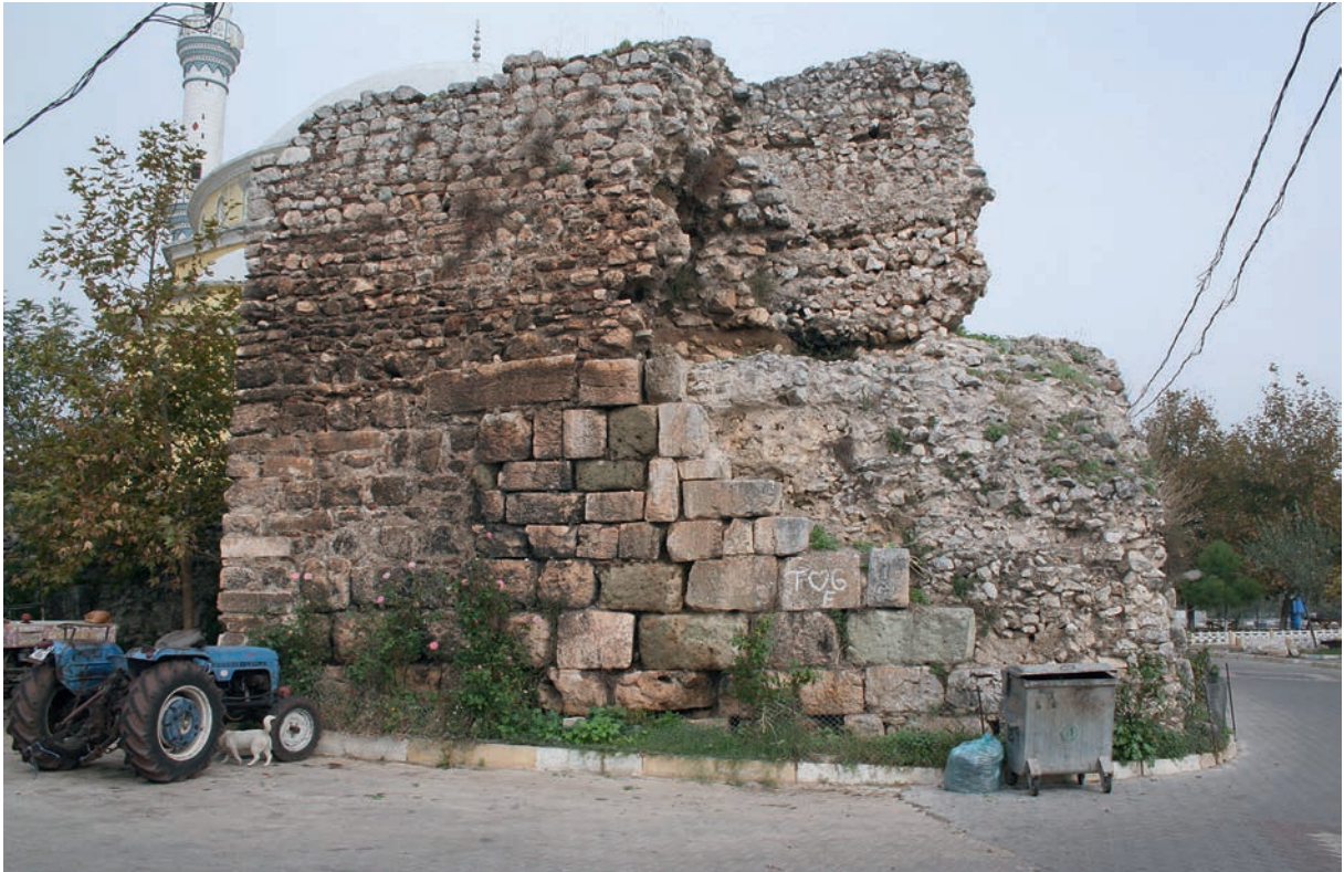
40 Apollōnias, byz. Stadtmauer aus antiken Spolienquadern