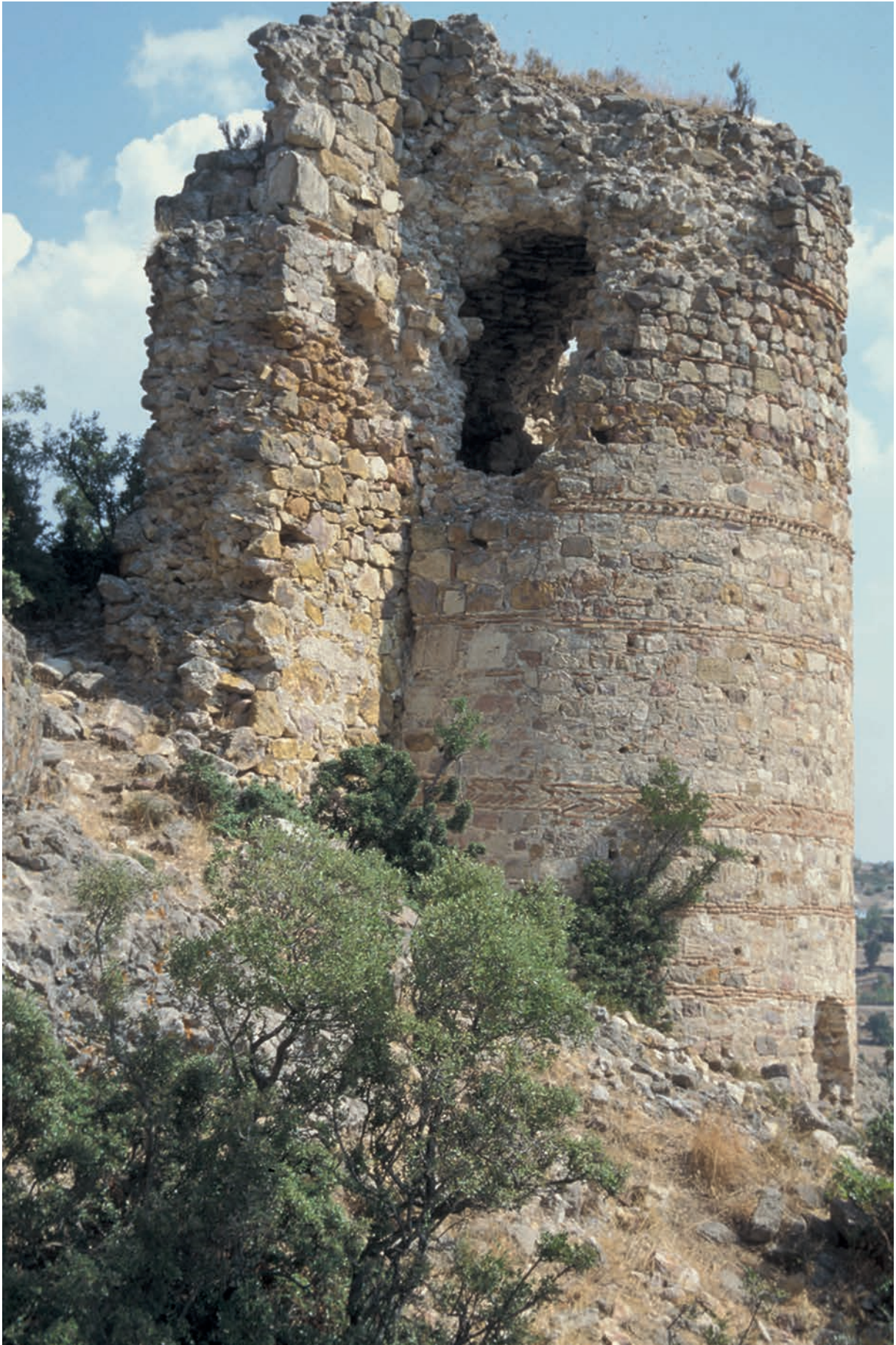
134 Kremastē, Turm 9