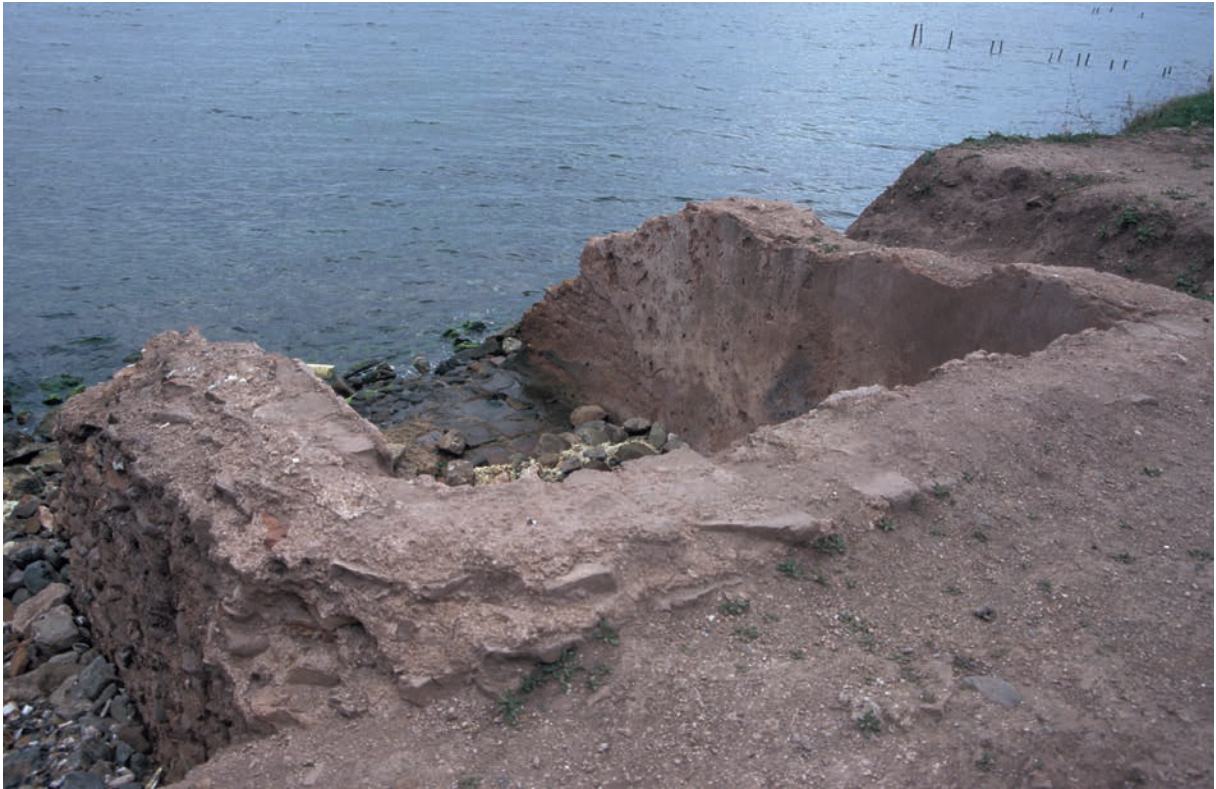
77 Elegmoi, Gebäude am Meer