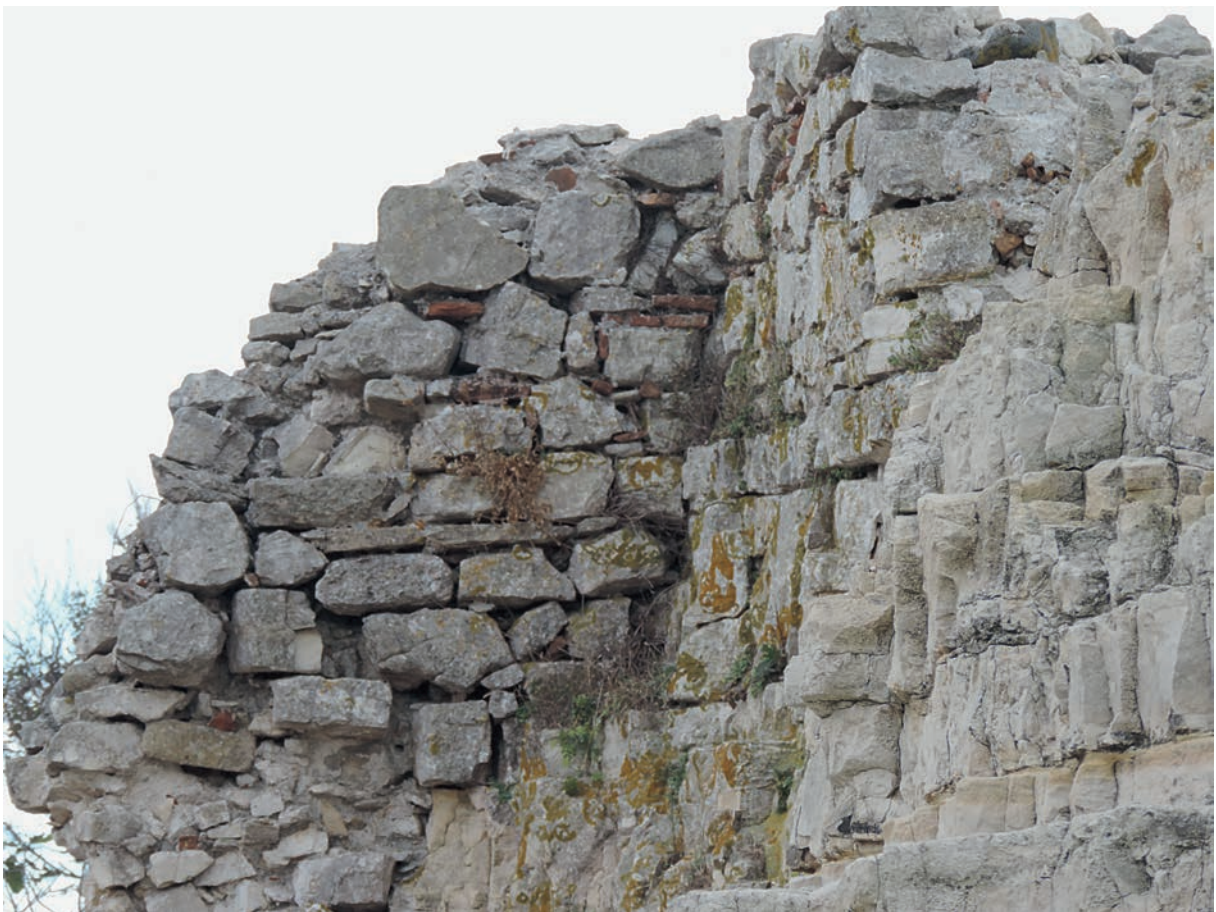
114 Karpē, byz. Befestigung, Detail des Mauerwerkes