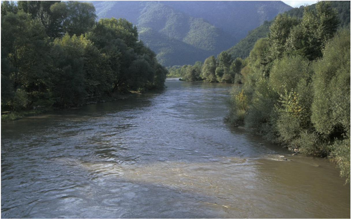
5 Sangarios, Durchbruchstal nördlich von Kabeia