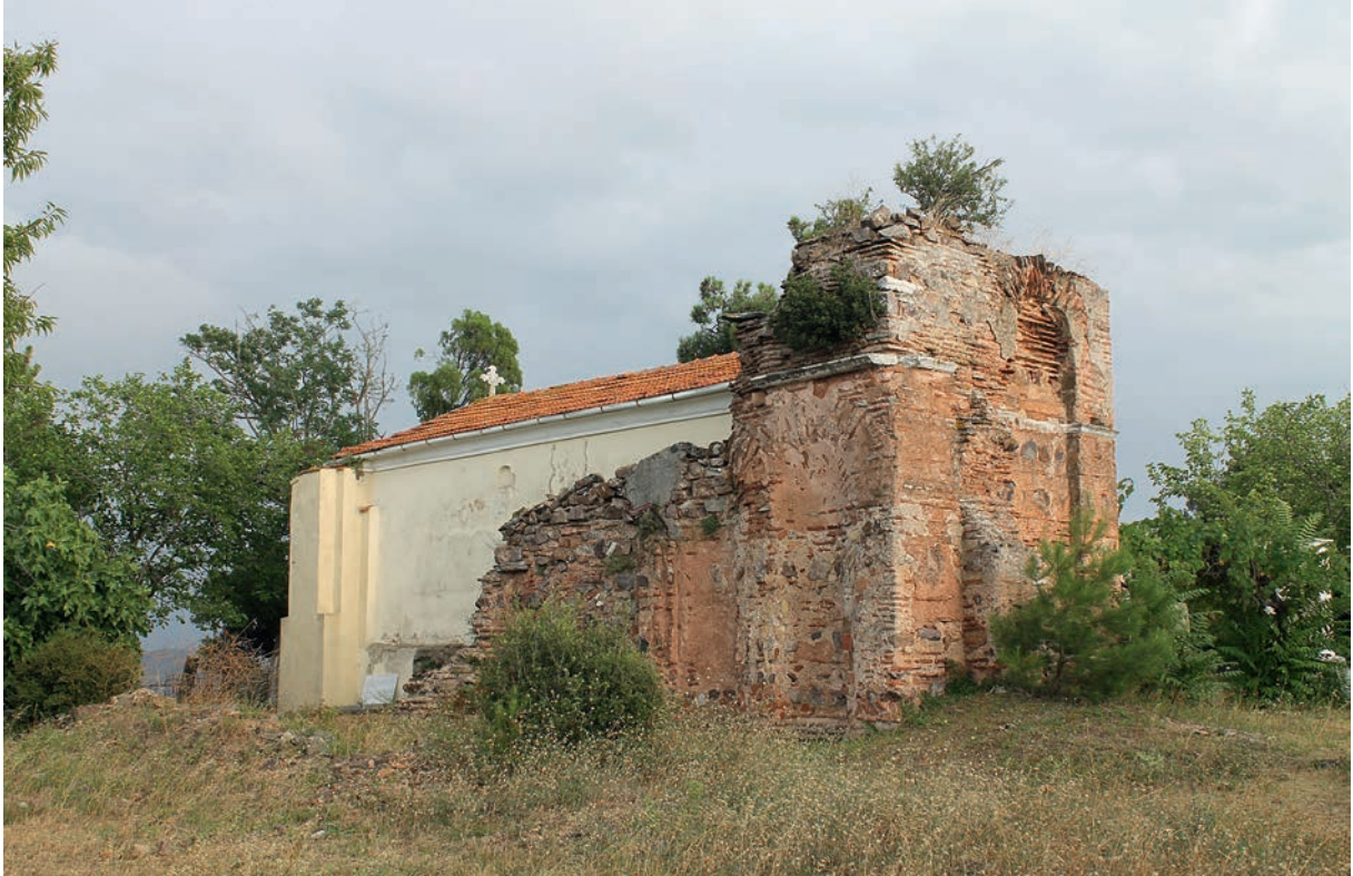
167 Metamorphōsis Christu auf Antigonu Nēsos, NW-Ecke von außen