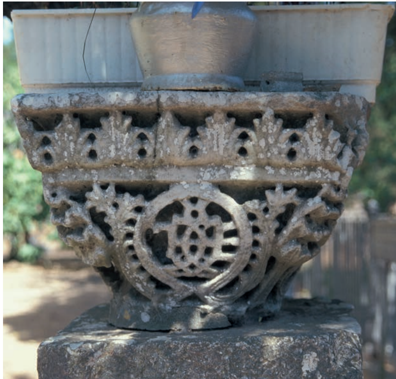
171 Metamorphōsis Christu auf Antigonu Nēsos, Kapitell mit Monogramm