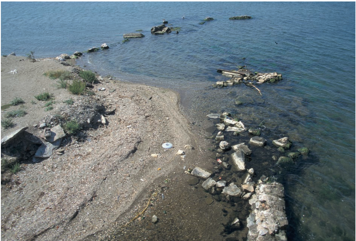
227 Parion, Westhafen, alte Mole