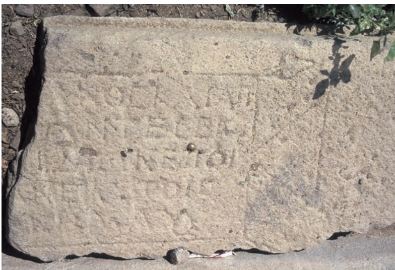
270 Sağırlar, Fragment einer antiken Inschrift