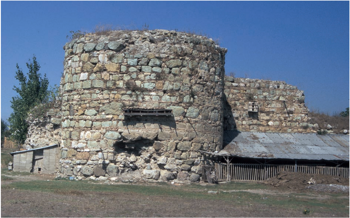
153 Lopadion, Turm der Stadtmauer