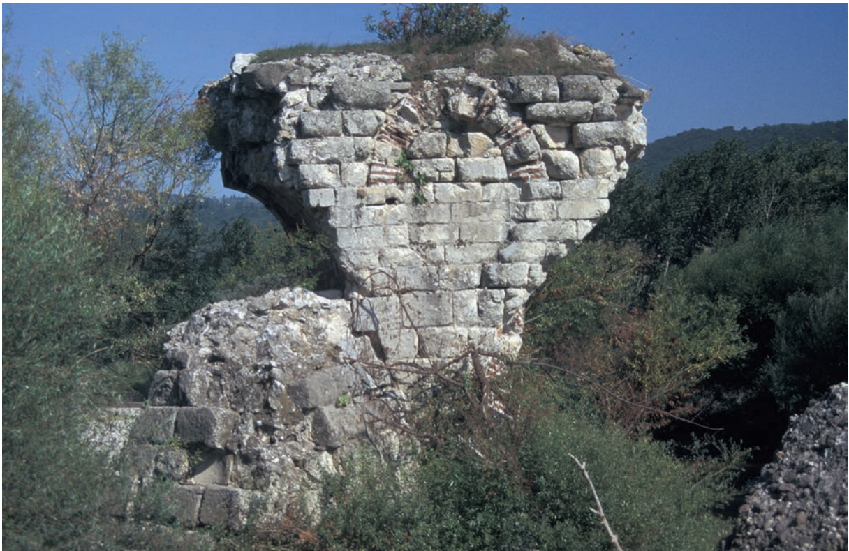
289 Sultançayır, Brücke, Detail eines Pfeilers