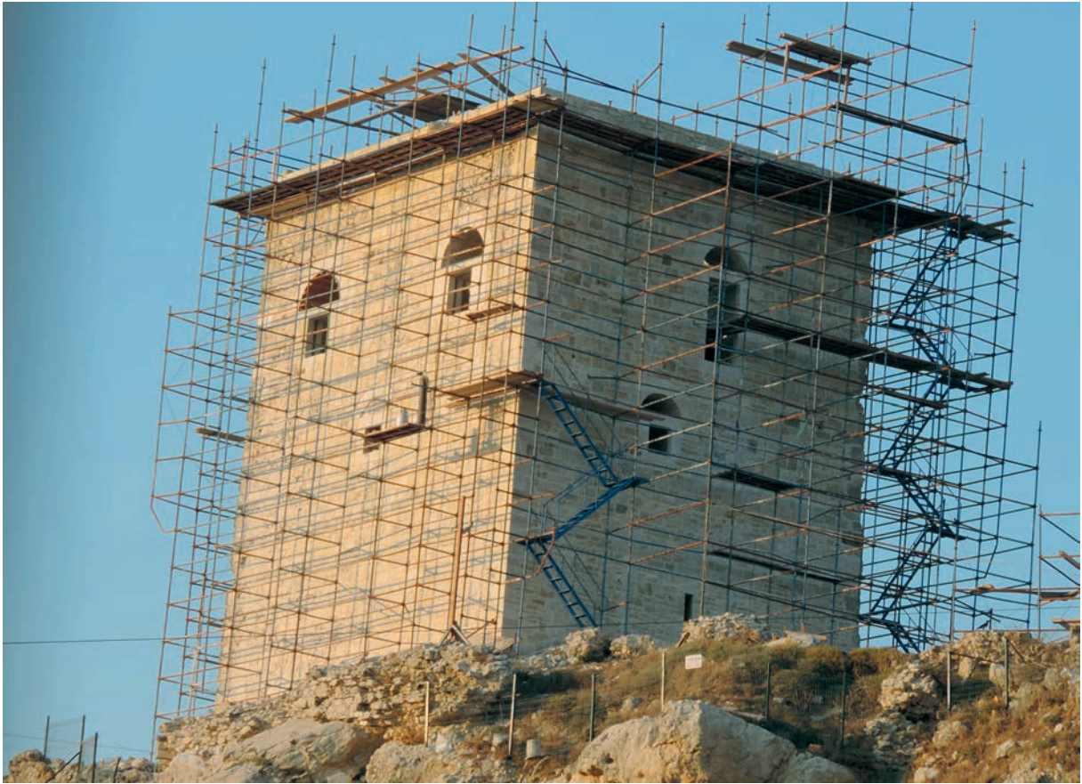
66 Chēlē (2), osman. Turm, rezente Restaurierung (2013)