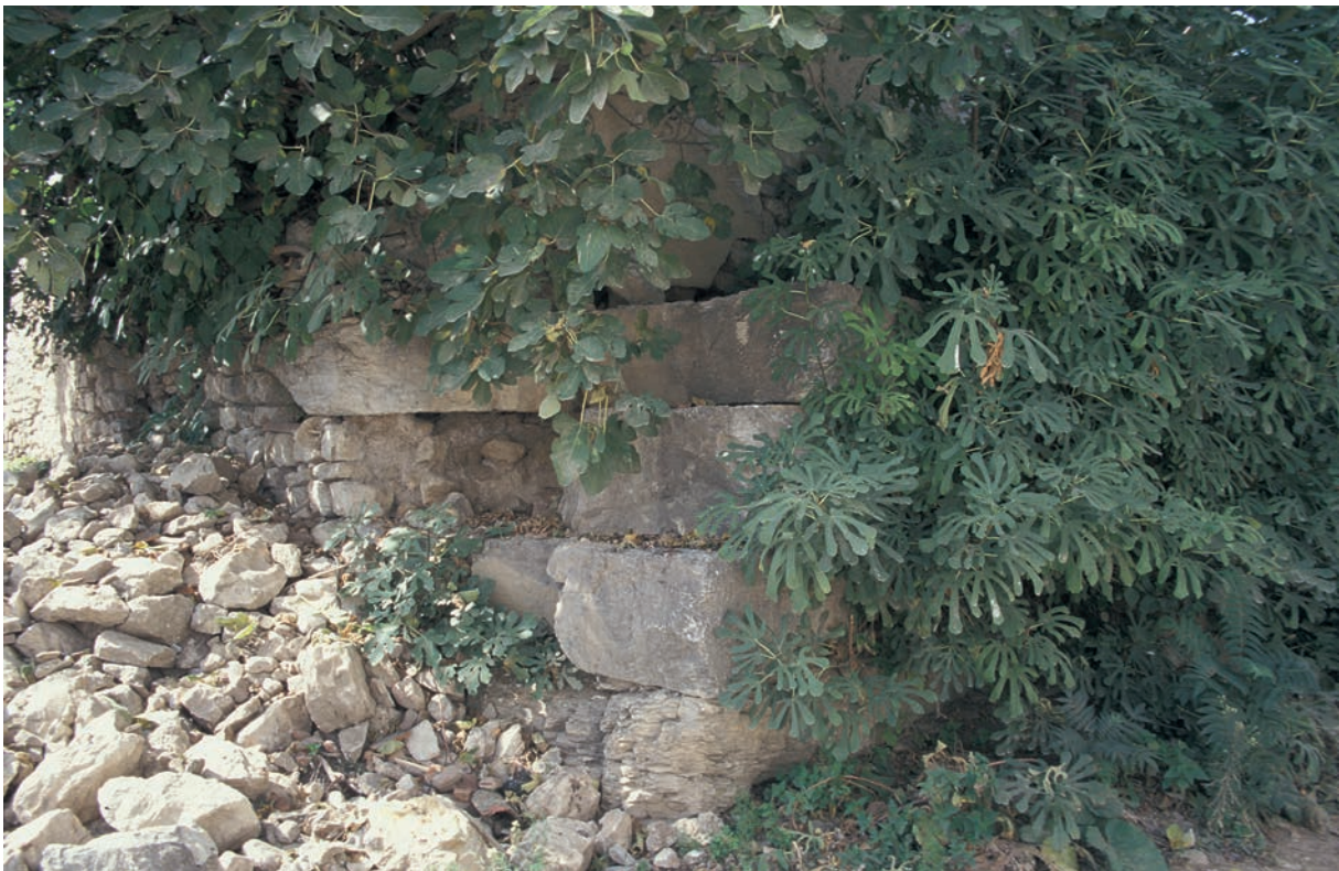
189 Neokaisareia, byz. Bau (Befestigung?) mit antiken Quadern