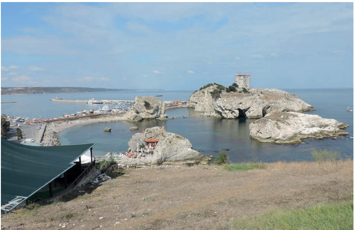
63 Chēlē (2), Überblick über die Felsinseln, Ocaklı Ada und den modernen Fischereihafen (2013)