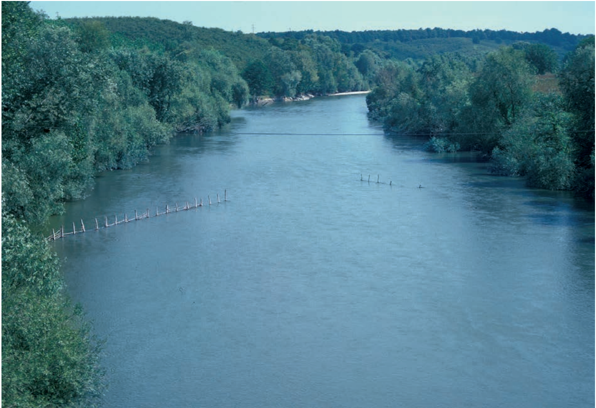
272 Sangarios, Unterlauf mit Fischreusen