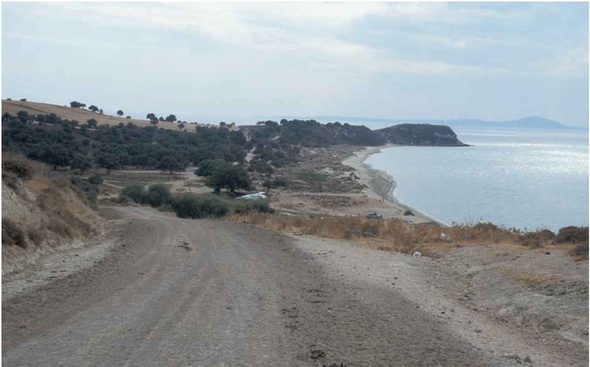
18 Achilleion von Norden