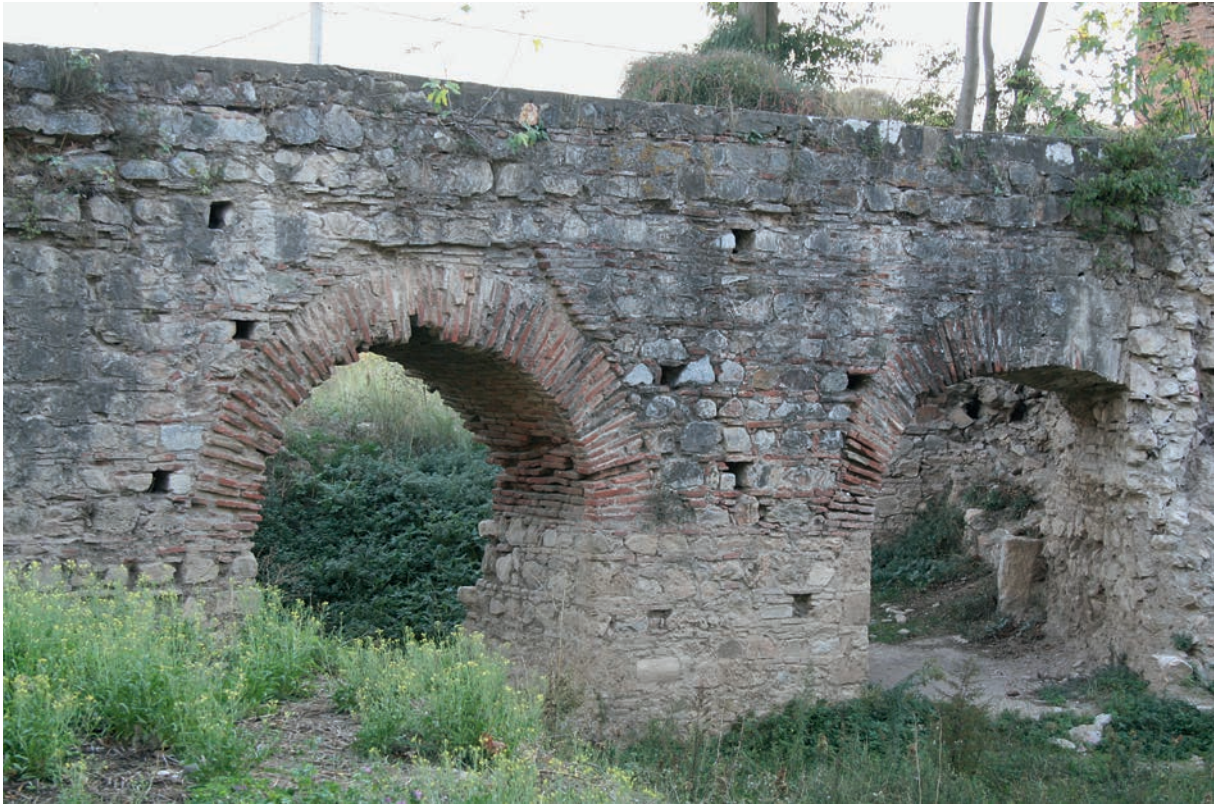
199 Nikaia, Aquädukt nahe Eintritt in die Stadtmauer