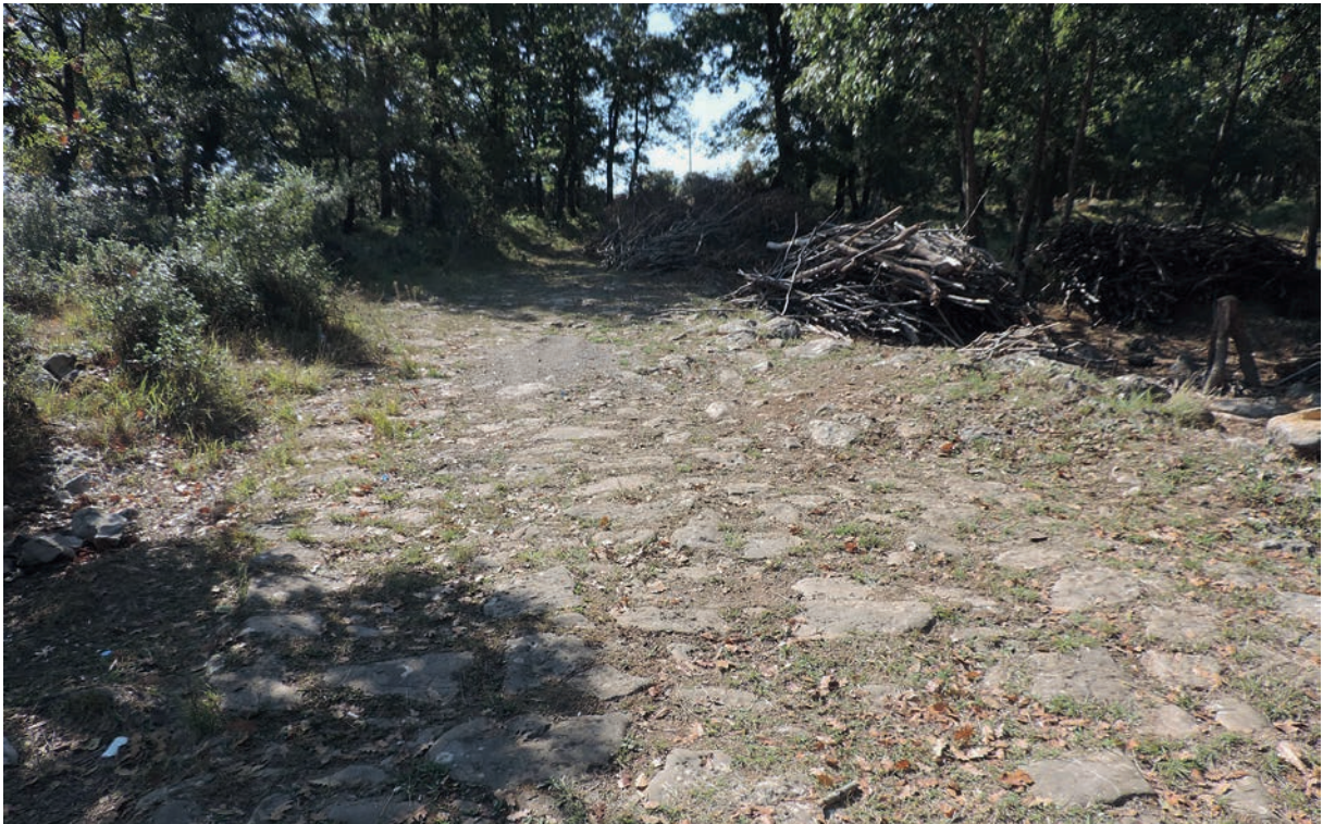
14 Alte Straße bei Yazımanayır