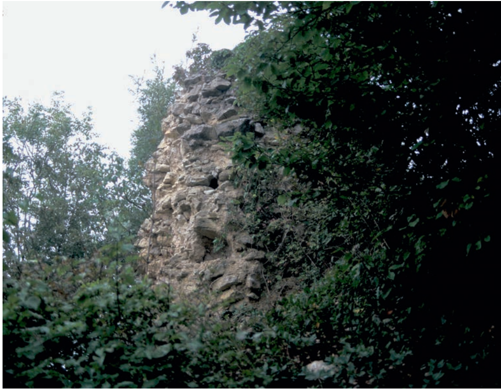
172 Miskura, Turm der Burg