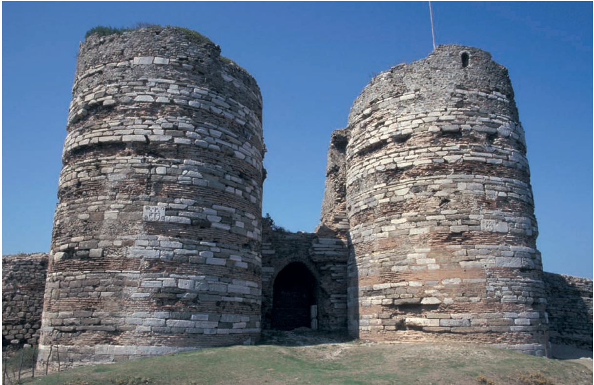
96 Hieron, Festung, von Türmen flankiertes Tor