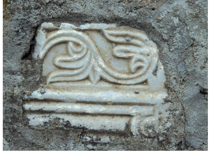
303 Tepeköy, Fragment einer byz. Platte