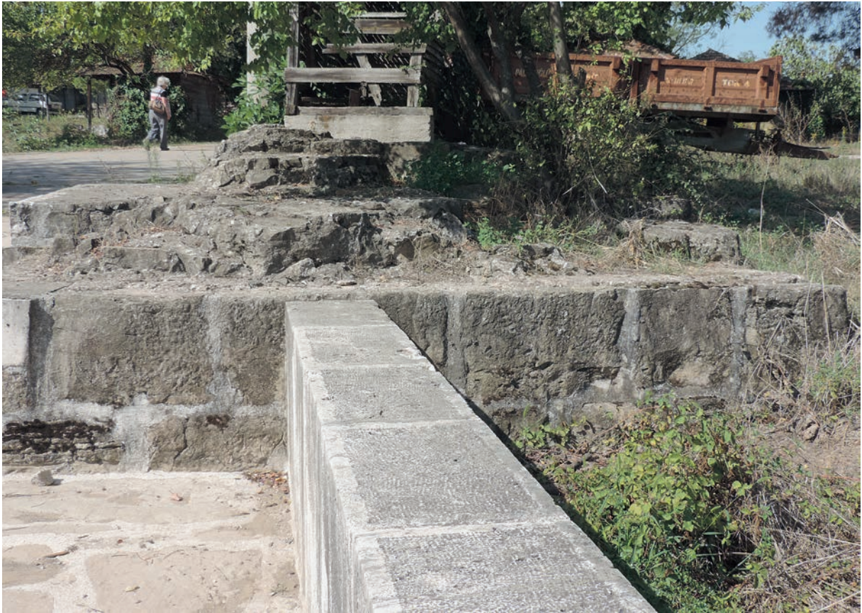
236 Pentegephyra, Fundament des nördlichen Pfeilers des nicht mehr existenten Triumphbogens