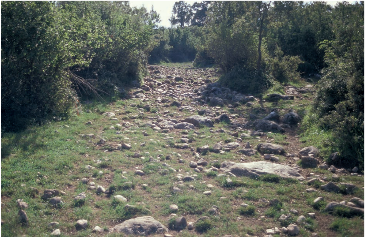
13 Alte Straße n/w. von Yarhisar