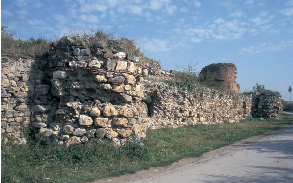
196 Nikaia, Vormauer Kaiser Iōannēs' III. Batatzēs mit Bastionen