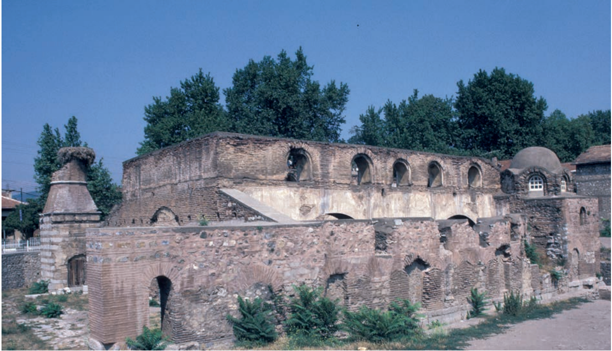
201 Nikaia, H. Sophia von SW, Zustand 1997