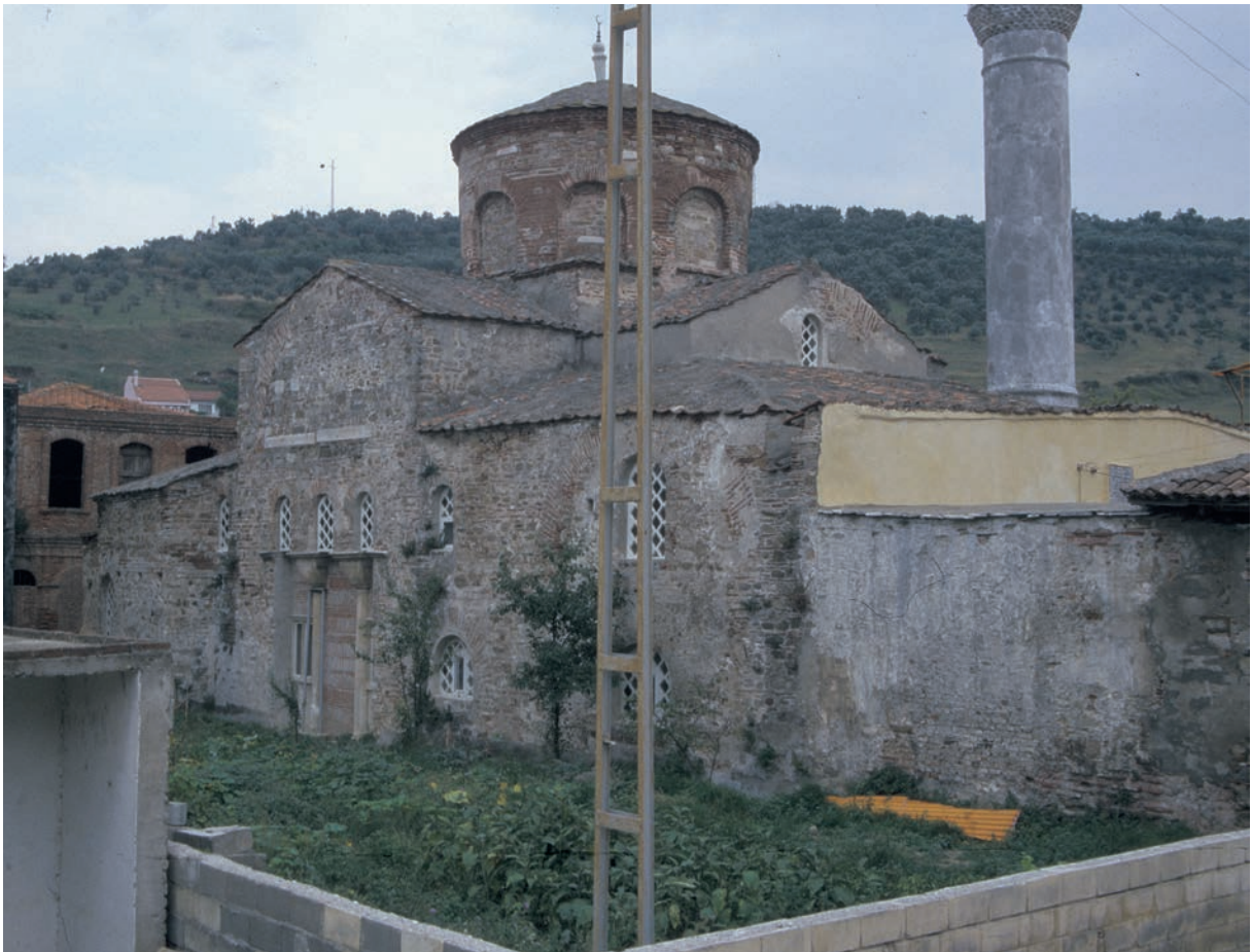
313 Trigleia, Christus-Kirche (Fatih Camii) von Nordwesten