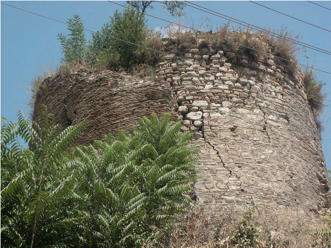
217 Nikomēdeia, Turm 16, Details beider Außenschalen