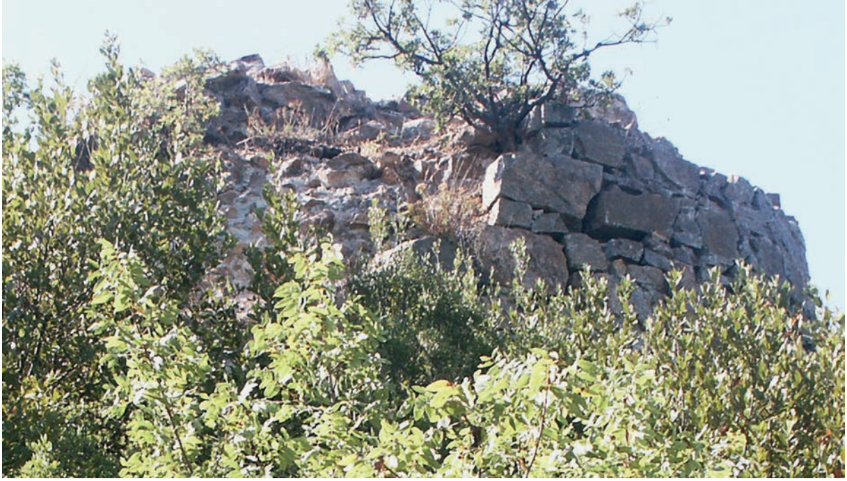
23 Actos (Aydos Dağı), Turm im SW