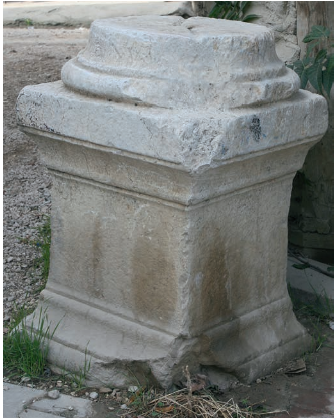
188 Neokaisareia, Säulenpostament