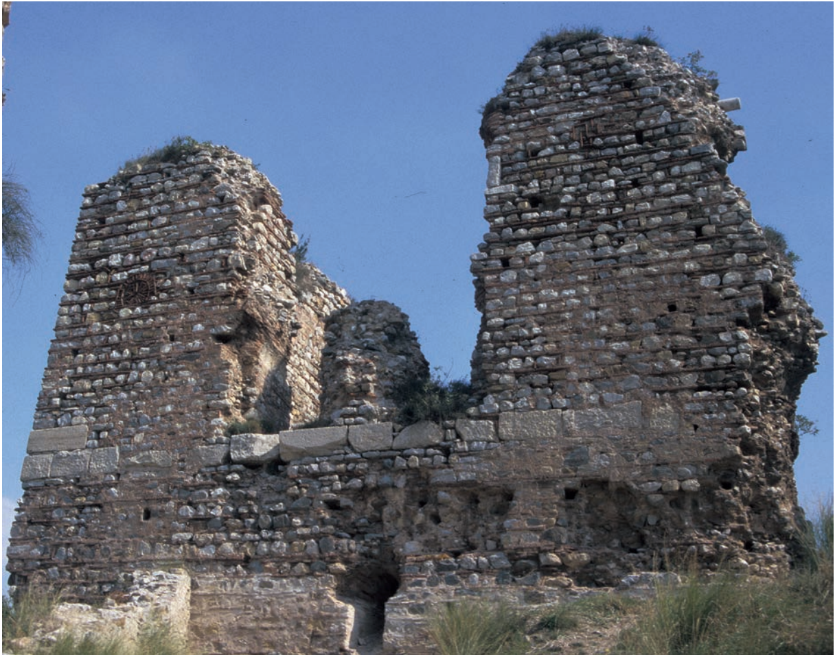
210 Nikētiatu Phrurion, Palastgebäude, Westfassade