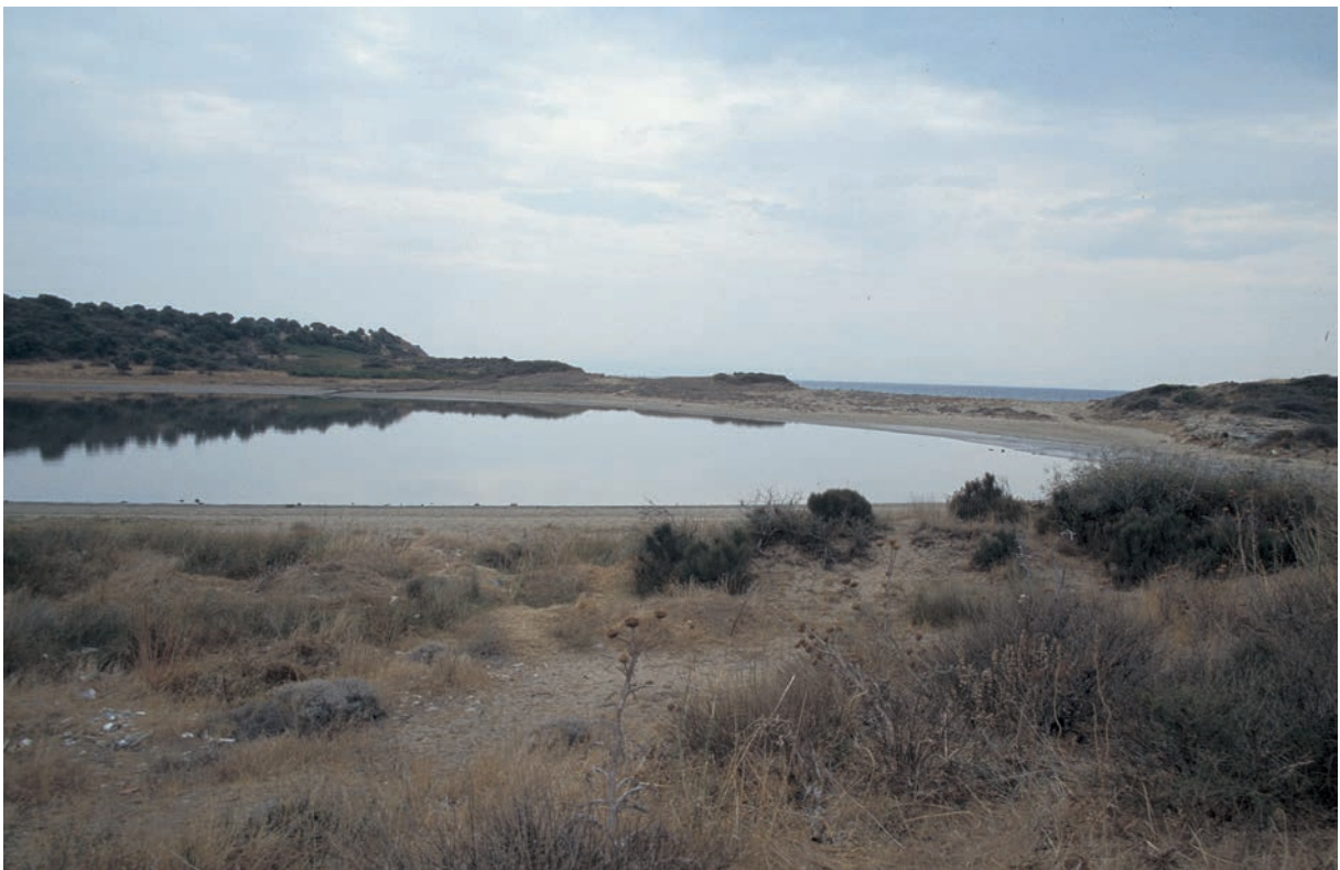
319 Trôas (1), inneres Hafenbecken