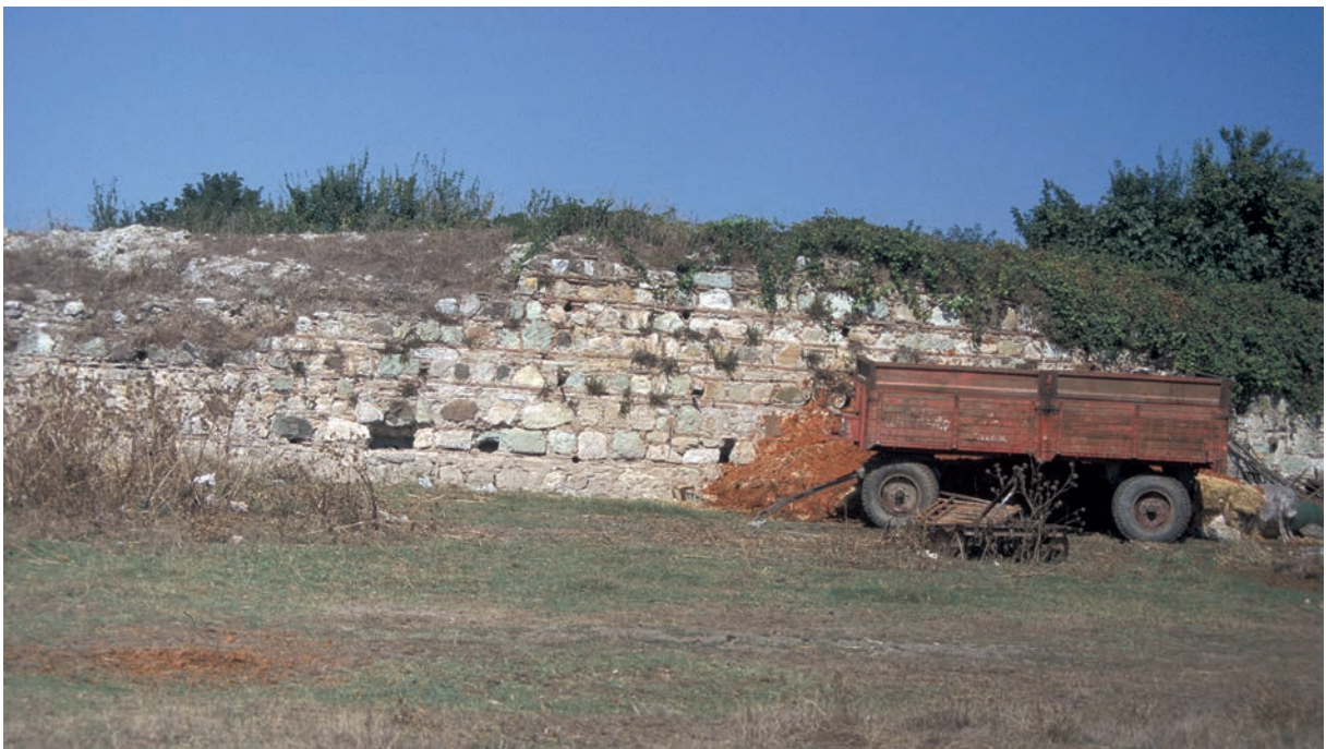
152 Lopadion, byz. Stadtmauer