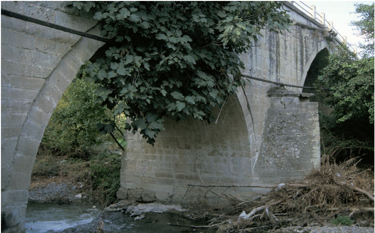
10 Valideköpsüsü (osmanische Brücke)