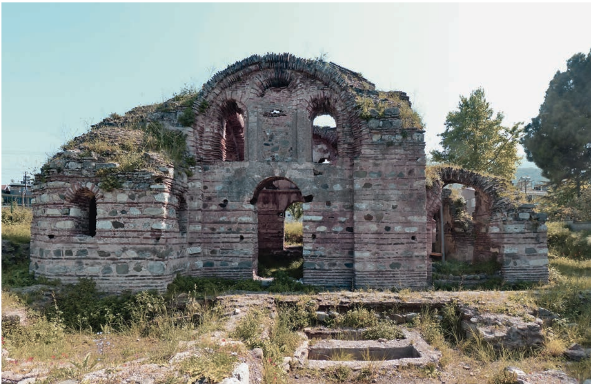
76 Elegmoi, Kirche H. Aberkios von NO