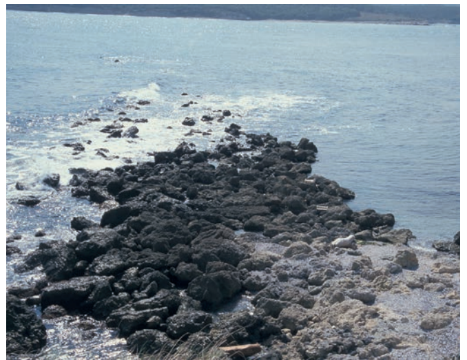
72 Daphnusia, alte Mole