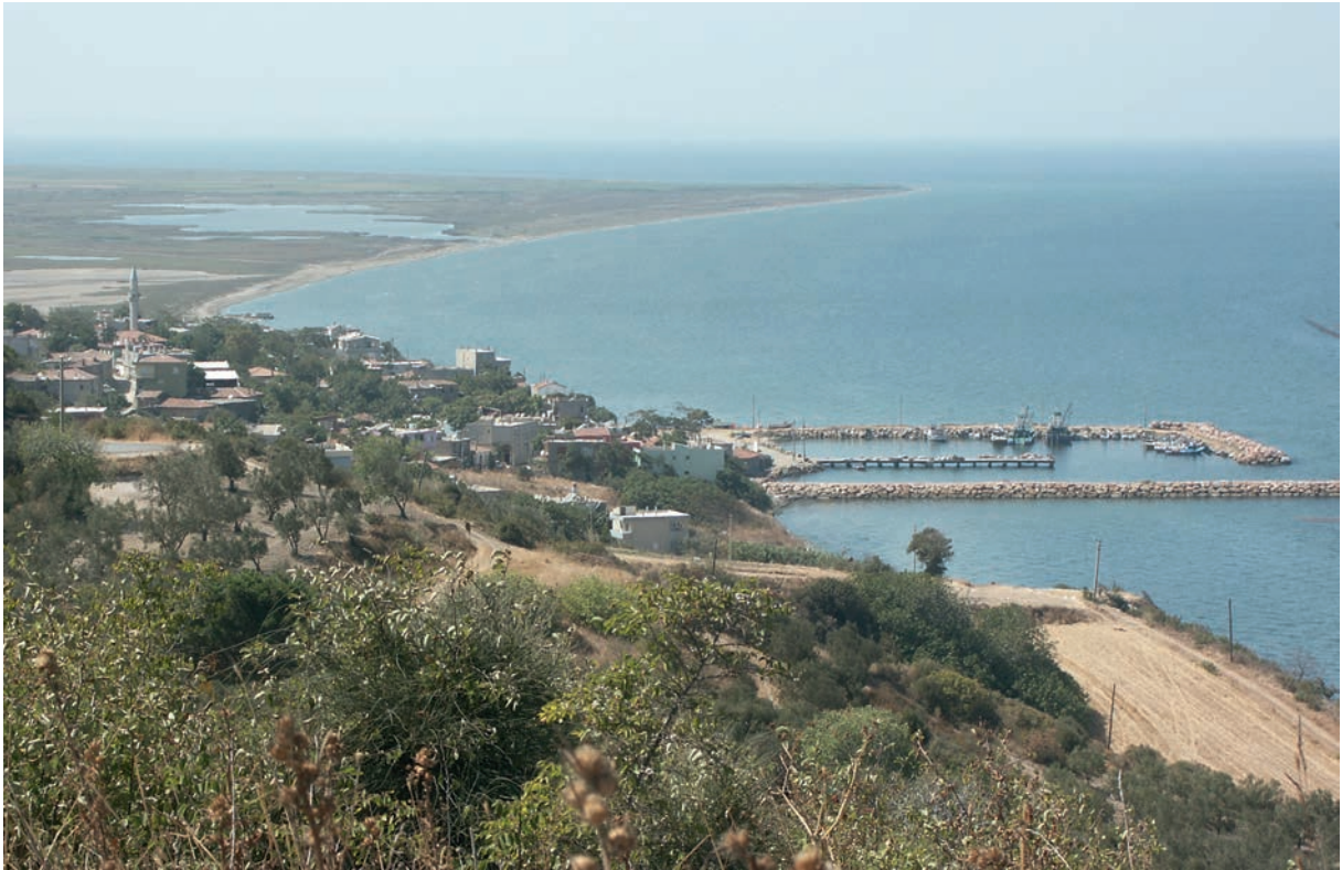
177 Musakça, Blick auf den Ort; im Hintergrund Mündungsdelta des Aisēpos