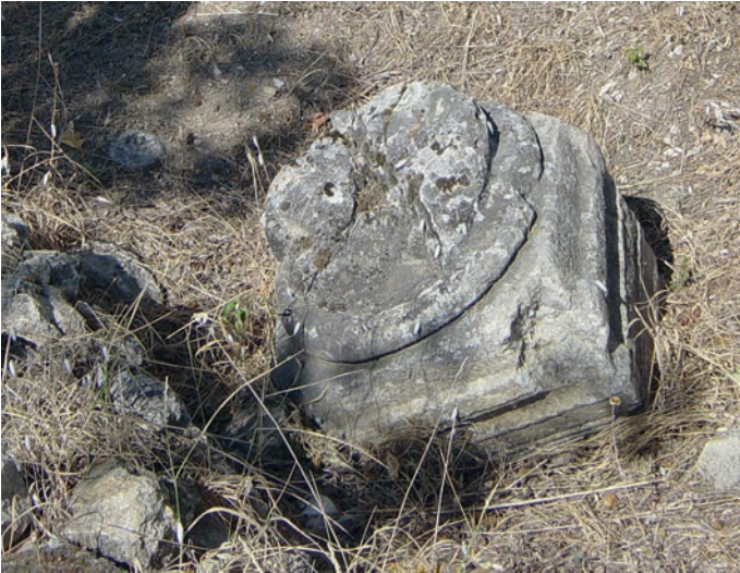
83 Harmankaya, Säulenpostament