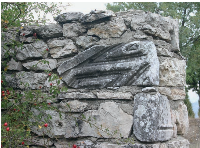
120 Kıranışıklar, Şahinbaba Türbesi, byz. Schrankenplatte