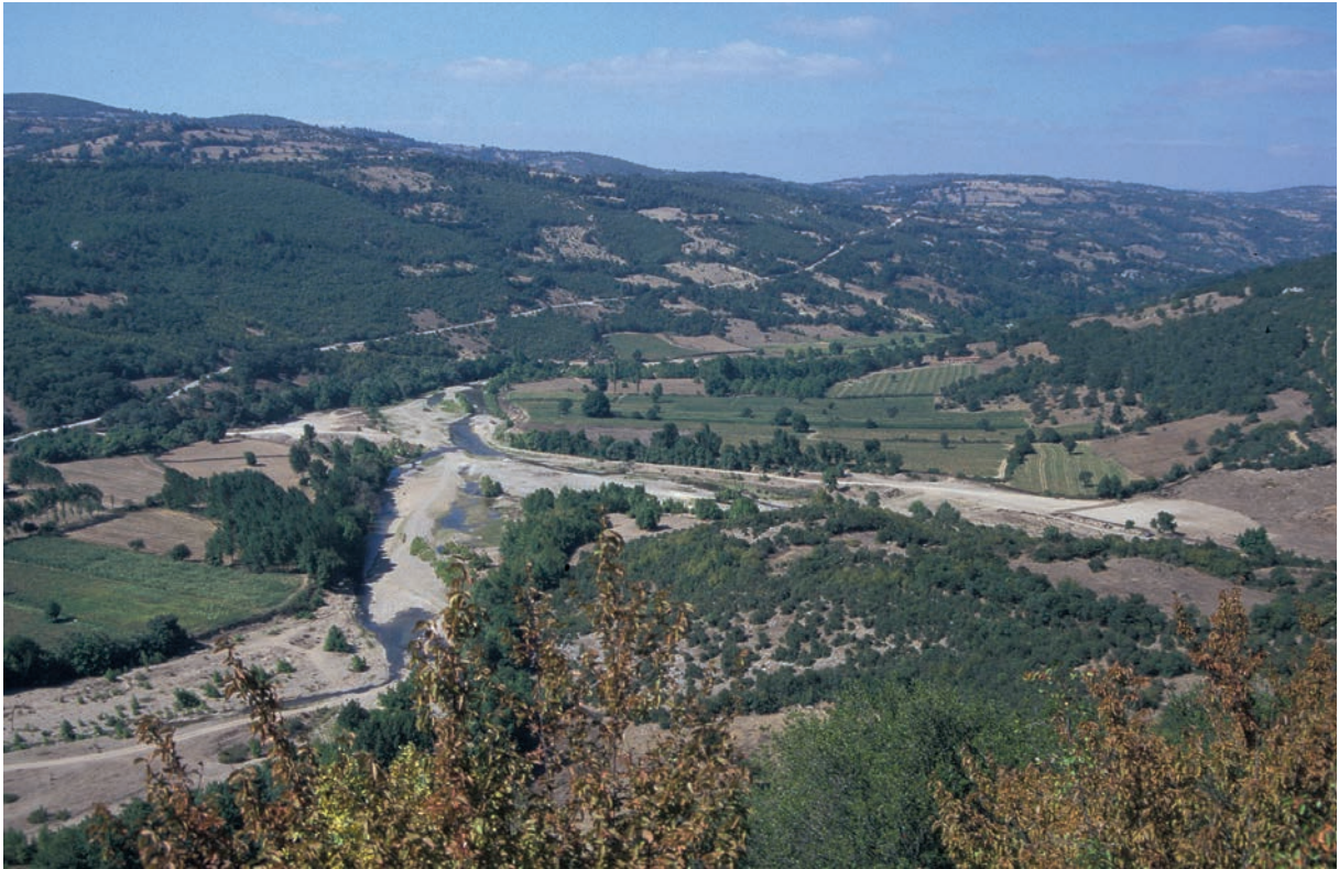
9 Empēlos bei Palaia, flußabwärts