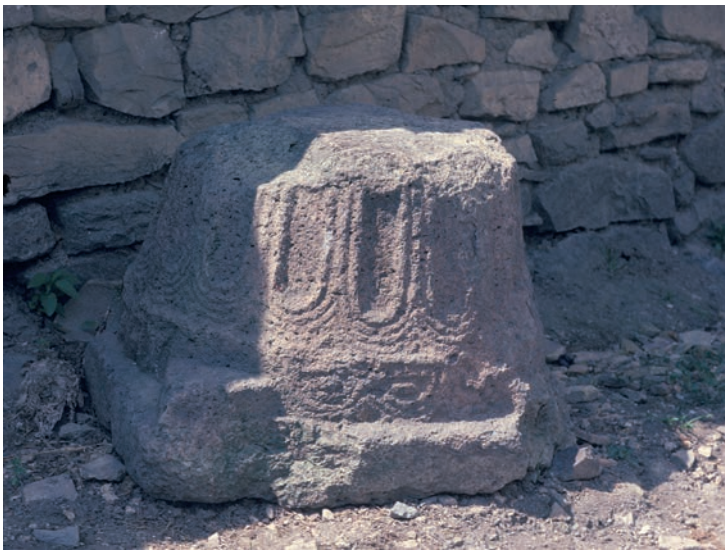
173 Modrënë, Pfeifenkapitell