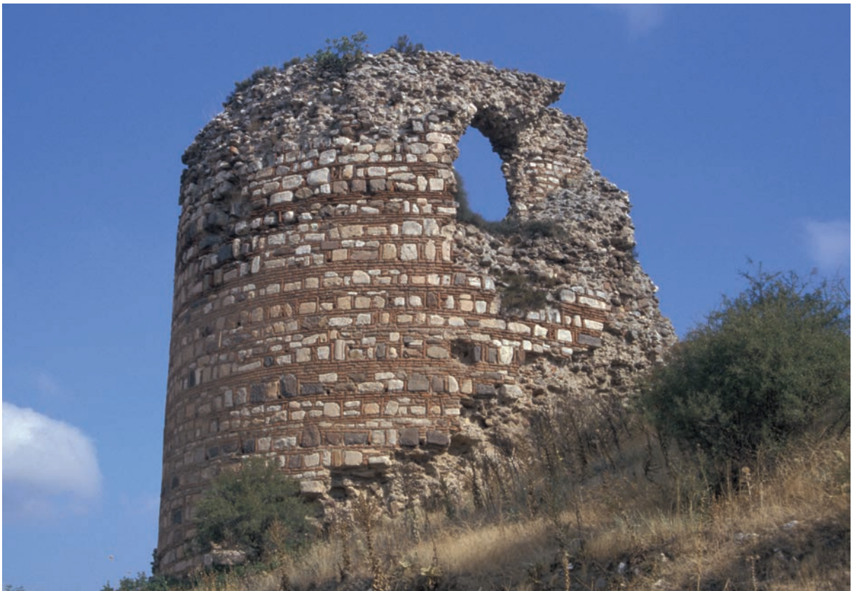
20 Achyraus, Turm der Befestigung, Detail