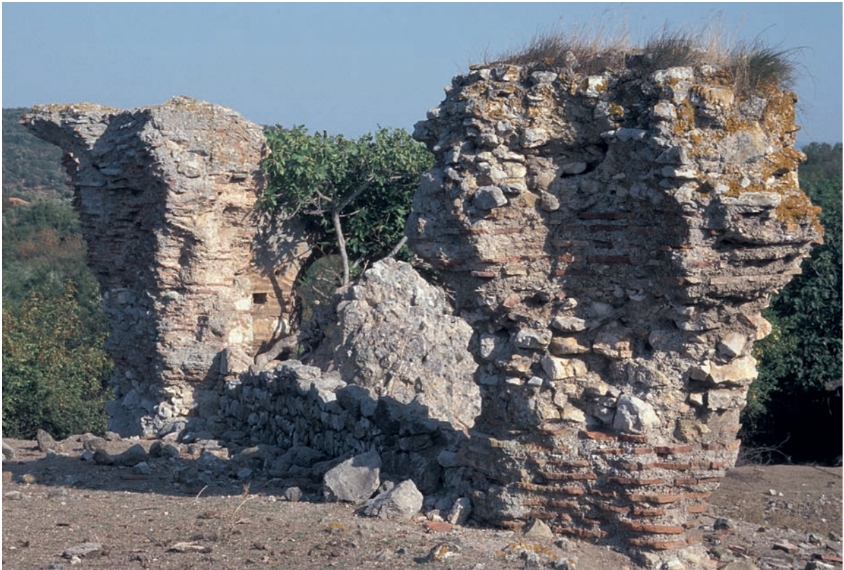
106 Kadina, byz. Gebäude von NW