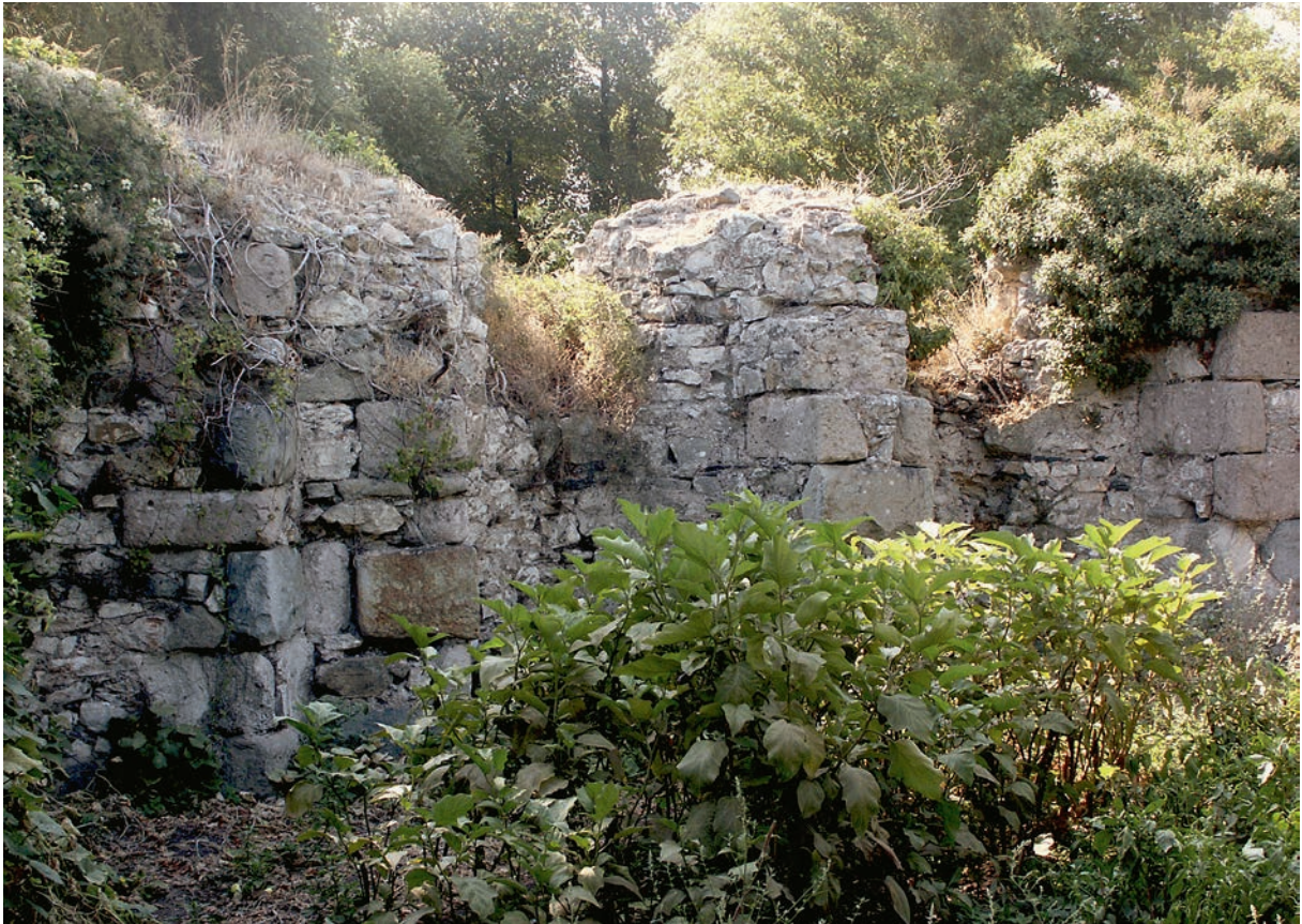
138 Kyzikos, Turm der Stadtmauern im S, Inneres