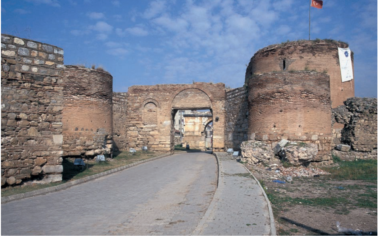
192 Nikaia, Yenişehir-Tor