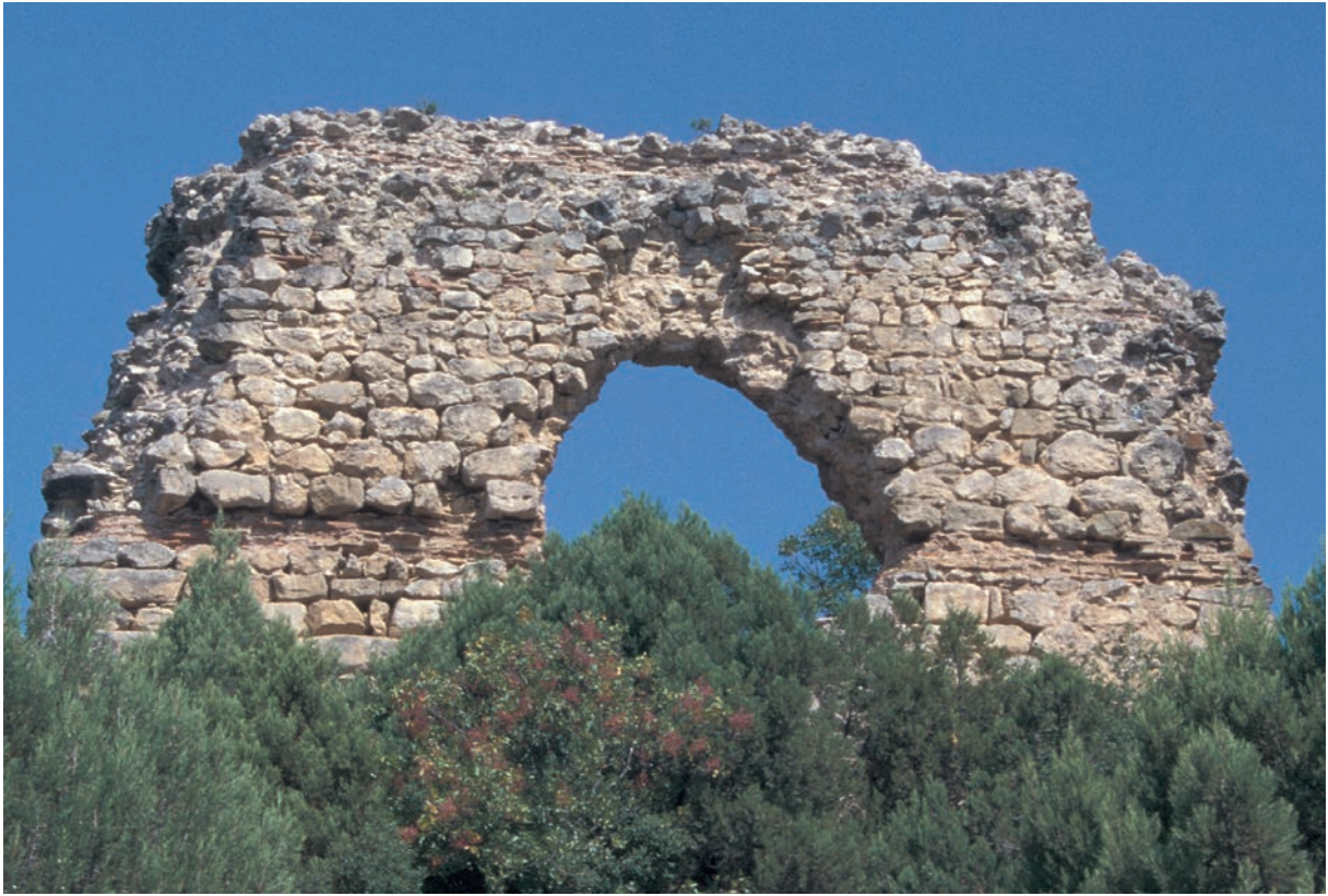
161 Metabolē, Festung, komnenenzeitliches Turmgebäude von außen