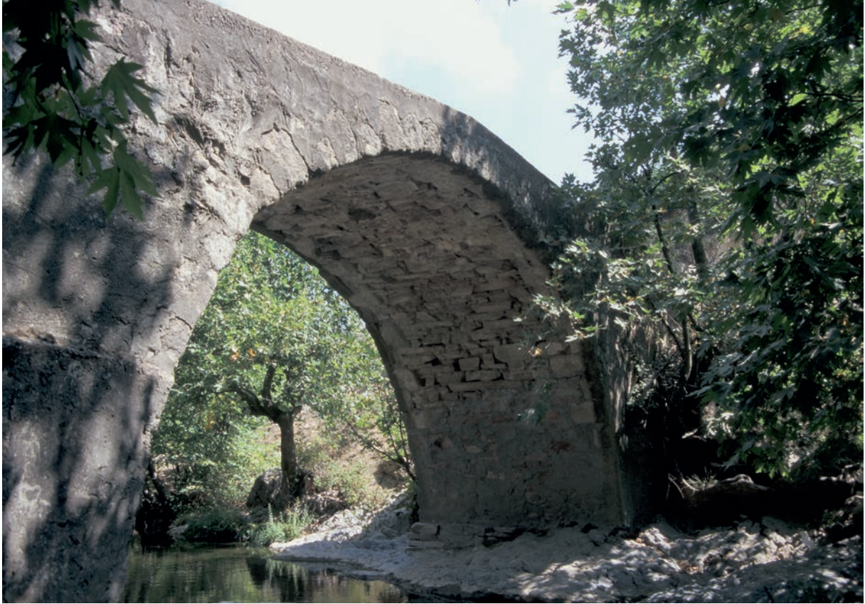
142 Lakku Mitata, osmanische Brücke 1