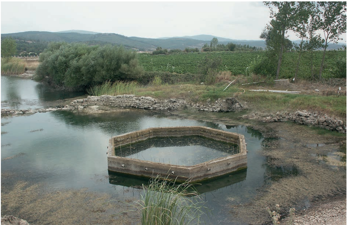
67 Çınarköy, altes Wasserbecken