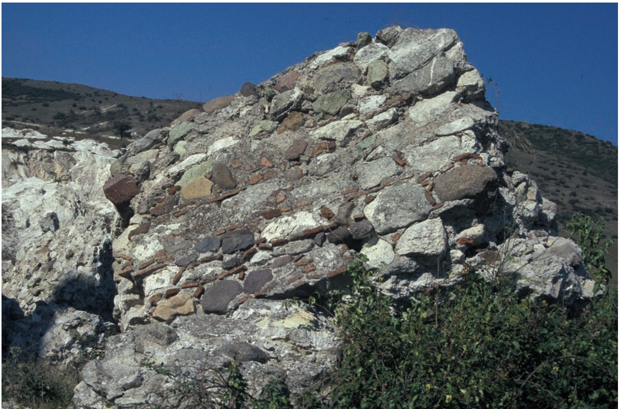
291 Sultançayır, Burg, herabgestürztes Mauerwerk mit intakter Außenschale