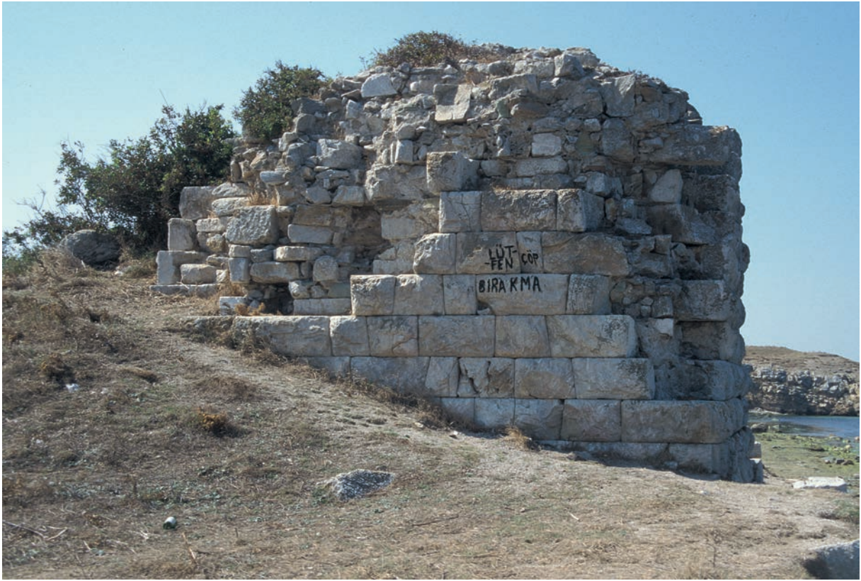
224 Parion, Befestigung am Nordhafen