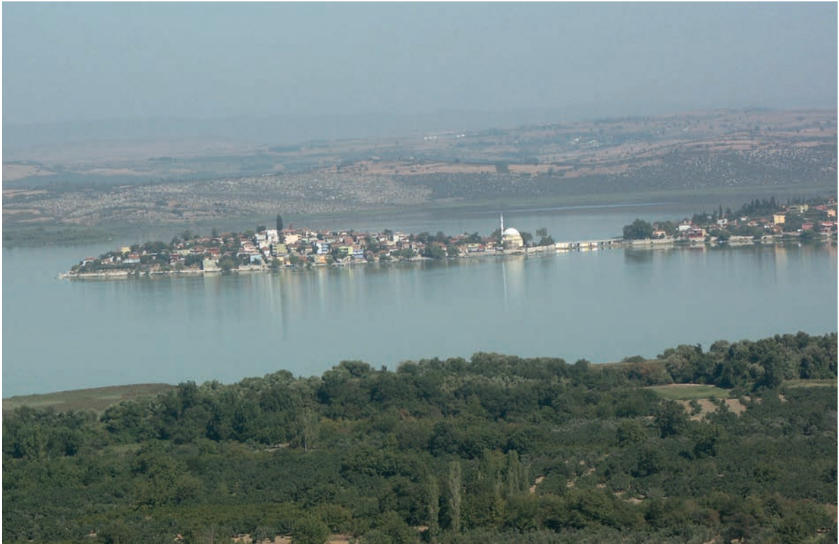
38 Apollōnias, Blick auf Stadt und See