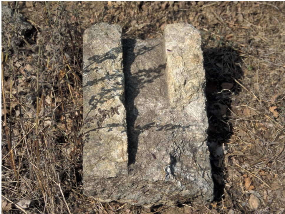
304 Tepeköy, Teil einer Wasserrinne