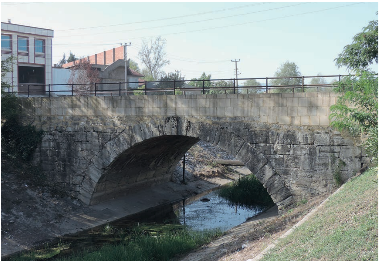
160 Melas, röm. oder frühbyz. Brücke (Zustand 2013)