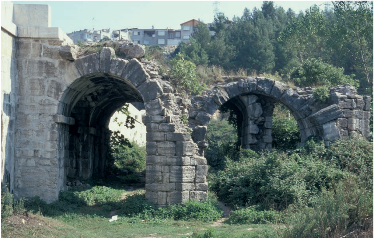
238 Pentegephyra, Anbau im Süden