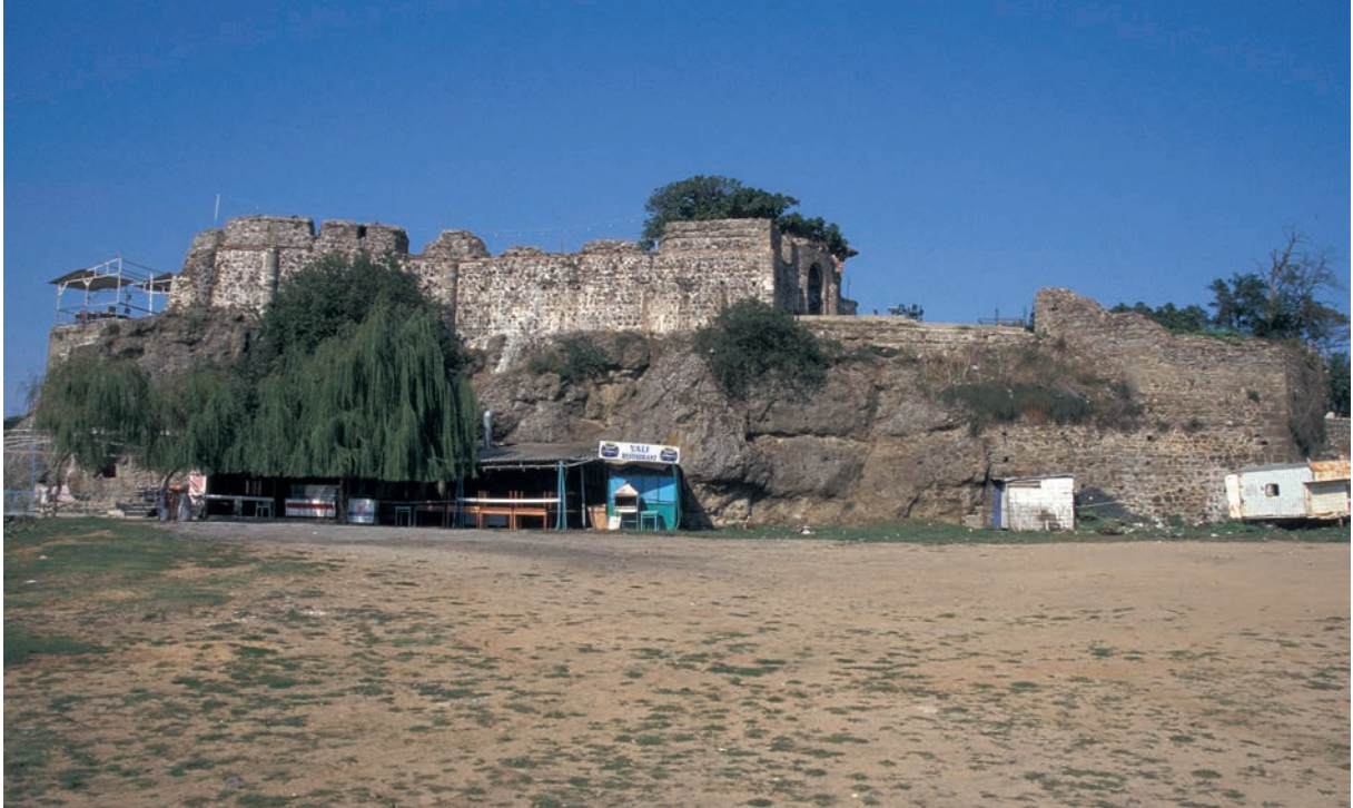
265 Rēbas (1), osmanische Burg