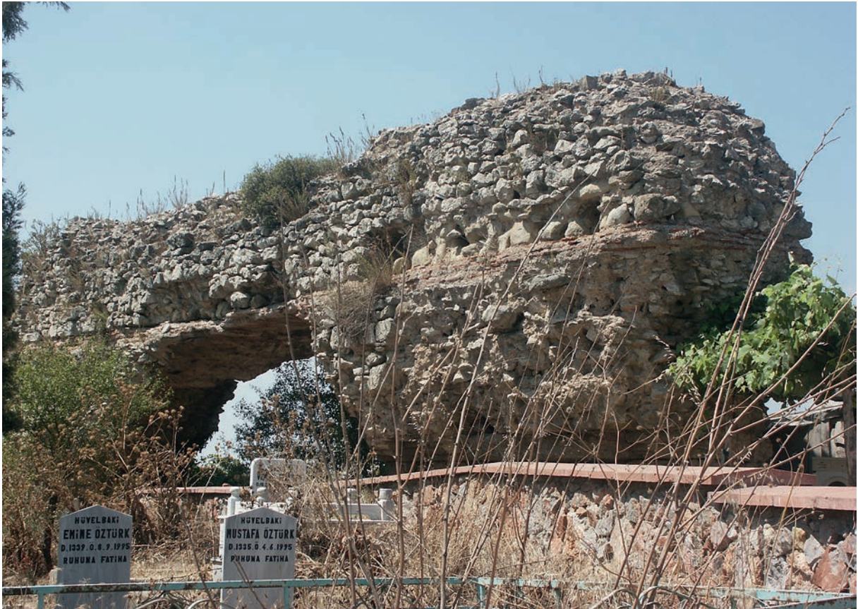
215 Nikomēdeia, diokletianische Stadtmauer im Nordosten