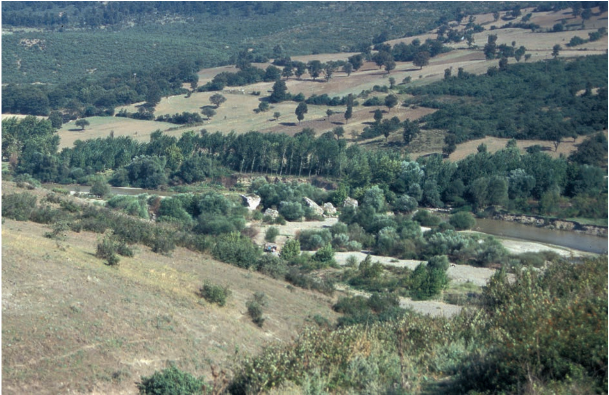
286 Sultançayır, Blick von der Burg auf die Brücke