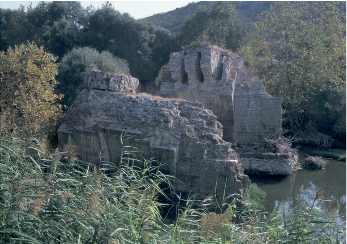
28 Aisēpos, Güverçin Köprüsü