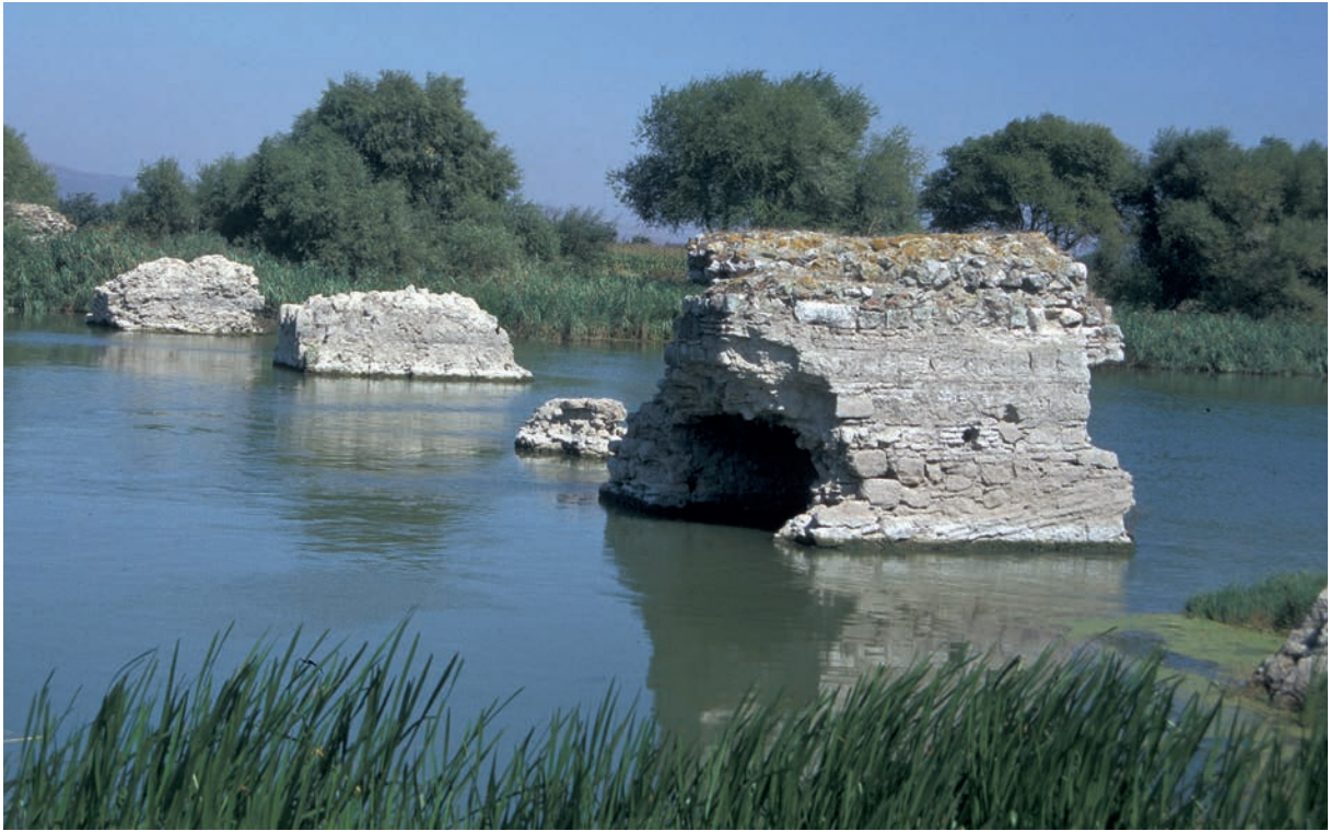
155 Lopadion, alte Brücke