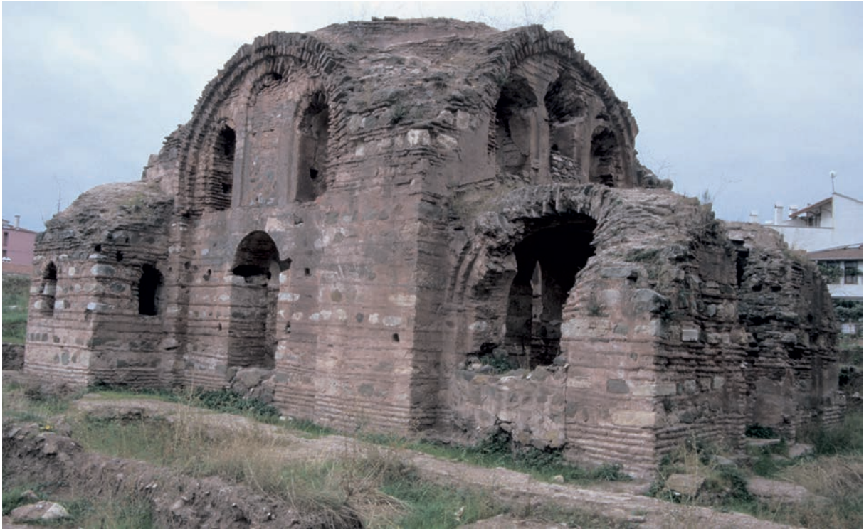
75 Elegmoi, Kirche H. Aberkios von NW