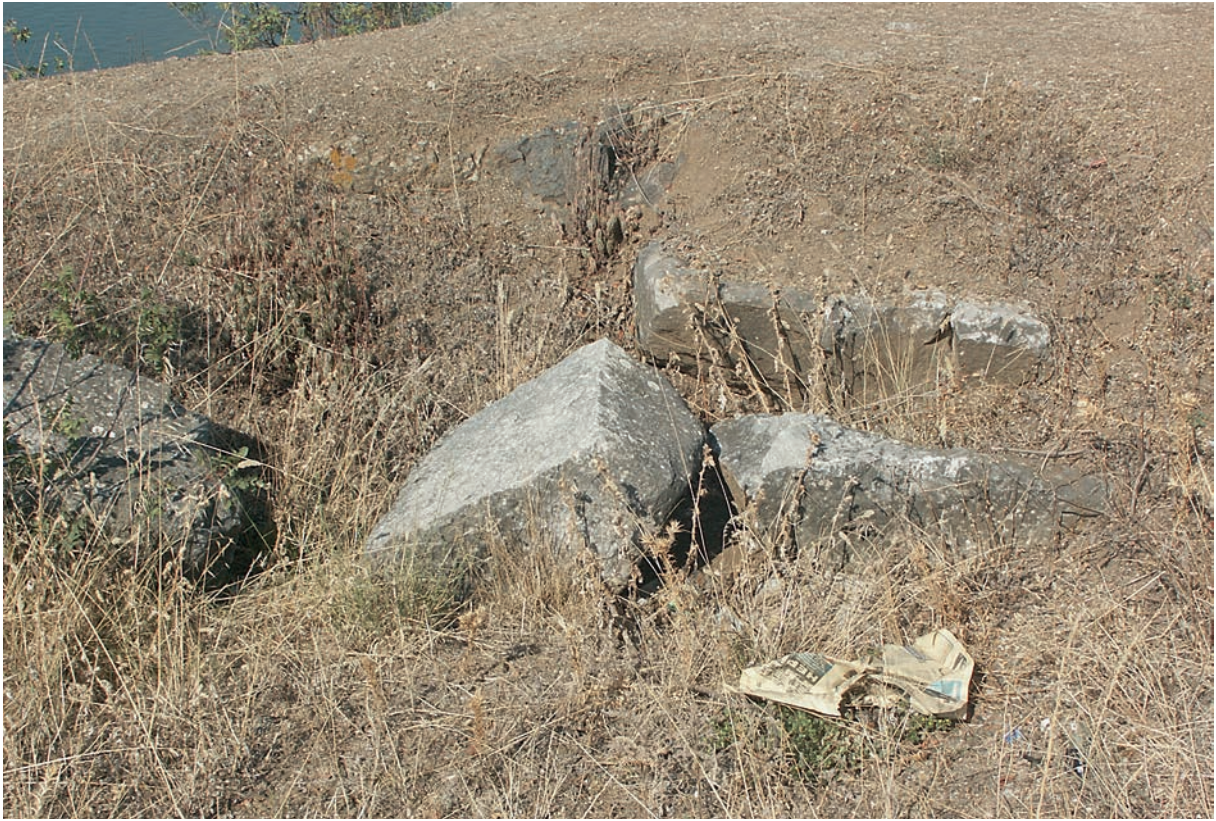
109 Karacakaya (Lokus?), antike Reste auf dem Gipfel