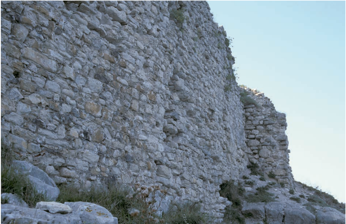
46 Astrabēkē, Kurtine