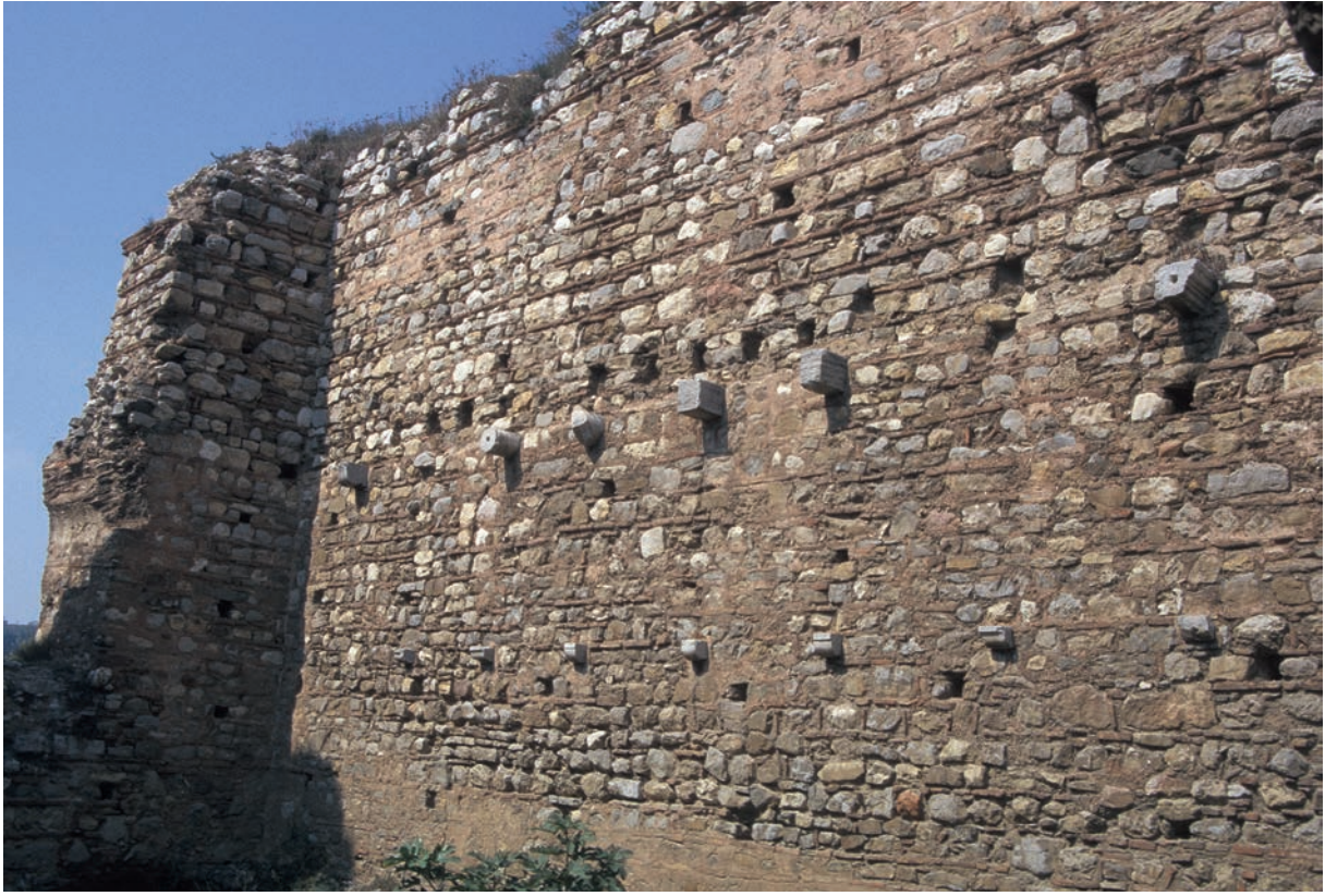
208 Nikētiatu Phrurion, Nordwand des Palastgebäudes von innen