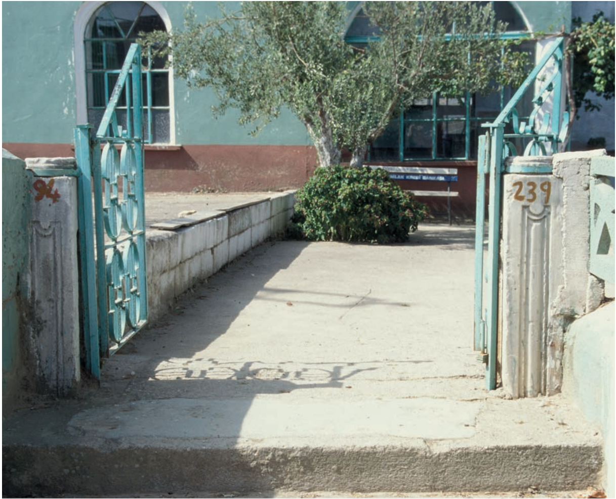
282 Skamandros (1), Schrankenpfeiler