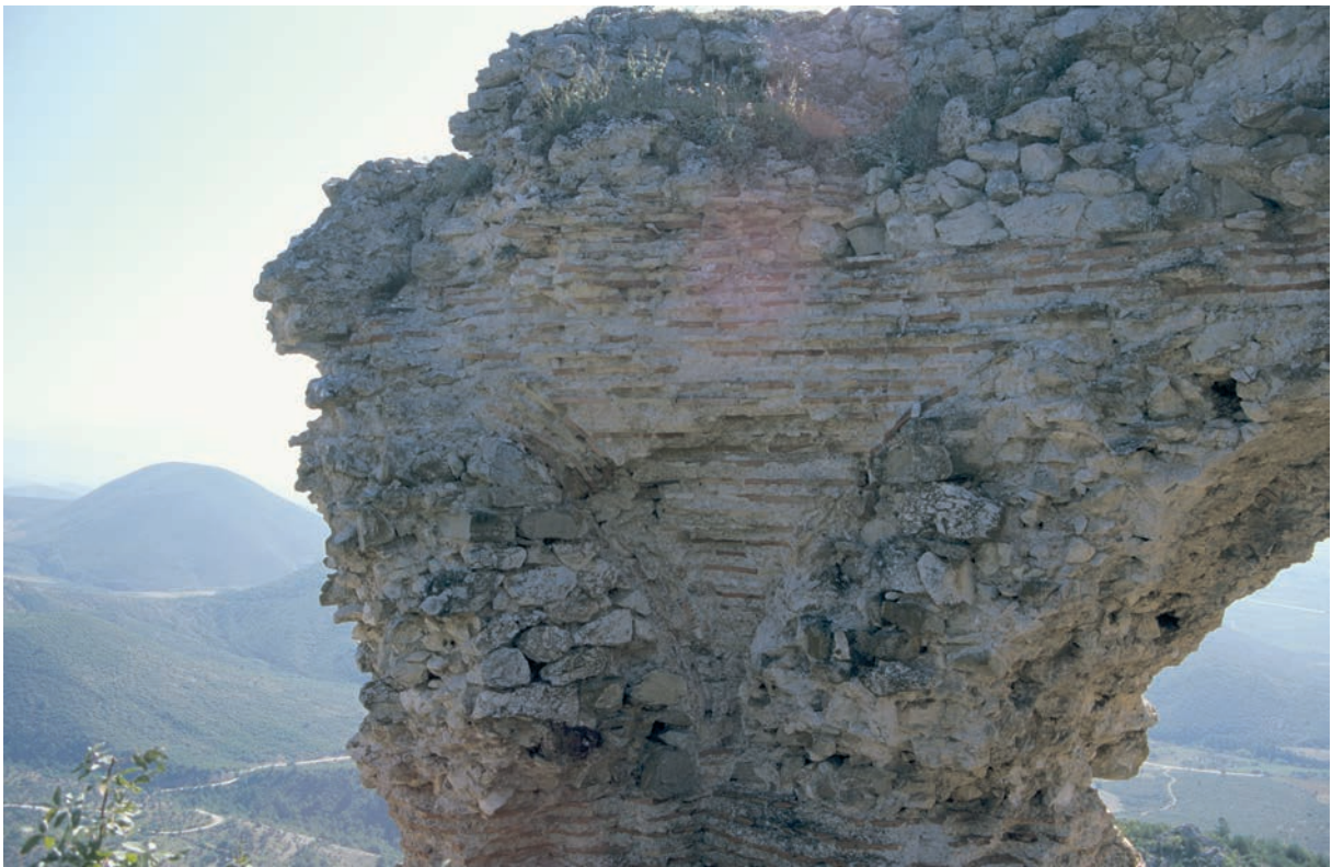
162 Metabolē, Festung, komnenenzeitliches Turmgebäude von innen