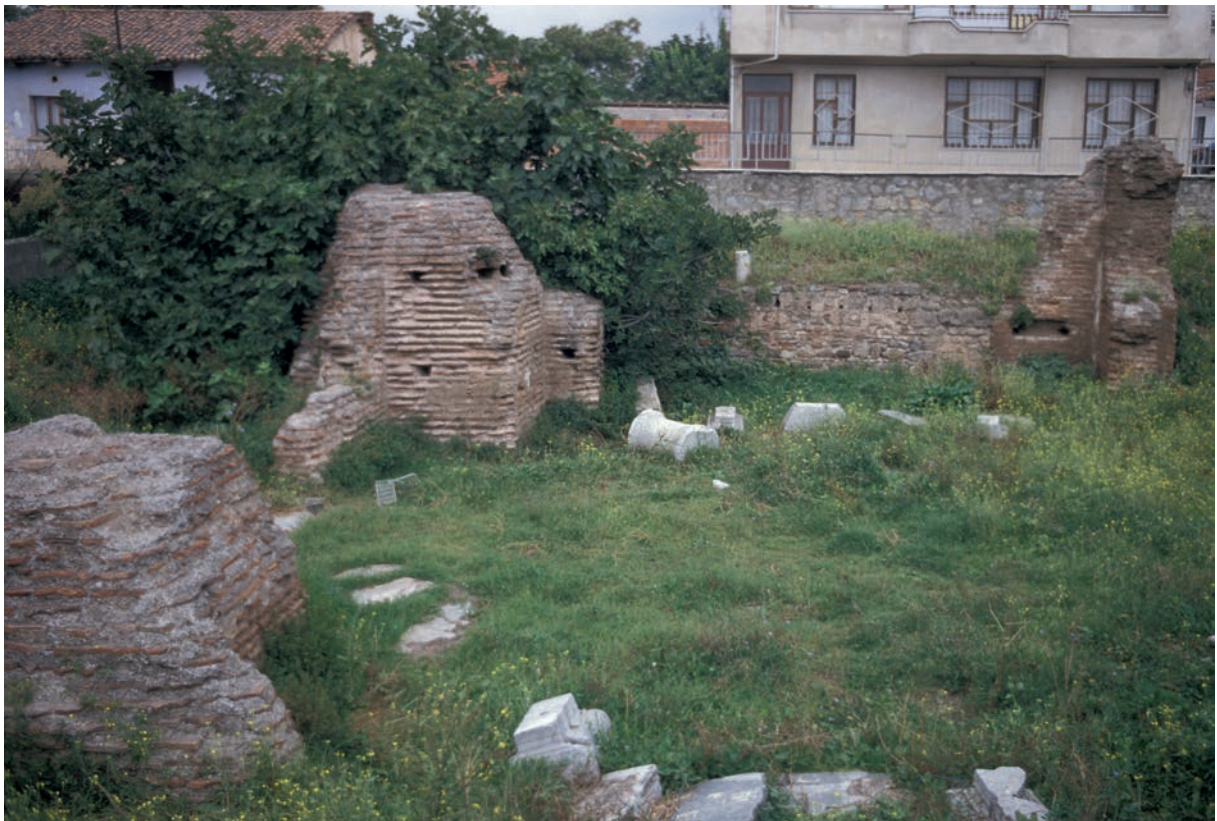
205 Nikaia, Reste der Koimēsis-Kirche