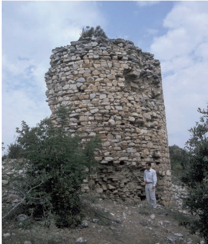
21 Adrianoi, Turm der ma. Befestigung