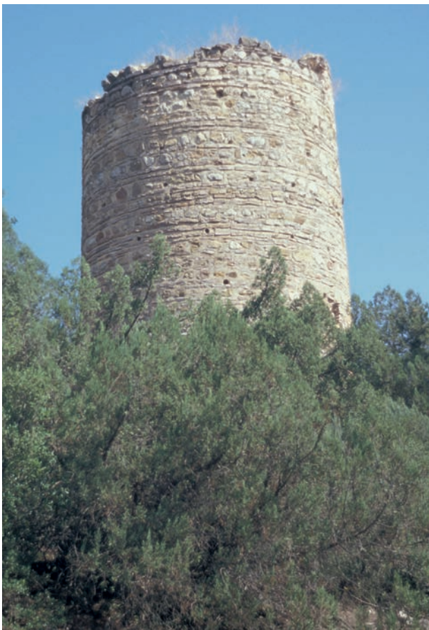
101 İki Kule, Turm der Festung