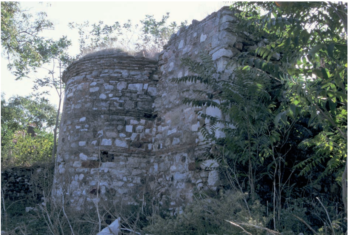
80 Gulios, Apsis der neuzeitl. Kirche Archangelos Michaël