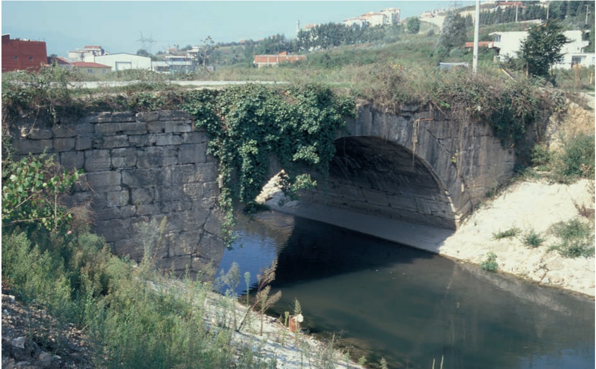
159 Melas, röm. oder frühbyz. Brücke (Zustand 2000)