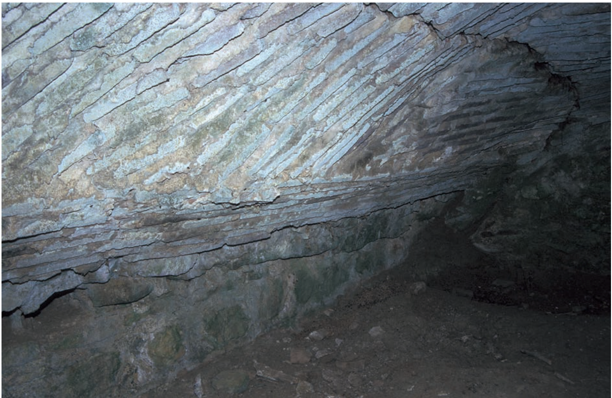
35 Akköprü, Brücke über den Granikos, Gewölbe des Unterbaues des Straßendamms