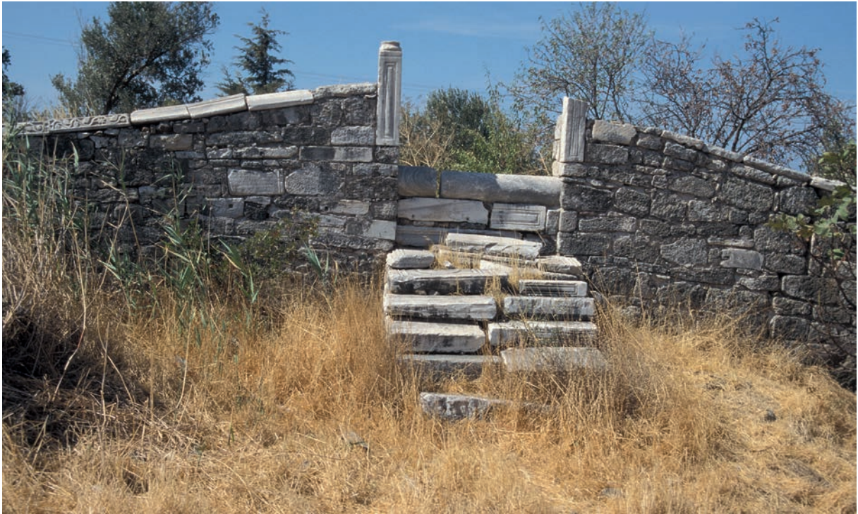
128 Kösedere, Spolien am Eingang zum Friedhof