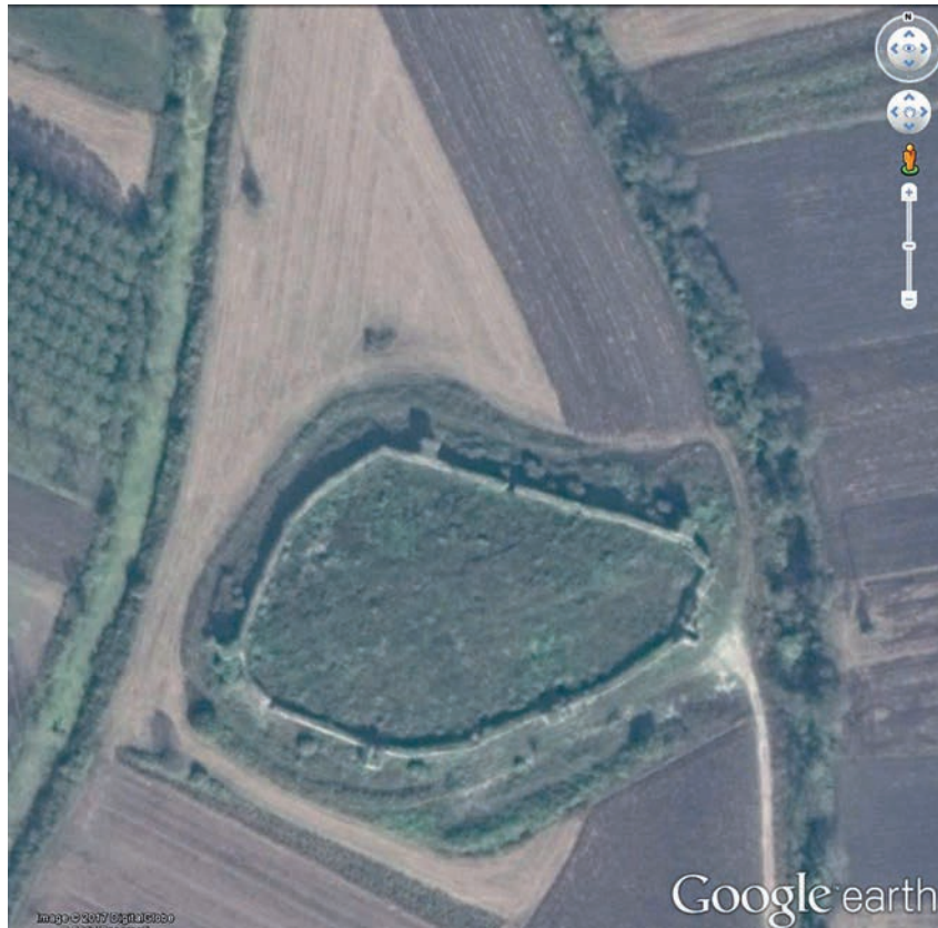
86 Harmantepe Kalesi