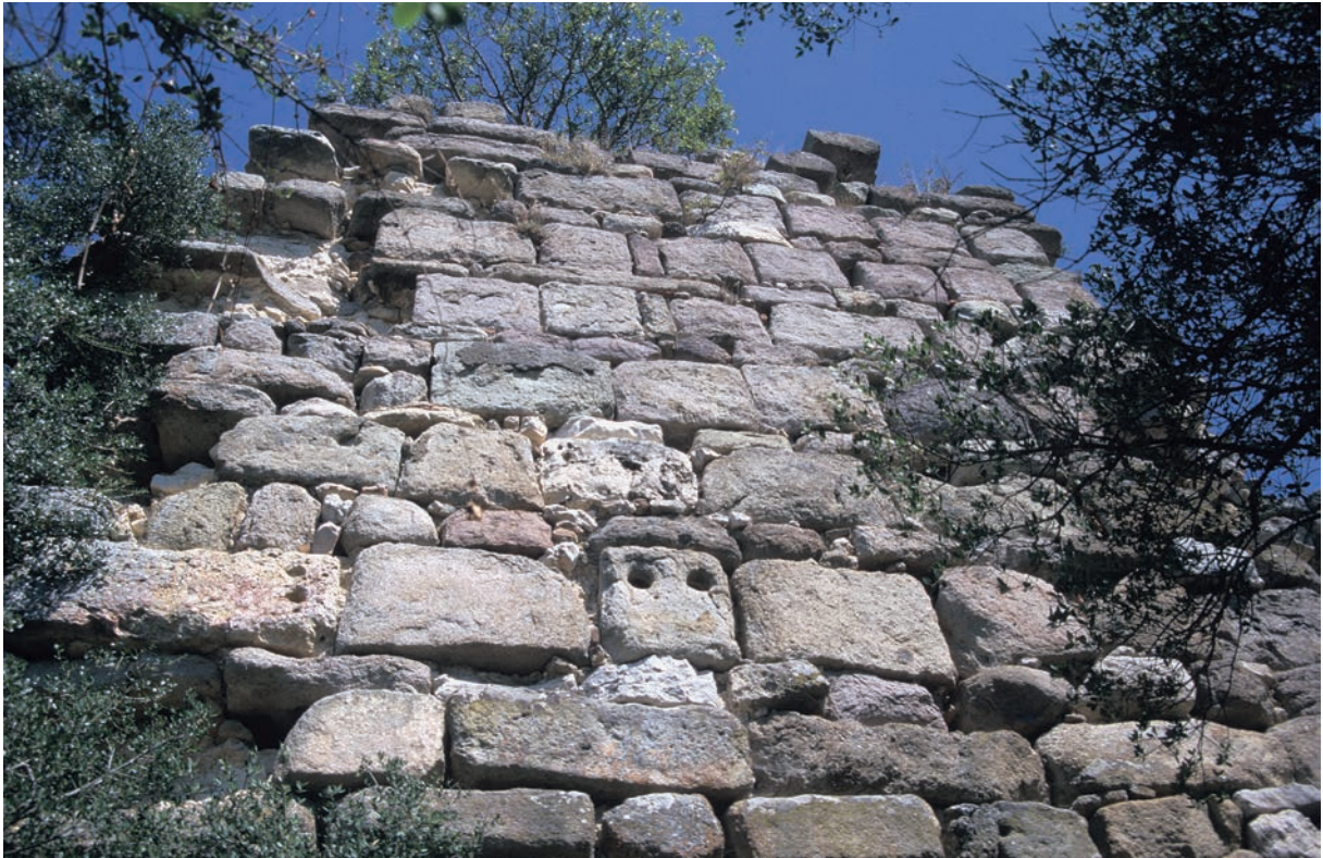
220 Palaia, Kurtine nahe dem Südturm