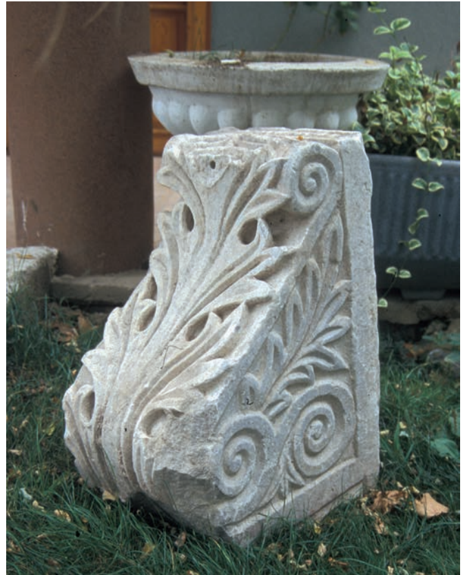
184 Neochōraki, Konsolstück