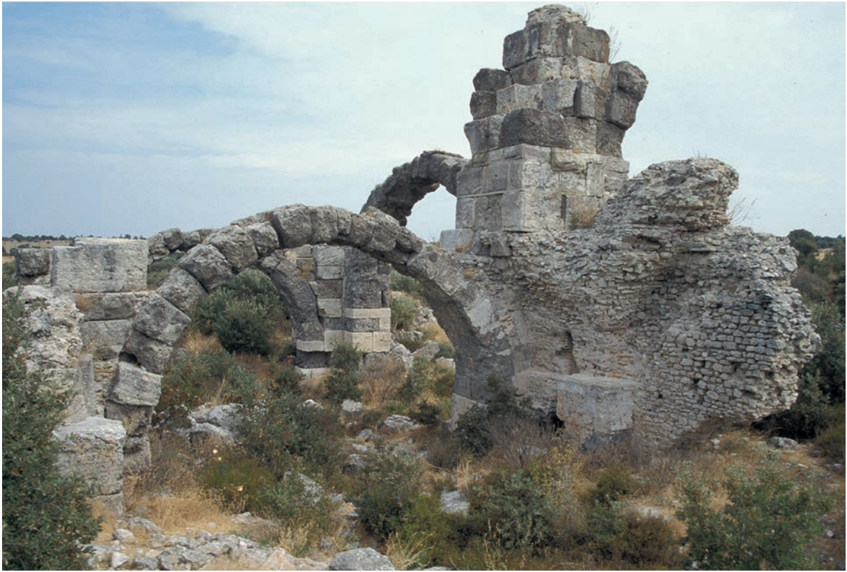
318 Trôas (1), Thermen des Herodes Attikus (Zustand 1997)