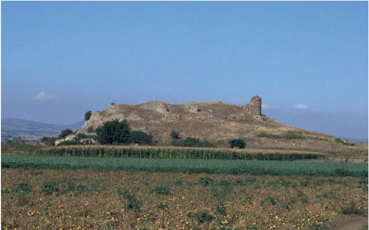
149 Lentiana, Festung von Südwesten