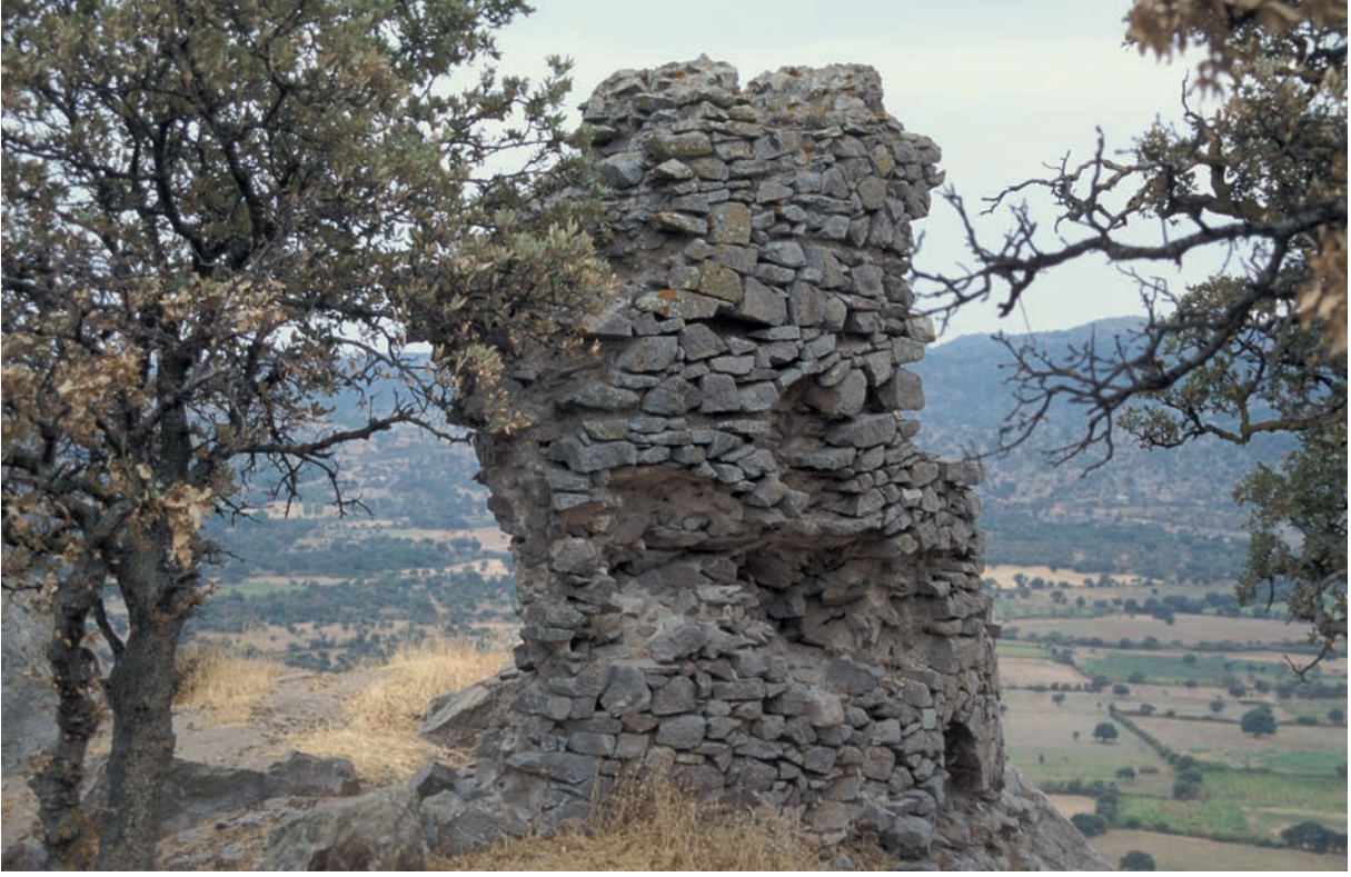
126 Kızkalesi, Turm