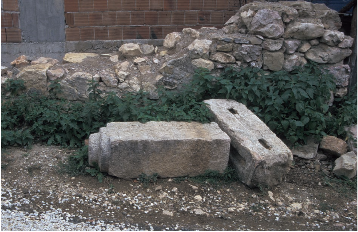
324 Yeniyrük, Schrankenpfeiler