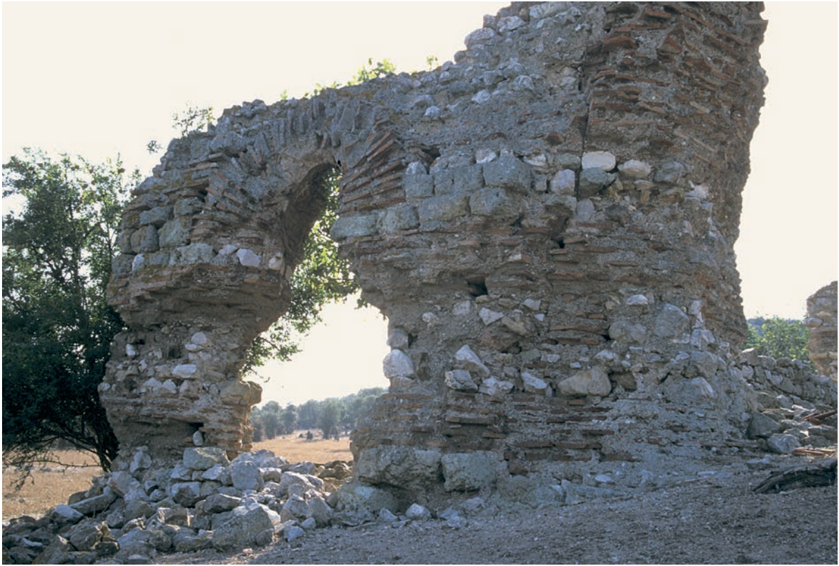
105 Kadina, byz. Gebäude von NO