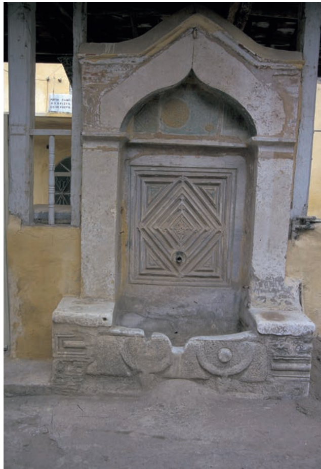
315 Trigleia, Christus-Kirche, (Fatih Camii), osman. Brunnen mit antiken und byz. Spolien