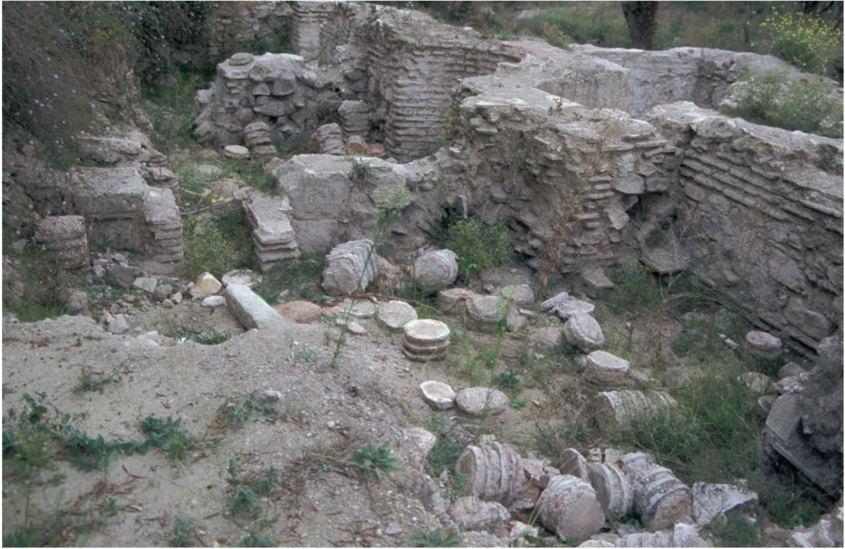
36 Apameia, Thermenanlage