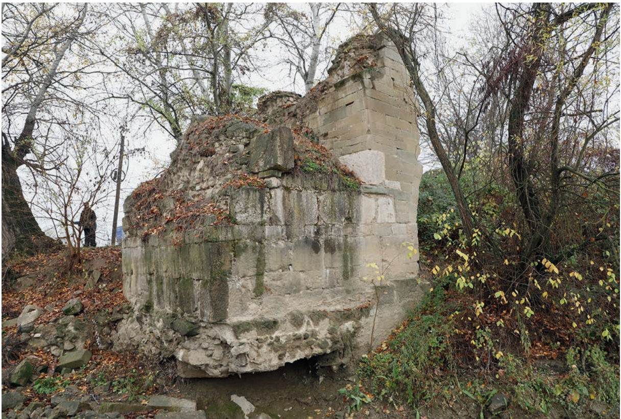
297 Taşköprü (2), alte Brücke, Pfeiler mit Ansatz des osman. Oberbaues