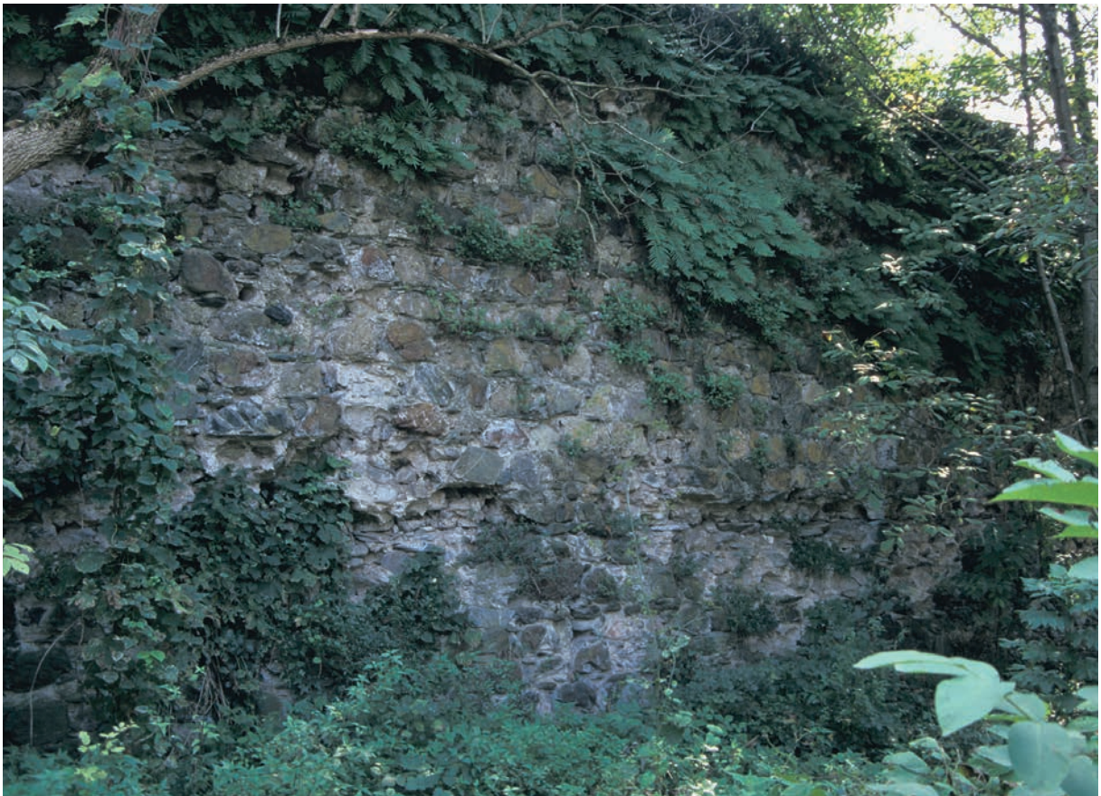
55 Büyükkale, Burg von innen