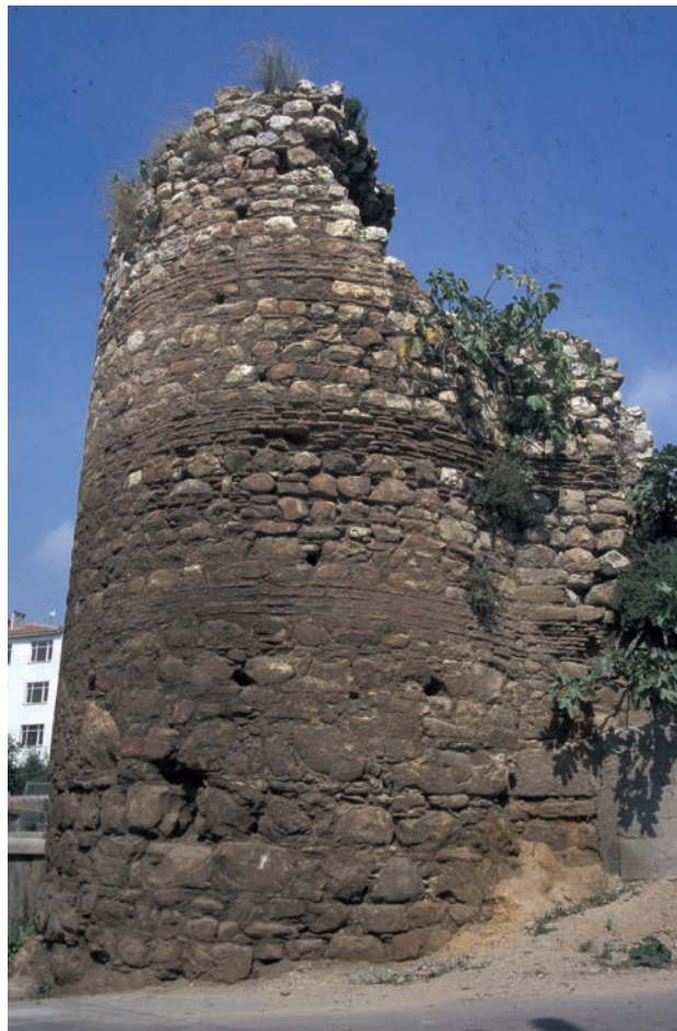
268 Ritzion, Turm der byz. Befestigung