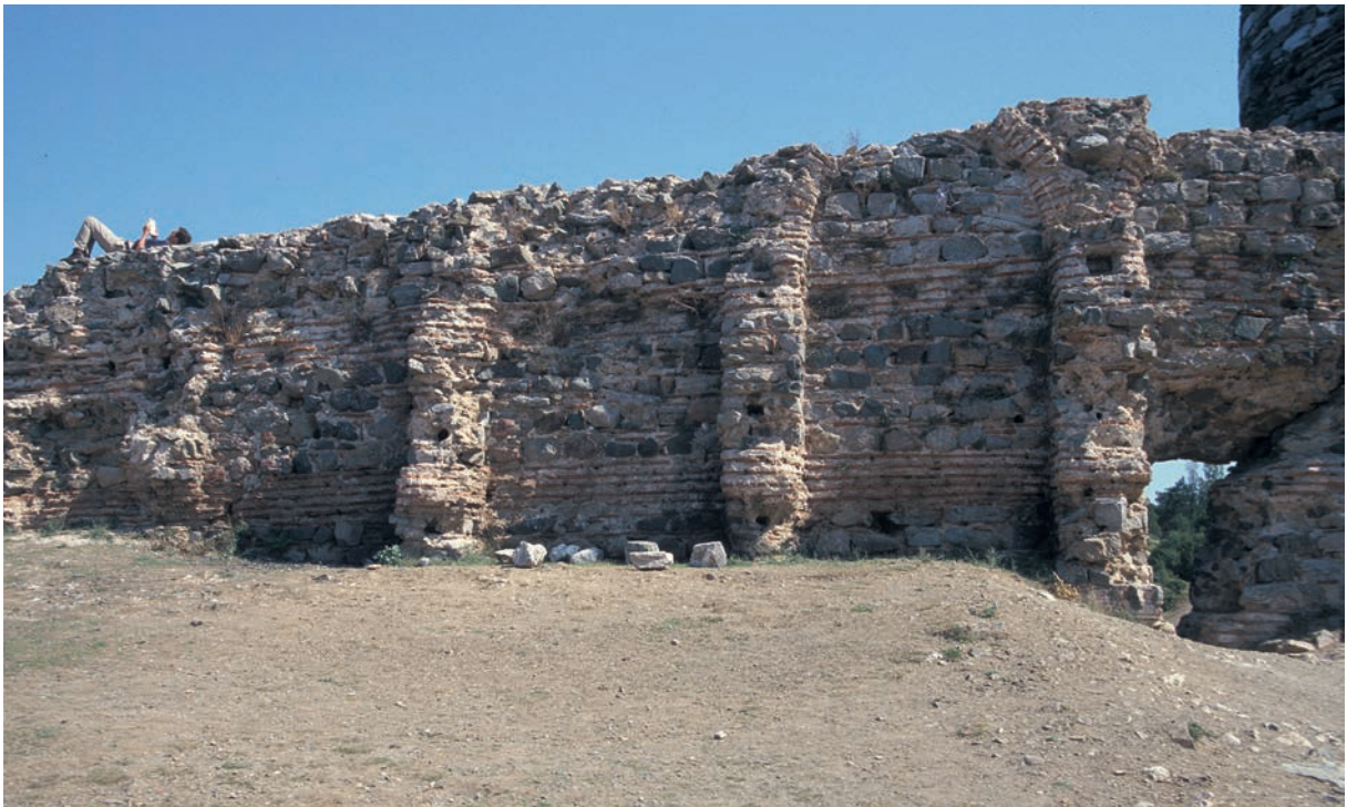
266 Rēbas (1), osmanische Burg, Detail der Kurtine