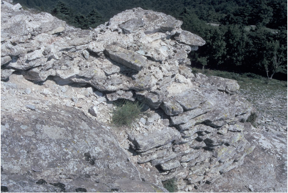
56 Çatalca Dağı, Befestigung