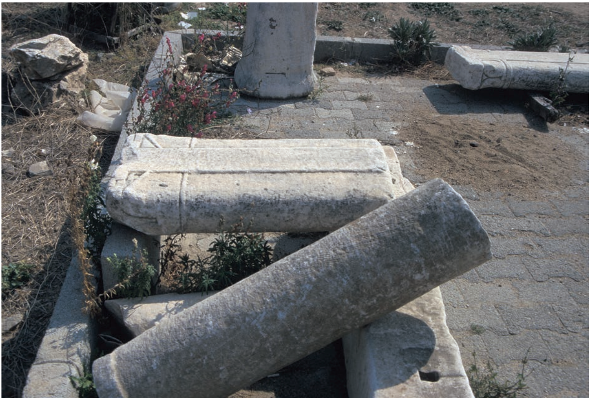
251 Priapos, frühbyz. Architekturfragmente (vielleicht von Fundstellen der Umgebung)