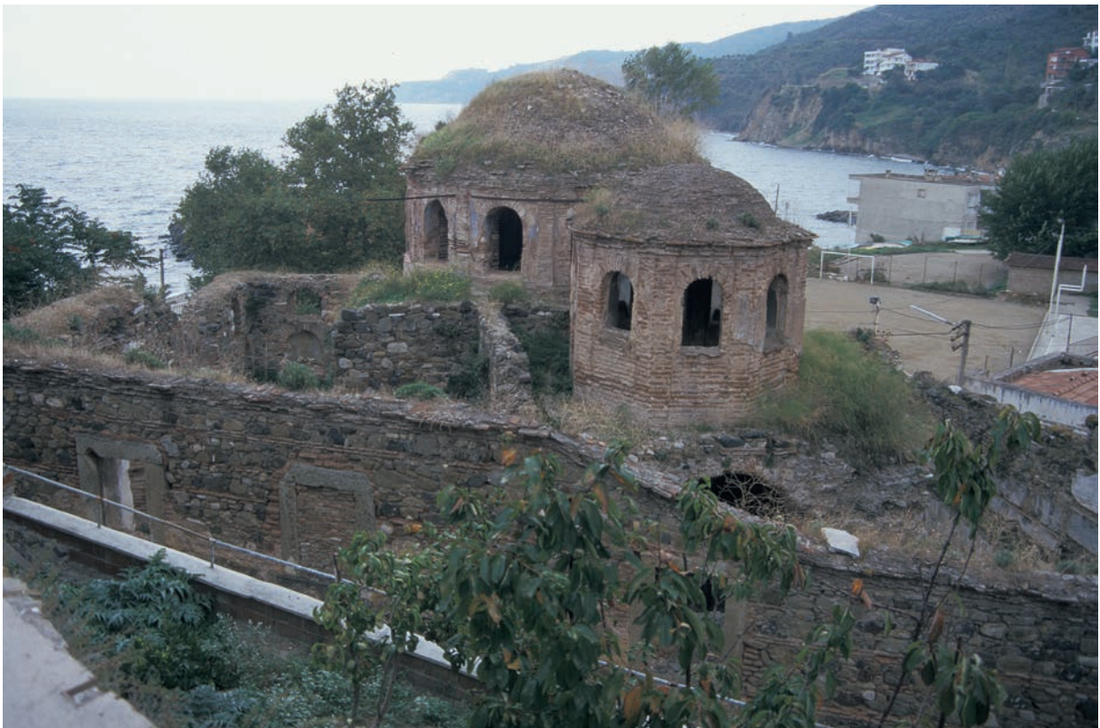
293 Sykē, Michaelskirche, Gesamtanlage von Nordwesten