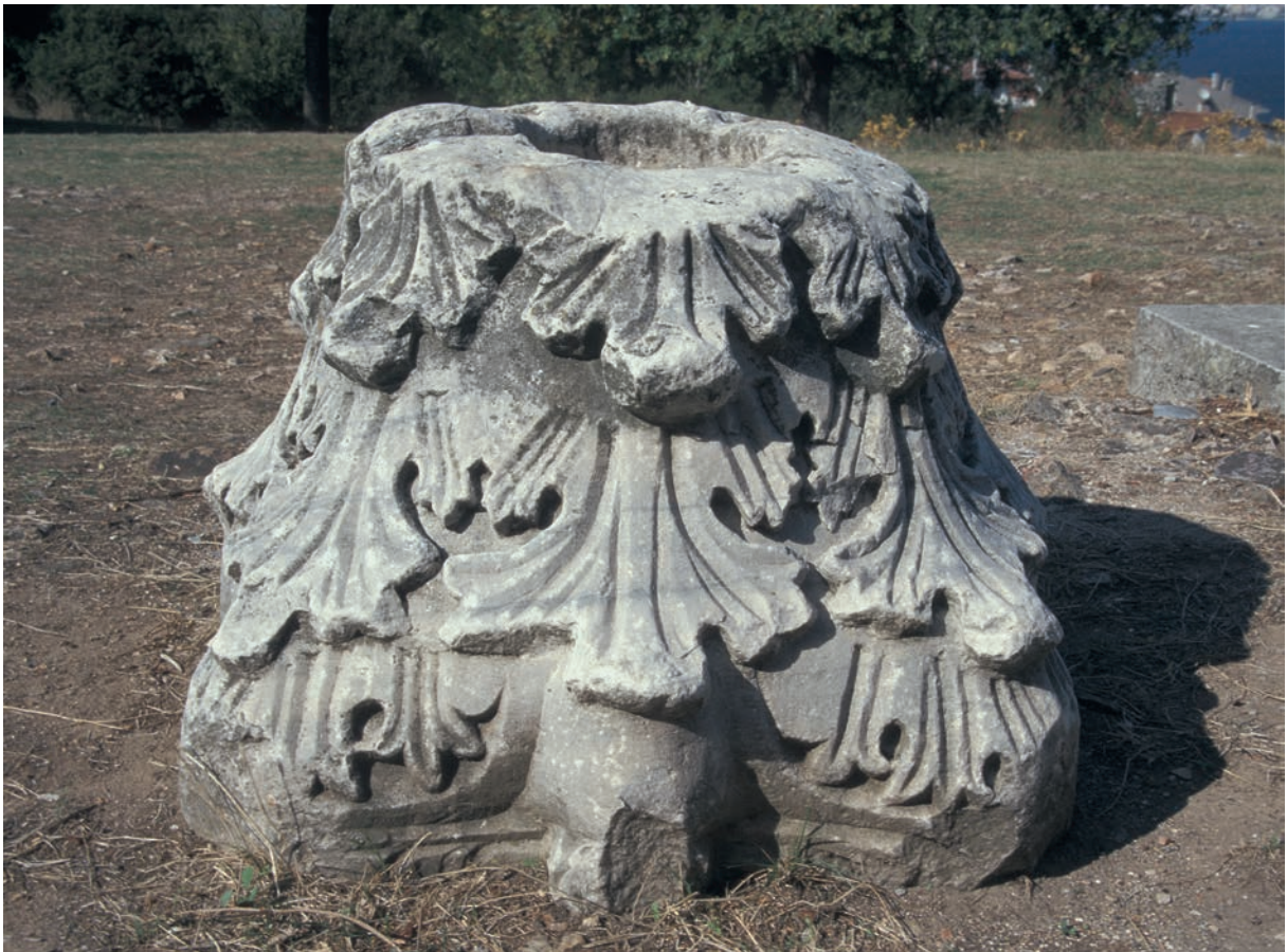
166 Metamorphōseōs Sōtēros Monē (auf Prōtē), korinth. Kapitell