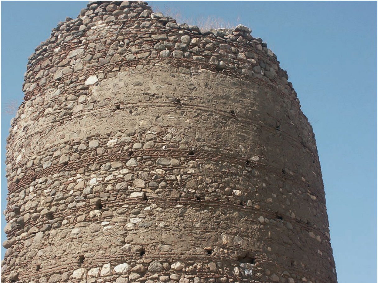
151 Lentiana, Festung, Turm, Detail