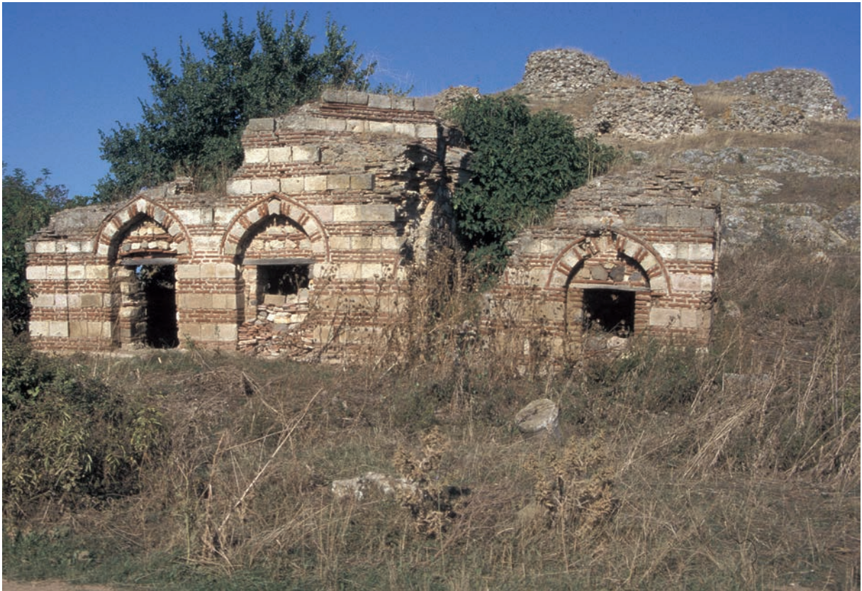
148 Lentiana, osmanische Külliye mit Spolien