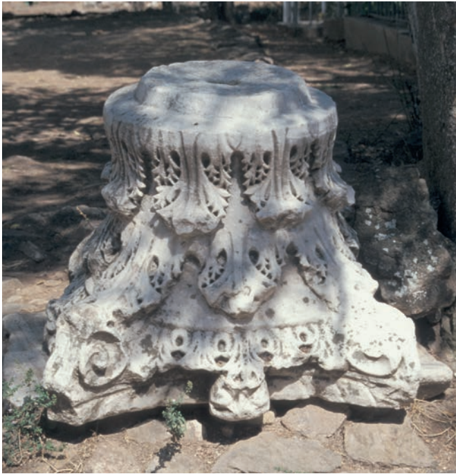
169 Metamorphōsis Christu auf Antigonu Nēsos, Kompositkapitell