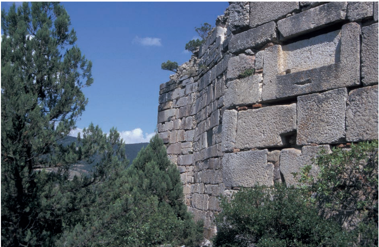
164 Metabolē, Festung, Kurtine des 7. Jh.