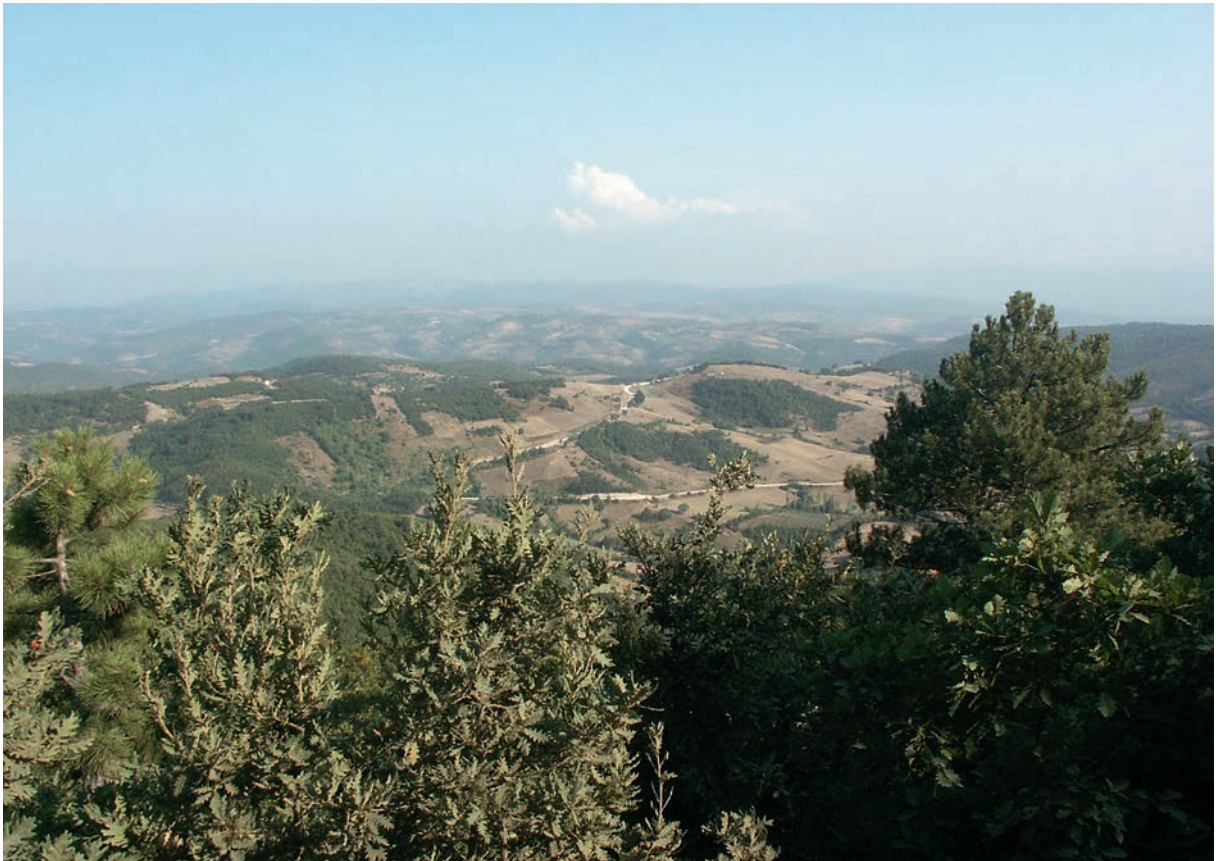
2 Östliche Samanlı Dağları zwischen dem Golf von Nikomēdeia und dem See von Nikaia