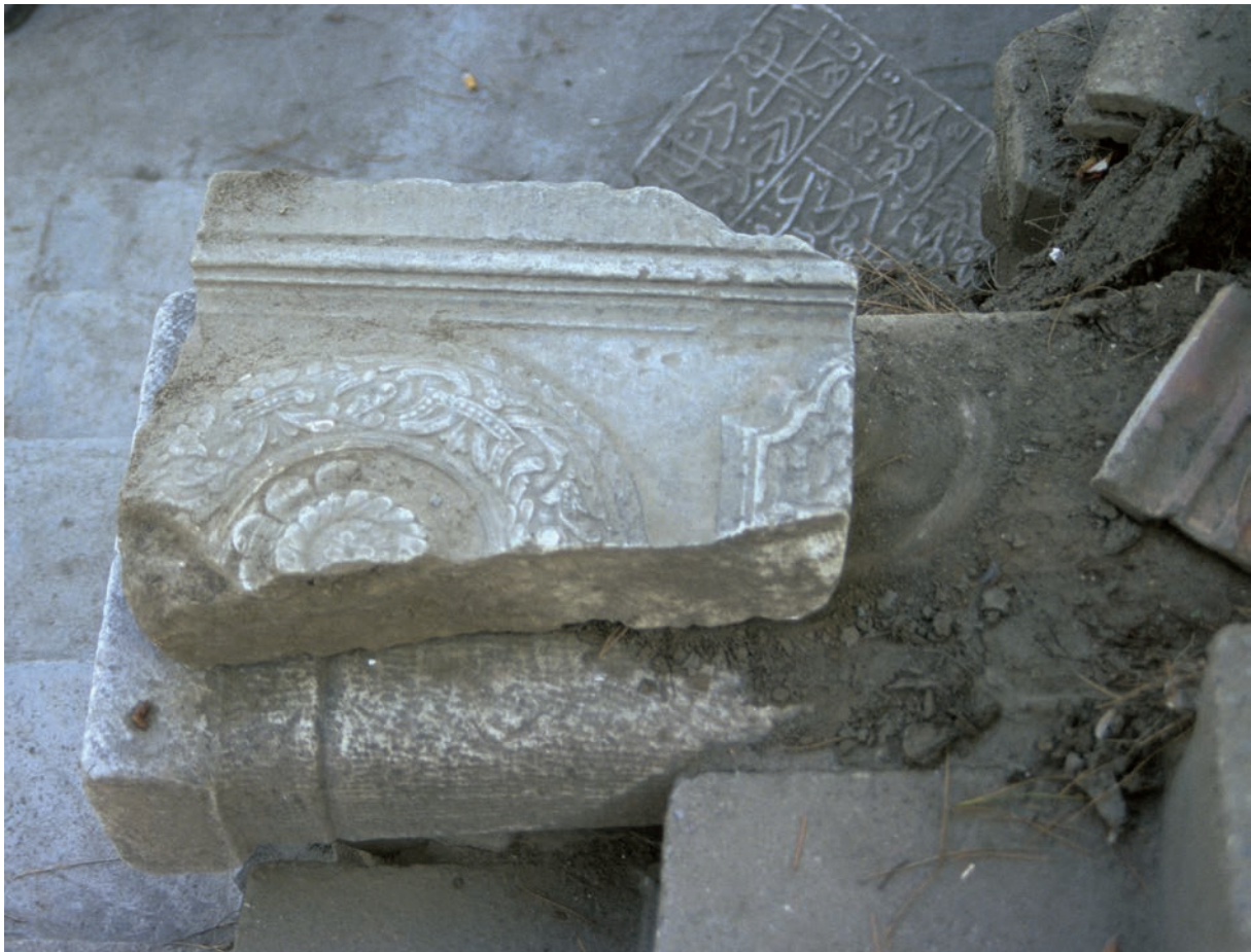
31 Akhisar, osman., ornamentierte Steinplatte auf frühbyz. Doppelsäule