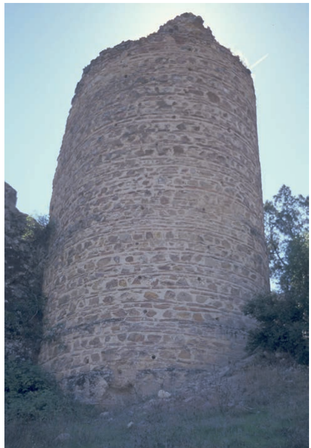
102 İki Kule, Turm der Festung