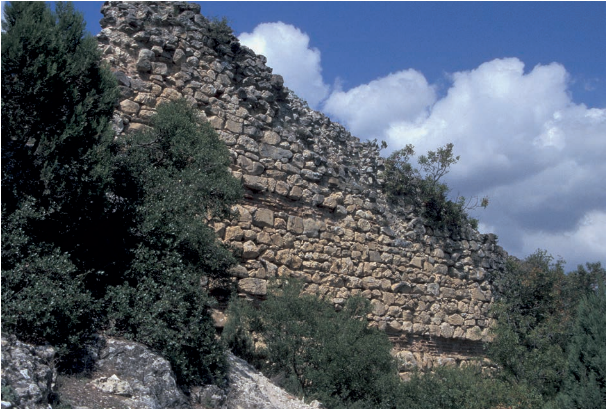
163 Metabolē, Festung, komnenenzeitliche Kurtine