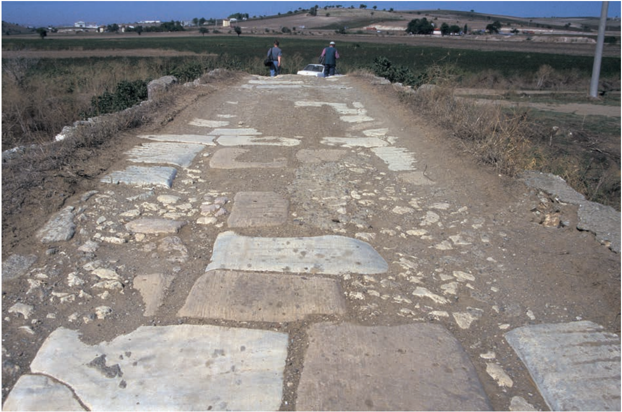
309 Troypē, alte Brücke, Pflasterung