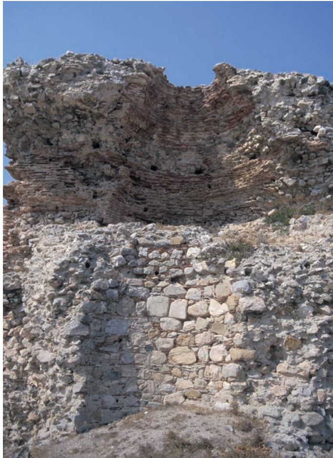
232 Pēgai, Turm der Stadtmauer, Innenseite