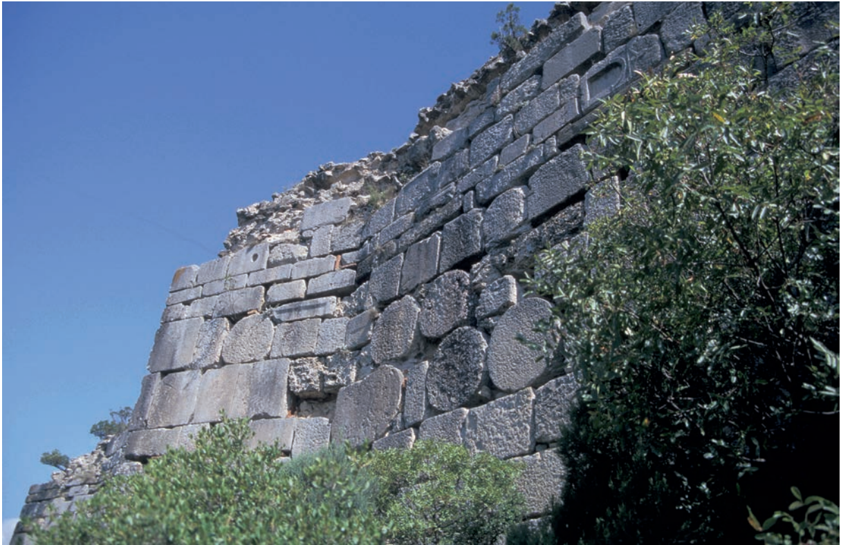
165 Metabolē, Festung, Kurtine des 7. Jh. mit Spolien und Dreieckbastion