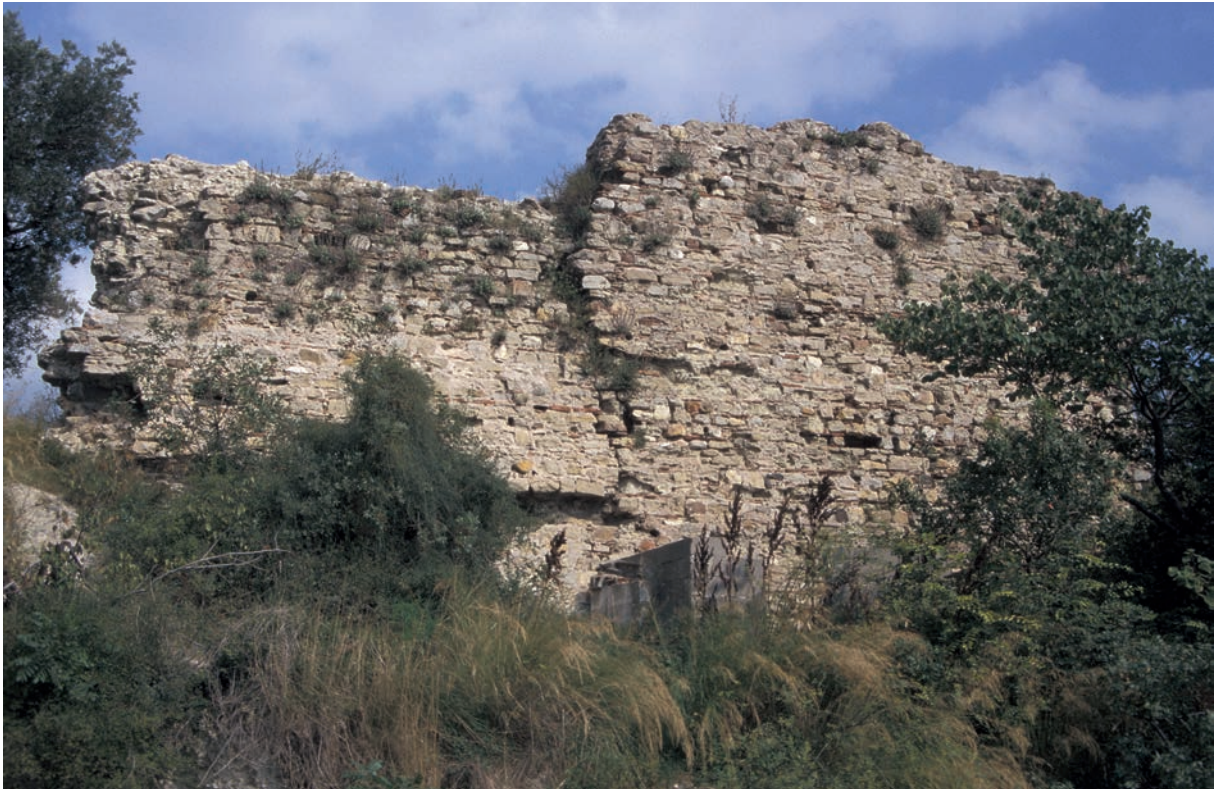
62 Charax, Kurtine