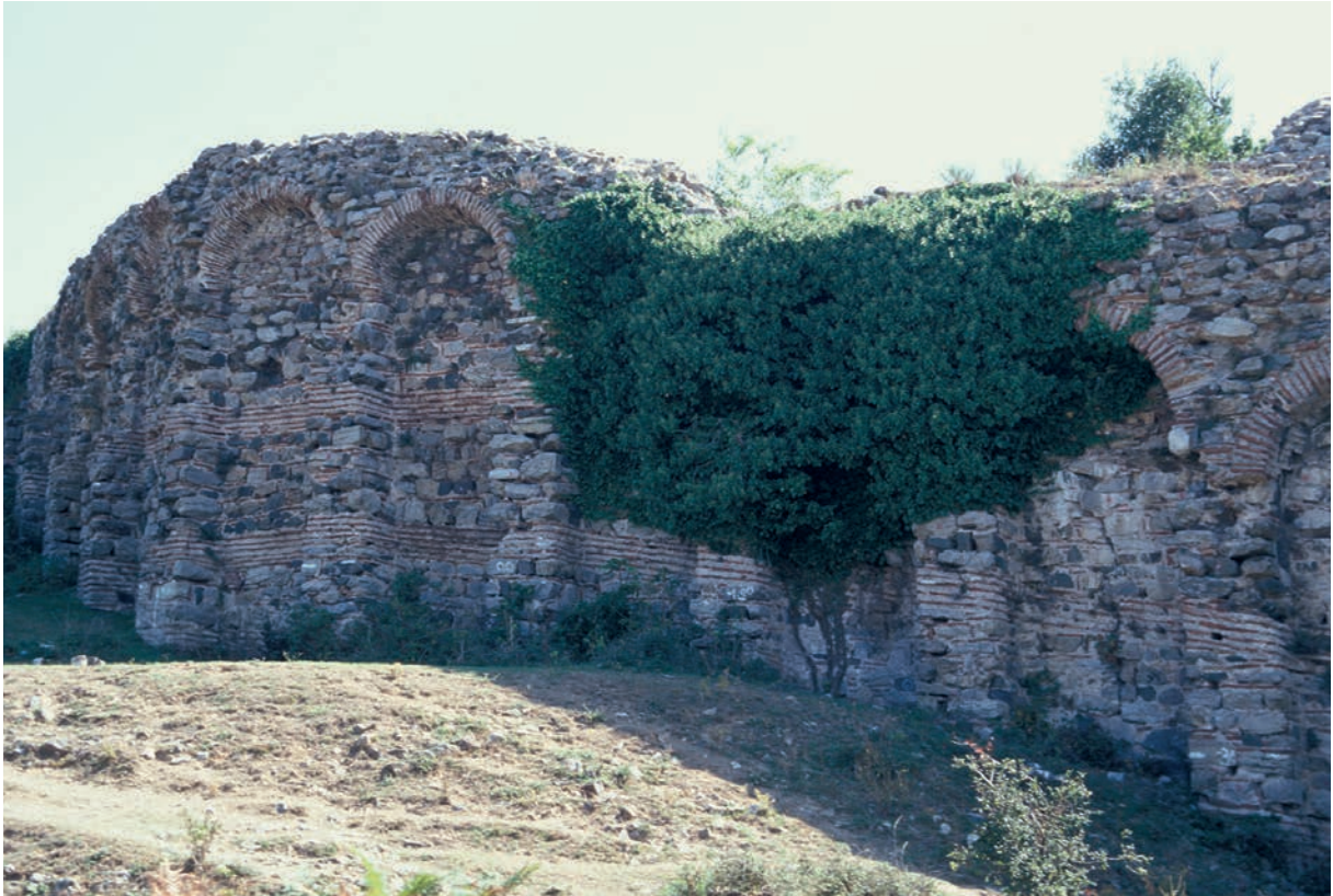
98 Hieron, Festung, Kurtine, Innenseite