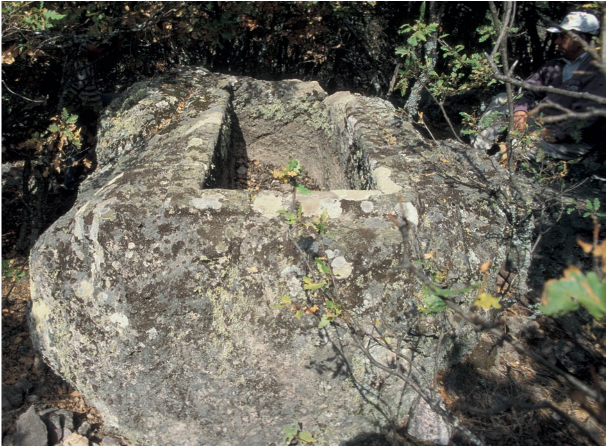
157 Markaion, Chamosorion