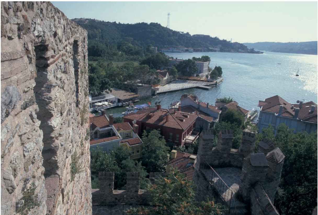
249 Potamōnion, osman. Festung Anadolu Hisarı mit Mündung des Aretae (Göksu)