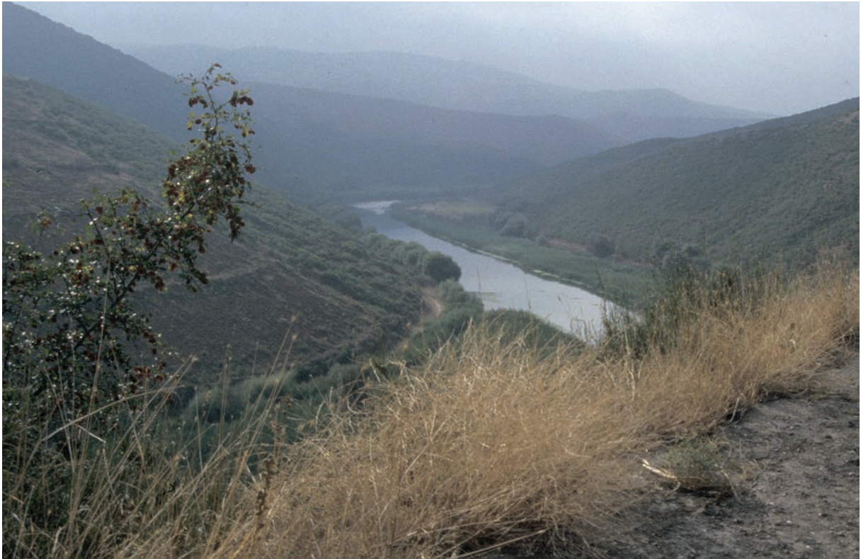
7 Makestos (angestaut) bei Attaos