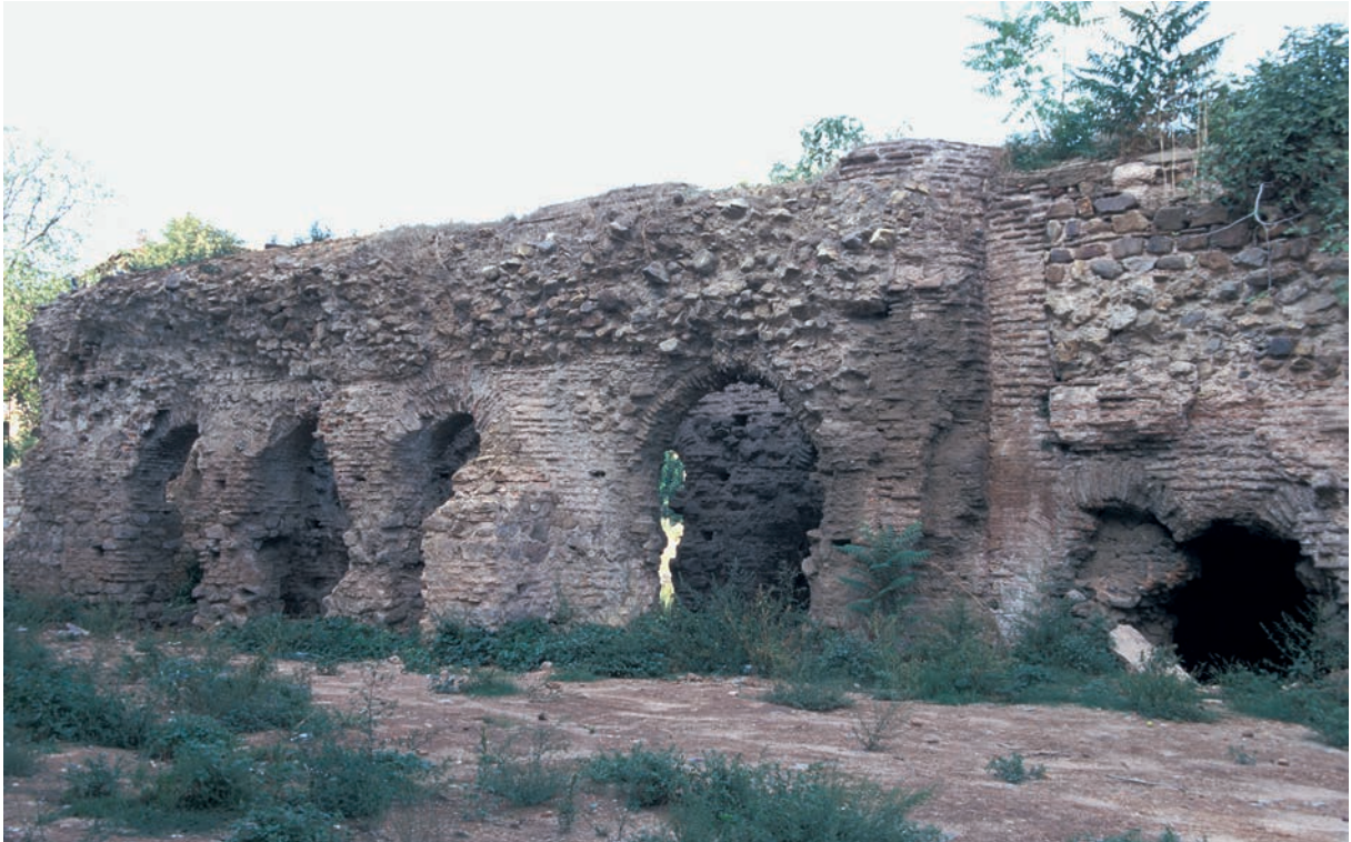
68 Damatrys, Ruinen des Palastes