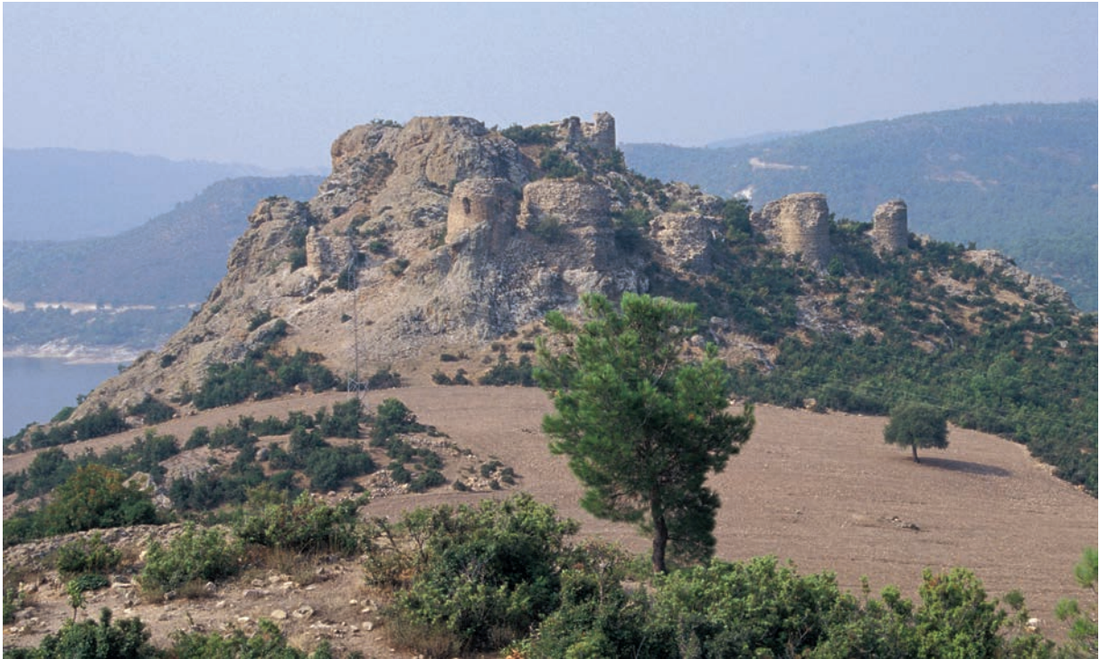
130 Kremastē, Lage der Festung