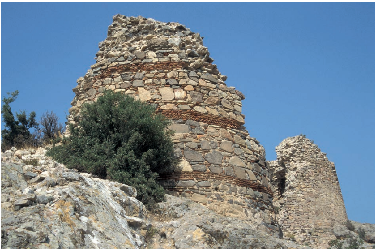
133 Kremastē, Turm 7