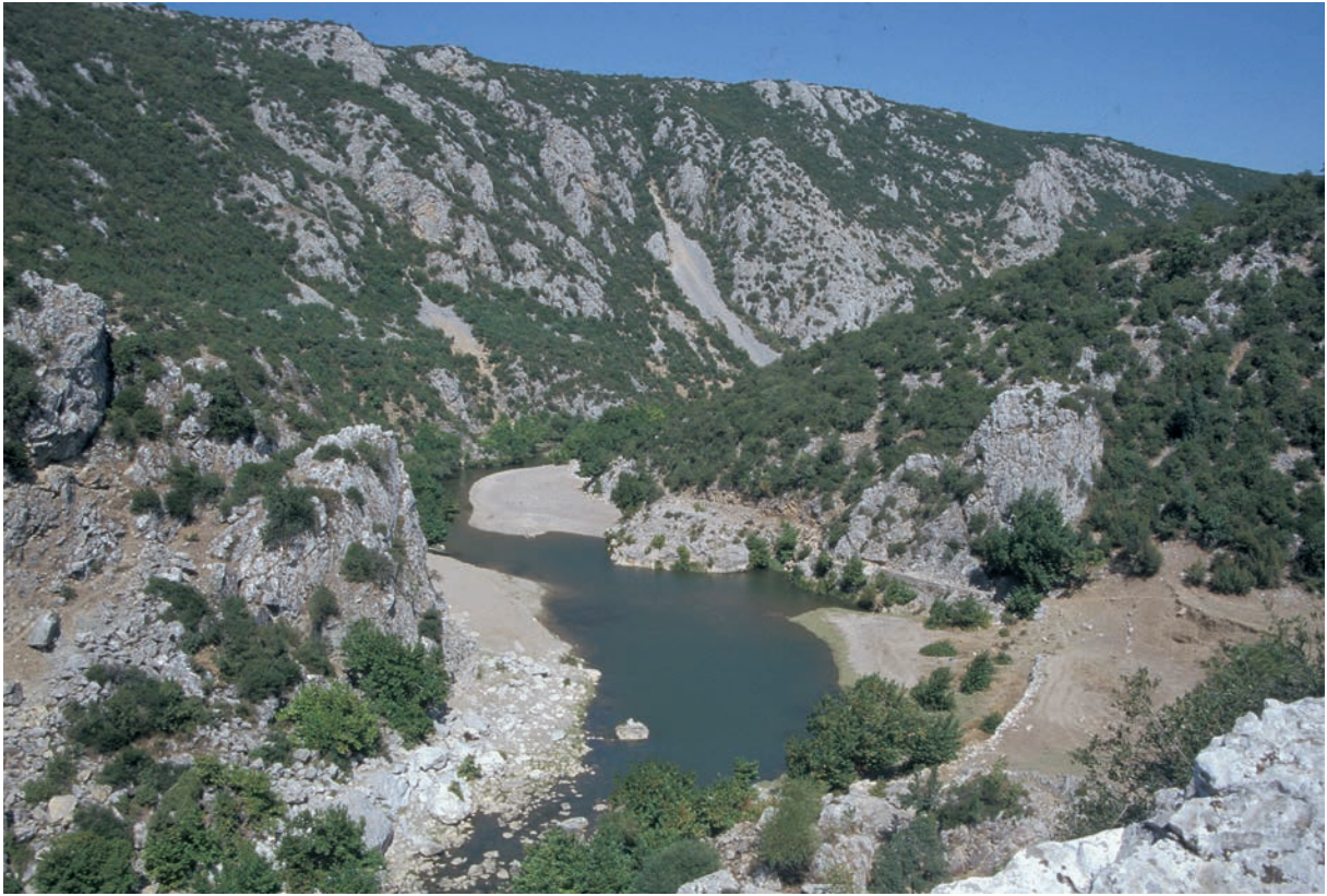
244 Pionia, Empēlos von der Burg aus gesehen