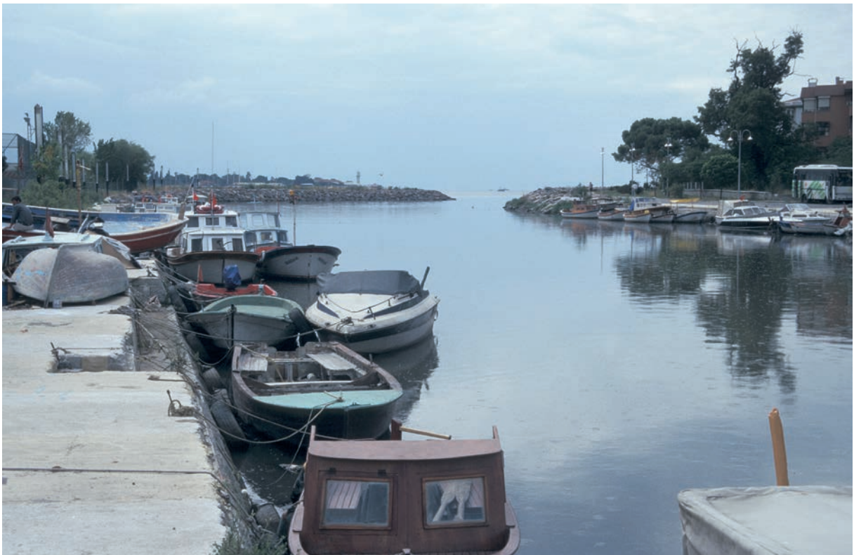
61 Chalkēdōn (2), Fluß Richtung Mündung