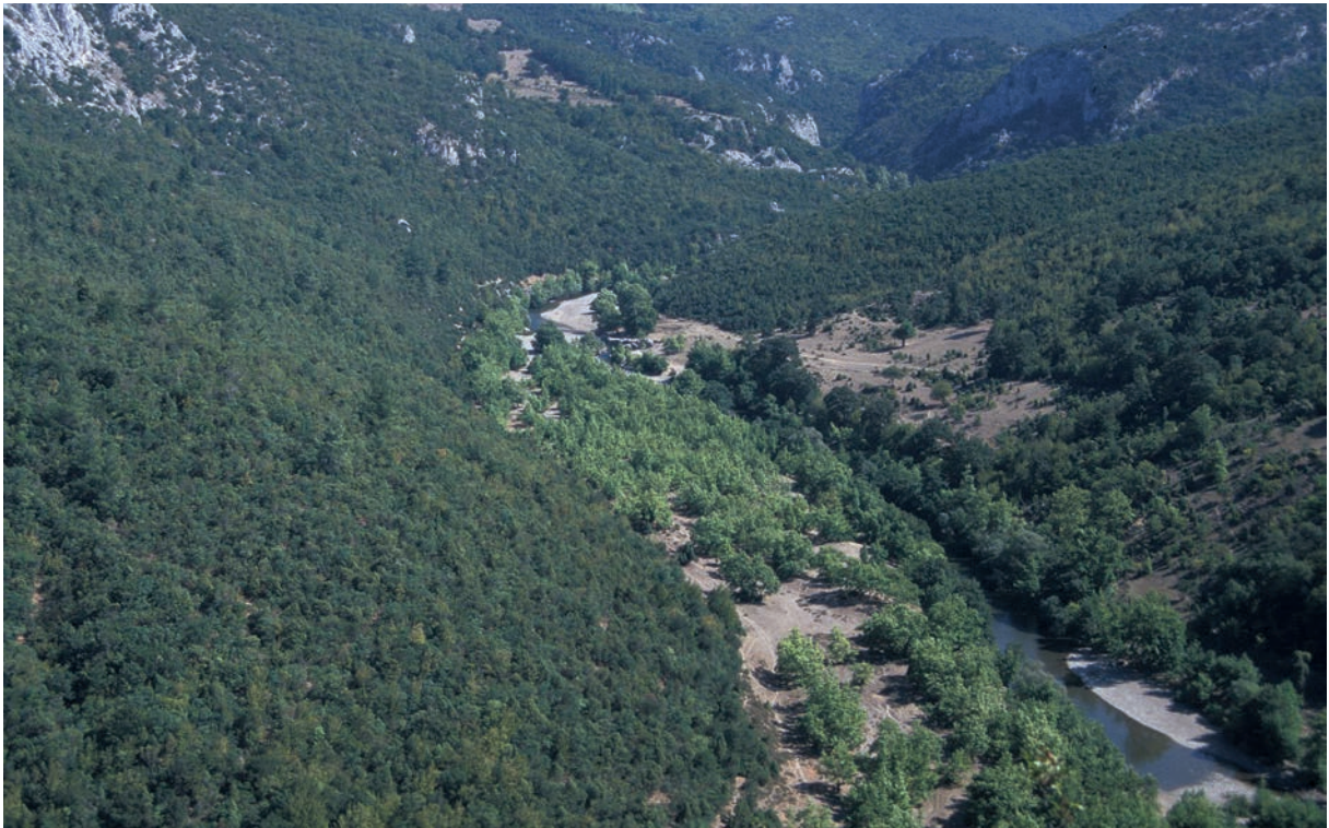
8 Empēlos bei Palaia, flußaufwärts