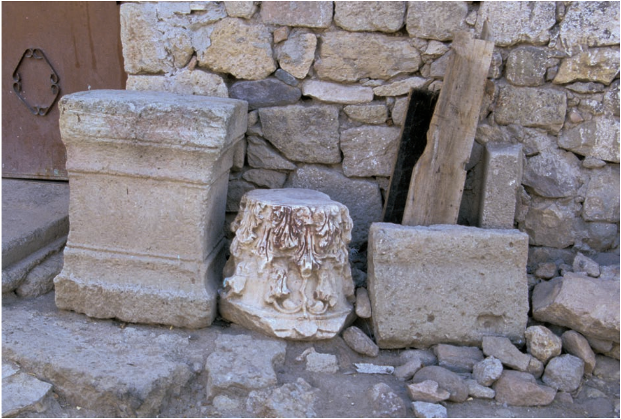
100 Hisarköy, antike und byz. Architekturfragmente