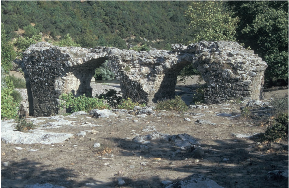
222 Palaia, alte Brücke