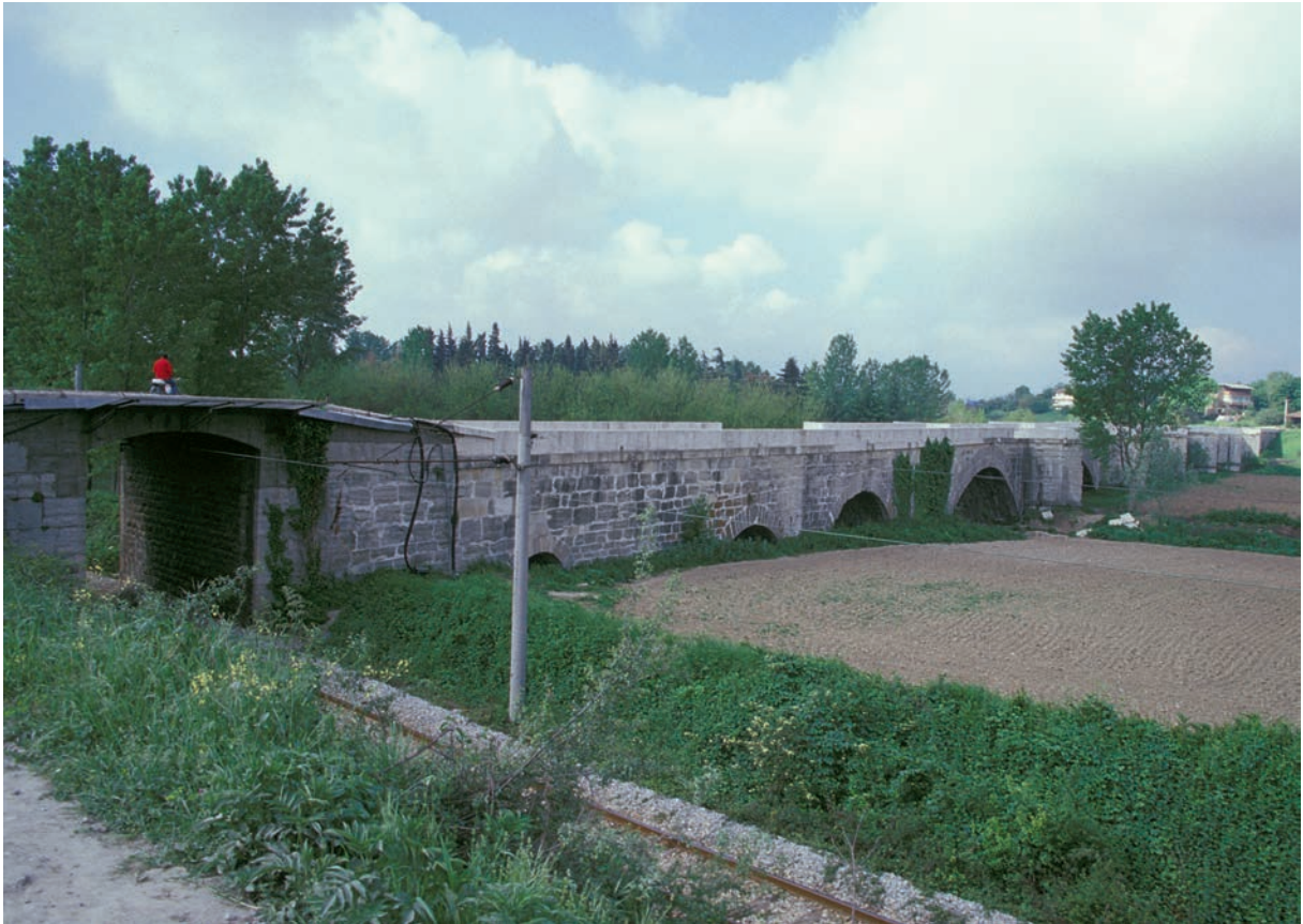
237 Pentegephyra, justinianische Brücke von Norden