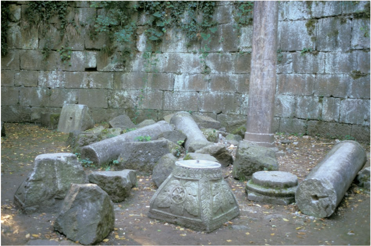
258 Pythia, Exedra, Säulen und Korbkapitell mit Monogramm der Kaiserin Sophia