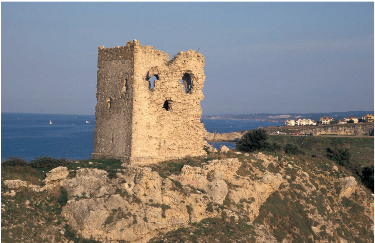
65 Chēlē (2), osman. Turm auf der Ocaklı Ada (2000)