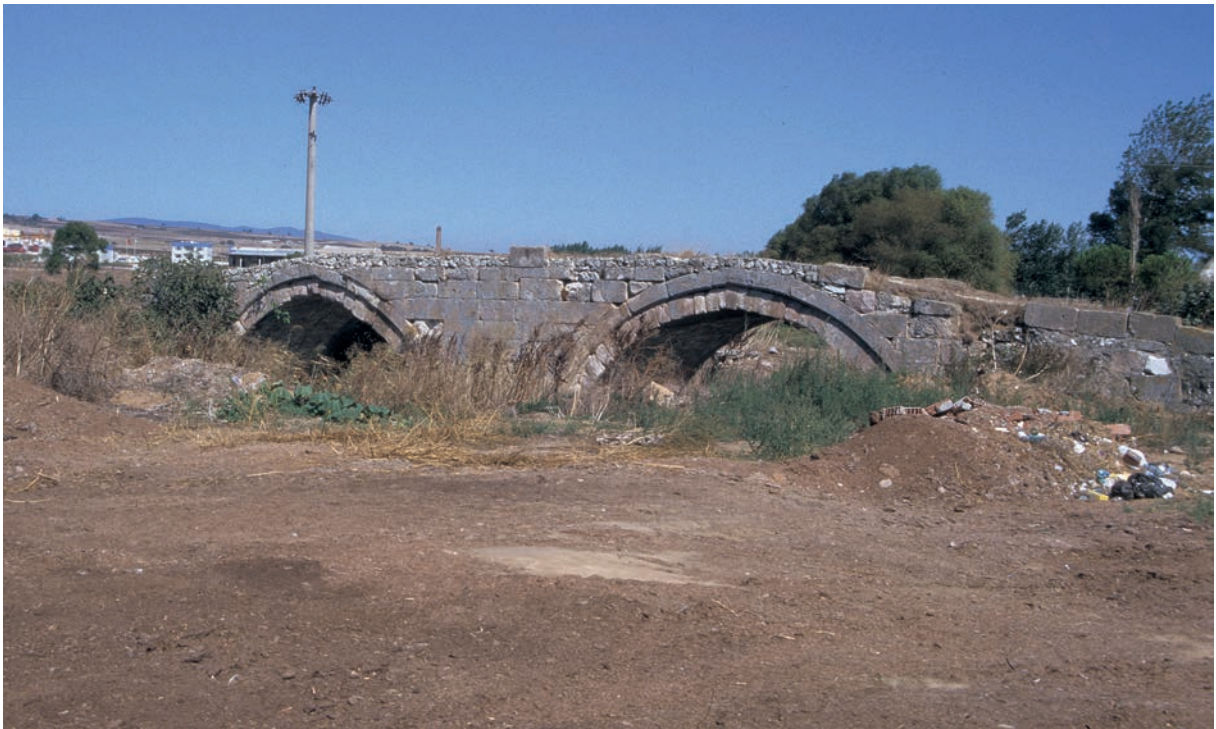
306 Tolypē, alte Brücke