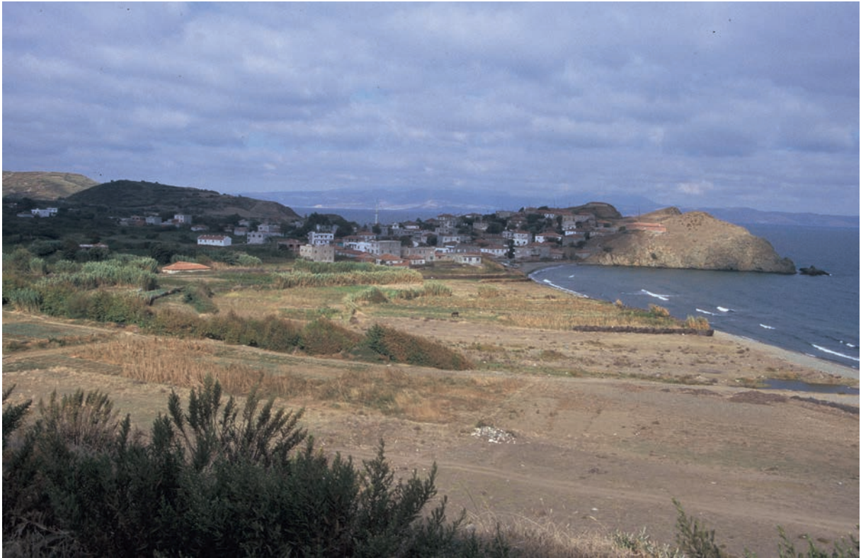
95 Hiereia (2), Lage