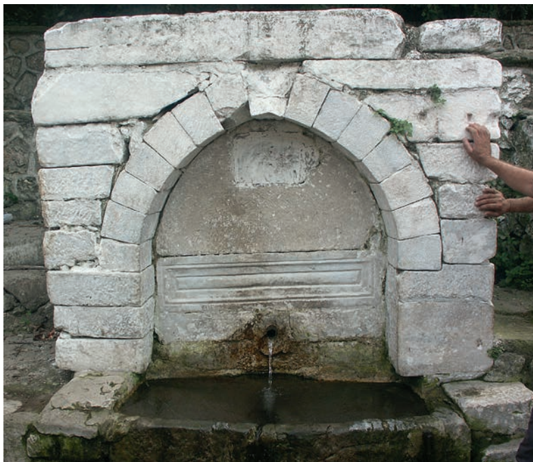
112 Karatepe, Brunnen mit frühbyz. Schrankenpfeiler