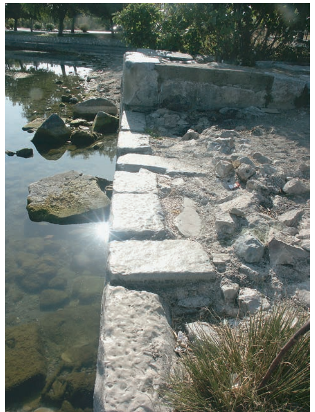
198 Nikaia, Kaimauern am See