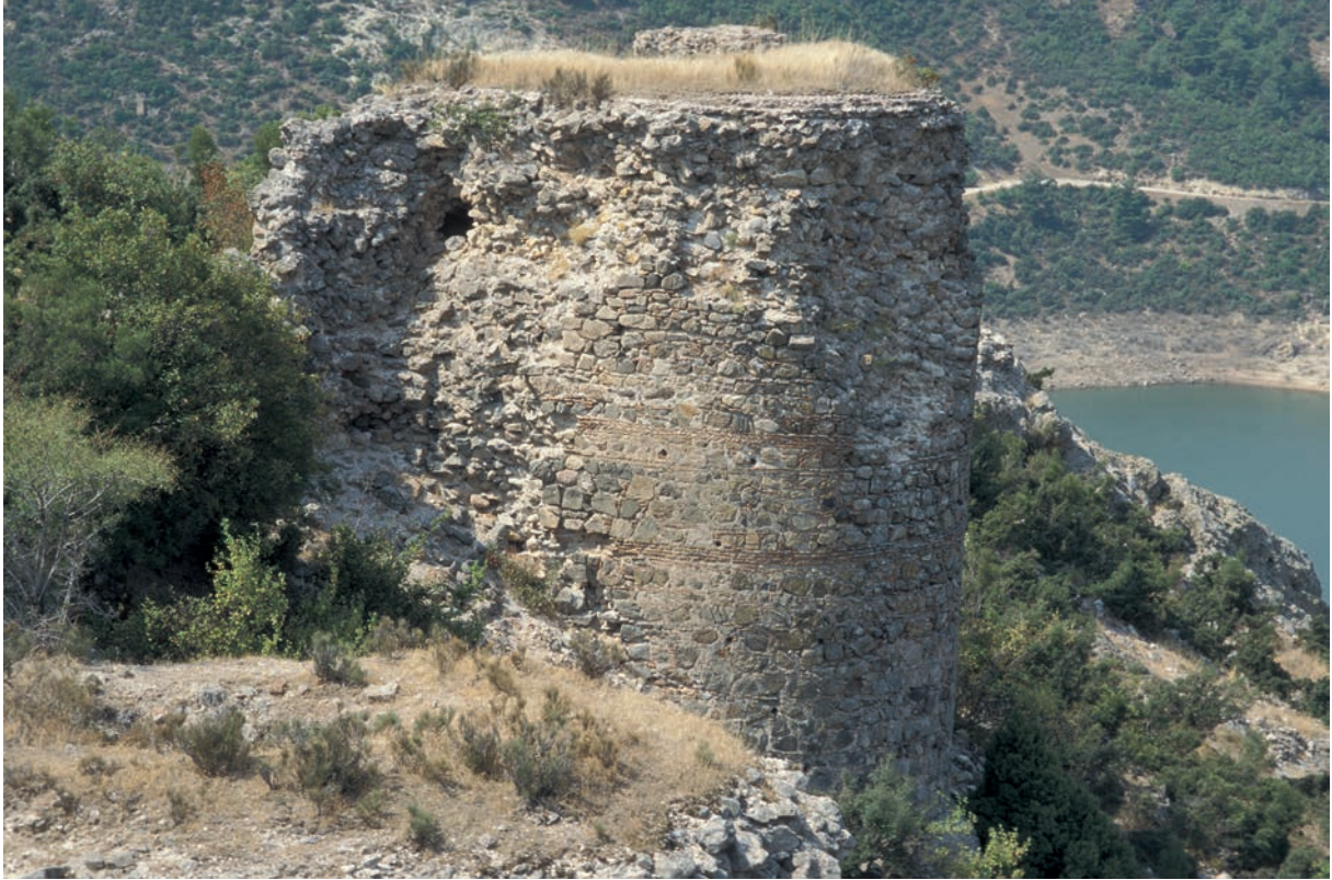
132 Kremastē, Turm 3