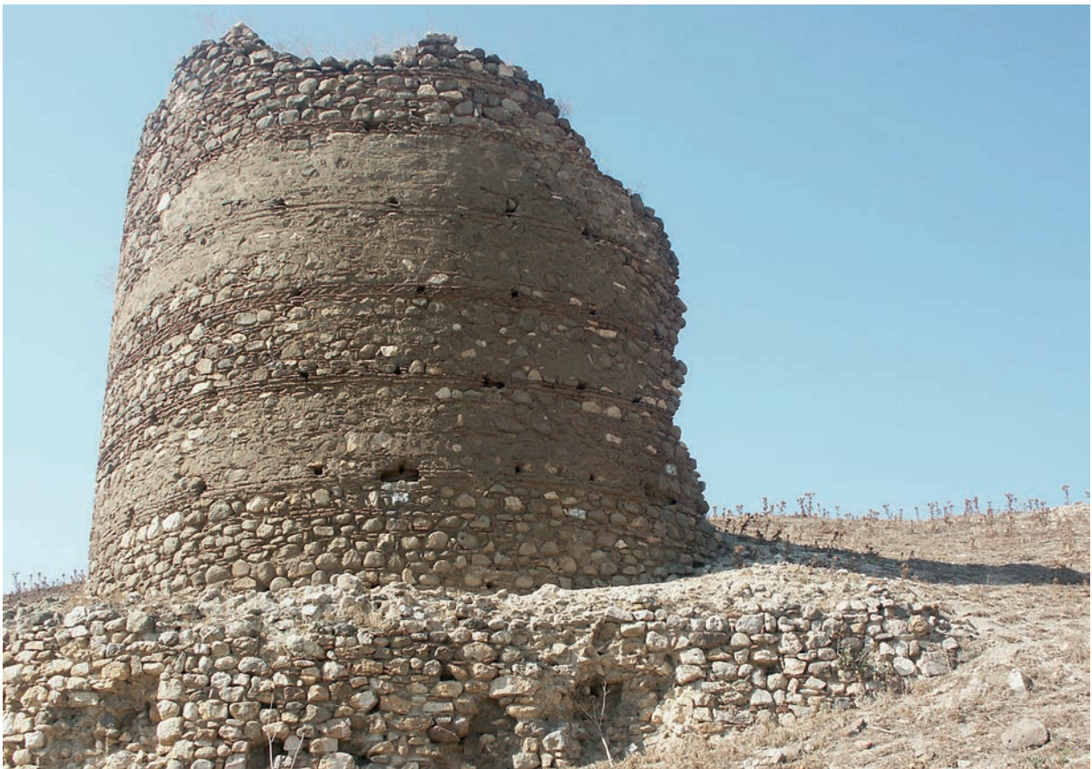
150 Lentiana, Festung, Turm mit Zierziegelbändern