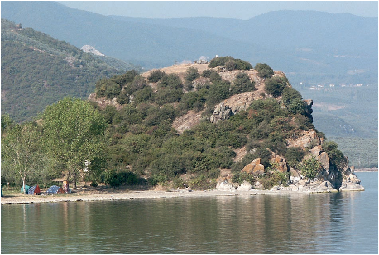
107 Karacakaya (Lokus?), Ansicht des Felsklotzes