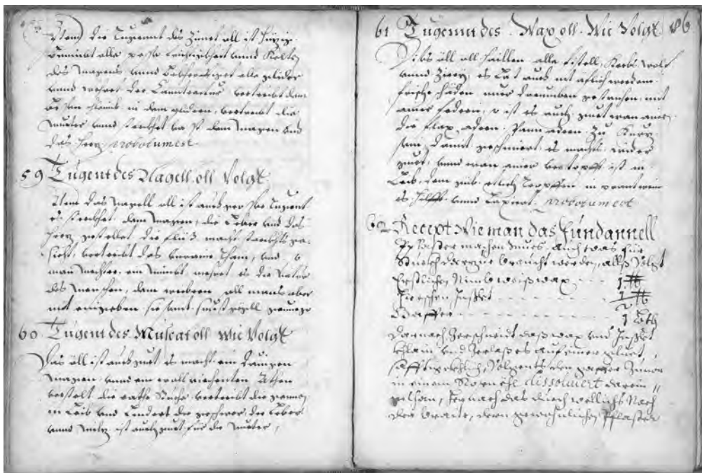
Abb. 2: Handschriftliches Arzneibuch, 17./18. Jahrhundert (StLA, Hs. 1149)

Die größte Rolle spielte aber wohl die mündliche Überlieferung, wiewohl es dafür kaum Belege gibt. 35 Gerade ein delikates Thema wie die „schlafende Venus“ wurde vermutlich lieber unter vier Augen besprochen, umso mehr bei Personen, denen der Zugang zur Schriftlichkeit fehlte. Der Erfahrungsschatz im Volk war groß, es gab Traditionen des Dorfes und des Hauses,