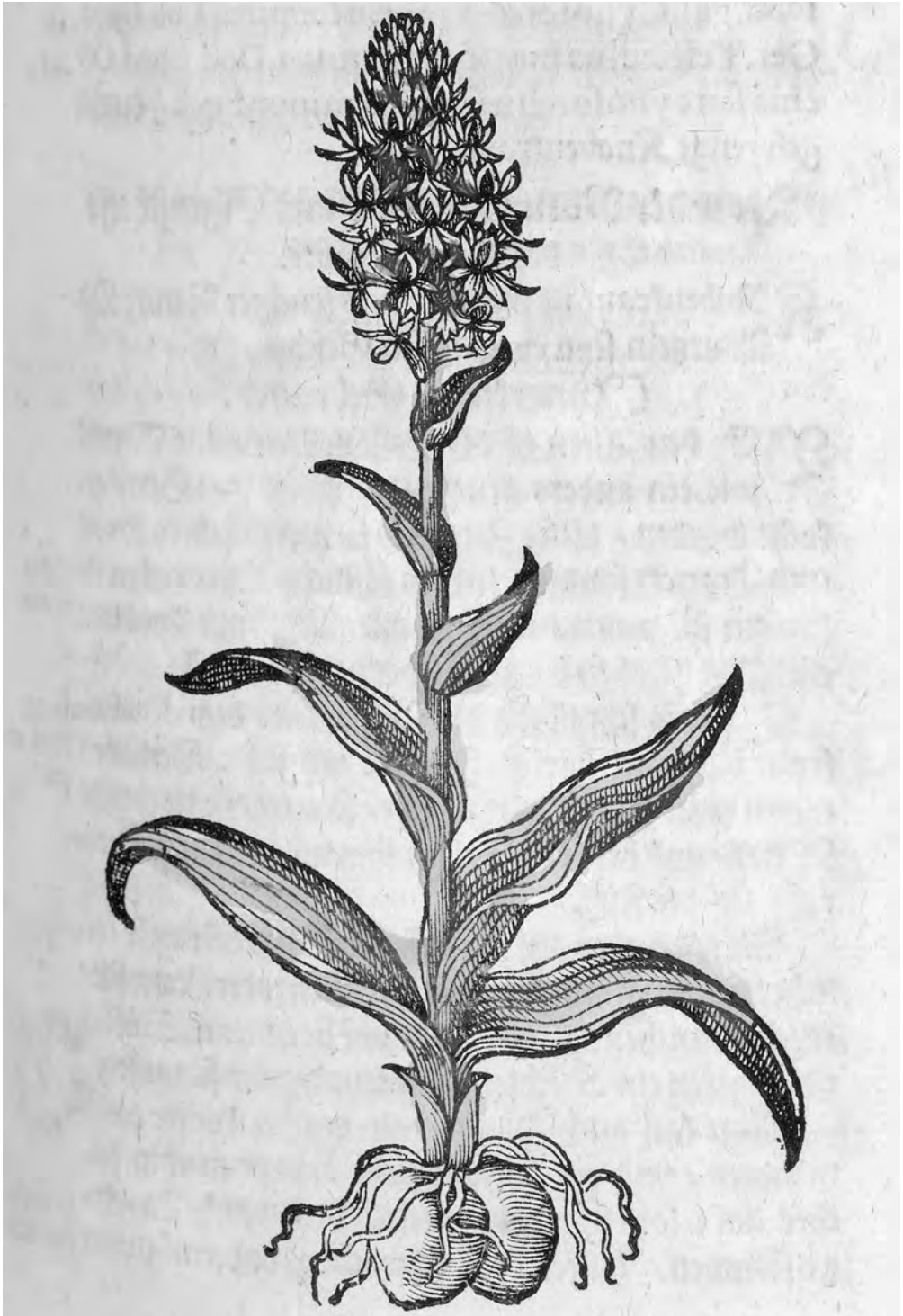
Abb. 3: Großes Knabenkraut, in: D. Iacobi Theodori Tabernaemontani, Neu vollkommen Kräuter-Buch / Darinnen Über 3000 Kräuter / mit schönen und kunstlichen Figuren [...] (Basel 1687)