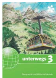
Schulbuch 3 SBNR 175113