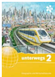
Schulbuch 2 SBNR 170101