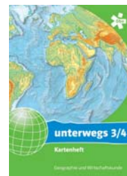
Kartenheft 3/4 SBNR 175115 [A]