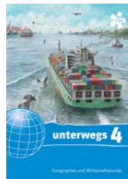
Schulbuch 4 SBNR 180092