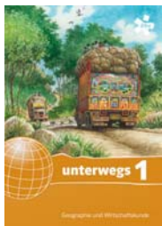
Schulbuch 1 SBNR 170100